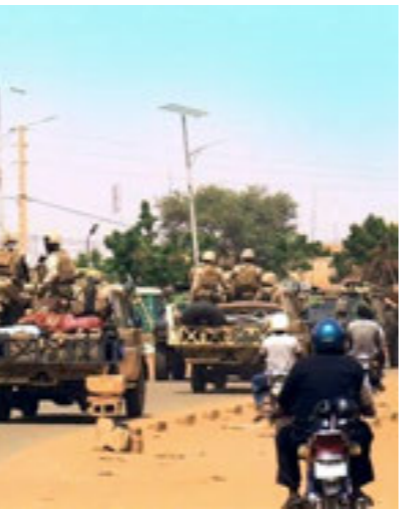
الميليشيات في مالي

ومع عودة الأنشطة الإرهابية إلى شمال مالي وازدياد التحالف بين شبكات التهريب والجريمة المنظمة، حذر الدبلوماسي قرادة من تصاعد احتمالات انتقال الخطر نحو الداخل الليبي عبر الحدود المفتوحة، سواء عبر عناصر إرهابية أو تحقيقات السلاح والبشر والمخدرات. والمعروف عن مالي أنها تعد اليوم نموذجاً لتراكم أزمات أفريقيا المعاصرة من حدود مصلنة ومستعجلة الترسيم، مروجة عن المرحلة الاستعمارية والتي لم تنته فعلياً باستمرار التبعية. إلى تنوع عرقي وثقافي غير مدموج في دولة وطنية جامعة، يسبب سياسات التمييز الاجتماعي والاقتصادي، وتفاوت الموارد جغرافياً.