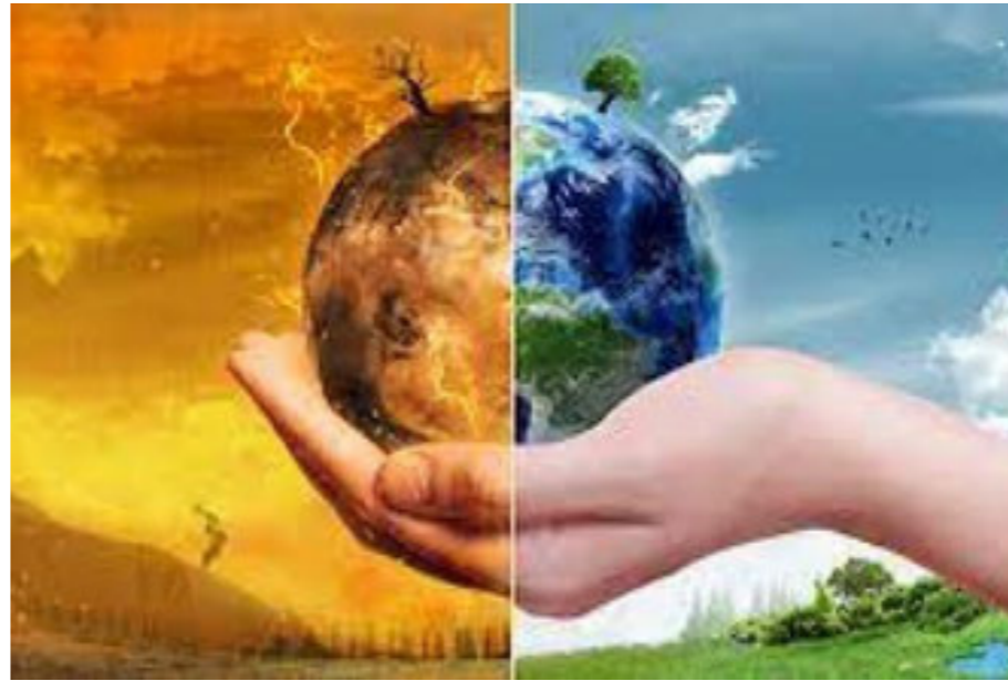
• التغيرات المناخية