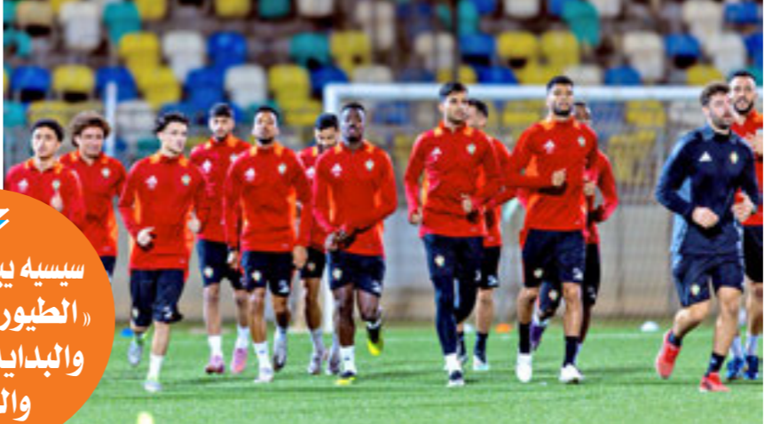
المنتخب الوطني خلال التدريبات

سياسية يبدأ استقطاب «الطيور المهاجرة» والبداية بالوداني والحرك