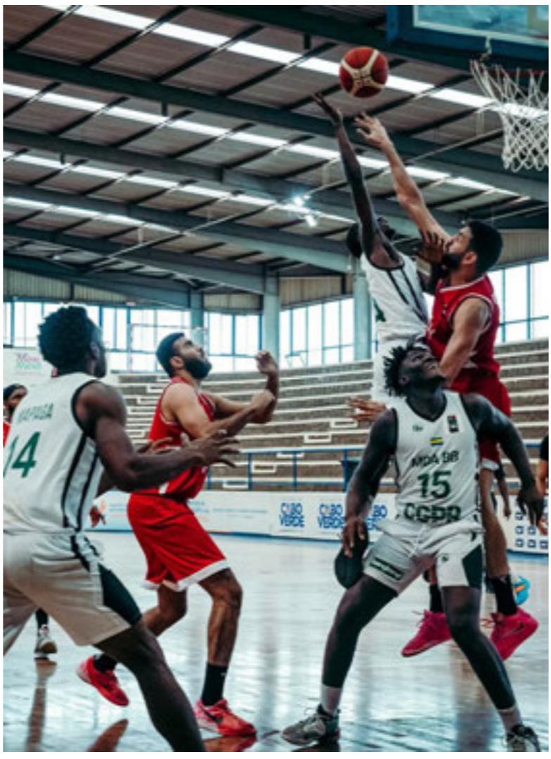
مباراة الأهلي بنغازي ومواندا الغابوني بالدوري الأفريقي لكرة السلة

يلتقي فريق الأهلي بنغازي اليوم بفريق سينتسكس نايتس الغاني في اللقاء الأخير له ضمن منافسات المجموعة الثانية من تصفيات النخبة لمسابقة الدوري الأفريقي لكرة السلة «BAL» المقامة حاليا في كات فيردي، في صراع مفتوح على كل الاحتمالات بين الفريقين على تصدر المجموعة والعبور إلى الدور التالي من التصفيات. تأتي مواجهة اليوم للأهلي بنغازي بعدما تمكن من الفوز بمباراته الأولى على فريق مواندا الغابوني بنتيجة 85 - 68، وفي المباراة الثانية انسحب فريق جامعة نيو تك من أفريقيا الوسطى من مواجهة الأهلي بنغازي بعدم حضوره إلى ملعب المباراة في الوقت المحدد، وذلك لأن الفريق لم يصل إلى كات فيردي للمشاركة في تصفيات النخبة، حيث سبق أن تغيب عن الحضور في الجولة الأولى أمام سينتسكس نايتس الغاني. وكشفت واقعة غياب فريق جامعة نيو تك عن المباراتين عن وجود قصور في اللوائح التي لا تتضمن بندا محمدا وضربا لكيفية التعامل مع عدم حضور أحد الفريق خلال منافسات الدوري الأفريقي، غير أن اللوائح العامة بالاتحاد الأفريقي لكرة السلة تنص على أن الفريق الغائب يخسر فرصته في التأهل للدور التالي من التصفيات، ليحل محله الفريق المؤهل الذي يليه في الترتيب، كما سيخسر فرصته في المشاركة في تصفيات الدوري الأفريقي لكرة السلة «BAL» في الموسم التالي. كما تنص اللوائح العامة أيضا على أن الفريق الذي يفشل في المشاركة في تصفيات دوري النخبة يخسر مكانته في تلك المرحلة من التصفيات... ووفقا للوائح أيضا فإن انسحاب فريق جامعة نيو تك من دون عنق مقبول، يعني منح الأهلي بنغازي فوزا اعتباريا بنتيجة 20 - صفر.