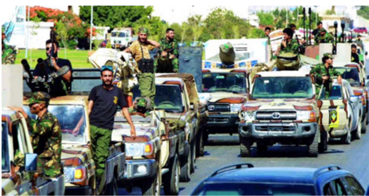
فوضى السلاح في ليبيا

وكشفت التقرير أن العام 2024 شهد ارتفاعاً كبيراً في عدد الوفيات الناتجة عن استخدام الأسلحة الصغيرة، إذ سجلت مفوضية الأمم المتحدة السامية لحقوق الإنسان أكثر من 48 ألف حالة وفاة مرتبطة بالزنازات، زيادة بلغت 40% عن العام السابق، وكانت 6% منها بسبب الأسلحة الصغيرة والخفيفة، فيما جاءت أفريقيا جنوب الصحراء الكبرى في مقدمة المناطق الأكثر تضرراً. وشهدت طرابلس عشرات المواجهات المسلحة كان أخطرها في مايو الماضي بعد مقتل قائد من الكلي الشهير بـ«غنيوة»، وما تلاها من مواجهات بين «الواء 444 قتال» و«جهاز الردع». ولم تكن حالة الانفلات الأمني هذه حكرًا على العاصمة، إذ امتدت إلى مدن أخرى في الغرب