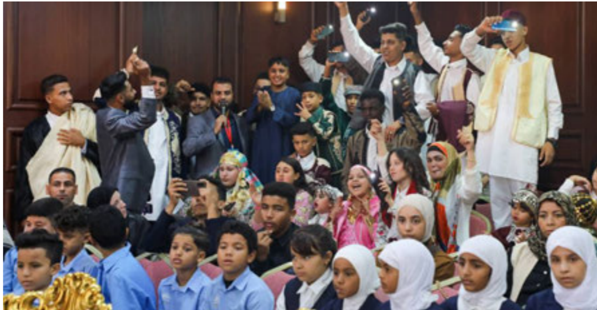
● مشاركون في معرض بنغازي الدولي للكتاب

إلى جانب الفعاليات الفكرية، استمر عمل «معرض الصناعات التقليدية» و«بيت التراثي» اللذين يجسدان روح التراث الليبي الأصيل، ويقدمان صورة عن الموروث الحرفي والفني الذي تزخر به المنطقة.