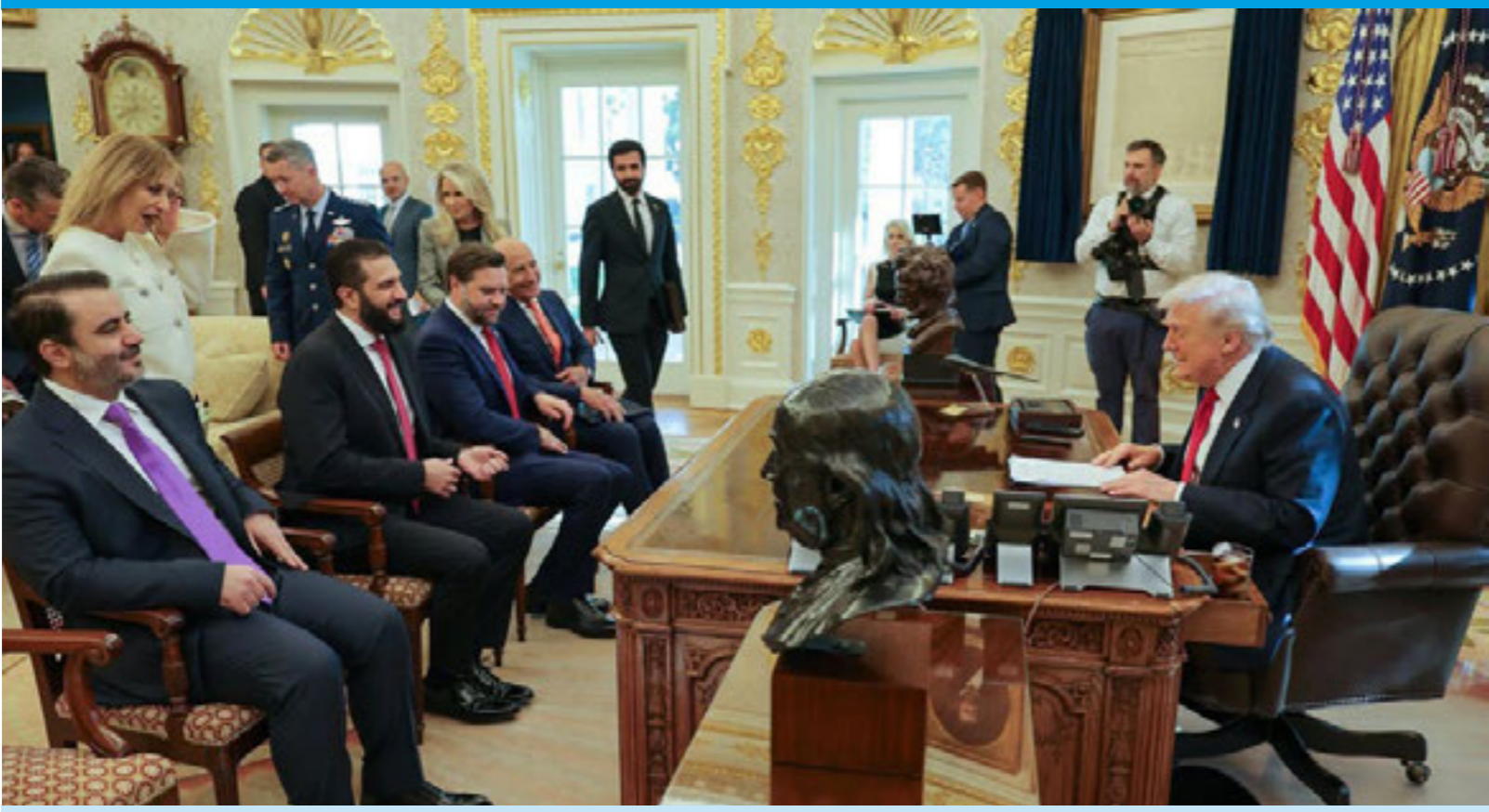
الرئيس السوري أحمد الشرح ووزراء حكومته يجلسون أمام الرئيس الأميركي دونالد ترامب