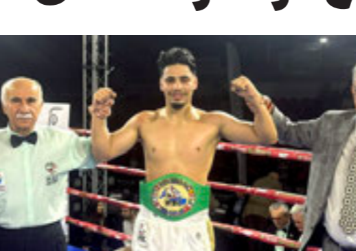
الفلاح لحظة إعلان فوزه باللقب، بريشيا 8 نوفمبر 2025

الليبية، سجلا حافلا بالبطولات، حيث جرى تتويجه بحزام «WKR»، والعديد من البطولات، منها فوزه على خصمه البلجيكي أندريا سالجورا في العاصمة الفرنسية «باريس»، ومناقشته الروسي فلاديمير سيرجي بالضربة الفنية القاضية في الجولة الثانية بنزال قوي شهدته قاعة روما الكبرى في إيطاليا. أيضاً فاز البطل الليبي على خصمه الجورجي كانديلاك خلال نزال أقيم بينهما في العاصمة الفرنسية باريس. ويتنمي سعد الفلاح إلى جيل جديد من الملاكمين الليبيين الذين شقوا طريقهم بثبات في عالم الاحتراف الأوروبي، ويعرف بأسلوبه القتالي القائم على السرعة والتركيز العالي، إلى جانب قدرته على استغلال نقاط ضعف خصومه بشكل ذكي.