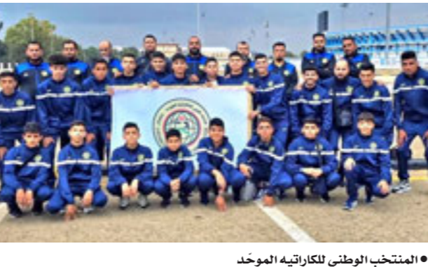
المنتخب الوطني للكراتيه الموحد