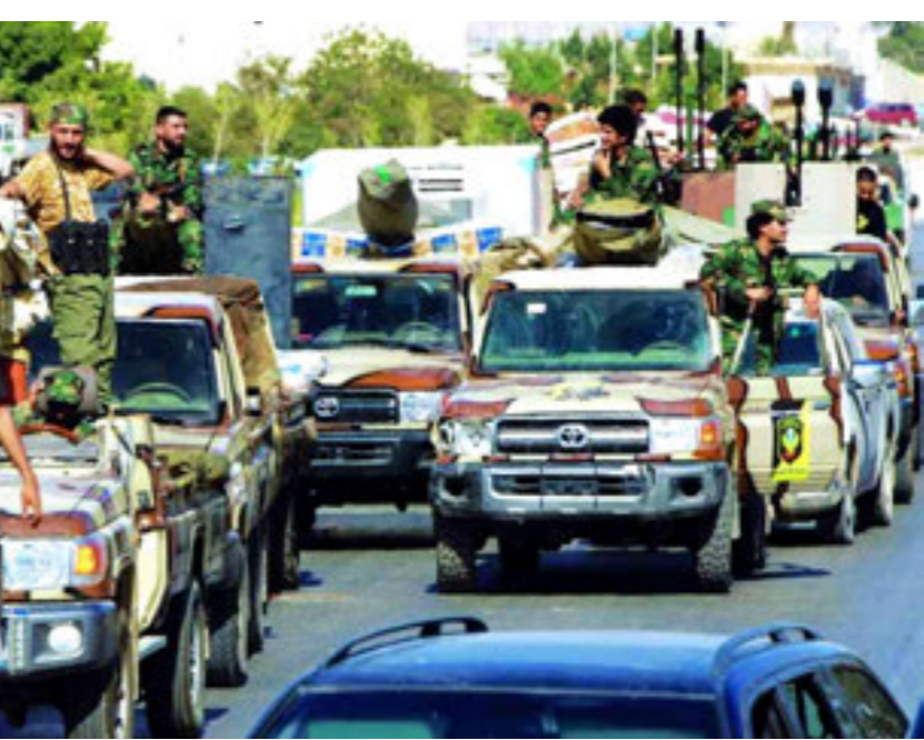
فوضى السلاح في ليبيا

مشيرا إلى أن الأسلحة الصغيرة والخفيفة هي أسلحة نارية مصممة ليحملها فرد أو طاقم صغير من الجنود، وتنقسم إلى قسمين رئيسيين: الأسلحة الصغيرة وتشمل المسدسات والبنائق والرشاشات الخفيفة، أما الأسلحة الخفيفة فهي أسلحة محمولة على الكتف أو بواسطة طاقم يتكون من فردين، وتتضمن قاذفات القنابل اليدوية والمدافع الرشاشة الثقيلة وقاذفات الصواريخ عديمة الارتداد.