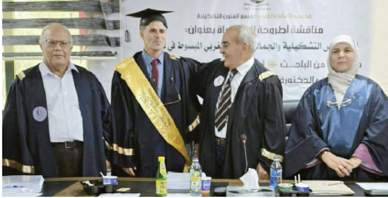
● بعض أعضاء لجنة المناقشة