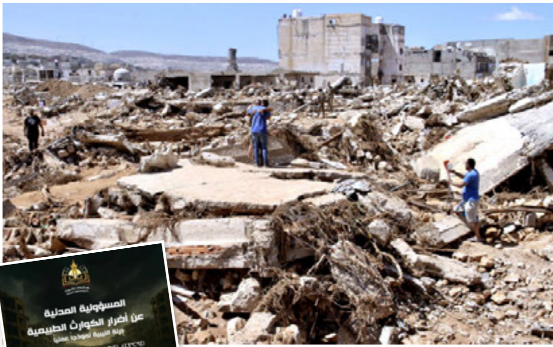
• درنة بعد الفيضانات المدمرة في سبتمبر 2023، رشييفية،

وفي العاشر من سبتمبر 2023، احتاجت مناطق الشرق الليبي العاصمة «دانيال» فأحدثت فيضانات معرت مدينة درنة وأودت بحياة الآلاف، وهي الكارثة الطبيعية الأسوأ في تاريخ ليبيا.