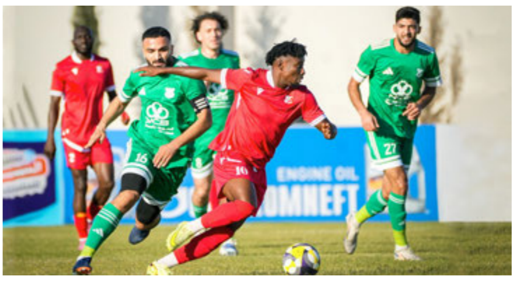
مباراة الأهلي بنغازي والأخضر بكأس ليبيا