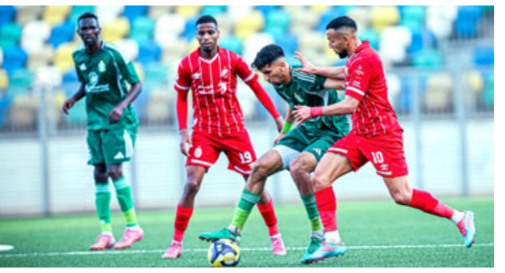
مباراة الأهلي طرابلس والاتحاد بكأس ليبيا

عندما في كل الاستحقاقات والبطولات المحلية. وأشار البيان إلى أنه لم يسجل أي اعتراض رسمي من قبل الأندية المتأهلة لنصف نهائي كأس ليبيا على القرارات الصادرة عن اجتماع الأندية في مدينة ميلانو الإيطالية، علماً بأن نادي الاتحاد لم يكن طرفاً في ذلك الاجتماع، ولم يشارك فيه.