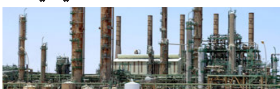
حقل الشراة النفطي في ليبيا، أسبوعية

عودة الشركات العالمية إلى الاستكشاف، ويرى الموقع أن هذا الاكتشاف يؤكد قدرة ليبيا على استعادة مكانتها كلاعب رئيسي في صناعة النفط والغاز في أفريقيا بعد سنوات من الصراع والاضطرابات التشغيلية. ونقل الموقع عن مصدر نفطي بشركة «الخليج العربي» أن إجمالي إنتاج الشركة من النفط بلغ 310 آلاف برميل يوميا بنهاية أكتوبر الماضي، ما يشير إلى تعافٍ كبير في إنتاج ليبيا. وفي حوض سرت، اكتشفت شركة «أو أم في» النمسائية نفطاً جديداً، مع إجراء اختبارات للينر الاستكشافية في القطاع 4/106، التي يصل عمقها إلى 10476 قدماً، وهي التي تنتج أكثر من 4200 برميل يوميا، بينما يتجاوز إنتاج الغاز 2.6 مليون قدم مكعب يوميا. وهو الاكتشاف الأول للشركة النمسائية في المنطقة منذ توقيع اتفاقية الاستكشاف ومشاركة الإنتاج مع مؤسسة النفط في العام 2008.