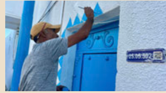
● المعروف يزين بيوت إيند عيسى