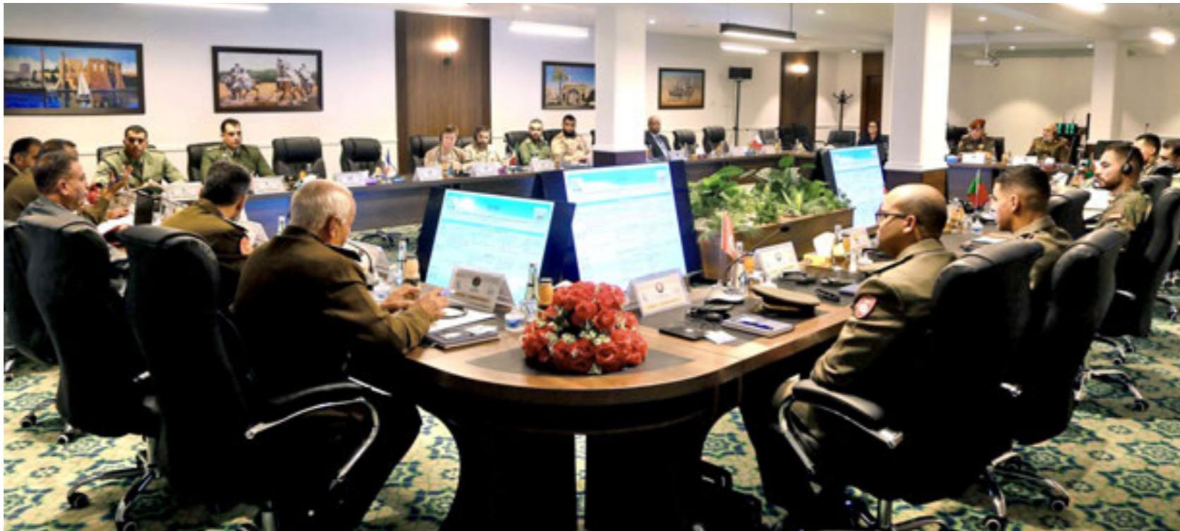
• خلال افتتاح الدورة التدريبية على أعمال مكافحة الألغام، طرابلس 11 نوفمبر 2025

وفي 18 أبريل الماضي قال نائب الممثلة الخاصة للأمين العام في ليبيا المنسق المقيم ومنسق الشؤون الإنسانية، إينيس شوما، إنه جرى تحديد مئات الملايين من الأمتار المربعة في ليبيا الملوثة بالألغام، وذلك وفق بيانات المركز الليبي للأعمال المتعلقة بالألغام ومخلفات الحروب، شوما توقع اكتشاف مساحات جديدة متضررة مثل تلك المدفونة تحت الأنقاض. تصريحات المسؤول الأممي جاءت في كلمته خلال فعالية نظّمها المركز الليبي في العاصمة طرابلس، بالشراكة مع البعثة الأممية ومنظمات دولية ووطنية معنية بإزالة الألغام ومخلفات الحرب، وذلك لإحياء اليوم الدولي للتوعية بخطر الألغام.