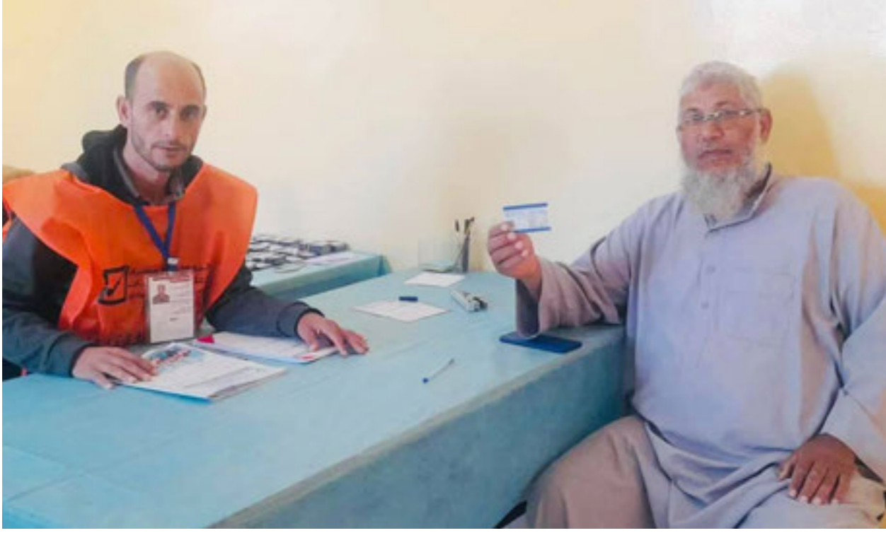
• استلام بطاقة ناخب