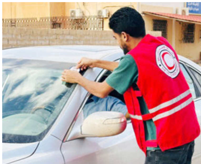
• حملات التوعية لاستلام بطاقة ناخب في بلديات شرق وجنوب البلاد