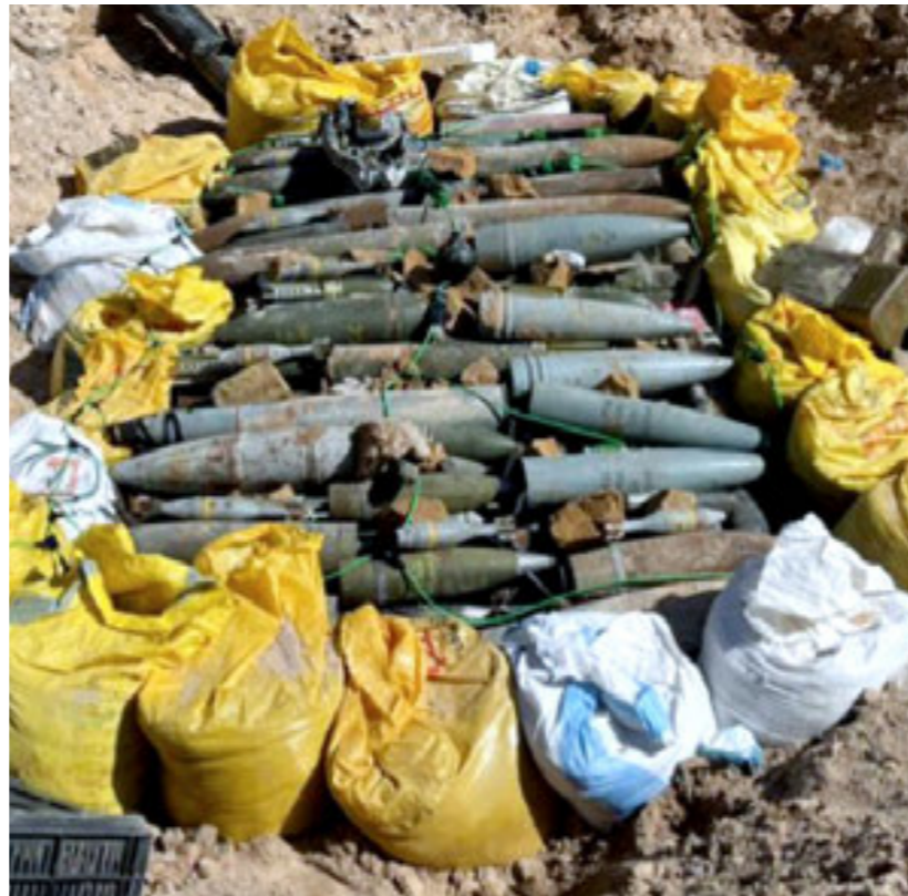
• قذائف ومخلفات حربية غير منفجرة في ليبيا، إرشيفية،

البعثة الأممية كشفت أنه «منذ العام 2020، سجّلت أكثر من 420 إصابة بسبب مخلفات الحروب من المتفجرات»، لافتة إلى أن «هذه الأرقام لا تعكس الواقع كاملاً، بل تمثل الحوادث المؤكدة فقط». تتبعه، حثّ المجتمع الدولي على التركيز