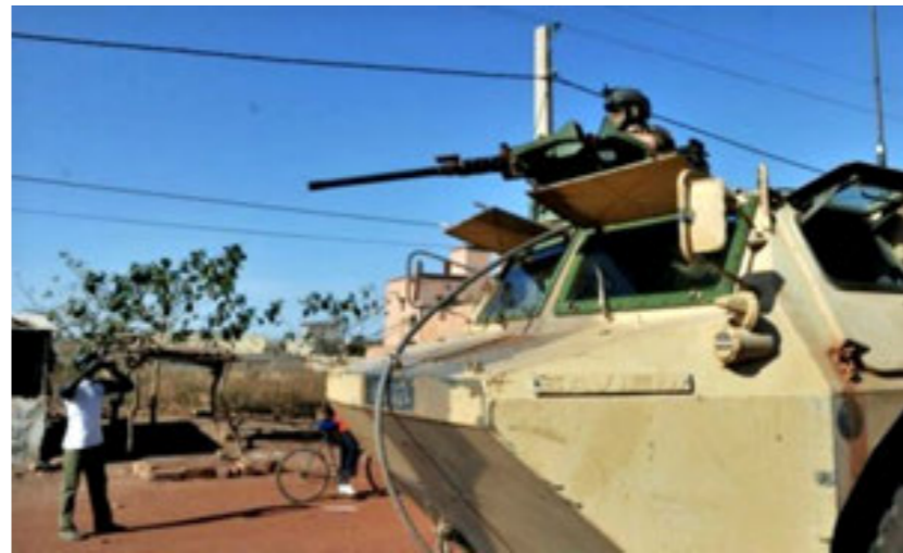
فوضى السلاح في مالي

وتستيد التحولات التي عرفتها مالي خلال الأعوام الأخيرة - ولا سيما بعد الانقلابات العسكرية