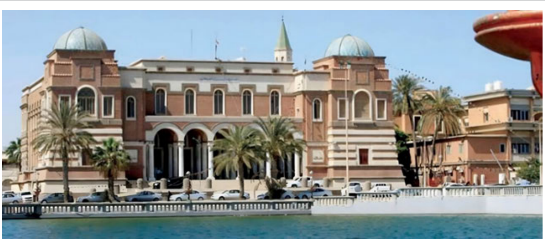
• مصرف ليبيا المركزي