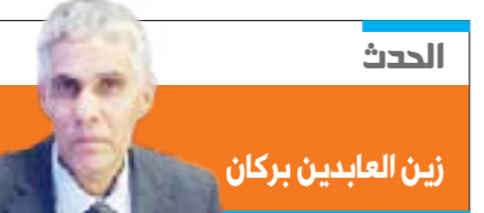
الحدث زين العابدين بركان

الخميس 16 أكتوبر 2025 | 24 ربيع الثاني 1447 هـ | السنة العاشرة | العدد 517 | الموقع الإلكتروني: www.alwasat.ly