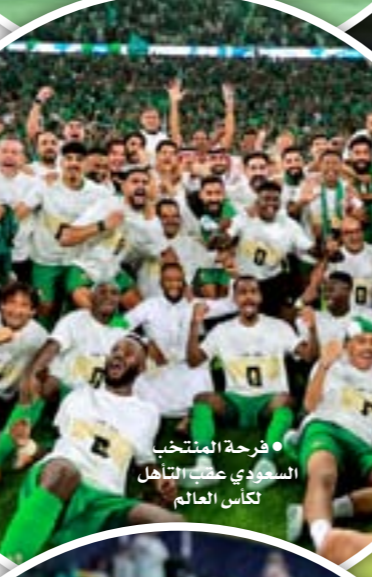
● فرحة المنتخب السعودي عقب التأهل لكأس العالم