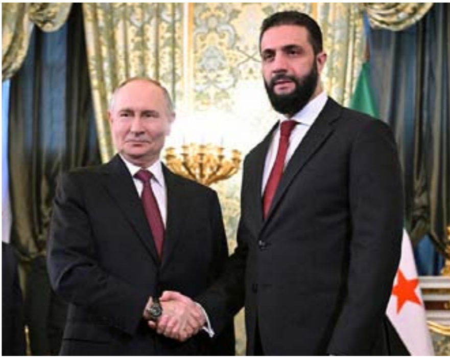
• بوتين والشرع

بوتين أيضاً كان حريصاً على استيعاب التغييرات التي حدثت في سورية، وهو ما بدأ واضحاً في تصريحه: «أن روسيا لم تكن يوماً تضع مصالح ضيقة أو الحالة السياسية الراهنة في حساباتها تجاه سورية».