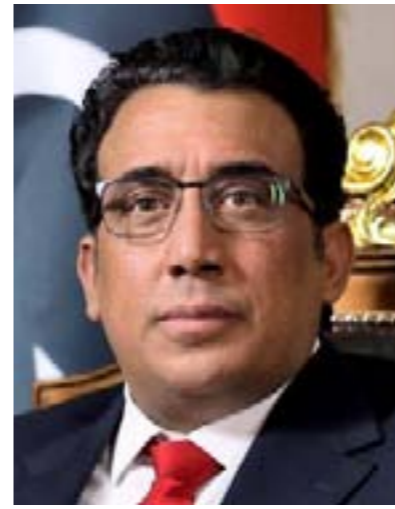
• محمد المنفي

على منصة «إكس»: «مستمررون في تعزيز الاستقرار والتنسيق الأمني كشرط أساسي للتقدم في المسار السياسي، والتنمية المستدامة».