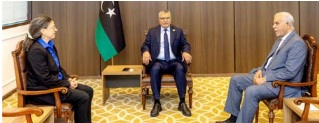
• رئيس الأعلى للدولة ونائبه موسى فرج مع ستيفاني خوري، طرابلس 9 أكتوبر 2025

تمارس بالأساس دوراً رقابياً يتطلب الاستقلالية، ورأى أن «ما يجري يمثل بداية جديدة يمكن البناء عليها»، مضيفاً: «أنا متفائل بما يحدث، لأن السياسة لا تقوم على معاملة صفرية، بل على محاولات مستمرة للتقارب»، مؤكداً أن «العملية التفاوضية بطبيعتها معقدة، ومن الطبيعي أن تسعى كل جهة سياسية إلى الدفاع عن مصالحها كما تراها، وأن أختلاف الرؤى بين الأجسام السياسية لا يعد سلبياً، بل قد يشكل مدخلاً لحل الأزمة إذا أُدير بطريقة بناءة».