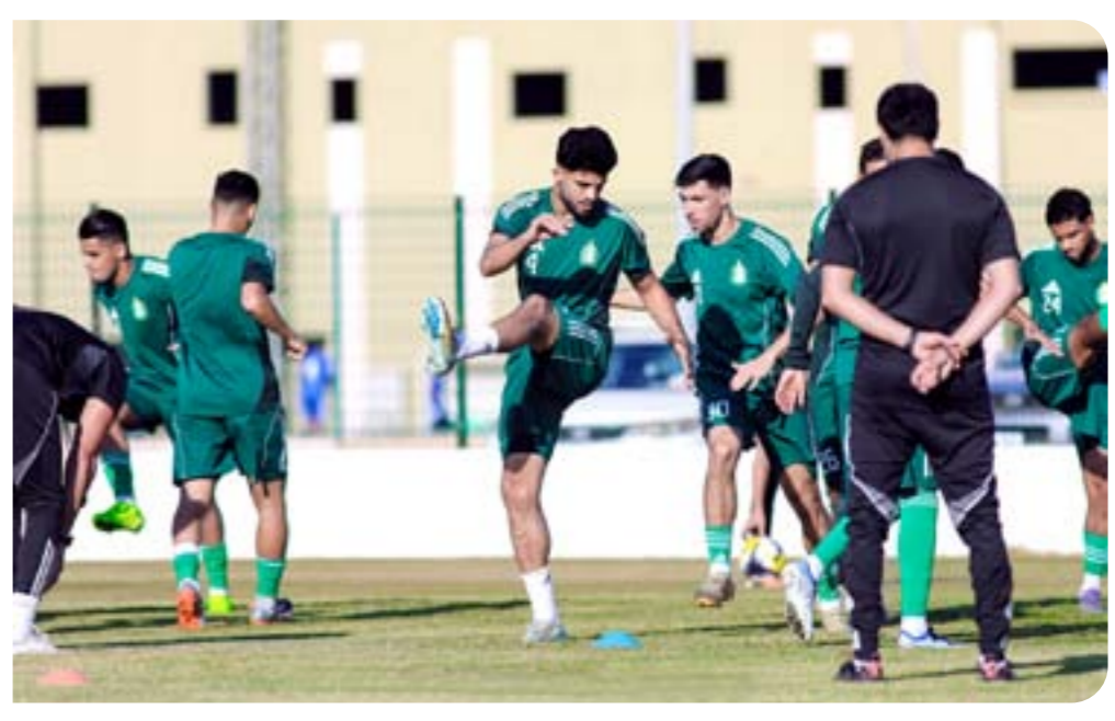
• تدريب الأهلي طرابلس