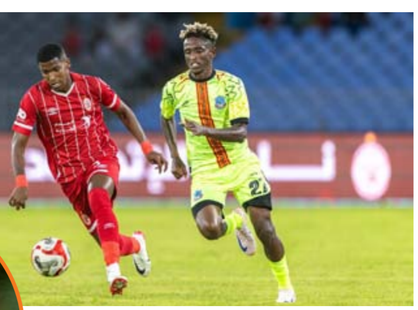
• مباراة الاتحاد وولاية ديتشا الاثيوبي