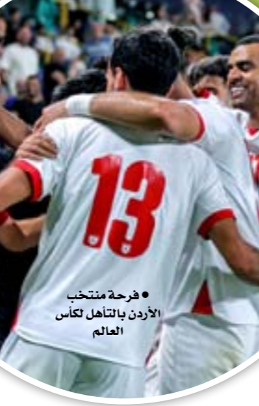
● فرحة منتخب الأردن بالتأهل لكأس العالم