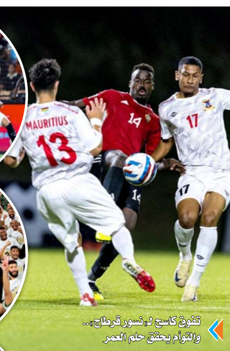
تفوق كاسح لـ «نسر قرطاج».. والتفوق يحقق حلم العمر