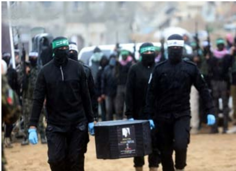
• عمليات تسليم جثث الأسرى

كما قتلت قوات الاحتلال، الأربعاء، مواطناً فلسطينياً في بلدة الرام شمال القدس المحتلة.