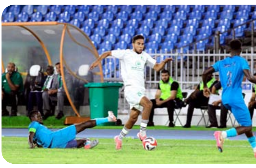
• مباراة الأهلي طرابلس ودادجي البنييني