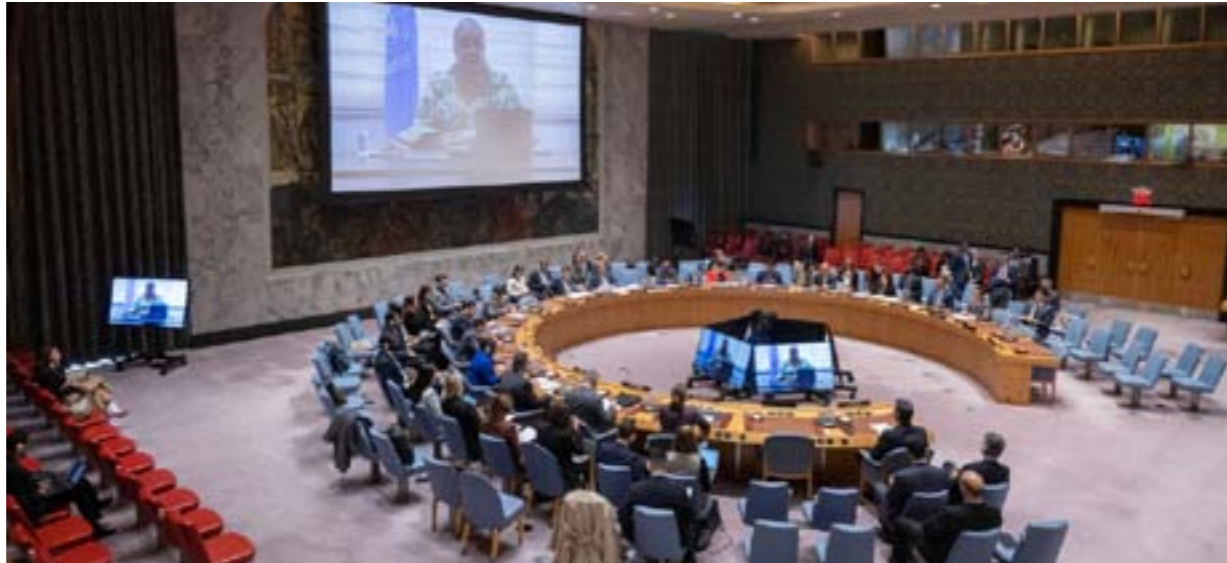
تيتيه تلقي إحاطتها عبر تقنية الفيديو أمام مجلس الأمن الدولي، نيويورك، 14 أكتوبر 2025

القوات الأجنبية من الأراضي الليبية أحد العوائق الرئيسية أمام تحقيق سلام دائم، وبناء دولة ذات سيادة، وستحتل هذه القضية بالضرورة مكانة محورية في الحوارات المتعددة الأطراف. في المقابل، أبرز المعهد الفرنسي ضرورة اعتماد نهج خريطة الطريق الجديدة بشكل كبير على إحياء برامج إصلاح قطاع الأمن، وعملية نزع السلاح، والتسريح، وإعادة الإعمار. في الواقع، لا يزال السياق الأمني حساساً للغاية نظراً لتشرنم القوات المسلحة في جميع أنحاء البلاد. ففي مايو 2025، وقعت اشتباكات عنيفة بين قوة الردع الخاصة، وهي إحدى أقوى الجماعات المسلحة في العاصمة، التي تسيطر على مطار معيتقة الدولي، وأخرى مرتبطة بعليشيات متحالفة مع حكومة طرابلس، التي لا تزال تعتمد على دعم هذه الجماعات للحفاظ على سلطتها.