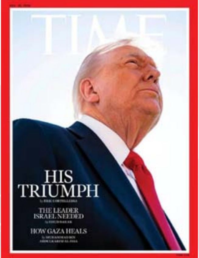
• غلاف مجلة تايم الأميركية الجديد الذي أغضب الرئيس ترامب فقال: أسوأ صورة في التاريخ