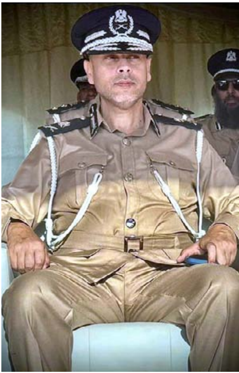
• اللواء وليد قنيجيو

الإجرامية. كذلك تدريب الكوادر على أحدث أساليب التحري، وتشديد الرقابة على البريد الدولي والعقاقير المخدرة والمؤثرات