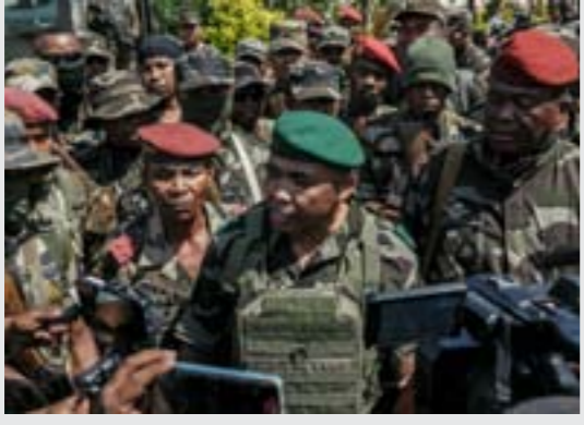
احتجاجات مدغشقر

ووفق مسؤولين مطلعين على التحقيقات حول «ملف 4000»، فإن الأدلة الخاصة بالقضية، بما في ذلك الشهادات والأدلة المادية والتسجيلات الصوتية، تربط نتنياهو وزوجته مباشرة في منع شركة «بيزك» الموافقة على شراء شركة الكوابل التلفزيونية «يس»، بالإضافة إلى أمور أخرى تتجاوز قيود محكمة الاحتكار.