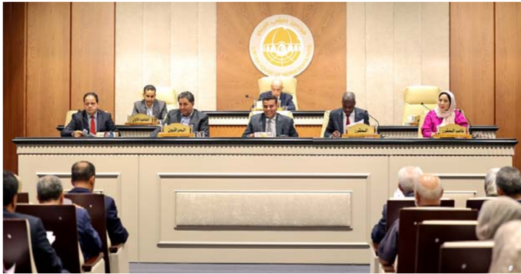
• مجلس النواب في جلسة برئاسة عقيلة صالح، بنغازي، في 19 أغسطس 2025

واستعرضت الشركة، خلال ورشة العمل، أبرز خدماتها وحلولها في مجالات الحفر وصيانة الآبار وتحسين الإنتاج وتقنيات التحفيز، بالإضافة إلى أحدث التطبيقات الرقمية المستخدمة في إدارة العمليات النفطية. وخلال اللقاء، أشار رئيس مجلس إدارة المؤسسة الوطنية للنقط إلى أهمية التعاون مع الشركات العالمية الرائدة مثل «هالبيرتون»، لتبادل الخبرات وتعزيز الكفاءات الوطنية، بما يسهم في تطوير القطاع ورفع مستوى الأداء الفني والتقني، في حين أكد وفد الشركة الأمريكية استعدادها لدعم برامج المؤسسة في مجالات التدريب ونقل المعرفة. وتختلط «هالبيرتون» الأمريكية لتوسيع المشاركة مع المؤسسة الوطنية للنقط من خلال برامج تعاون بين الجانبين، للصدور بمستوى عمليات إنتاج النفط في ليبيا، وزيادة معدلاته من خلال عمليات الحفر وصيانة الآبار، وبرنامج بناء القدرات للعاملين في القطاع.