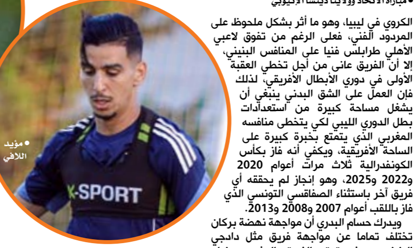
• مؤيد التلاهي