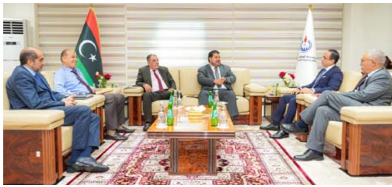
• جانب من اجتماع موسع مع وفد شركة هالبيرتون، الأميركية بطرابلس، في 14 أكتوبر 2025

الموقع الأميركي يرى أن تلك الاستراتيجية الملمحة، بالإضافة إلى موقع ليبيا المتميز على ساحل البحر المتوسط، يجعلها جسراً طبيعياً يصل بين الموارد الأفريقية والأسواق الأوروبية. ويوضي التقرير ليقول إن مسارات تصدير النفط والغاز الحالية إلى إيطاليا، إلى جانب المناقشات الجارية حول ممر غاز جديد عبر الصحراء الكبرى، تبرز إمكانات البلاد كمركز رئيسي لنقل الطاقة، ومع سعي أوروبا لتنويع مصادر الطاقة بعيداً عن المصادر التقليدية، يوفر قرب ليبيا وبنيتها التحتية القائمة ميزتين تنافسيين على المنتجين الأبعد. كما يشير التقرير إلى الاحتياجات النفطية الهائلة من النفط والغاز الطبيعي التي تملكها