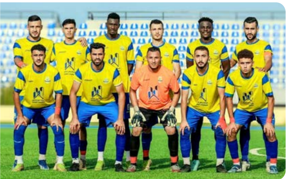
فريق الصباح مصراتة