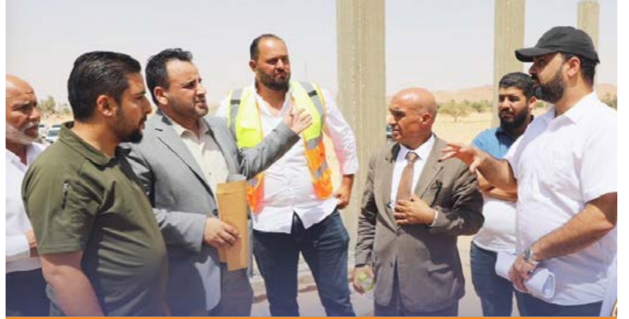
حالة استنصار وزيارات في عموم البلاد للوقوف على حالتها الفنية