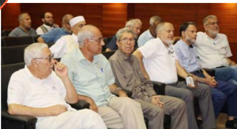
• جانب من مستمعي المحاضرة بالمركز الليبي للمحفوظات

وتكر درويش أسماء بعض تلك المطبوعات مثل مجلة «نوافير» الشهرية بعدد 200 صفحة من ورق السجائر الأطلس الكبير الحجم نسبياً وأيضاً إصدار كتب منها ما ترجم عن الإنجليزية