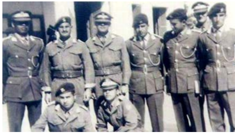
عدد من أعضاء مجلس قيادة ثورة سبتمبر 1969

غنية لفت إلى أن انقلاب سبتمبر 1969 جاء في إطار المد القومي السائد آنذاك في المنطقة العربية، تحت تأثير الناصرية ومعارك التحرر الوطني، سواء في فلسطين أو في أفريقيا وآسيا وأميركا اللاتينية، معتبراً أن ليبيا لم تكن استثناءً، وأن الضباط الذين قادوا التغيير كانوا مشبعين