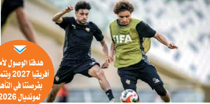
• تدريب المنتخب الوطني

هدفنا الوصول لأمم أفريقيا 2027 وتمسك بفرصتنا في التأهل لمونديال 2026