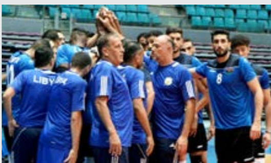
المنتخب الوطني لكرة الطائرة خلال معسكره بتونس

والبرتغاليين وفنلندا وكوريا الجنوبية، والمجموعة الرابعة أميركا وكوبا والبرنغال وكولومبيا، والمجموعة الخامسة سولوفينيا وألمانيا وبيلاروسيا، والمجموعة السادسة إيطاليا وأوكرانيا وليجيا والجزائر، والمجموعة الثامنة البرازيل وصربيا والتشيك والصين. وقد اشتمل برنامج استعدادات المنتخب للمشاركة في بطولة العالم على عدة مراحل، بدأها بمعسكر داخلي في ليبيا، ثم توجه المنتخب إلى مصر الذي خاض فيه معسكراً مشتركاً مع نظيره المصري تضمن لعب عدد من المباريات الودية، ثم العودة إلى ليبيا ومنها إلى تونس لخوض معسكر خارجي تخلله لعب عدد من المباريات الودية مع المنتخب التونسي، وأخيراً العودة إلى ليبيا لاستكمال الاستعدادات ووضع الترويض الأخيرة على الجوانب الفنية قبل بدء رحلة المعسكرات.