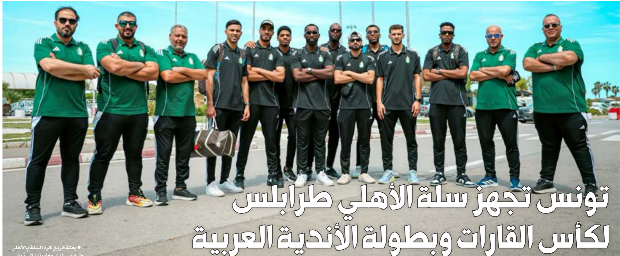
• بعثة فريق كرة السلة بالأهلي طرابلس لدى مغادرتها إلى تونس

أخيراً، لعلمكم بتابعتم المباراة النهائية لبطولة «الشان» التي كانت بين منتخب المغرب، ممثل الدولة المنظمة للبطولة، مع منتخب مدغشقر الدولة الصغيرة وحديثة العهد ببطولات كرة القدم، وكيف وصلت المباراة النهائية وكانت نداءً قوياً للفريق المغربي.. نعم خسرت بعشرين ثلاثة لكن بشرف واحترام كبير من الخصم. لقد صنعت مدغشقر المنهج العلمي والعملي واستعانت بالخبراء الدوليين ونفذت البرامج التي وضعت وحققنا التطور والنتائج الإيجابية، ونحن ما زلنا لم ننجح في إقامة دوري يتناسب عدد فرق مع عدد السكان، وبإ حسرة على أيام حصولنا على بطولة «الشان» رغم بعض الصعوبات التي تضاعفت في الوقت الحاضر، وأنت إلى ما نحن عليه من مستوى فني متواضع جداً جداً لا يبشر بخير.