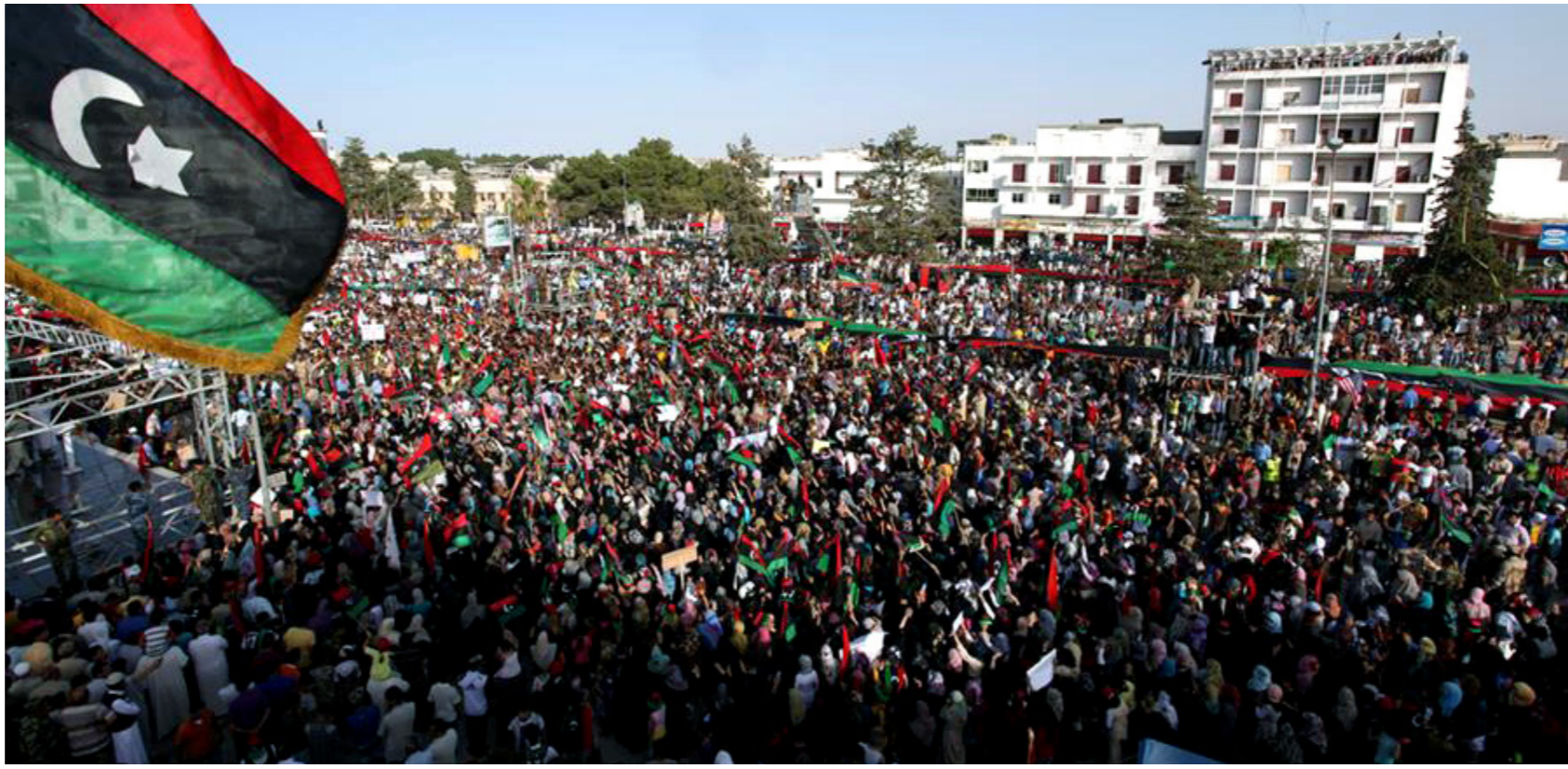
الأف الليبيين يحتفلون بذكرى 17 فبراير التي أنهت حقبة الفاتح من سبتمبر

بوعصير أضاف أن «انقلاب الأول من سبتمبر 1969 أفرز حكماً فريداً يسعى إلى السلطة»، مثله قادة مجلس قيادة الثورة،