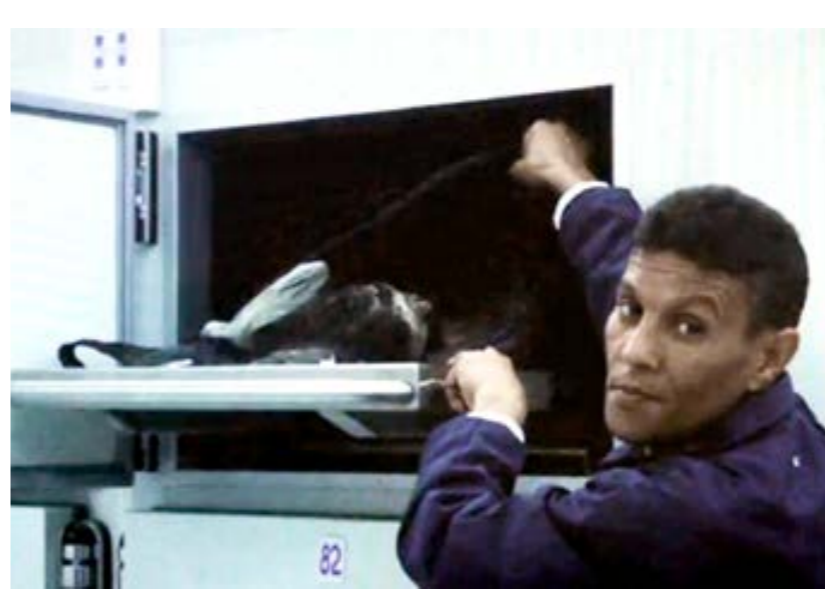
صورة نشرتها «بي بي سي» تقول إنها لعامل بمشرحة ليبية تظهر صورة وجه جثة الصدر