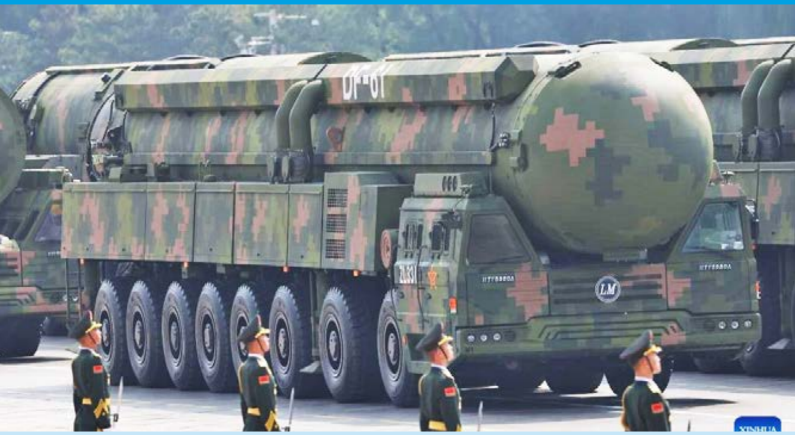
(يكن، 2 سبتمبر 2025)