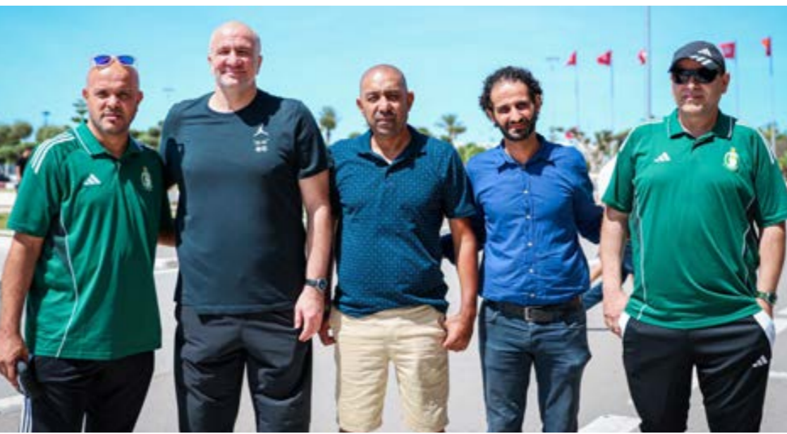
• الجهاز الفني الجديد لفريق كرة السلة بالأهلي طرابلس

وعن سبب انتقاله إلى الاتحاد على الرغم من أن الأهلي طرابلس مقبل على المشاركة في كأس العالم للأندية وبطولة الأندية العربية، قال نجم كرة السلة الليبية إنه كان متواجداً في إيطاليا