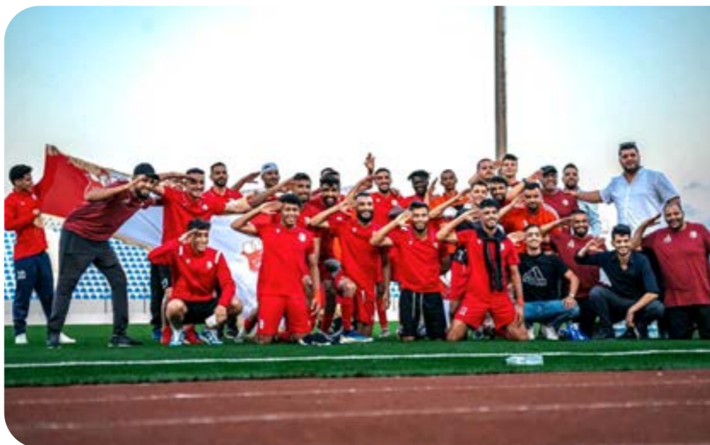
فريق الاتحاد العسكري