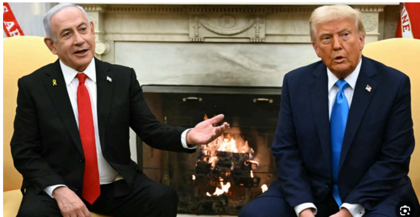
• ترامب وتنتياهو

نتنياهو يراها طوق إنقاذ ولأجلها تجاهل صفقة الأسرى وبدأ تنفيذ «عربات جدمون 2»