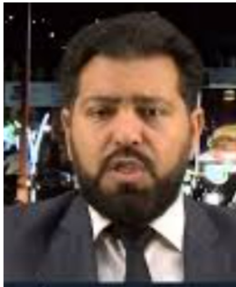
الكاتب الصحفي رمضان معيتيق