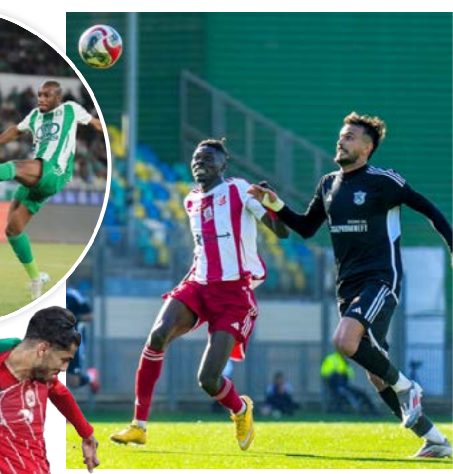
مباراة الأهلي بنغازي والتحدي