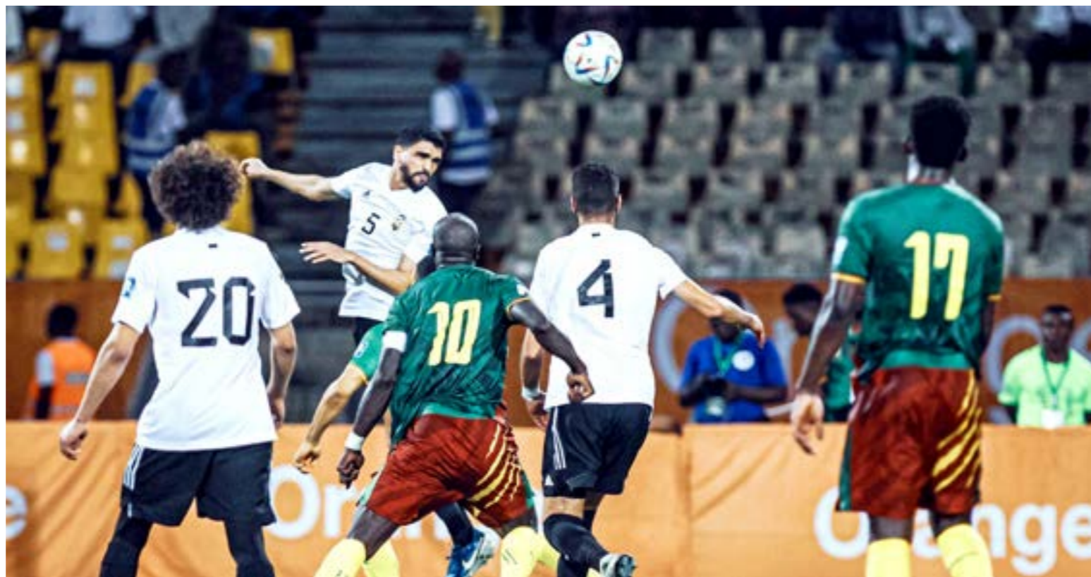
• مباراة ليبيا والكاميرون بتصفيات كأس العالم 2026