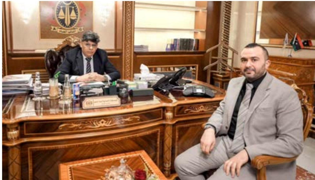
• النائب العام يستقبل وكيل وزارة الصحة المكلف بتسيير مهامها، طرابلس 6 مايو 2025

وبشأن ما ورد حول مشغلات مرضى الكلى والاختلاسات المزعومة، أكدت الوزارة أن «كافة التعاقدات والمشتريات بهذا الخصوص تجرى وفق الأطر القانونية المعمدة»، وخضعت لمراجعات من ديوان المحاسبة وهيئة الرقابة