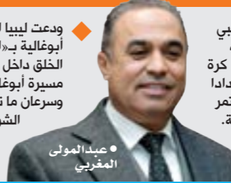
• عبدالمولى المغربي

أعلن الاتحاد الليبي لكرة القدم برئاسة عبدالمولى المغربي، إقامة معسكر تدريبي للسيدات؛ لاختيار منتخب نسائي للمشاركة بتصفيات كأس أمم أفريقيا للسيدات للمرة الأولى في تاريخ ليبيا. وأصدر اتحاد كرة القدم بياناً تضمن دعوة لاعبات كرة القدم للمشاركة في التجمع الأول لاختيار المنتخب الليبي النسائي، استعداداً للاستحقاقات الدولية القادمة. وقال الاتحاد إن التجمع سيكون بداية لمسار مستمر من العمل والنشاط، حيث ستوالي المشاركات والمعسكرات خلال الفترة القادمة. ودعا اتحاد الكرة الفتيات الموهوبات الطموحات من كل الأندية والمناطق إلى الحضور والمشاركة، مضيفاً أن الباب مفتوح لكل اللاعبات لتمثيل ليبيا.