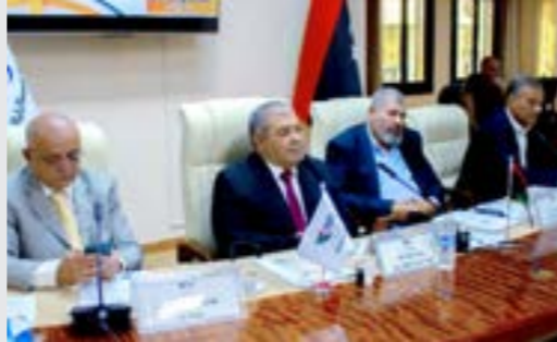
• اجتماع اللجنة البارالمبية الليبية

كما جرى تقديم تقرير مالي مفصل يوضح الوضع المالي والإيرادات والمصروفات المتعلقة بالأنشطة. وشكلت تقارير الاتحادات الفرعية في المناطق المختلفة ورؤساء اللجان الفنية بالمناطق، وكذلك رؤساء اللجان الفنية العليا للاعبين الرياضية القربية والجماعية، جزءاً محورياً من الاجتماع، حيث قدموا عرضاً تفصيلياً عن سير العمل في قطاعاتهم، والتحديات التي تواجههم على أرض الواقع، والمقترحات التي من شأنها أن تسهم في تطوير الأداء والارتقاء بمستوى الرياضيين البارالمبيين. وفي إطار التطلع نحو المستقبل، جرى استعراض الخطة الطموحة للجنة البارالمبية الليبية لموسم 2025-2026 والتي تضمنت مجموعة من الأهداف الاستراتيجية والبرامج التنفيذية.