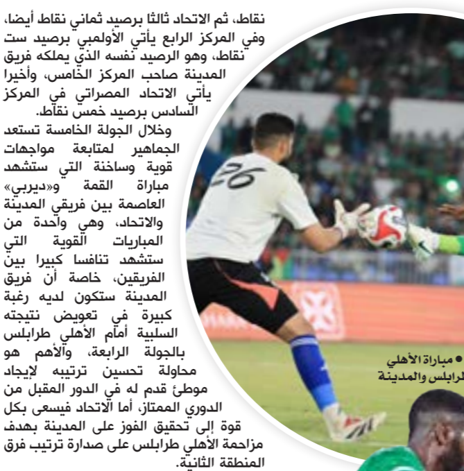
مباراة الأهلي طرابلس والمدينة

التحكيم جزء من نجاح أي لعبة رياضية خاصة كرة القدم اللعبة الشعبية الأولى في معظم دول العالم، وفي بلادنا نجد أن التحكيم الكروي ما زال يحبو في مكانه مع الإقرار بوجود بعض النجاشات الفردية، لأن الاتحادات العامة للعبة لم تعمل على تطوير المجال ورفع مستواه بوضع البرامج الفعالة بتطويره وربطه بالعالم الحديث، ووضع الضوابط التي تجيز لمن يرغب في الدخول إليه ومتابعة سيرته التحكيمية ومستوى أدائه في المباريات، ومدى نزاهته وقله أخطائه المقصودة وغير المقصودة. ونظراً لدخول «دورينا» إلى مرحلة السداسي الأول وما حدث فيه من سلبيات تحكيمية في عدة مباريات خاصة في الأسبوع الرابع، عليه نحاول أن ننبه إلى ضرورة الاهتمام بهذا المجال، إذا أردنا لكرة القدم التطور وأن يسير التحكيم معها في كل مواز.