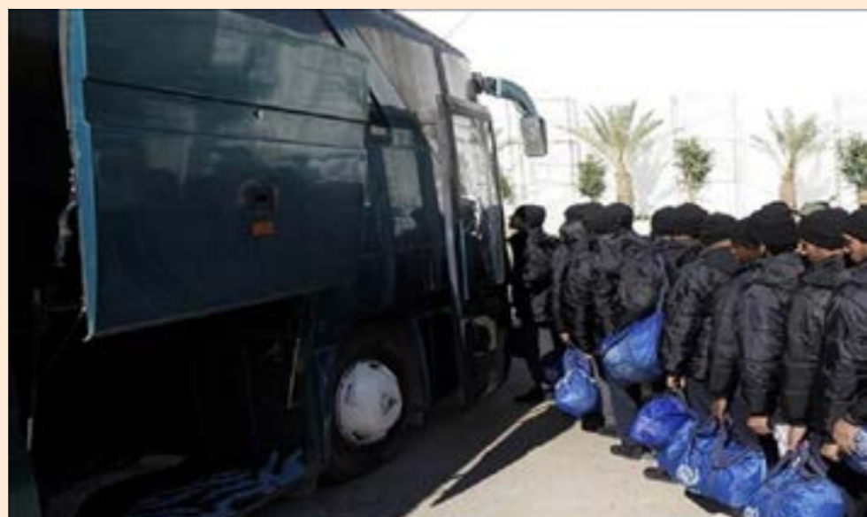
• ليبيا ترفض خطة ترامب لارسال مجموعة من المهاجرين على متن طائرة عسكرية

وفي هذا السياق، وصفت «نيويورك تايمز» قرار إدارة ترامب إرسال مهاجرين مرحلين إلى ليبيا بـ«الصادم»، مشيرة إلى «استمرار الصراع السياسي والمسلح في البلاد، وكذلك ظروف احتجاز المهاجرين المرفوعة