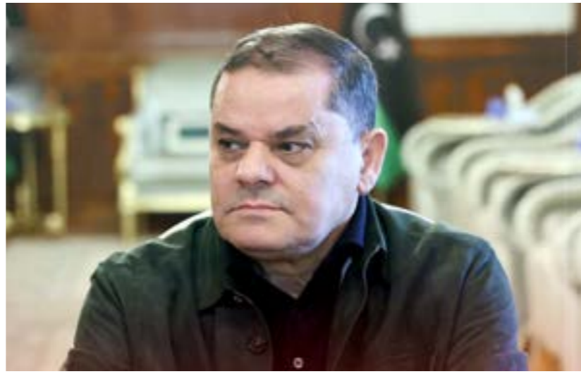
• عبد الحميد الدببية

الوزير وزير الصحة المعفي من منصبه في حكومة «الوحدة الوطنية المؤقتة»، رمضان أبوجناح، عقد مؤتمر صحفي بمقر وزارة الصحة بطرابلس، وذلك للرد على قرار إعفائه من الوزارة.