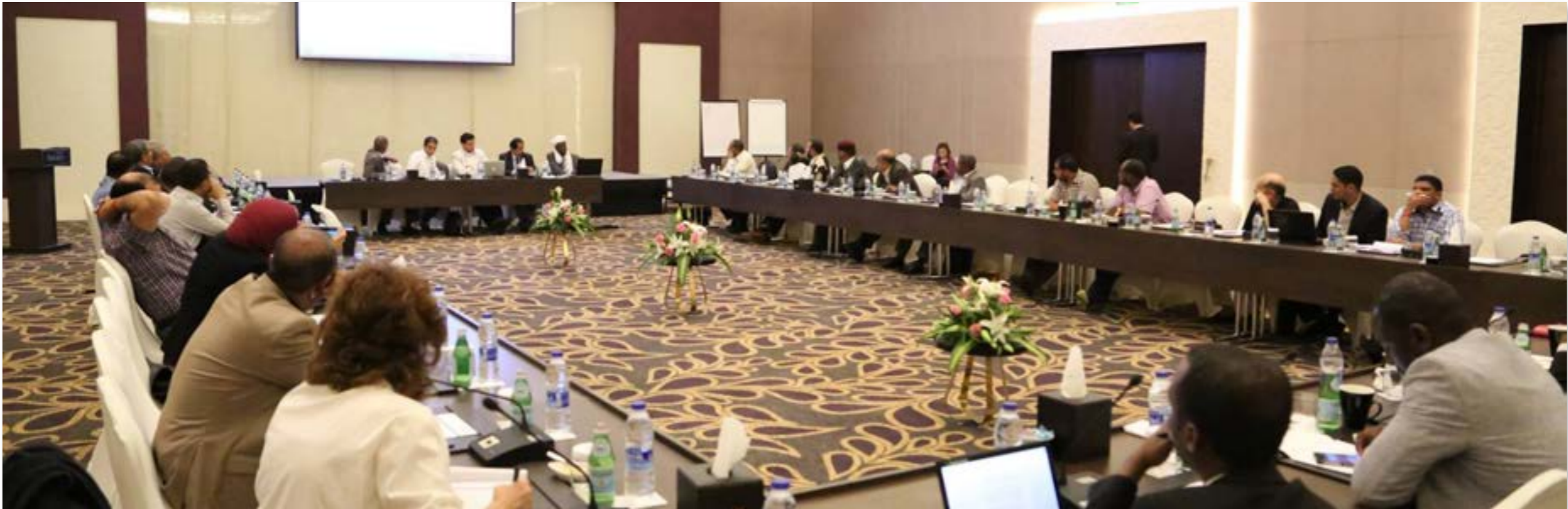
(الصفحة الرسمية للهيئة)

• من اجتماع أعضاء الهيئة التأسيسية لصياغة الدستور مارس 2016.