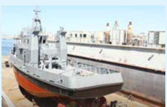
سفينة في المنطقة الحرة جليانة

وعلى هامش الزيارة، عُقد اجتماع طاولة مستديرة لمناقشة التحديات التي تواجه الاستثمارات الأجنبية وسبل تجاوزها، إضافة إلى استعراض فرص التعاون المتاحة في مجالات الطاقة والبنية التحتية والإسكان والتجارة والصناعة.