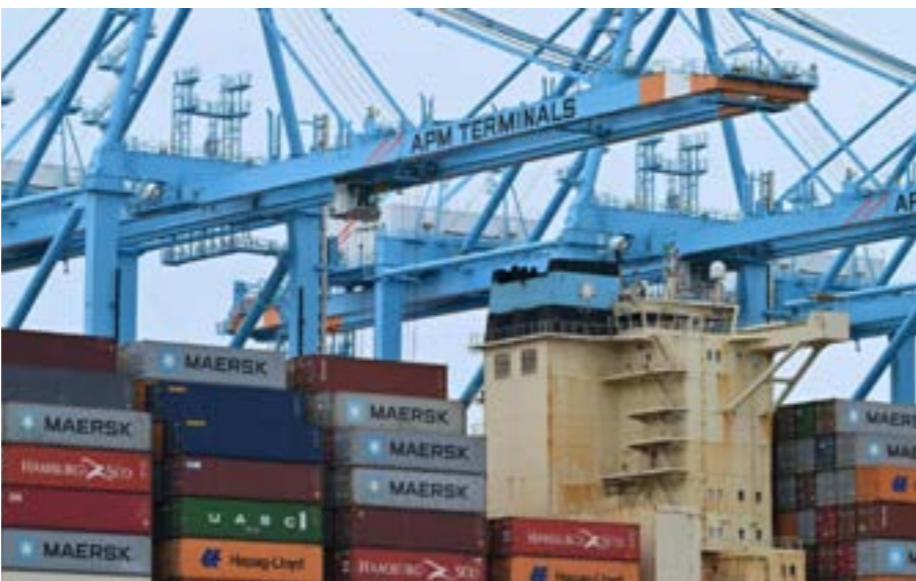
• حاويات محملة على سفينة في ميناء لوس أنجلوس، 30 أبريل 2025

وأوضح بهذا الصدد أنه مع الرسوم الجمركية البالغة 145٪ التي فرضها ترامب على المنتجات الصينية، فإن «كثافة سلعة مصنوعة في الصين باتت الآن أعلى بمرتين ونصف من تلك الشهر الماضي». وفي هذا الرسم الباهظة المفروضة على المنتجات الصينية، فرض ترامب رسوماً جمركية شاملة بنسبة 10٪