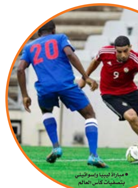
• مباراة ليبيا وأسواتيني بتصفيات كأس العالم

وهناك أيضاً المدرسة المصرية العريقة التي يقودها الصربي زوران الذي يتولى قيادة الهلال للموسم الثاني توتاليا، ويتصدر فرق مجموعته دون خسارة، من دون أن تغفل بقية الخبرات الأخرى التي لها بصماتها مع فرقها من مصر وتونس والجزائر وإسبانيا وصربيا، إلى جانب المدرب الوطني الذي يوجد ويسجل حضوره في الدور السداسي بثلاثة مدربين لهم خبراتهم وبصماتهم مع فرقهم ويدافعون عن حيازة المدرب الوطني في هذا المعترك الكروي المثير، ونحن نتمنى التوفيق في بقية المرحلة والاستفادة من كل الأخطاء لتدارك ما فات قبل فوات الأوان حتى تنتهي المسابقة في موعدها وتتفرغ لمرحلة التتويج بلقب، ومن ثم نفعس المجال والوقت أمام مدرب المنتخب الوطني السنغالي أبو سيسي لإعداد وتحضير منتخبنا الوطني للاستحقاقات الدولية المقبلة، وفي مقدمتها تصفيات كأس العالم التي سيستأنف منتخبنا نشاطه خلالها في شهري سبتمبر وأكتوبر المقبلين، الأمر الذي يتطلب عملاً إدارياً مزيماً والوقت استعداداً للمرحلة الأهم وهي مرحلة الالتفاف حول «فرسان المتوسط» ودعم الفريق ومؤازرته لكونه يمثل كل ليبيا وأنديتها وجماهيرها.