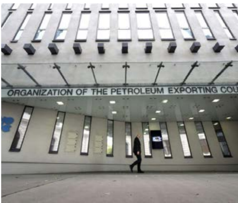
مقر أوبك في فيينا بتاريخ 4 أكتوبر 2022، (أرشيفية، أ ف ب)

تستند توقعات «غولدمان ساكس» على التأثير الذي تركته قرار «أوبك بلس» إعادة آلاف البراميل إلى الأسواق، على الرغم من انعدام اليقين المتنامي بشأن وضع الاقتصاد العالمي والطلب على الخام، على خلفية الحرب التجارية بين الصين والولايات المتحدة. وكتب استراتيجيو البنك في مذكرة صدرت أمس الإثنين: «قرار يوم السبت يزيد ثقتنا في أن خط