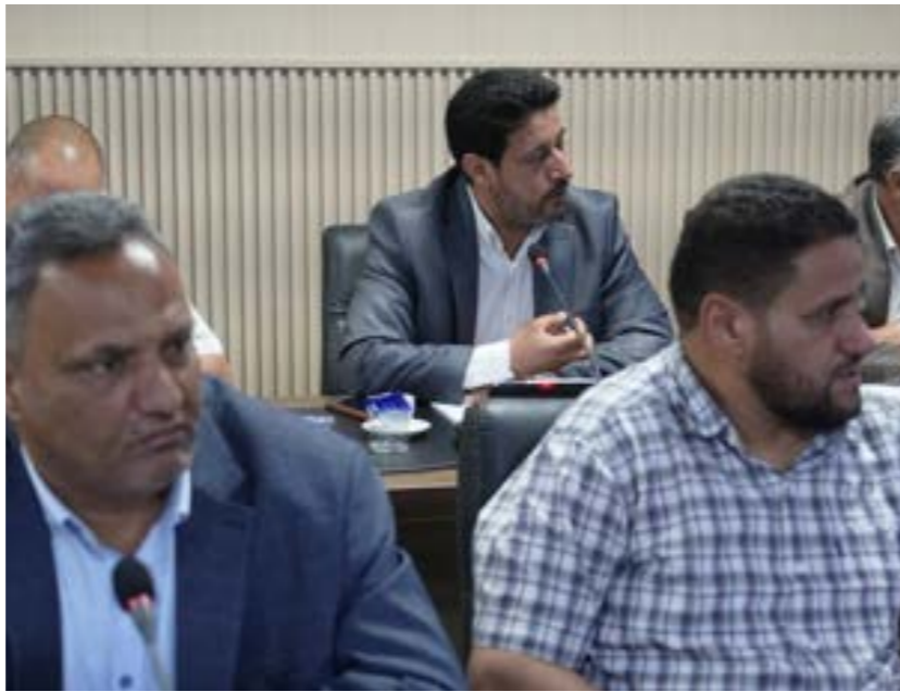
• جانب من اجتماع العمداء مع قيادات «الحكم المحلي»

الصادرة عن مختابر المحلات بالبلديات، والتي تجري المصادقة عليها من مكتب شؤون المختابر والمحلات بوزارة الحكم المحلي. وزارة الحكم المحلي لفتت إلى الاتفاق على «ضرورة استمرار التنسيق والتواصل المباشر بين الوزارتين، بما يضمن صحة وسلامة البيانات الواردة في النماذج المعتمدة، ويعزز موثوقية الإجراءات الإدارية المتبعة، وفقا للأطر القانونية النافذة». ونهاية الأسبوع الماضي عقد وزير الحكم المحلي بدرالدين التومي، اجتماعا موسعا مع عمداء الإدارات والمكاتب والجهات التابعة للوزارة، لمناقشة سير تنفيذ الخطة العامة للوزارة للعام 2025، ومناقشة التقدم المحرز في مختلف البرامج والمشاريع، واستعراض الإجراءات والخطوات اللازمة لضمان تحقيق الأهداف المحددة ضمن الخطة. وقالت الوزارة في منشور مصور على صفحتها الرسمية إن المجتمعين ناقشوا «جملة من الموضوعات الأخرى المتعلقة بمستجدات خطة التحول الرقمي بالقطاع لاسيما فيما يتعلق بالنظم المعلوماتية الجاري تنفيذها بالوزارة لإنجاز المهام وتنفيذ المراسلات الإدارية بشكل إلكتروني بين الوحدات التنظيمية داخل البلديات، وبين البلديات».