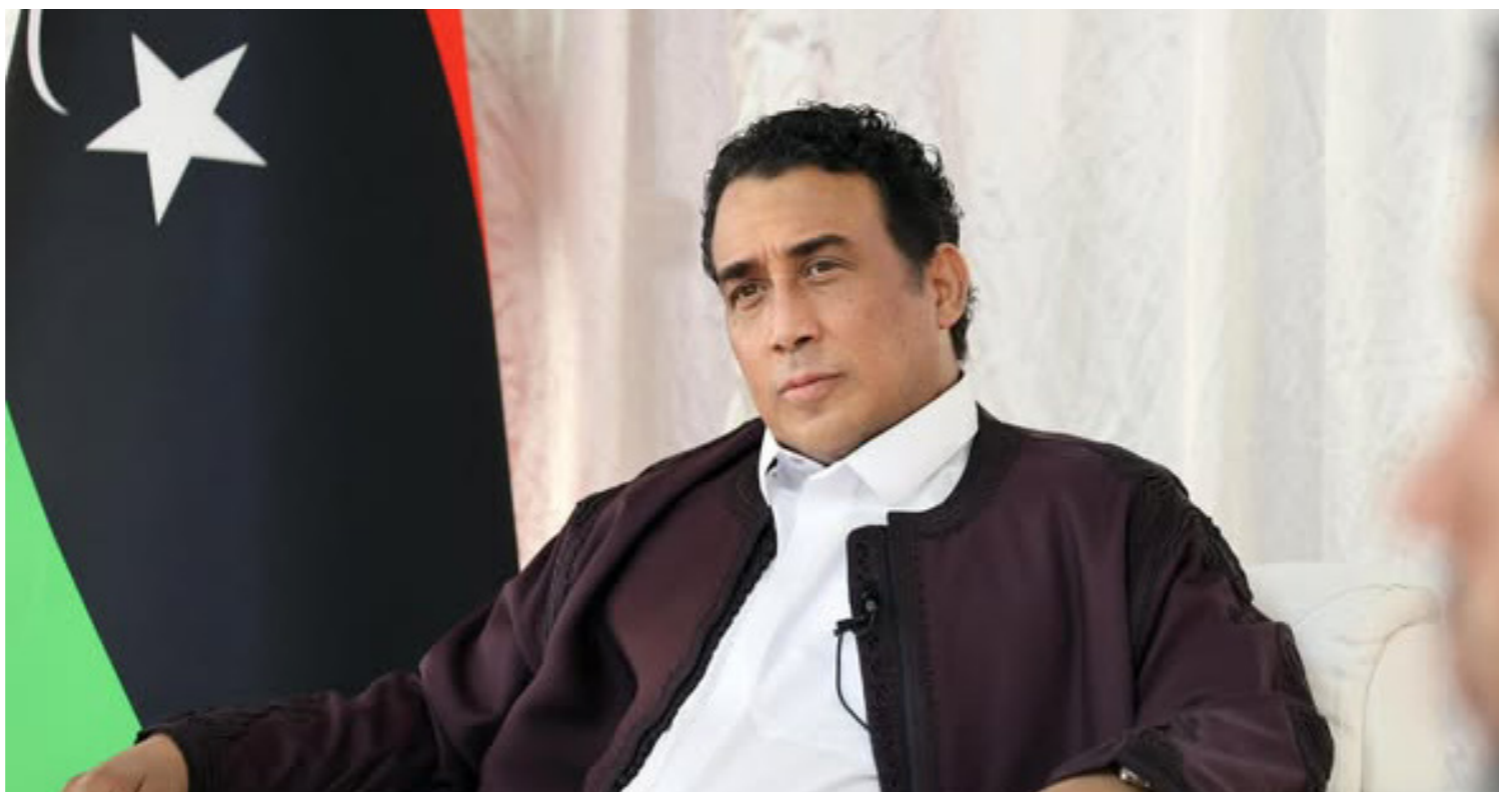
• رئيس المجلس الرئاسي محمد المنفي.

ووجد دعواته إلى إجراء انتخابات تشريعية تجدد الشرعية السياسية، وتأتي بعدها حكومة منتخبة من ممثلي الشعب، وليس ممن قفوا شرعيتهم الانتخابية منذ 10 إلى 14 سنة مضت من أعضاء المجلس. ويستبعد فرقاش، «أي تأثير واقعي يكون لمخرجات اللجنة الاستشارية، لا سيما في موضوع تغيير السلطة التنفيذية في ظل الخندق الحالي» مشترطا لنجاح مساعي الرئاسي «دعمه في إجراء استفتاء شعبي بحل المجلسين وربما الاستفتاء على الدستور أو اعتماد لفترة مؤقتة على الأقل للخروج من الوضع الراهن والنهائى في انتخابات تشريعية ورئاسية عامة تجرى على أساسه».