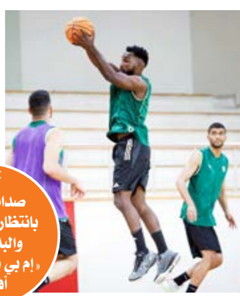
تدريب سلة الأهلي طرابلس خلال معسكر تركيا

التي أقيمت في المغرب، ومجموعة الصحراء التي أقيمت في السنغال، عن تفوق عربي واضح يتأهل فريق الاتحاد السكندري المصري والاتحاد المنستيري التونسي إلى نهائيات الدوري الأفريقي لكرة السلة «BAL»، ليضع ذلك التفوق عينا على الأهلي طرابلس الذي أصبح مطالباً بشكل أكبر بحجز مكانه بين عمالقة كرة السلة في القارة الأفريقية من خلال حجز بطاقة التأهل عن مجموعة النيل. والى جانب الفريقين المصري والتونسي، تأهل إلى نهائيات الدوري الأفريقي لكرة السلة فريق ريفرز هوبرز النيجيري بصفته صاحب المركز الثاني في مجموعة كالاهاري، وبترو أنتيغو الأنغولي بصفته صاحب المركز الثاني في مجموعة الصحراء، وكريول ستارز من كاب فبردي صاحب المركز الثالث في مجموعة الصحراء، وكريول ليدل عدد المتأهلين في مباراة جنوب أفريقيا إلى خمسة فرق، بينما تتبقى ثلاث بطاقات اثنتان منها ستذهبان لمتصدر ووصيف