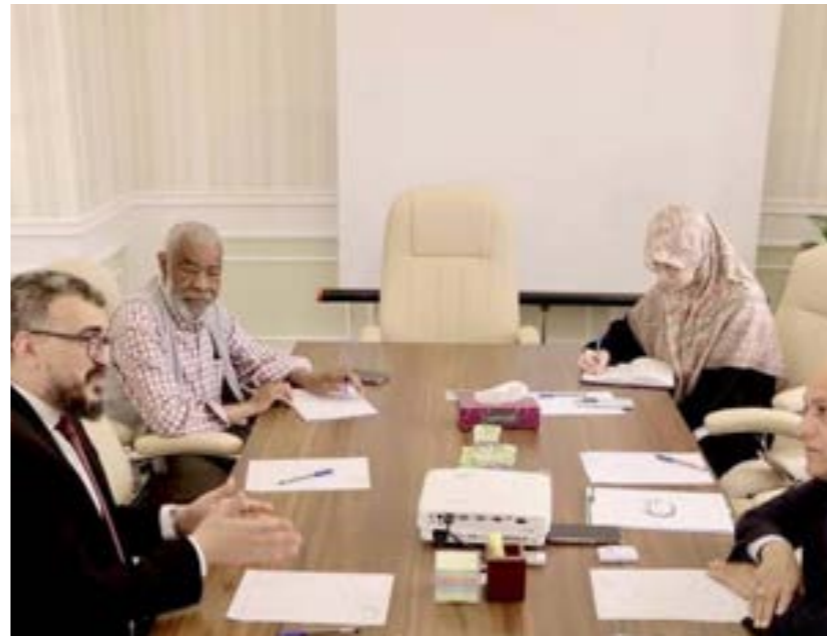
• جانب من اجتماع التومي مع رئيس هيئة التخطيط العمراني، 4 مايو 2025

والتعرف على الصعوبات والتحديات التي تواجهها بهدف تذليلها». وأوضحت أن ذلك في إطار تنفيذ توجيهات رئيس الوزراء عبدالحميد الديب التي تؤكد أهمية إشراك البلديات وأخذ رأيها في متابعة وتنفيذ المشاريع التنموية الواقعة ضمن نطاق عملها الإداري. وافتتحت الوزارة في منشورها إلى أن هذا الاجتماع عقد بحضور عمداء بلديات «طرابلس المركز، البيضاء، أم الرززم، الحليدة، سيدي السايح، قصر بن غشير، العواتة، وزارة الزاوية الجنوبية، الجميل، صبراتة، المنشية، غدامس، رقدالين، سرمان، اسبيعة، مرادة، ككلة، الساحل، سوق الجمعة، زطن، الساحل»، ويأتي في إطار جهود الوزارة المستمرة لتعزيز الأداء