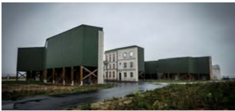
• ديكورات سينمائية في منطقة سين إي مارن الفرنسية، 2 أكتوبر 2024.