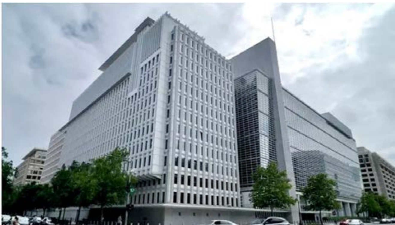
مقر البنك الدولي في واشنطن

وحسب التقرير ذاته، فقد توقع البنك الدولي تسارع التضخم، الذي لا يمكن تقديره إلا في منطقة طرابلس، إلى 3.6% في العام 2025 نتيجة لخفض قيمة الدينار في أبريل الماضي. وإذ أشار البنك الدولي إلى «حاجة ليبيا إلى موازنة موحدة شفافة وفعالة»، فإنه أعاب على الليبيين عدم