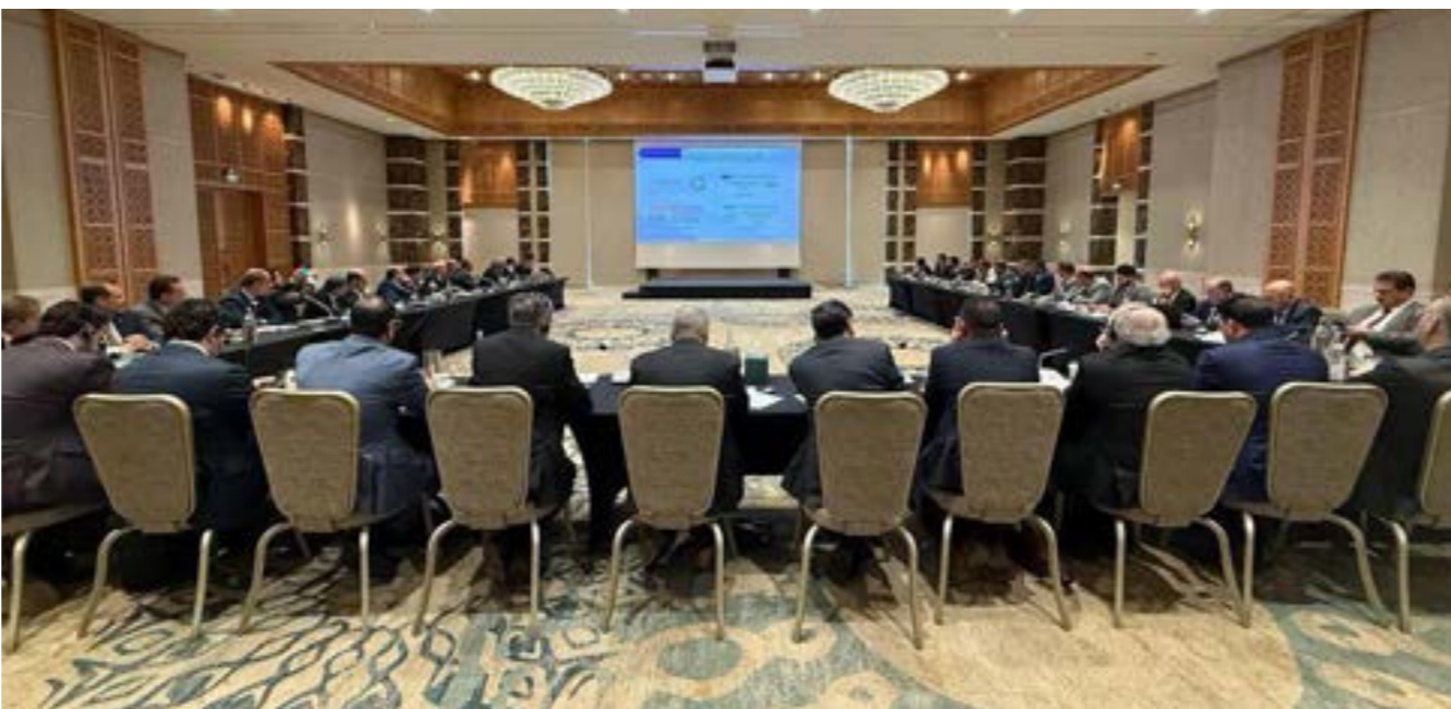
• مشاورات وفد اقتصادي رسمي لبيبي مع فريق خبراء صندوق النقد الدولي.

وتنص المادة الرابعة من اتفاقية تأسيس صندوق النقد الدولي على إجراء مناقشات ثنائية مع الدول الأعضاء، تجرى في العادة على أساس سنوي، ويوزر خلالها فريق من خبراء الصندوق البلد العازم، ويجري المعلومات الاقتصادية والمالية للعضو، ويجري مناقشات مع المسؤولين الرسميين حول التطورات والسياسات الاقتصادية في هذا البلد. وبعد العودة إلى مقر الصندوق، يعد الخبراء تقريرا يشكل أساسا لمناقشات المجلس التنفيذي. وفي ختامها، يقدم