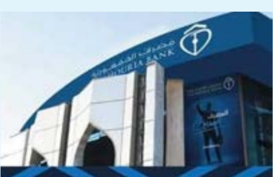
• مصرف الجمهورية

وقال أديسينا، في كلمة ألقاها بجامعة نيجيريا الوطنية المفتوحة، إن هذه التطرقت أيضا إلى العجزة وانخفاض المساعدات الخارجية، إن هذه الرسوم الجديدة، واحتمال فرض رسوم جمركية أعلى على 47 دولة إفريقية، سيستبان في أضرار العملات المحلية على خلفية انخفاض عائدات النقد الأجنبي. وأضاف في العاصمة أوجندا: «سيرتفع التضخم مع ارتفاع تكاليف السلع المستوردة وانخفاض قيمة العملات في مقابل الدولار الأميركي». وتابع: «سيرتفع تكلفة خدمة الدين كمنصة من إيرادات الحكومة، وذلك في ظل الانخفاض المتوقع للإيرادات». وفي حين يتوقع بعض المحللين تقارب دول العالم مع شركاء تجاريين آخرين، من بينهم الصين، حذر أديسينا من أن أوروبا وآسيا «ستستريان سلعًا أقل مصدرها أفريقيا وسط الصدمات العالمية».