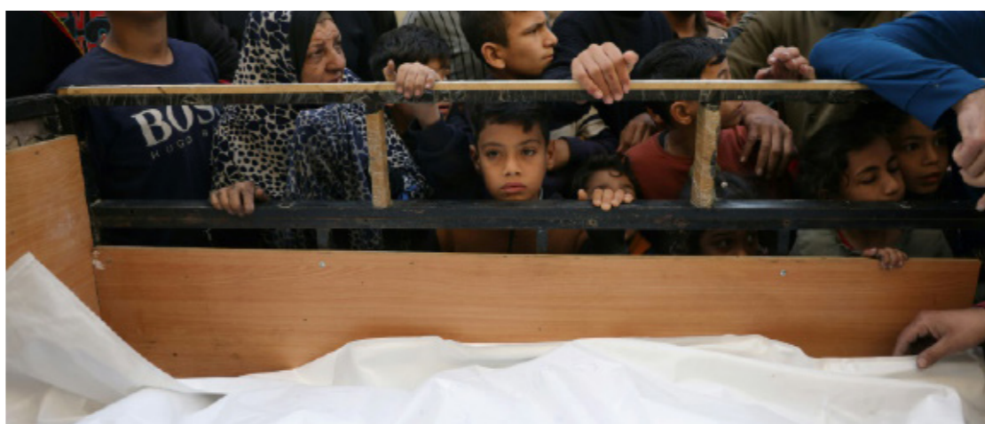
• فلسطينيون يتجمعون حول جثث مغطاة قبل دفنها بعد غارات إسرائيلية على نزلة جنوب غرب جباليا.

ووفق رؤية الخبير العسكري الأردني، فإن ما يجري في غزة لا يمكن فصله عن المشهد الإقليمي العام، في ظل تصاعد الأزمات في البحر الأحمر وسورية وإيران وأوكرانيا. قائلًا: «دونديلا وساعدا، لكن حتى اللحظة لا مؤشرات حقيقية على تغيير الموقف الإسرائيلي أو الأميركي بشكل جذري».