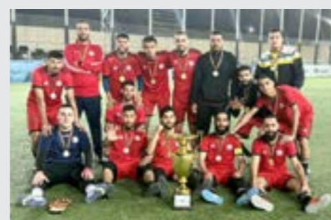
• تتويج الأحرار بزليتن ببطولة سوبر الكرة المصغرة