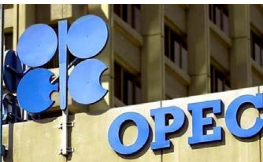
• شعار أوبك

وأوضحت الوكالة في تقريرها الشهري: «النظرة المستقبلية المتدهورة للاقتصاد العالمي في ظل التصعيد الحاد والمفاجئ في التوتر التجاري بأوائل أبريل دعغتنا إلى خفض توقعاتنا لنمو الطلب على النفط هذا العام». وتوقعت الوكالة أن يتباطأ النمو بشكل أكبر في عام 2026، ليصل إلى 690 ألف برميل يومياً، إذ لم يحج انخفاض أسعار النفط سوى جزء من أثر ضعف البيئة الاقتصادية.