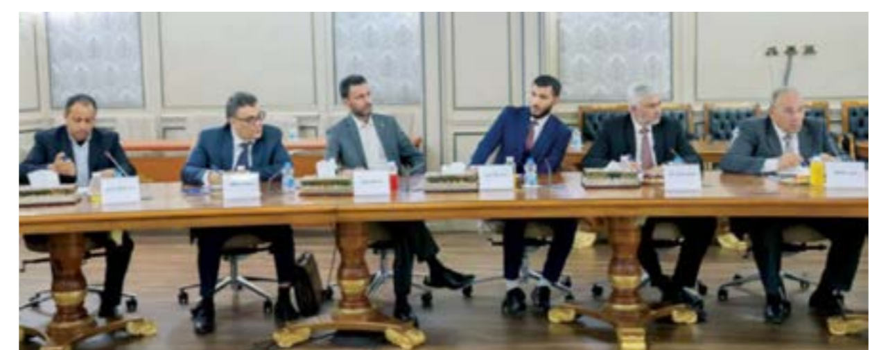
• بعض رؤساء الأحزاب السياسية في لقاء سابق برئيس حكومة الوحدة، الموقوتة عبدالحميد الدبيبة (الوحدة)

تكون هذه المبادرة محلية، لتحظى بشرعية وقبول أكثر، وتجنب احتكار إنتاج هذه المبادرة على الأطراف المحلية المتكتمة في الوضع الراهن، ذلك أنهم جزء من المشكلة، لذلك يعتقد أنها «لجات إلى تكوين لجنة استشارية اعتمدت في معيار اختيار أعضائها على مبدأ الحياد إضافة للتركيز على التكنولوجيا، لضمان الحصول على مخرجات من اللجنة أقل تأثراً بأطراف الصراع». وفيما يتعلق بمقترحات الأحزاب للبعثة خلال لقاءات سابقة لهم فقد قال الحمري، «تركزت على عدم البعثة في إنجاز المبادرة، بسبب الانهيار المتسارع للوضع الاقتصادي والمعيشي، إضافة لتضاؤل احتمال حصول صدامات مسلحة، كما أوضحوا للأمم المتحدة أهمية أن تكون هناك شفافية ووضع أكثر في خطط البعثة بخصوص أي مبادرة». وتطالب التكتلات بأهمية عدم إغفال الجانب الجغرافي والإقليمي عند التعامل مع موضوع تكوين لجنة حوار لتفضي لحكومة موقوتة، مركزين أيضا على مدى أولوية الاهتمام العادل بالجنوب الليبي (إقليم فزان) أسوة بالإقليمين الآخرين. وأكد رئيس حزب «نيض الوطن»، أهمية إشراك الأطراف القوية الحالية لضمان عدم عرقلتهم المبادرة، ولكن دون تمكينهم من القدرة الكاملة على إفشال العمل حال سلبية تعاونهم، مشيراً إلى أهمية دور المرأة وعدم تجاهل أو إقصاء أي أقلية أو فئة لضمان شمولية الحل. أما المحلل السياسي سليمان البيوضي فيتوقع إعلان اللجنة الاستشارية نتائج أعمالها في 25 أبريل وستكون بعدها خطة عمل للوصول للانتخابات الوطنية في ليبيا. لافتاً في تصريح إلى «الوسط» بخصوص الأنباء التي تتحدث عن حسم دولي لإنهاء حكومة «الوحدة الوطنية الموقوتة» برئاسة عبدالحميد الدبيبة، إلى أن «المواقف الدولية تتسم بالديناميكية وهي متغيرة بحسب مصالح الدول