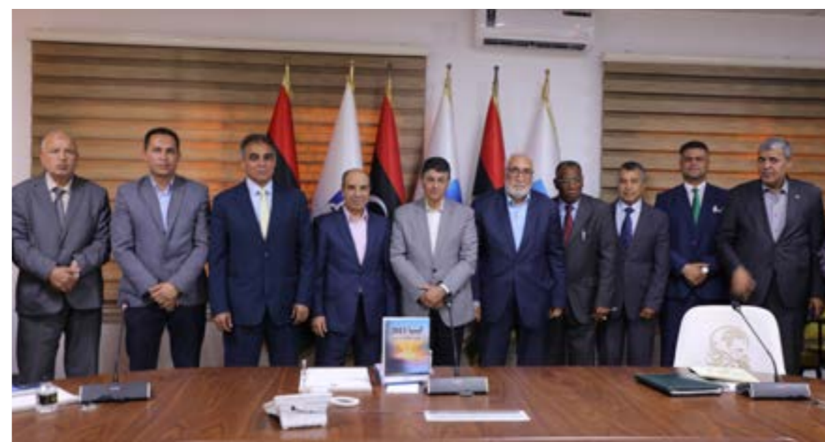
المتحاورون وأمامهم نسخة من الكتاب

المؤلف تحدث عن الدور الكبير الذي قامت به بعثة ليبيا في الأمم المتحدة خلال بداية ثورة فبراير 2011، للحفاظ على ممتلكات السفارات الليبية في الخارج، كما أشار إلى الجهود المبذولة لمنع بيع تلك الممتلكات عندما حاول البعض من