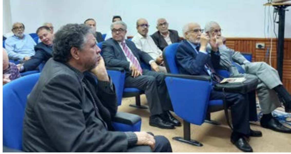
عدد من حضور حفل التوقيع بالمجمع