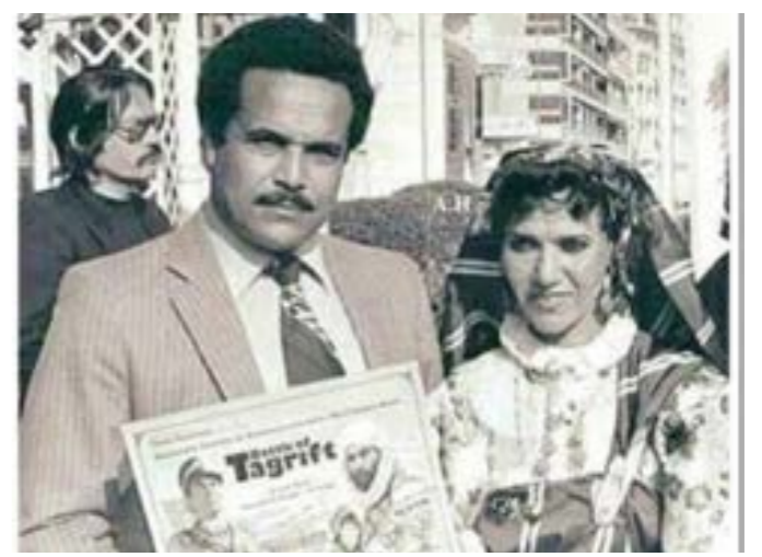
الفنانة الراحلة حميدة الخوجة خلال مشاركتها في أحد المهرجانات الدولية

عمت أجواء الحزن في الوسط الفني الليبي هذا الأسبوع برحيل الفنانة القديرة حميدة الخوجة، التي وصفها الوسط الفني بأنها «أم المسرح الليبي»، بعد مسيرة حافلة بالأعمال الإبداعية التي رسخت وجودها كرمز للفن المحلي. وعلى مدار عقود، تميزت الفنانة الليبية الراحلة بحضورها الصادق وتنوع أدوارها، وإبداعها الذي ظل راسخاً في ذاكرة المشاهد الليبي، مما جعلها صورة وصوت المرأة الليبية في الدراما. وتداولت صفحات تواصل ليبية ما قالت إنه آخر تسجيل مصور للفنانة الراحلة وهي على فراش المرض؛ حيث دعت الليبيين إلى الوحدة ونبت الكراهية قائلة باللهجة العامية الليبية «لازم نحب بعض، نتعيش كويسين، ربي يباعد الفتنة ويباعد البغض بين الليبيين». وتعاني ليبيا من انقسام بين حكومتين