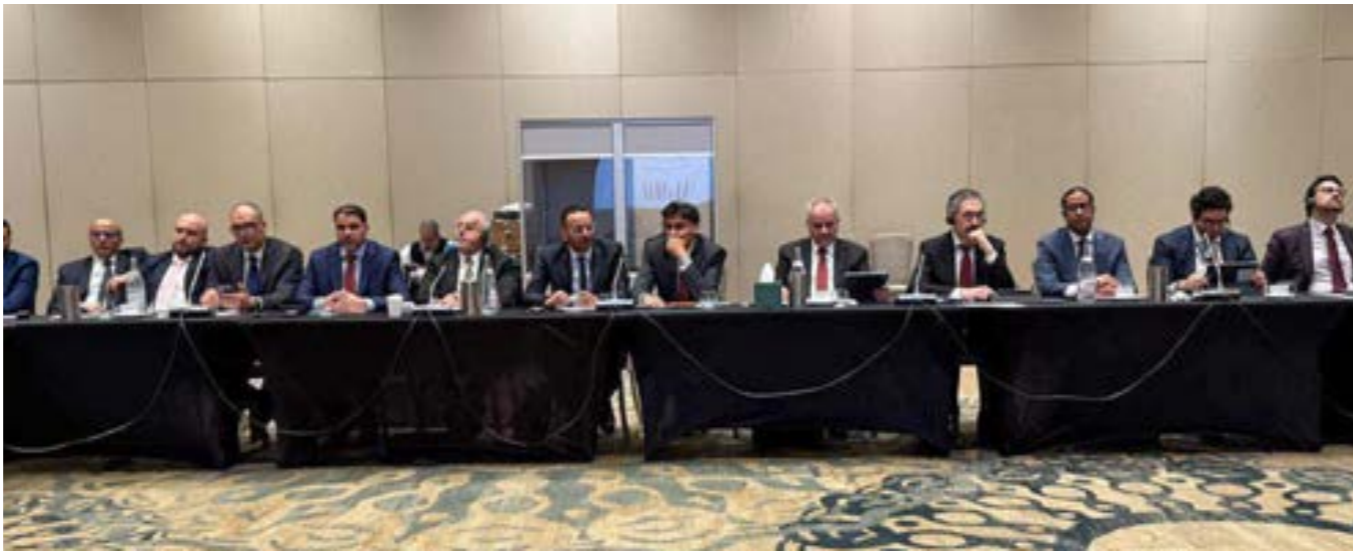
«مصرف ليبيا المركزي»

في المناسبات السيادية يجب أن تجري عبر توافق مجلسي النواب والدولة، محذراً من التعدي على أحكام الإعلان الدستوري، والفوضى الشاملة التي تحدث نتيجة تجاوز نصوصه. وبالمثل، رفض عقيلة صالح القرار، وموجهت اتهامات صريحة بتورط مسؤولين وأجهزة الدولة في الفساد، وكان من المفترض أن يتولى شكشك رئاسة الديوان لمدة ثلاث سنوات تجدد له لمدة واحدة فقط منذ العام 2015 وهو ما لم يحدث.