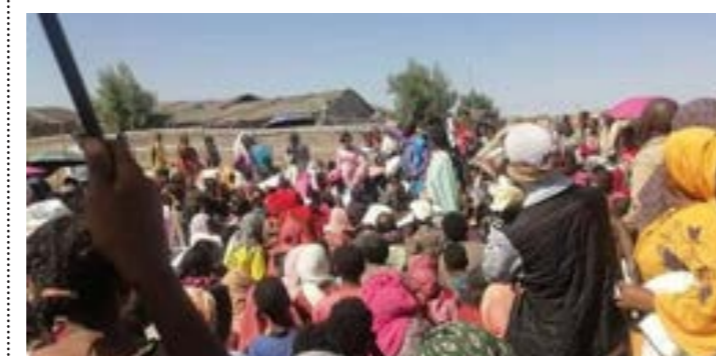
• المدنيون هم من يدفعون ثمن الحرب في السودان

آخر مدينة رئيسية لا تزال خارجة عن سيطرتها في الإقليم. وأطلقت هذه القوات، الأسبوع الماضي، هجوماً جديداً عند أطراف القاشر التي تحاصرها، أتاح لها السيطرة على مخيم زعيم الذي يعاني المجاعة، وذلك بعد يومين من القصف المدفعي العنيف وإطلاق النار.