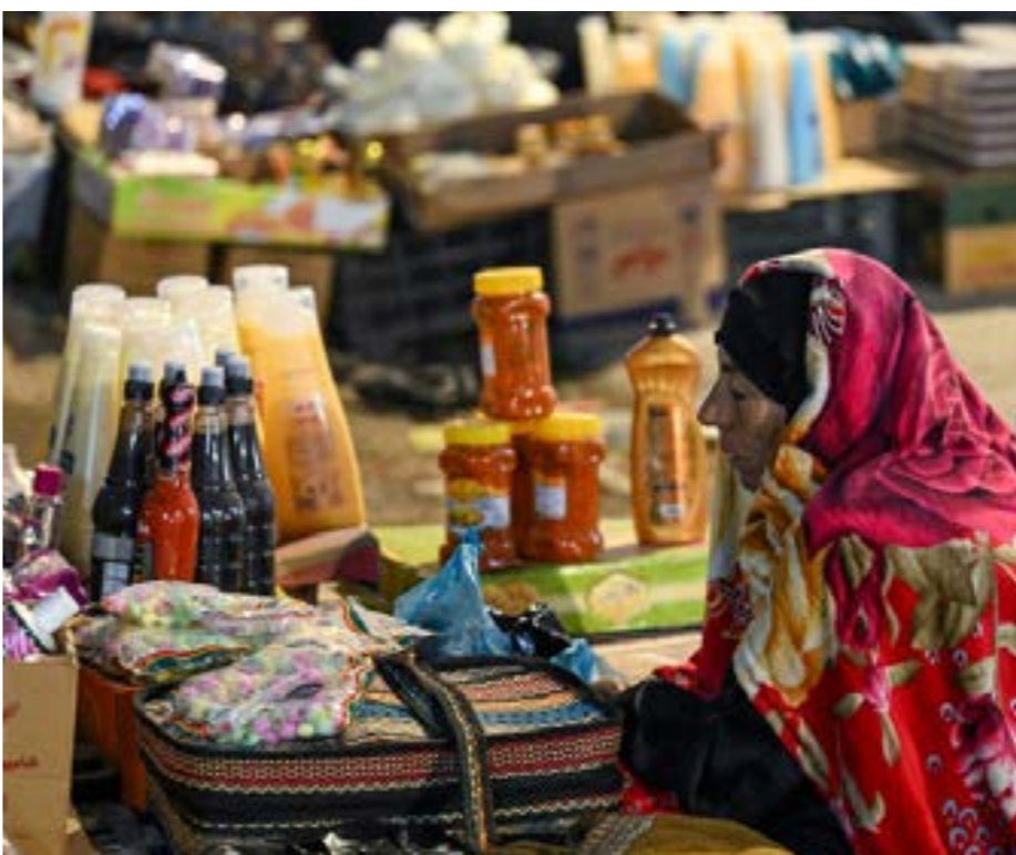
• بائعة جواله إيرانية في السوق القديمة في مدينة البصرة في جنوب العراق، 28 مارس 2025.

على صيف غراه الفخار، تنتشر بضائع في صنایق بلاستيكية أو أكياس رز، ويجلس باعة، بينما ينام آخرون، وقد تلخفوا بطبائنا أو قطع كرتون، قرب صناديق وحقائب سفر وأكياس بلاستيكية كبيرة لحمل البضائع. ويؤكد الباحث في مركز «تشاتام هانس» حيدر الشاكري أن هذه الظاهرة القديمة «تزايدت إلى حد كبير خلال العقد الماضي مع تزايد تأثير العقوبات على الحياة