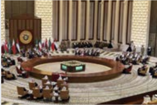
• حالات داعمة للقوى المجتمعية الثورية السورية