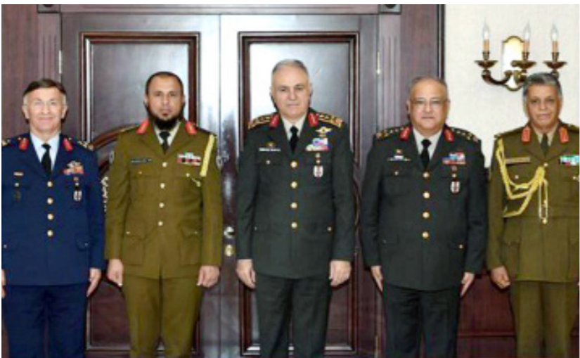
• اللواء محمود حمزة مع قيادات وزارة الدفاع التركية في أنقرة، 14 أبريل 2025، حكومتنا،