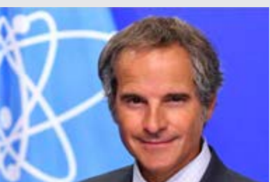
• رافاييل غوروسي

وسبق للشيباني أن زار قطر مرتين منذ توليه منصبه، وخلال زيارة برفقة وزير الدفاع ومدير الاستخبارات، دعا الشيباني إلى رفع العقوبات عن سورية، معتبراً أنها تشكل حاجزاً وممانعاً من الانعاش والتطوير «السريع».