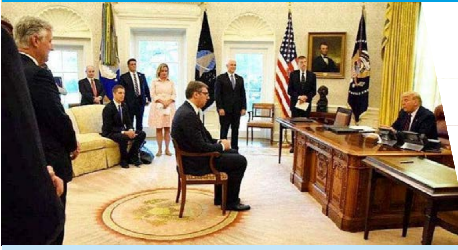
• ترابم يجلس الرئيس المصري كالتعليم، في المكتب البيضاوي.

وفي أوروبا، سيبلغ سعر النسخة الرقمية من الجهاز 499.99 يورو، وفق «سوني»، مما يمثل زيادة بنحو 11٪ مقارنة بسعره الأولي (449.99 يورو)، ومن بين المناطق المتأثرة، أعلنت شركة سوني عن زيادة في أسعار PS5 بالمملكة المتحدة ونيوزيلندا وأستراليا، مما يؤثر على كل من الإصدار