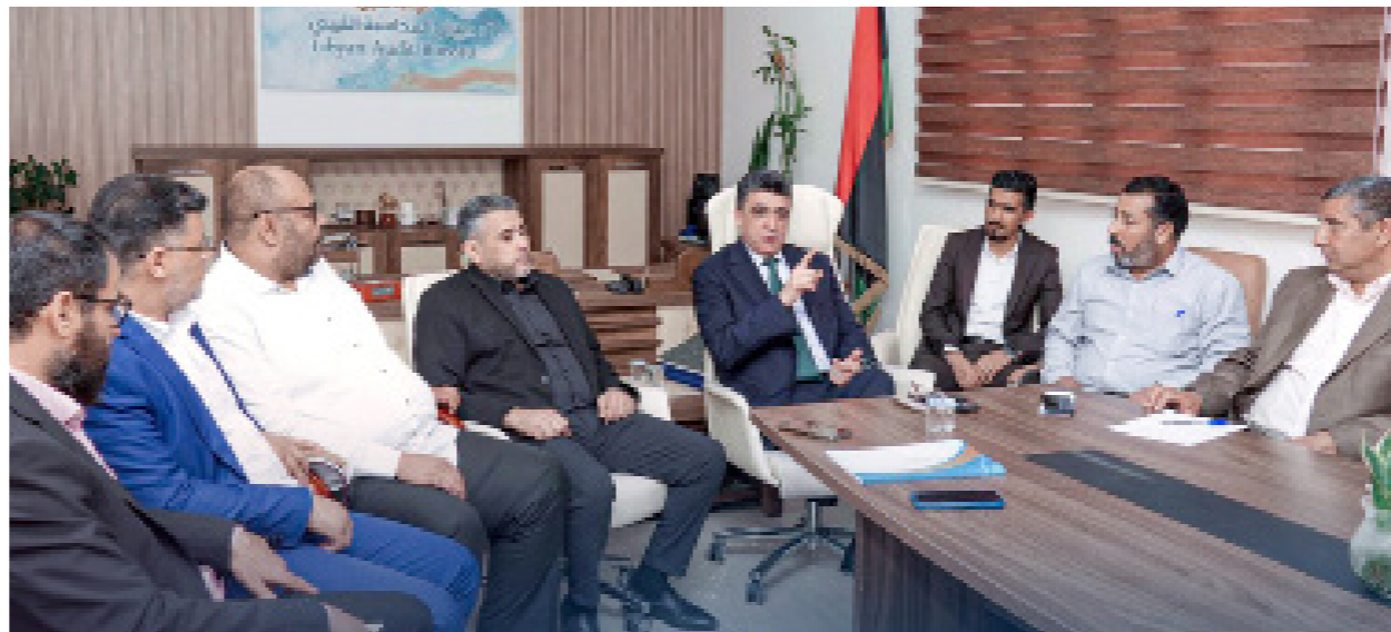
شكشك مجتمعاً بمرؤوسيه في مقر ديوان المحاسبة، الظهرة 15 أبريل 2025

جاء ذلك خلال لقاء جمع رئيس ديوان المحاسبة خالد شكشك، مع القائم بأعمال السفارة الأميركية في ليبيا جيريمي برنت، حسب بيان نشرته صفحة ديوان المحاسبة على «فيسبوك».