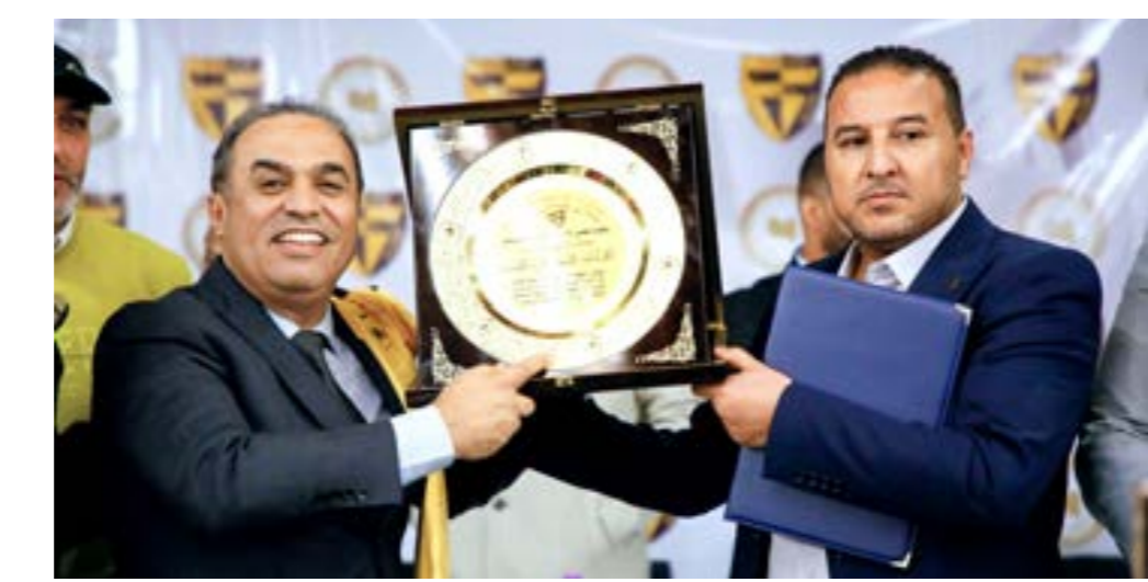
• نجوم فريق دارنس يحل الدوري الليبي في موسم 78-79