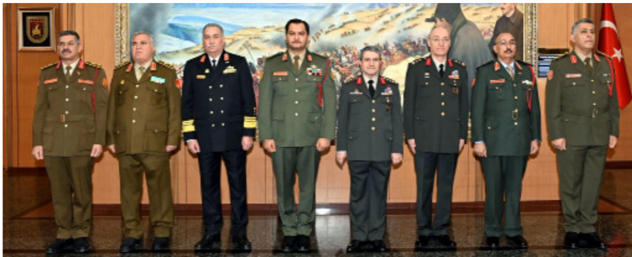
• استقبال رسمي عسكري لصدام حفر من مقر وزارة الدفاع التركية، 4 أبريل 2025