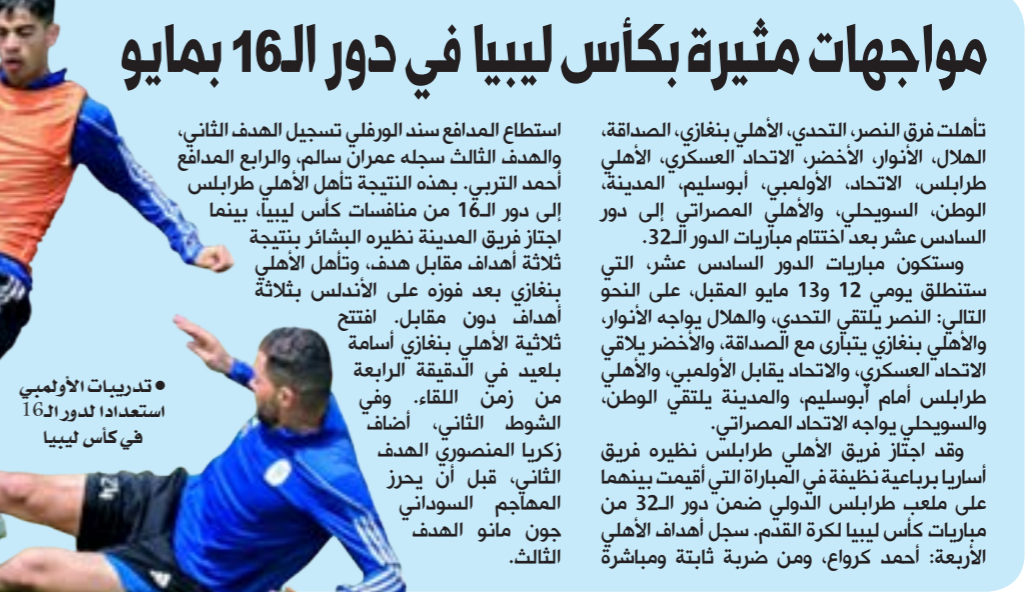
• تدريبات الأولمبي استعداداً لدور ال16 في كأس ليبيا