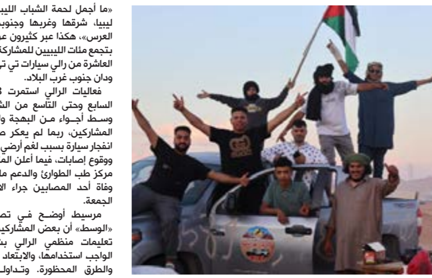
● العلم يجمع الليبيين من أنحاء البلاد كافة في رالي ودان