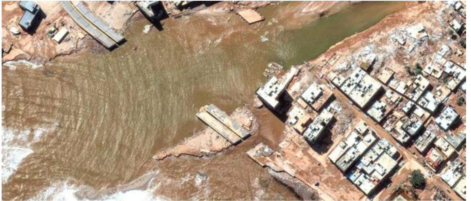
آثار العاصفة المدمرة «دانيال»، التي ضربت درنة في سبتمبر 2023

تجاوزت عملة بتكوين عتبة 80 ألف دولار الأحد للمرة الأولى في تاريخها، مدعومة بأحتمال تخفيف القوانين المنظمة للعمليات الرقمية مع عودة دونالد ترامب إلى الرئاسة الأميركية. وتخطت العملة الرقمية الأولى من ناحية القيمة هذه العتبة قرابة الساعة 12.00 بتوقيت غرينتش لتصل إلى 80116 دولاراً، قبل أن تتراجع قليلاً. ووصلت بتكوين إلى مستوى 75 ألف دولار الخميس الماضي، متجاوزة المستوى القياسي المسجل في مارس الماضي، ويجري تداول «بتكوين» بشكل مستمر بما في ذلك أيام الأحد. ومنذ إعلان نتائج الانتخابات الرئاسية الأميركية، ارتفع سعرها انسجاماً مع الدولار. وتعهد الرئيس الأميركي المنتخب دونالد ترامب خلال حملته الانتخابية بجعل الولايات المتحدة «العاصمة العالمية للبتكوين والعملات المشفرة». كما تشهد عملات «ميمكوينز»، وهي عملات رقمية شديدة التقلب دفعة قوية مثل عملة «دوكونين» التي يروج لها الملياردير إيلون ماسك وهو من أشد المؤيدين لترايب. من خلال دعمه العملات المشفرة، اتخذ ترايب موقفاً معاكساً لإدارة بايدن التي تعتبر مؤيدة لتنظيم صارم للقطاع المثير للجدل والذي لا يخضع إلى حد كبير لسيطرة مؤسسات.