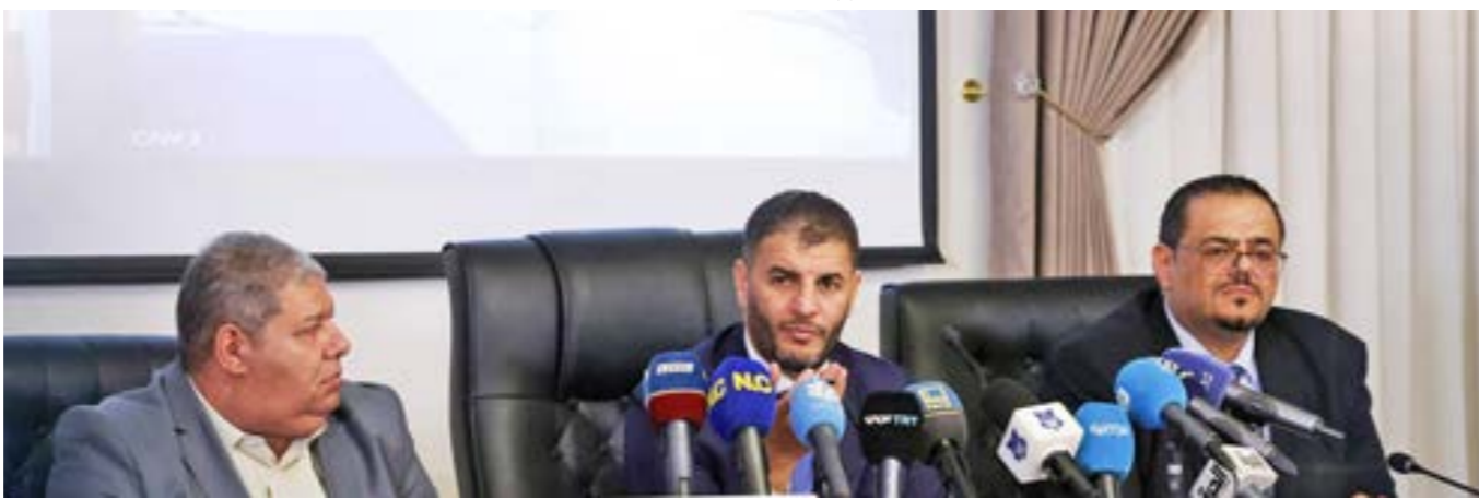
● الطرابلسي يتوسط مساعدين له خلال مؤتمره الصحفي المثير للجدل، طرابلس 6 نوفمبر 2024

ونشر حساب مجلس الدولة على «فيسبوك» الأربعاء صوراً لتكلفة وهو عقد الاجتماع الأول لمكتب الرئاسة بعد إعادة انتخابه رئيساً للمجلس الأعلى للدولة في جلسة حصل فيها على 55 صوتاً بحضور 73 عضواً من ضمن 143 عضواً. ويؤكد محللون أن الإشكالية القائمة بمجلس الدولة لم تكن يوماً قانونية؛ بل سياسية يقف وراءها الخلاف بين المشري والدمستور من مجلس الدولة المنقسم، وهو الصراع الذي سيعرقل نشاط مجلس النواب في تحريك العملية السياسية والتوافق على القوانين الانتخابية العادية ونزيرتها، والاستفتاء على الدستور الذي سنظامه إطار العلاقة بين الليبيين. كما لم يرد الديبية أيضاً على اتهامات خالد المشري الذي يعتبر نفسه الرئيس الشرعي للمجلس الأعلى للدولة حين استنكر تأمين القوات التابعة لحكومة الوحدة، جلسة الثلاثاء المؤثرة للجدل، مشيراً في تصريحات تلفزيونية إلى أنه ممنوع من عقد جلسات، واتهم السلطات الحكومية في طرابلس بالوقوف وراء ذلك، معتبراً أن الجلسة «مخالفة للنظام الداخلي، وفرض الأمر الواقع». المشري، الذي جدد تمسكه بحقه في منصبه أتهم غريمه محمد تكالة الذي أعلن فوزه برئاسة المجلس بـ«انتصاب