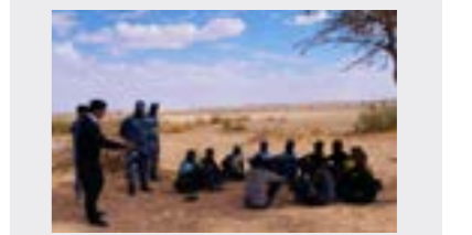
إتقاد 13 مهاجر غير نظامي «تاهوا» في الصحراء 16 ص