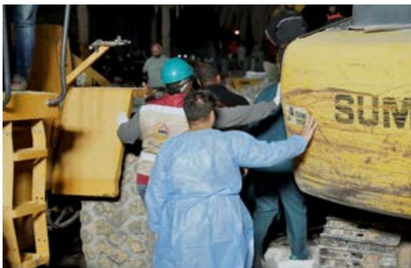
• خلال محاولة انتشال الضحايا والمصابين من تحت أنقاض العمارة المنهارة

المجلس الأعلى للدولة، أيضاً دعا الجمعة الجهات المختصة إلى إجراء تحقيق «شامل» في حادث انهيار عمارة سكنية في منطقة جنزور غرب العاصمة طرابلس، وحض على محاسبة المقصرين؛ لضمان عدم تكرار هذه الحوادث والحفاظ على سلامة المواطنين وأرواحهم وممتلكاتهم. وتقدم المجلس في بيان، بالتعازي والمواساة لأسر ضحايا الحادث، والمسائل، وتضمن الشفاء العاجل للمصابين، وأثنى على جهود الفرق الطبية في إنقاذ الجرحى وتقديم الرعاية اللازمة لهم.