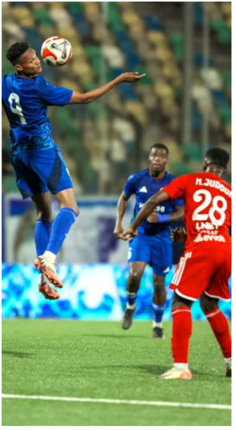
جانب من مباراة الهلال والسويحلي في نهائي بطولة عمر المختار

تستأنف المنافسات في شهر مارس المقبل بمواجهتي الغولا والكاميرون في انتظار التعرف على هوية المدرب الجديد الذي سيقود الفريق في باقي مشوار تصفيات المونديال، بعد انتهاء مرحلة المدرب المؤقت الحضورى بانتهاه تصفيات الكان التي أصبحت فيه مهمة منتخبنا معقدة في انتظار مواجهتي الفرصة الأخيرة، ومباريات آخر لثنتين التي ستكشف عن مستقبل الفريق وحظوظه في التأهل من عدمه.