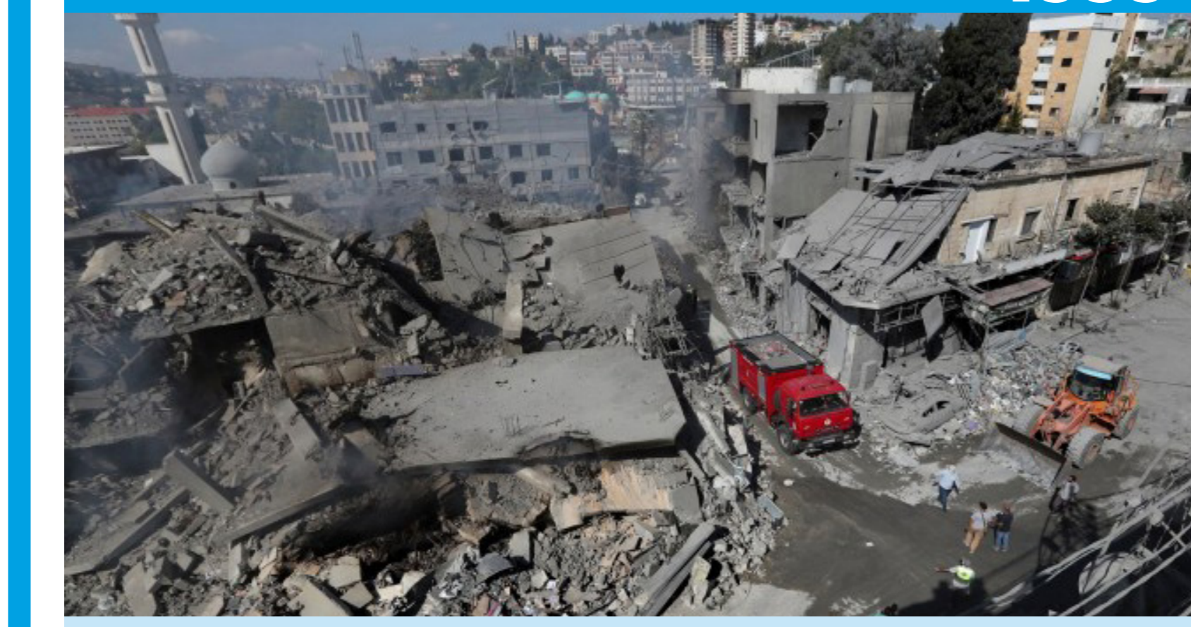
مبان مدمرة تعرضت لغارة جوية صهيونية في بلدة النبطية جنوب لبنان.