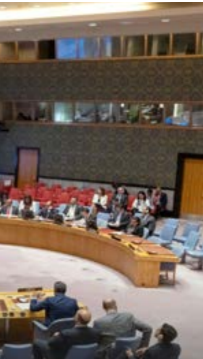
خوري تقدم إحاطتها بشأن ليبيا إلى مجلس الأمن «أرشيفية»

أضاف: «في ضوء اختيارات الشعب الليبي تعقد الانتخابات الوطنية، فهذا هو أفضل الطرق لقيام الدولة وإنهاء تدوير أزمة البلاد من قبل المجتمع الدولي». قرار تعديد مهمة البعثة الأممية في ليبيا واعتماد مجلس الأمن الدولي قراراً يقضي بتعميد ولاية البعثة الأممية حتى 31 يناير المقبل، بالتزامن مع انتهاء تفويضها الحالي في 31 أكتوبر الماضي. في 31 أكتوبر الماضي، القرار نص على أن تمدد ولاية البعثة «تلقائياً تسعة أشهر إضافية» في حال جرى تعيين ممثل خاص للأمين العام لرئاسة البعثة، كما جدد تأكيد شرعية الاتفاق السياسي الليبي الموقع في الصخيرات، و«إعادة الطريق التي أقرها ملتقى الحوار السياسي الليبي، وكذلك القوانين الانتخابية