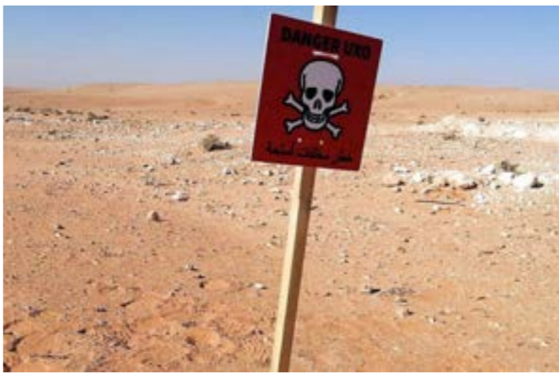
خطر مخلفات الحروب يهدد سكان عدة مناطق في ليبيا

الاستراتيجية الوطنية لمكافحة الألغام بالتعاون مع المركز الليبي للأعمال المتعلقة بالألغام، التي تهدف إلى تنظيم أعمال التخلص من مخلفات الحرب، وتعزيز الجهود الميدانية للتوعية بمخاطرها، موضحة أهمية التعاون بين جميع الأطراف المعنية بهذا الملف، بمن في ذلك المواطنون والجهات الحكومية وغير الحكومية، لضمان نجاح هذه الجهود.