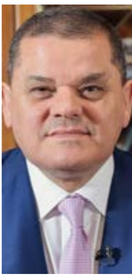
عبد الحميد الدبيبة