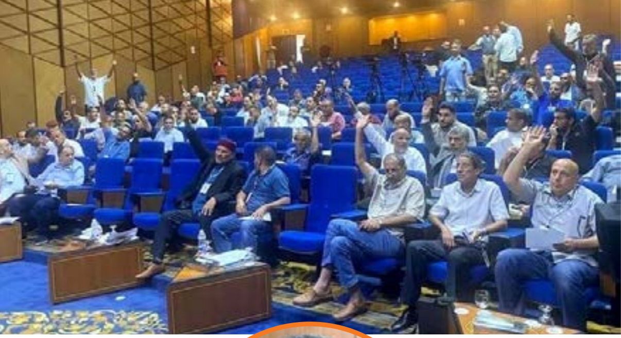
• جانب من اجتماع الجمعية العمومية لاتحاد الكرة

وقد انعكس عدم الاستقرار على شكل الموسم الجديد من مسابقة الدوري الممتاز على الأمور الإدارية والتنظيمية، حيث لم