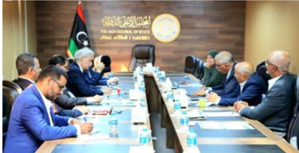
المجلس الأعلى للدولة ينتظر الاستقرار على رئيس شرعي