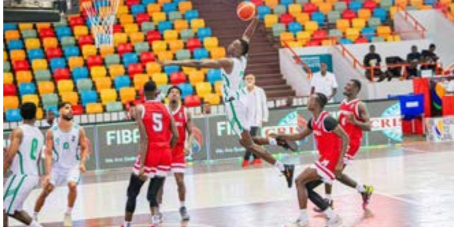
مباراة الأهلي طرابلس ومايتي بروني الليبيرى بتصفيات الدوري الأفريقي للسلة

يؤهله إلى مواصلة الطريق نحو المراحل النهائية من تصفيات الدوري الأفريقي بسهولة وعن جدارة واستحقاق، حيث أظهرت المباريات التي أقيمت حتى الآن أنه الفريق الأفضل من بين كل المنافسين. ففي مستهل رحلته بالجولة الحالية من التصفيات، تمكن الأهلي طرابلس من اكتساح فريق مايتي بارولي الليبيرى بنتيجة كبيرة مناهيا المباراة فائزاً 99 - 75 محققاً فارقاً بلغ 24 نقطة، عكس بها التفوق التام له على منافسه الليبيرى الذي لم يستطع مجاراة لاعبي الأهلي طرابلس الذين تفوقوا على أنفسهم وسيطروا على مجريات اللقاء من البداية للنهاية من دون ترك أي فرصة للمنافس لتشكيل أي صعوبة أو منحه الأمل في الخروج فائزاً، ليبدأ الأهلي طرابلس رحلته في المرحلة الثانية من تصفيات الدوري الأفريقي لكرة السلة بشكل ممتاز مطلقاً انذاراً شديد الهجة لبقية المنافسين في المجموعة بأنه توجه إلى أبديجان من أجل تحقيق هدف واحد فقط وهو العودة إلى ليبيا حاملاً بطاقة مواصلة رحلة البحث عن لقب «BAL».