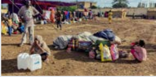
• سودانيون فارون من ولاية الجزيرة لدى وصولهم إلى مخيم للنازحين في مدينة القضارف