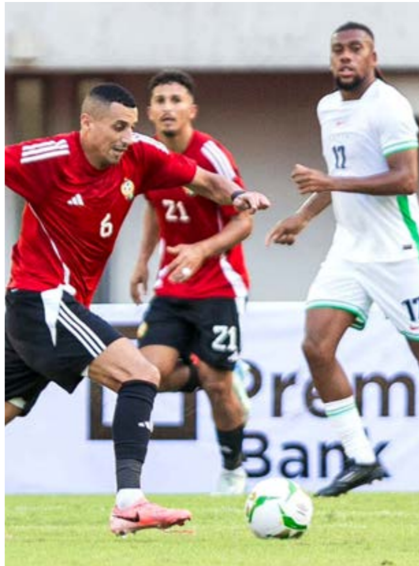
مباراة الذهاب بين المنتخب الليبي أمام نظيره النيجيري