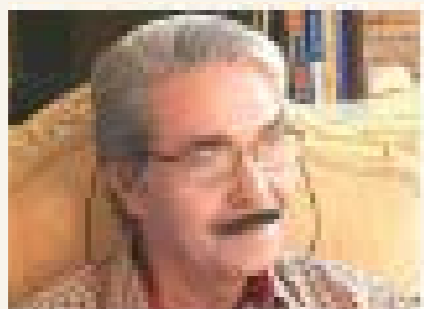
بقلم: البوصيري عبدالله

«ها أنا - عزيزي القارئ - أصل إليك أخيراً عبر هذه الصفحات من مشروع الثقافي - الوطني الأعظم، الأقرب إلى قلبي، وهو مشروع وهبته جزءاً كبيراً من عمري إذ بدأت منذ ما ينيف عن ثلاثة عقود. بدأت مراحل الأولى بتجميع المصادر والمراجع، واقتفاء كل أثر له علاقة ببلادنا العزيزة، ومطاردة تلك الآثار في المكتبات العامة والخاصة، وملاحقتها داخل حدود الوطن وخارجها، ورصدها بلغة أمتنا أو بلغة غزاتها، ثم الشروع في قراءة أو ترجمة ما نالته أيادينا ومقارنته مع بعضه بعضاً لفرز الحب عن الحسك، ولمعرفة السليم من السقيم، وبعد ذلك جاءت مهمة ترتيب المواد المراد تناولها ترتيباً أبجدياً، ثم أنت مرحلة التحرير، فالتصحيح، فالترقيم على جهاز الحاسوب ثم الدخول في المتابعة بحثاً عن الجهة القادرة على تحمل مسؤولية النشر والرعاية فيه أيضاً».