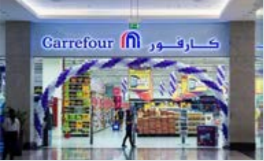
• كارفور الأردن