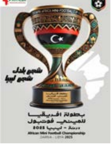
• شعار بطولة أمم أفريقيا

تستضيف مدينة بدرنة مدينة دينة منتصف الشهر المقبل قرعة بطولة أمم أفريقيا للميني فوتبول التي تستضيفها ليبيا خلال شهر أبريل 2025. وأعلن الاتحاد الليبي للعبة أن المنتخب الليبي سيخوض مباراة مهمة أمام منتخب رومانيا في مباراة «الماستر كب»، وذلك لمتناسبة إجراء قرعة بطولة الأمم الأفريقية التي تستضيفها ليبيا على ملعب بدرنة الدولي، وقال إن المباراة ستقام في السادسة والنصف مساء في الخامس عشر من ديسمبر على ملعب بدرنة الدولي.