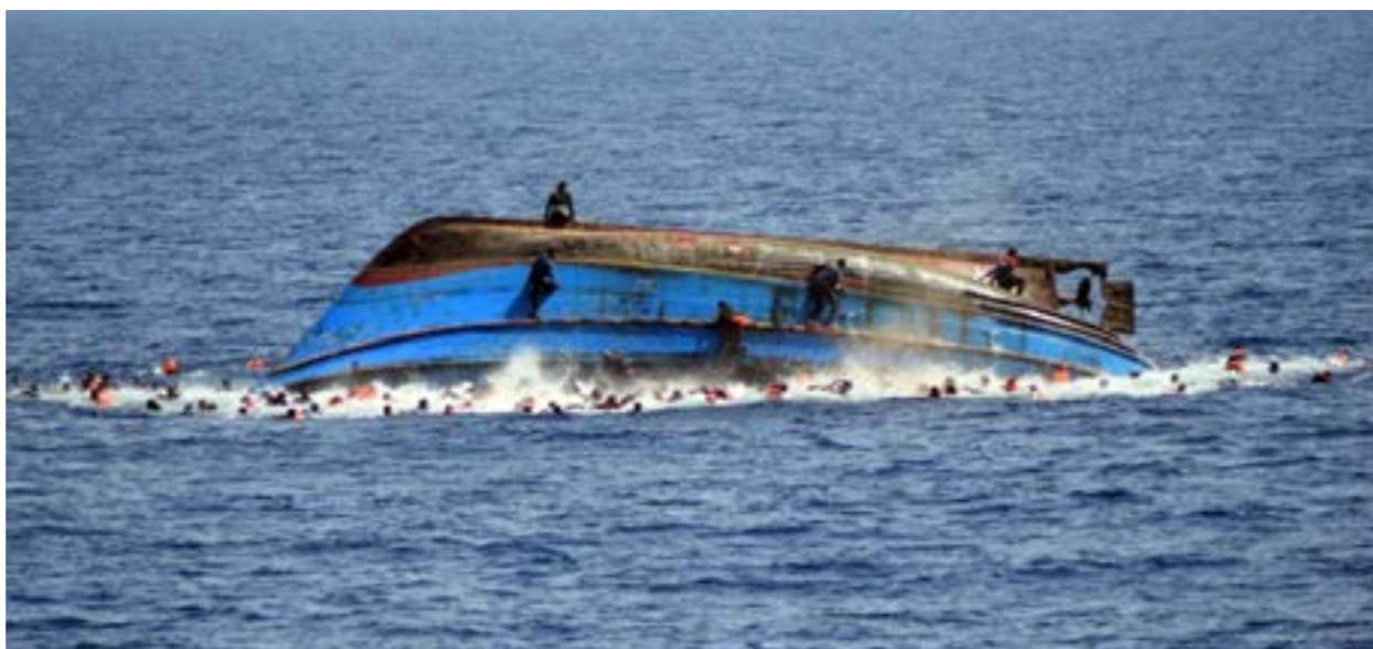
قارب هجرة غير نظامية يغرق في مياه المتوسط، أرشيفية.

وفي أغسطس الماضي أعلن كل من رواتدا والاتحاد الأفريقي والمفوضية السامية للأمم المتحدة لشؤون اللاجئين تصديق اتفاق الإجراء الطارئ للمهاجرين واللاجئين الأفارقة من ليبيا إلى نهاية العام 2025. وسيجري تصديق مذكرة التفاهم الموقعة في سبتمبر 2019 حتى 31 ديسمبر 2025. وينص الاتفاق على التزام جميع الأطراف بحماية وإيجاد حلول دائمة للاجئين وطالبي اللجوء الذين جرى إجلاؤهم من ليبيا.