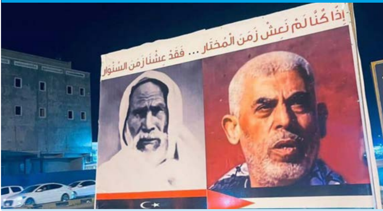
صورة بمدخل مدينة الزاوية ترعيب كعاب عمر المختار ويحيى السنوار ضد الاحتلال.