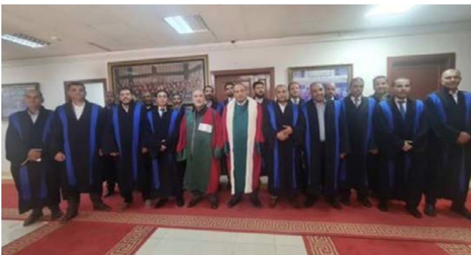
• قضاة المحكمة العليا خلال افتتاح السنة القضائية 72، طرابلس 10 أكتوبر 2024

من جانبها، أجرت القائمة بأعمال المبعوث الأممي ستيفاني خوري سلسلة لقاءات لمناقشة الوضع السياسي والاقتصادي، إذ التقت مع عضو المجلس الرئاسي موسى الكوني مساء الأحد للحديث عن سبل معالجة الانقسام السياسي، مؤكدة «الحاجة إلى توزيع عادل للموارد وحوكمة فعّالة على المستويات كافة». وأضافت أنها «جددت التأكيد على التزام الأمم المتحدة بعملية سياسية شاملة تفضي إلى إجراء الانتخابات، ومعالجة الأزمة المؤسسية الراهنة، وإعادة الثقة للمواطنين الليبيين، وإنشاء إطار حكم مستقر من أجل السلام والتنمية المستدامين». ويوم الإثنين اجتمعت مع رئيس ديوان المحاسبة خالد شكشك، مؤكدة أهمية وجود هيئات رقابية موحدة وقوية وقضاء مستقل، مع تعزيز الشفافية والمساءلة والحكم الرشيد، لضمان استخدام موارد ليبيا لصالح الليبيين. ويوم السبت، عقدت خوري اجتماعاً مع محافظ المصرف ناجي عيسى، إذ أشادت «بالإجراءات التي قام بها المصرف من أجل استقرار الدينار والتخفيف من حدة أزمة السيولة».