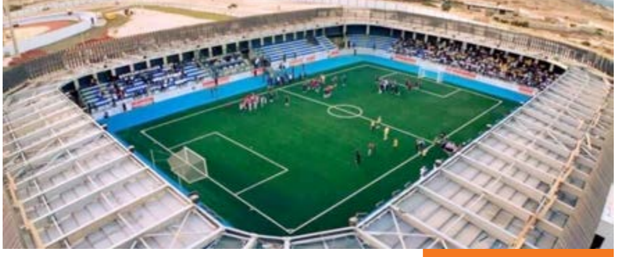
• ملعب بدرنة للميني فوتبول

المنتخب التي ستشارك في البطولة الأفريقية حيث جرى تقسيمها إلى أربعة مستويات وفقا لنتائجها في الكؤوس الثلاثة الأفريقية السابقة. وقد جاء المنتخب الليبي في المستوى الأول إلى جانب منتخبات جنوب أفريقيا وموريتانيا وغانا، بينما ضم المستوى الثاني منتخبات تونس وتشاد وكوت ديفوار ونيجيريا، وضم المستوى الثالث منتخبات بوركينا فاسو والصومال والكاميرون وزامبيا.