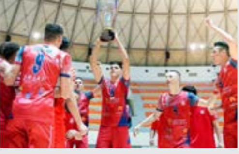
• تتويج السويحلي بكأس ليبيا تحت 21 عاما

لجهود مجلس الإدارة وإدارة الكرة الطائرة في الارتقاء بالرياضة الليبية، ووضع النادي أمام تحد جديد يسعى من خلاله إلى تقديم بطولة استثنائية تليق بسعة الكرة الطائرة الليبية. يذكر أن فريق الكرة الطائرة بنادي السويحلي يعد من أقوى الفرق ليس في ليبيا فحسب، بل على الصعيدين العربي والأفريقي أيضا. وقد حققت فرق نادي السويحلي عديد الإنجازات هذا الموسم، حيث توج فريق السويحلي بلقب بطولة كأس ليبيا تحت 21 عاما بعد تغلبه في المباراة النهائية على الجزيرة بثلاثة أشواط لشوط، كما فاز السويحلي أيضا بلقب بطولة كأس ليبيا تحت 17 عاما بعد تغلبه في النهائي على الجزيرة أيضا بثلاثة أشواط لشوط.