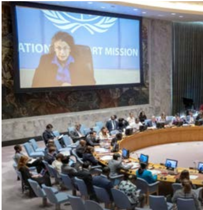
خوري تقدم إحاطتها بشأن ليبيا إلى مجلس الأمن «أرشيفية»

وفي الخامس من يونيو الماضي، أصدرت رئاسة الهيئة التأسيسية لصياغة مشروع الدستور بياناً، طالبت فيه بتنفيذ حكم صادر عن محكمة الزاوية الابتدائية بشأن «حق الشعب الليبي في الاستفتاء على مشروع الدستور»، مؤكدة أنسجام الحكم مع الإعلان الدستوري المؤقت، والأحكام القضائية السابقة التي نصت على حق الشعب الليبي