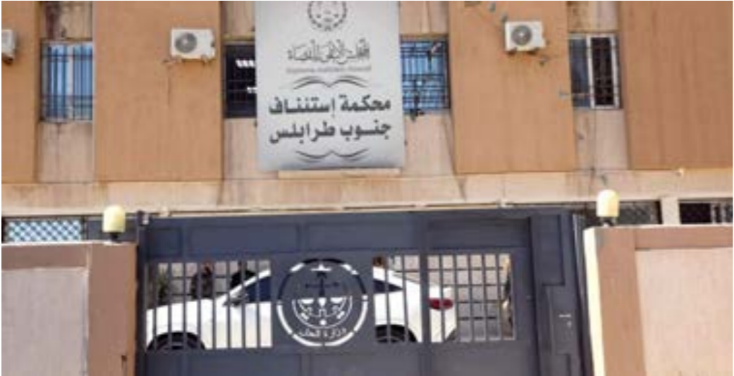
محكمة استئناف جنوب طرابلس حكمت لصالح تكالة