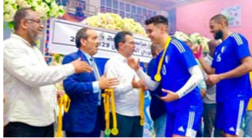
توزيع الميداليات على نجوم كرة اليد بنادي الهلال

توج فريق كرة اليد بنادي الهلال بطلا لمسابقة الدوري الليبي للموسم الرياضي 2023-2024، بينما أحرز فريق الأخضر لقب كأس الاتحاد الليبي بعد تفوقه على فريق النجمة. وقد أسدل الستار على بطولة الدوري في قاعة أحمد موسى بمدينة المرج، وتحديدا بعد نهائيات سداسي التتويج بلبق الدوري الليبي لكرة اليد، بإقامة آخر ثلاث مباريات، أسفرت نتائجها عن تتويج الهلال بلبق البطولة. جاء فوز الهلال بلبق الدوري الليبي لكرة اليد بعدما فاز على الأهلي طرابلس بنتيجة 27-23. كما فاز الأولمبي على الجزيرة بنتيجة 29-27، والاتحاد على النصر بنتيجة 36-27. وفي ضوء نتائج المباريات الثلاث، تصدر الهلال الترتيب النهائي لجدول الدوري الليبي لكرة اليد برصيد 14 نقطة، بعدما حقق الفوز في أربع مباريات وتعادل في مباراة واحدة، وجاء ثانياً الأهلي طرابلس برصيد 11 نقطة، وثالثاً الأولمبي بعشر نقاط، ورابعاً الاتحاد بتسع نقاط، وخامساً الجزيرة بثماني نقاط، وسادساً النصر بثماني نقاط. وشهد الموسم الرياضي المنقضي أحداثاً عدة على صعيد دوري كرة اليد، أبرزها أحداث مباراة