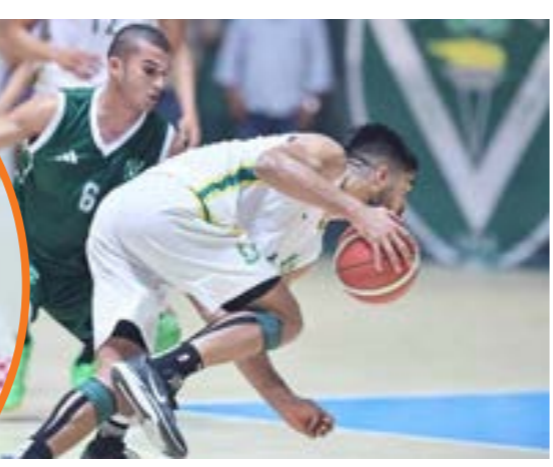
تواصل مسابقة الدوري الليبي الممتاز لكرة السلة في مجمع سليمان الضراب بنغازي، وشهدت أبرز وأهم النتائج تفوق الأهلي طرابلس على النصر بنتيجة 113-96، والاتحاد على الهلال بنتيجة 100-81، والأهلي بنغازي على المدينة بنتيجة 81-78، ضمن سباعي دوري التنويع. وتعد كرة السلة من أعرق الرياضات الشعبية في ليبيا، وتحظى بشعبية كبيرة بين مختلف الفئات العمرية. وقد شهدت اللعبة تاريخاً حافلاً بالإجازات على المستوى المحلي والإقليمي، حيث تمكنت الفرق الليبية من تحقيق العديد من البطولات والكؤوس. كما برزت خلال العقود الماضية أسماء لامعة من لاعبي كرة السلة الليبية، أسهموا في تحقيق إنجازات مميزة للمنتخب الوطني. كما تألقت أندية ليبية مثل الأهلي بنغازي والاتحاد والأهلي طرابلس في مختلف البطولات العربية والأفريقية، وحققَت نتائج مشرفة رفعت من شأن كرة السلة الليبية. وأخيراً، حصل الأهلي بنغازي على المركز الثاني في بطولة الدوري الأفريقي لكرة السلة «BAL»، بعدما فقد نتيجة المباراة

النهائية التي خاضها أمام فريق بترو دي لواندا الأنغولي بنتيجة 107-94. وتعد بطولة الدوري الأفريقي لكرة السلة البطولة «BAL» قوية جداً ومتعددة المراحل، ولا يشارك فيها إلا ممثل واحد من كل دولة، الذي يكون بطل الدوري فيها. والرحلة تبدأ بتصفيات المناطق، ثم تصفيات النخبة من خلال تقسيم الفرق إلى مجموعات، وأخيراً النهائيات التي تضم أفضل ثمانية فرق، لتحديد البطل. وتحاصر كرة السلة الليبية مجموعة من التحديات في ظل قلة الإمكانيات المادية ونقص الدعم الرسمي، إلا أن هناك بوادر إيجابية تشير إلى عودة كرة السلة الليبية إلى الواجهة بقوة، حيث يبذل الاتحاد الليبي لكرة السلة جهوداً كبيرة لإعادة إحياء هذه الرياضة من خلال تنظيم مختلف البطولات والدورات، وتشجيع إنشاء فرق جديدة، وتطوير البنية التحتية. كما يجري التركيز على الاهتمام بالناشئين، واكتشاف المواهب الشابة، من أجل بناء منتخبات وطنية قوية وقادرة على المنافسة على المستوى الدولي.