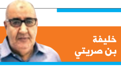
خليفة بن صرتي

الليبية بأنها المالك الروحي لمنتخب ليبيا، موجهاً الشكر للجماهير على كل لحظة من دعمها الأمامي. كما ما يوسعها لتحويل أحلام الجميع بالذهاب إلى كأس العالم إلى حقيقة، وأضاف أن المنتخب الليبي ليس لديه ما يخسره، ولكن هناك الكثير ليكسبه من أجل ليبيا. وأكد المدير الفني المنتخب الليبي أنه يدرك تماماً أهمية الفترة المقبلة، ويركز على أن يكون خادماً لليبيا، ومطالب المؤيدين الحقيقيين للمنتخب الليبي بتجاهل الشائعات المستمرة التي تطول المنتخب الليبي، والحملة الإعلامية التي لديها نيات لإزعاج الانسجام المطبق الحالي بين الجهاز الفني واللاعبين، وكذلك إدارة الفريق التي عينها رئيس اتحاد الكرة ومكتبه التنفيذي والأمين العام وموظفوه. وشدد «ميتشو» على أنه منذ بداية عمله تربطه علاقة مهنية قوية ومحترمة مع الجميع من دون أي تحذل. وقال إنه كمدير من