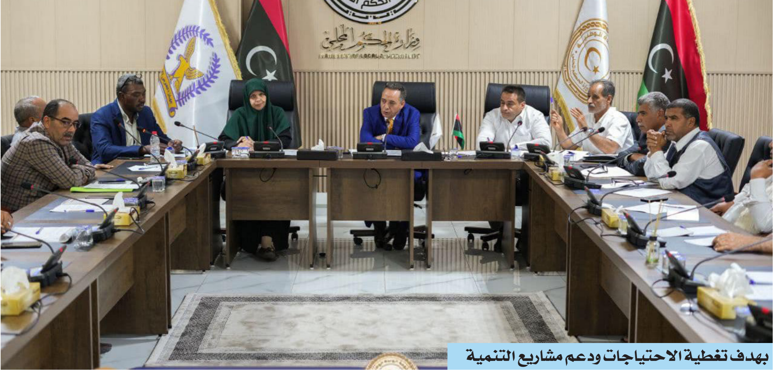
بهدف تغطية الاحتياجات ودعم مشاريع التنمية