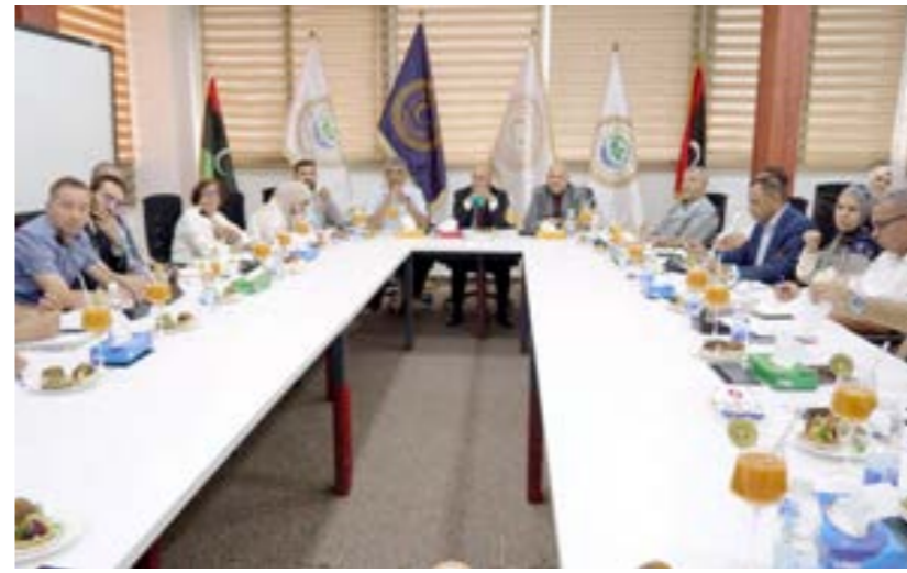
اجتماع مسؤولي 3 وزارات بحكومة الوحدة مع فريق خبراء فاو، طرابلس 12 يونيو

وقالت وزارة الحكم المحلي عبر صفحتها على «فيسبوك»، إن الاجتماع جرت خلاله «مناقشة مشروع التعاون الفني في اتجاه إعداد استراتيجية الأمن الغذائي بليبيا»، مشيرة إلى أن زيارة فريق خبراء «فاو» ليبيا تأتي تنفيذاً لبرنامج مشروع الدعم الفني المقدم من المنظمة بالتعاون والتنسيق مع وزارة الزراعة والثروة الحيوانية، ومجلس التطوير الاقتصادي والاجتماعي. واستمع فريق خبراء ومستشاري «فاو» خلال الاجتماع، إلى مداخلات عمداء البلديات الحاضرين حول أهم التحديات والصعوبات التي تواجه البلديات في مجال جودة المحاصيل الزراعية وبرنامج المواشي، حيث استعرضوا أمور عدة، أهمها تسويق المنتجات، خاصة الحبوب،