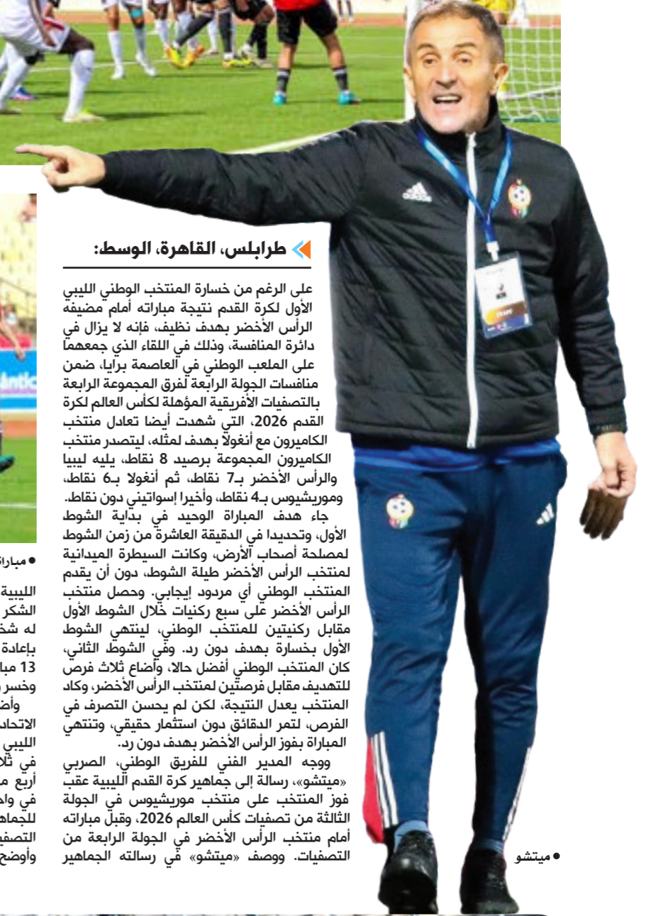
طرابلس، القاهرة، الوسط:

على الرغم من خسارة المنتخب الوطني الليبي الأول لكرة القدم نتيجة مباراته أمام مضيفه الرأس الأخضر بهدف نظيف، فإنه لا يزال في دائرة المنافسة، وذلك في اللقاء الذي جمعهما على الملعب الوطني في العاصمة نواكشوط، ضمن منافسات الجولة الرابعة لفرق المجموعة الرابعة بالتصفيات الأفريقية المؤهلة لكأس العالم لكرة القدم 2026، التي شهدت أيضاً تعادل منتخب الكاميرون مع أنغولا بهدف لمثله، ليتصدر منتخب الكاميرون المجموعة برصيد 8 نقاط، يليه ليبيا والرأس الأخضر بـ7 نقاط، ثم أنغولا بـ6 نقاط، وموريشيوس بـ4 نقاط، وأخيراً إيسواتيني دون نقاط. جاء هدف المباراة الوحيد في بداية الشوط الأول، وتحديدا في الدقيقة العاشرة من زمن الشوط لصلصة أصحاب الأرض، وكانت السيطرة الميدانية لمنتخب الرأس الأخضر طيلة الشوط، دون أن يقدم المنتخب الوطني أي مردود إيجابي، وحصل منتخب الرأس الأخضر على سبع ركنيات خلال الشوط الأول مقابل ركنتين لمنتخب الوطني، لينتهي الشوط الأول بخسارة بهدف دون رد. وفي الشوط الثاني، كان المنتخب الوطني أفضل حالا، وأضاع ثلاث فرص للهدف مقابل فرصتين لمنتخب الرأس الأخضر، وكاد المنتخب يعزل النتيجة، لكن لم يحسن التصرف في الفرص لتمر القاطن دون استثمار حقيقي، وتنتهي المباراة بفوز الرأس الأخضر بهدف دون رد. ووجه المدير الفني للفريق الوطني، المصري «ميتشو»، رسالة إلى جماهير كرة القدم الليبية عقب فوز المنتخب على منتخب موريشيوس في الجولة الثالثة من تصفيات كأس العالم 2026، وقبل مباراته أمام منتخب الرأس الأخضر في الجولة الرابعة من التصفيات. ووصف «ميتشو» في رسالته الجماهير