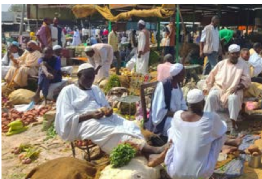
• بانجو خضار في سوق بمدينة القطار بشرق السودان

حدود»، ميشيل لاشاريت، إنه «أمر مشين أن تقوم قوات الدعم السريع بإطلاق النار داخل المستشفى». ودعا لاشاريت «الأطراف المتحاربة إلى وقف الهجمات على مرافق الرعاية الطبية، حيث تضررت المستشفيات في الفاشر، وأغلقت أبوابها. المرافق المتبقية ليست مهية لاستقبال أعداد كبيرة من الضحايا». ويوم الجمعة، دانت الولايات المتحدة الهجوم الذي شنته «قوات الدعم السريع» على قرية في وسط السودان، وأسفر عن مقتل أكثر من 100 مدني، مطالباً بحماسة مرتكبي هذا الهجوم المروع، واستئناف محادثات وقف إطلاق النار. وقال الناطق باسم وزارة الخارجية الأميركية، ماثيو ميلر، إن بلاده «تدين الهجمات المروعة التي شنتها قوات الدعم السريع على المدنيين العزل في قرية ود النورة» بولاية الجزيرة وسط السودان قبل يومين. وشدد ميلر على أنه «يجب على قوات الدعم السريع والقوات المسلحة السودانية ضمان حماية المدنيين، ومحاسبة أي شخص في صفوفهما مسؤول عن جرائم حرب أو انتهاكات لإعلان جدة». من جهتها، قالت المديرية التنفيذية لمنظمة الأمم المتحدة للطفولة (يونيسيف)، كارثرين راسل، إن الهجوم على «ود النورة» أودى بحياة 35 طفلاً وخلف 20 جرحياً على الأقل، مضيفة أن هذه الأرقام لا تزال أولية.