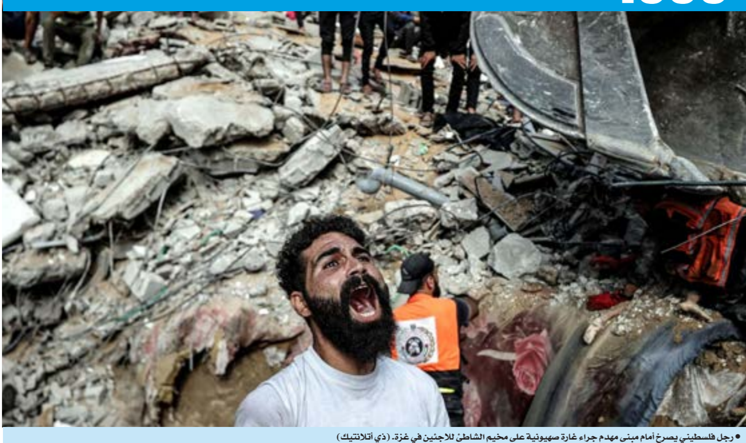
رجل فلسطيني يصرخ أمام مبنى مهدم جراء غارة صهيونية على مخيم الشاطئ للاجئين في غزة.