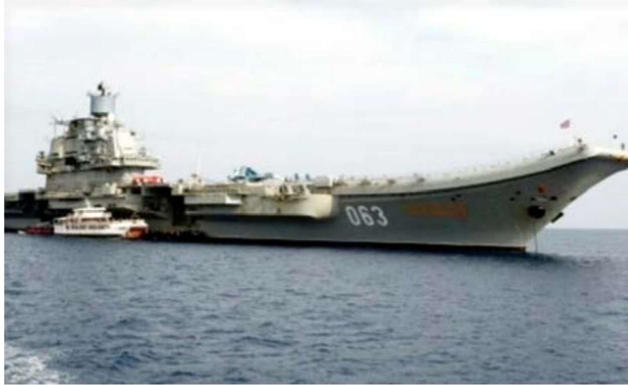
حاملة طائرات روسية في شرق البحر المتوسط

في شرق المتوسط ونتيجة لذلك، يشير الكاتب إلى عزم موسكو