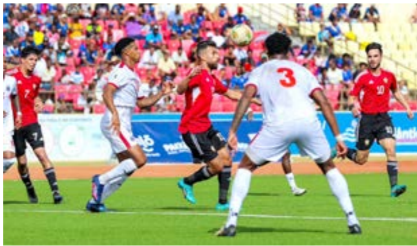
مباراة المنتخب الليبي أمام الرأس الأخضر في تصفيات مونديال 2026

أما المنتخب المغربي فجاء على رأس المجموعة الخامسة مع زامبيا والكونغو وتنزانيا والنيجر وإريتريا، وضعت المجموعة السابعة الجزائر والصومال مع منتخبات غينيا وأوغندا وموريشيوس وبوتسوانا، والمنتخب التونسي جاء في المجموعة الثامنة مع غينيا الاستوائية وناميبيا والأردن وليبيريا وسالوتومي. وتمتلك المنتخبات العربية والأفريقية فرصة ذهبية في التصفيات، حيث تتنافس على ستة مقاعد في مونديال أميركا الشمالية للمرة الأولى، وتمتلك المنتخبات صاحبة التصنيف الأول (مصر والمغرب والجزائر وتونس) الحظوظ الأكبر من تصد مجموعاتهما، والتأهل مباشرة إلى المونديال. ويفرض ألق تحاول السودان وليبيا وموريتانيا المنافسة على المركز الأول، أو الثاني على أقل تقدير في محاولة لدخول الملحق المؤهل لكأس العالم.