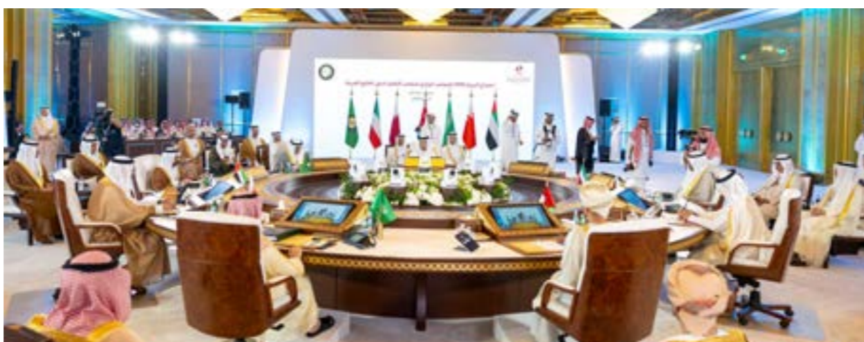
(وكالة الأنباء القطرية)

وصدر القرار الأول من مجلس الأمن بشأن احتجاز السفن قبالة ساحل ليبيا في أكتوبر 2015، وبمقتل القرار الجديد تمديداً للتقييد الأصلي. ويعد الاتحاد الأوروبي المنظمة الإقليمية الوحيدة التي تنفذ التقييد عبر عملياته المعروفة باسم «إيريني».