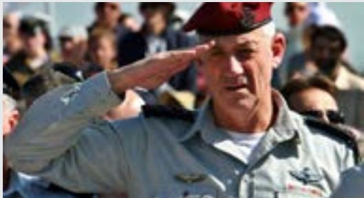
• بيني غانتس