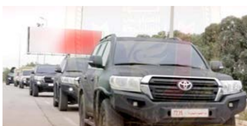
مركبات تابعة لقوة العمليات المشتركة