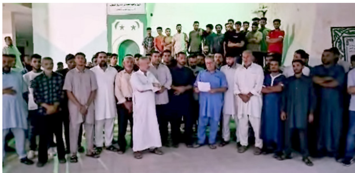
عدد من أهالي زاوية المحجوب خلال وقفة احتجاجية، 10 يونيو 2024