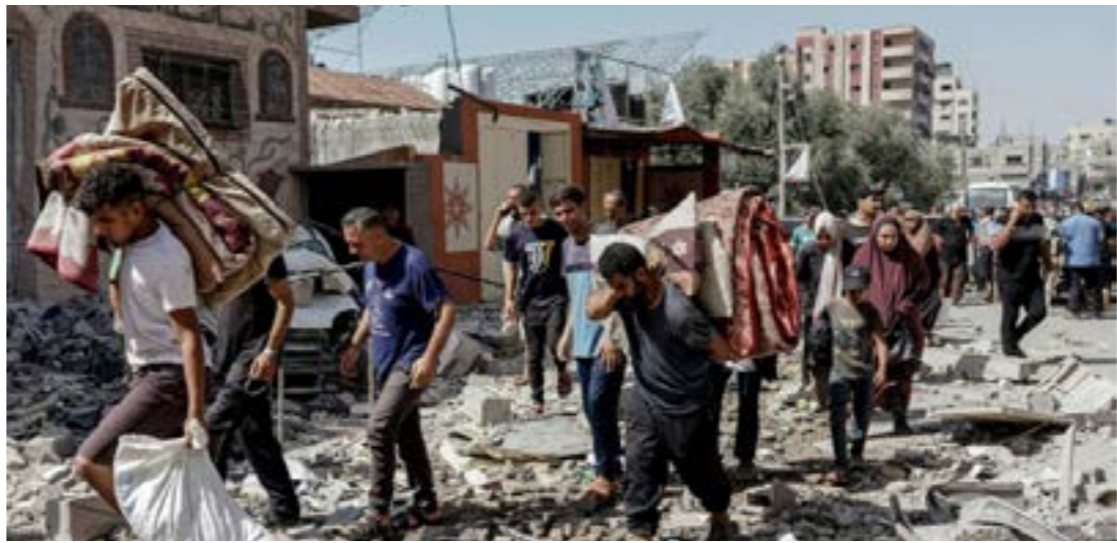
• فلسطينيون يغادرون أماكن إقامتهم بعد عملية نفذتها قوات تابعة للاحتلال في مخيم النصيرات وسط غزة

وتحدثت الجريدة عن تشكيل «خلية اندماج» بشكل سري، حيث يتبادل مسؤولو الاستخبارات الأميركية والإسرائيلية ومحللون عسكريون صوراً من طائرات مسيرة تحلق فوق غزة ومن الأقمار الصناعية بشأن مواقع الرهائن المحتملة.