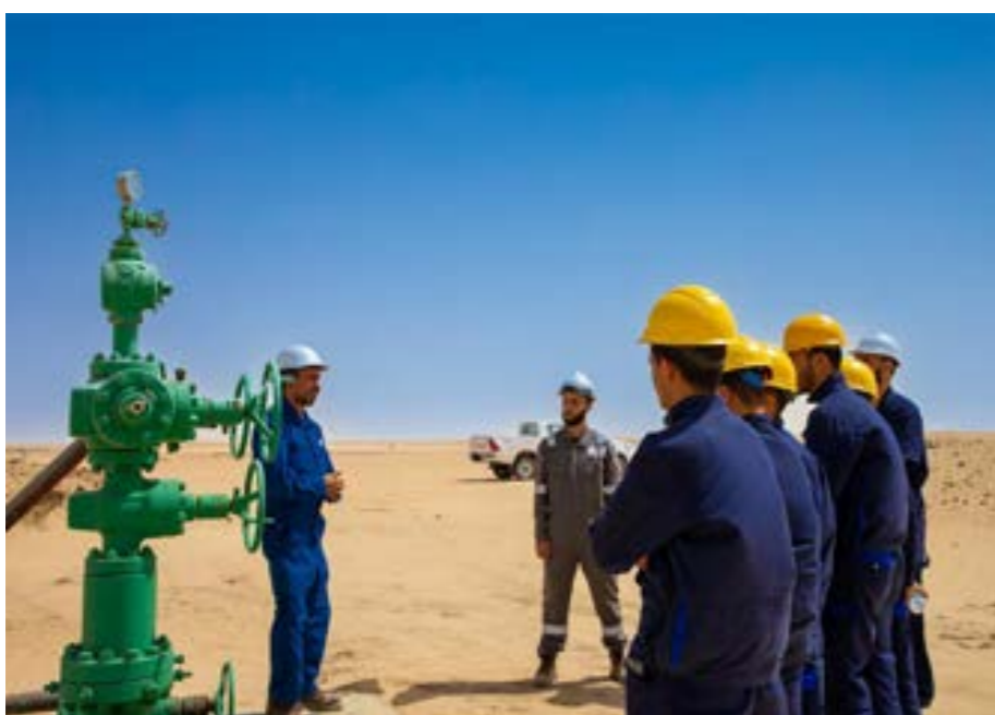
• طلاب بمعهد النفط في حقل آمال النفطي