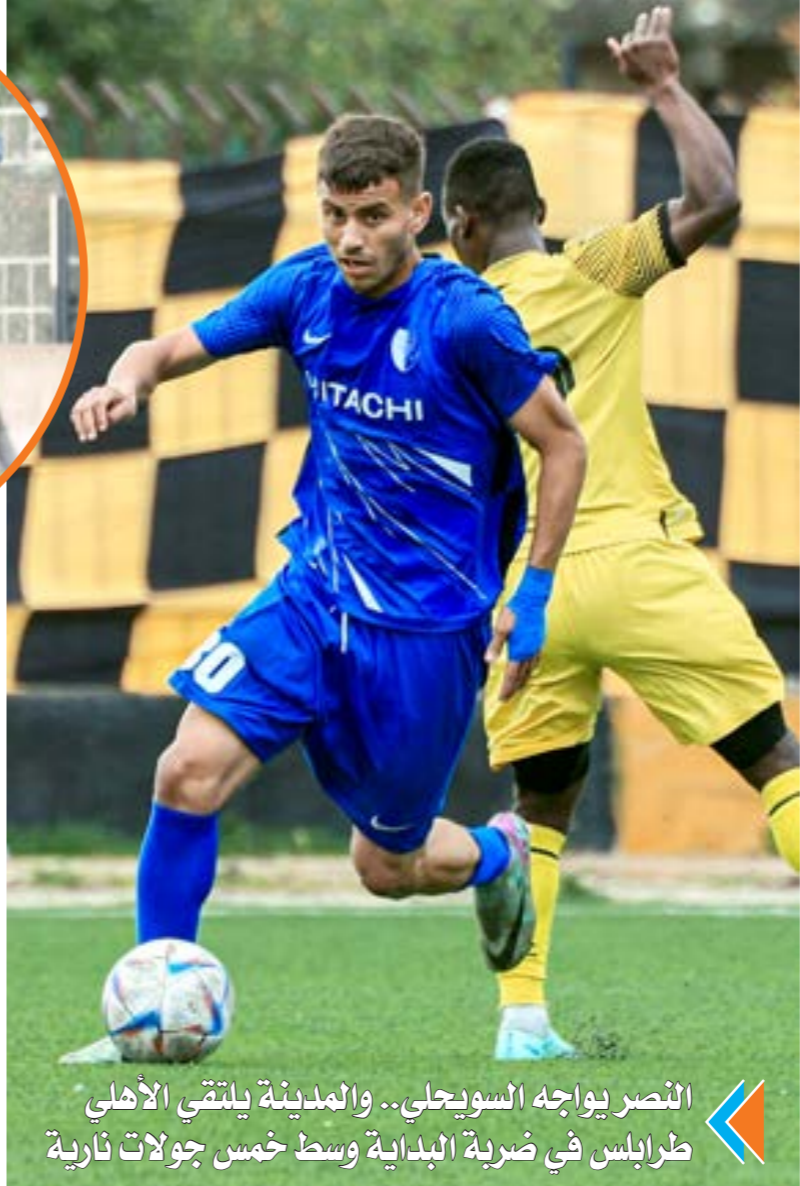
الأخضر في منافسات المجموعة الأولى

يلتقي، السبت المقبل، فريقا الهلال والأخضر على ملعب مدينة المرج، لتحديد البطولة الثالثة المشاركة في دوري التنويع السداسي لكرة القدم للموسم 2023-2024. وقد عُقد في مقر اتحاد الكرة اجتماع مع الفرق المتأهلة لدوري التنويع السداسي: الأهلي طرابلس والمدينة والسويحي والأهلي بنغازي والنصر والهلال والأخضر، دون أن تحسم البطولة الثالثة في المجموعة الأولى، لذا حضر الاجتماع فريقا الهلال والأخضر الذي ستقام بينهما مباراة لتحديد البطولة الثالثة في المجموعة الأولى يوم 15 يونيو الحالي بملعب مدينة المرج. وقبل إجراء مراسم قرعة الدوري السداسي، أكد رئيس الاتحاد الليبي لكرة القدم، عبدالحكيم الشلماني، ضرورة توفير الدعم خلال 48 ساعة، لإجراء الجولات والتشويرات. وبعد اجتماع ساعات عدة، جرى اختيار الملاعب الإيطالية لإقامة الدوري السداسي عليها في 25 يونيو الحالي، شريطة وجود دعم مالي للأندية، بما في ذلك توفير الإقامة والجورنال خلال 48 ساعة. وجاءت قرعة الدوري السداسي على النحو التالي: الجولة الأولى: النصر يلتقي السويحي، والأهلي بنغازي يقابل صاحب البطولة الثالثة في المجموعة الأولى، والمدينة يواجه الأهلي طرابلس. الجولة الثانية: النصر يلتقي الأهلي بنغازي، والسويحي يواجه الأهلي طرابلس، ويقابل صاحب البطولة الثالثة في المجموعة الأولى المدينة. الجولة الثالثة: النصر يلتقي الأهلي طرابلس، والأهلي بنغازي يقابل المدينة، والسويحي يواجه صاحب البطولة الثالثة في المجموعة الأولى. وفي المجموعة الأولى، والأهلي بنغازي يقابل السويحي. الجولة الأخيرة: النصر يلتقي صاحب البطولة الثالثة في المجموعة الأولى، والمدينة يقابل السويحي، والأهلي طرابلس يواجه الأهلي بنغازي.