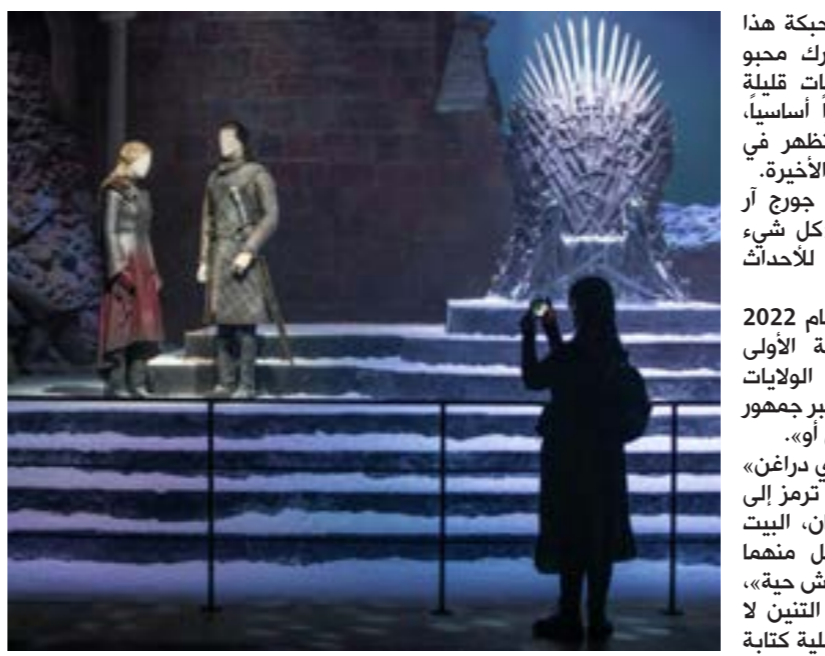
• غايم أوف ثرونز، في أحد استوديوهات إيرلندا الشمالية

إيغون (تاي تيننت). وبينما بقيت حبكة هذا الموسم الثاني طي الكتمان، أدرك محبو هذا المسلسل، من خلال مقتطفات قليلة متداولة، أن النساء سيؤديان دوراً أساسياً، شأنهن شأن التنانين التي لم تظهر في «غايم أوف ثرونز» إلا في المواسم الأخيرة. وأوضح مبتكر هذا الكون الكاتب جورج آر آر مارتن في فيديو ترويجي أن «كل شيء أصبح أكبر، وثمة أماكن إضافية» للأحداث والمعارك. وحقق الموسم الأول الذي وُفّر العام 2022 نجاحاً جماهيرياً. واجتذبت الحلقة الأولى حوالي عشرة ملايين مشاهد في الولايات المتحدة خلال عرضها الأول، وهو أكبر جمهور لمسلسل أصلي في تاريخ «إتش بي أو». وأشار مارتن إلى أن «هاوس أوف ذي دراغن» يمكن أن يعد بمعنى ما «استعارة ترمز إلى القوة النووية، ثمة قوتان عظيمتان، البيت الأسود والبيت الأخضر، ولدى كل منهما تانين. لكن هذه التانين هي وحوش حية»، وأضاف أن «مجرد ركوب الإنسان التانين لا يعني أنه يتحكم به»، وأفيد بأن عملية كتابة الموسم الثالث بدأت منذ الآن.