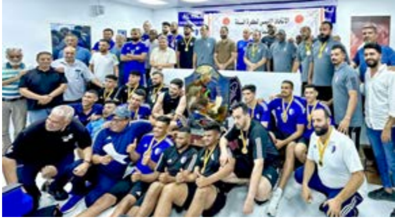
الهلال يحتفل بدور دوري اليد بعد ماراثون نهائيات سداسي التتويج

السوبر بين الأهلي طرابلس والأولمبي، وصور قرار من لجنة مسابقات كرة اليد اعتمدت فيه نتيجة كأس السوبر بفوز الأولمبي على الأهلي طرابلس بنتيجة 27-29. وفي المادة الثانية من القرار، تقرر حرمان فريق الأهلي طرابلس