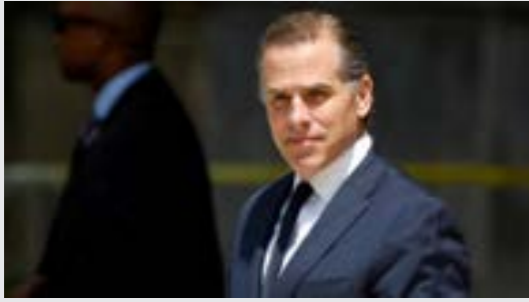
• هانتر بايدن