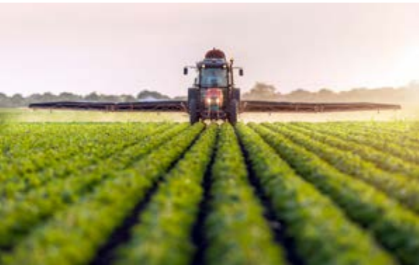
قطاع الزراعة يتراجع في ليبيا

الهيئات الدولية حذرت ليبيا من الانقراض إلى تنوع العوردين لاستيراد الغذاء، مما يرجح أن يجعل البلاد عرضة لخطر احتمال وقوع صدمات ببلد المنشأ، وانتقاعات في ممرات النقل الرئيسية.