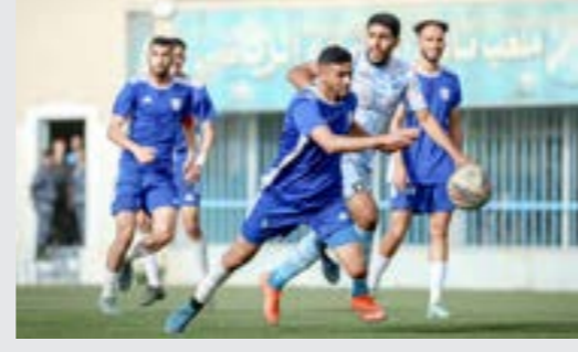
مباراة أبي الأشهر أمام الترسانة في دوري الدرجة الأولى

الأخيرة، ليحافظ أبي الأشهر على الرغم من تعادله على صدارة المجموعة برصيد 34 نقطة، وأقرب الملاحين له الترسانة 33 نقطة، وثالثا المجد 30 نقطة، وابعاء الجزيرة 29 نقطة، وخامسا رفیق 25 نقطة، وجاء سادسا المحلة 25 نقطة، وسابعاً النصر زيتين 21 نقطة، وثامنا الشروق 19 نقطة، وتاسعا الشط 18 نقطة، وعاشرا الوحدة 16 نقطة، والحادي عشر الأهلي المصري 14 نقطة، والثاني عشر العروبة 13 نقطة، وفي باقي النتائج، جرت أربع مباريات ضمن منافسات الأسبوع الحادي عشر لفريق المجموعة الثالثة، انتهت بفوز البرانس على السد بنتيجة 1-2، وتعادل الهلال طررق مع الأناصر 2-2، وتعادل نجوم أجديا مع اللبة سلبيا 0-0.