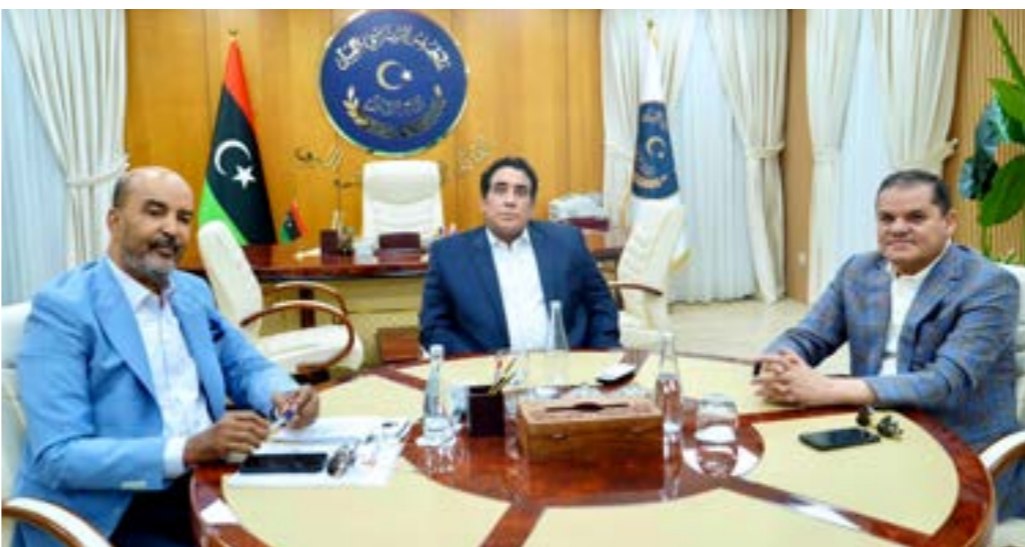
المنتضي خلال اجتماعه مع الديبية والكوني، طرابلس، 11 يونيو 2024

الداعم لدولة ليبيا والمجلس السياسي وقرارات مجلس الأمن ذات الصلة.