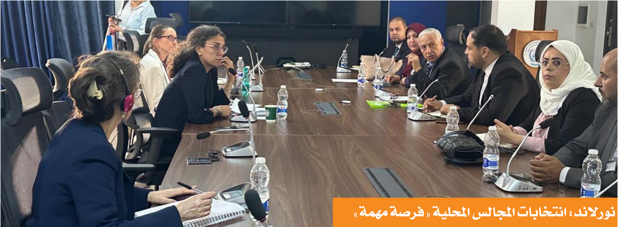
نورلاند: انتخابات المجالس المحلية «فرصة مهمة»