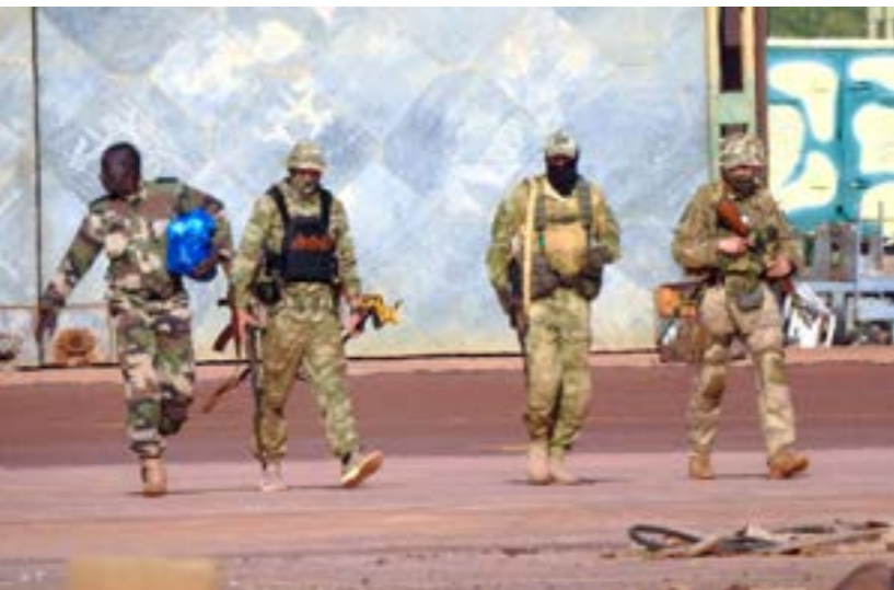
عناصر فاغنر في ليبيا

يشترون الوقود الروسي الخاضع للعقوبات ثم تجري إعادة تصديره