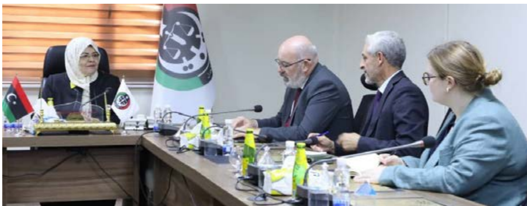
● من اجتماع وزيرة العدل في حكومة الوحدة الوطنية الموقّعة مع السفير البريطاني لدى ليبيا

يأتي ذلك في وقت تتحدث فيه تقارير حول أن روسيا تسعى إلى نشر مشروع «الفيلق الأفريقي» في مجموعة دول أفريقية، منها ليبيا ومالي وبوركينا فاسو والنيجر، ليكون بديلاً لمجموعة «فاغنر».