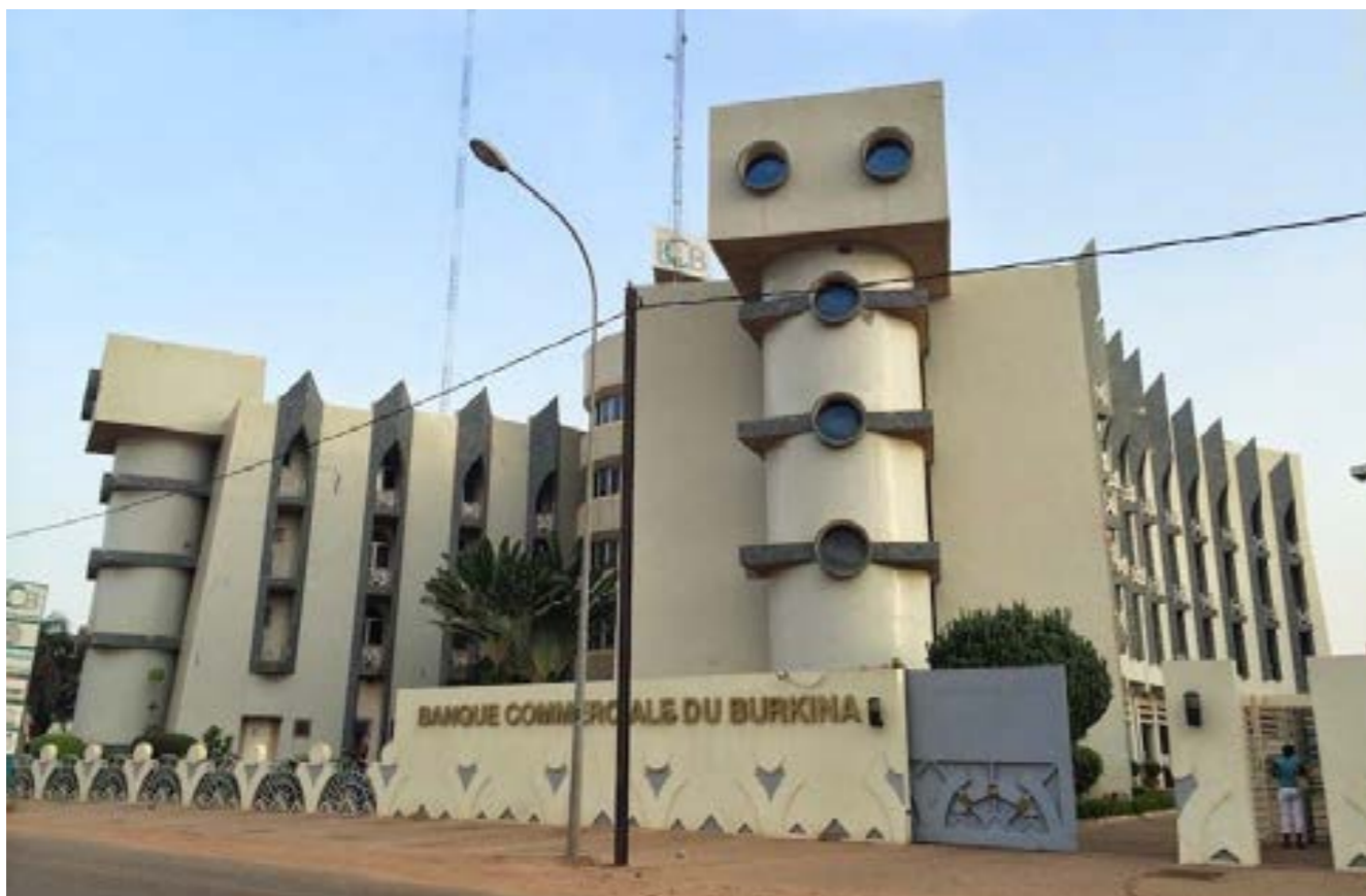
المصرف العربي الليبي للتجارة والتنمية في بوركيينا فاسو

وتابع أن الإجراءات التي قام بها الجانب البوركيني: «تعد انتهاكاً صريحاً لنصوص الاتفاقية المبرمة بين الطرفين»، وأيضاً تعليمات اللجنة المصرفية لدول غرب أفريقيا.