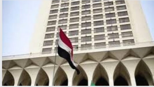
مقر وزارة الخارجية المصرية في القاهرة