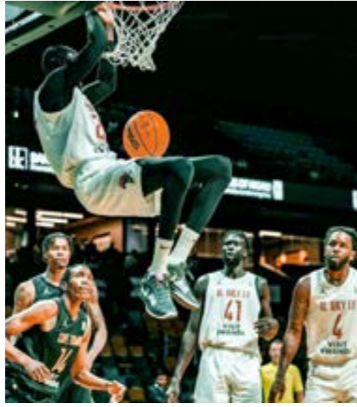
• مباراة الأهلي بنغازي وكيب تاون تايجرز الجنوب أفريقي

76 - 87، بعد مباراة مثيرة تأرجحت نتيجتها حتى تمكن ممثل السلة الليبية من حسم اللقاء لمصلحته. في الفترة الأولى من اللقاء تمكن فريق كيب تاون تايجرز من الفوز 25 - 21. وفي الفترة الثانية، بدأ الأهلي بنغازي بتدراك أخطائه، وسرعاً تمكن من تعويض فارق النقاط والدراك التعادل، ثم التقدم 32-40 قبل دقائق على نهاية الفترة الثانية، ثم إنهاء الفترة الثانية والشوط الأول متقدماً بنتيجة 41-74. وبدأ فريق كيب تاون تايجرز الشوط الثاني من المباراة بشكل قوي للغاية، وضغط بشكل كبير كي يتدارك فارق النقاط الذي يفصله عن الأهلي بنغازي، وبالفعل تمكن من تضيق الفارق لنقطة واحدة، لكن مرور الوقت تمكن الأهلي بنغازي من التعامل بذكاء مع ضغط الفريق الجنوب أفريقي، واستعاد زمام المبادرة من جديد، لينتهي الفترة الرابعة بنتيجة 72 - 58. ومع انطلاق الفترة الرابعة (الأخيرة) من زمن المباراة بدأ واضحاً أن فريق كيب تاون تايجرز يلعب بتسرع كبير، رغبة منه في تدارك موقعه، والعودة في النتيجة بأسرع ما يمكن. وفي المقابل، لعب الأهلي بنغازي بهدوء وثقة، وتمكن من تتابع الكرة بشكل سليم، وإحراز نقاط سهلة، لتنتهي المباراة بفوز الأهلي