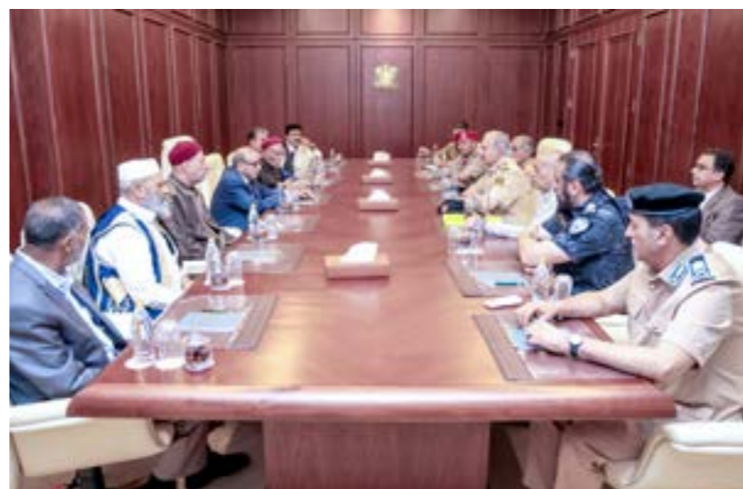
حزيريلتقي مشايخ قبيلة الدرسة، الرحمة 27 مايو 2024

أيضا أصدر رئيس مجلس النواب عقيلة صالح، الإثنين، توجيهات بتكثيف التحري والبحث عن النائب المختفي إبراهيم أبو بكر درسي إلى لجنتي الدفاع والأمن القومي والشؤون الداخلية بالمجلس،