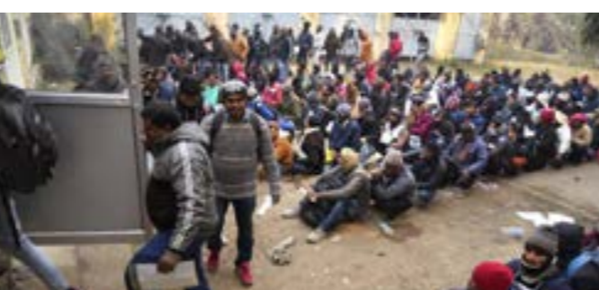
هنود أثناء تقديم طلبات للعمل بالأراضي الفلسطينية التي تحتلها إسرائيل

نيودلهي-وكالات بينما كانت الهند العام 1947 من أوائل الدولة المعارضة لتقسيم فلسطين في الجمعية العامة للأمم المتحدة، وصوت بذلك وكانت أول دولة غير عربية تعترف بمنظمة التحرير الفلسطينية ممثلا وحيدا وشرعا للشعب الفلسطيني في 1974، ثم اعترافها في 1988 ببولة فلسطين، إلا أنها ساءت من تنفيذ عملية «طوفان الأقصى»، التي شنتها المقاومة الفلسطينية ضد مواقع الاحتلال في 7 أكتوبر الماضي. سارعت الحكومة الهندية إلى إعلان تأييد الاحتلال، وكان رئيس الوزراء الهندي، ناريندرا مودي، من أوائل زعماء العالم الذين أدانوا هذا الهجوم، وهو موقف تبناه كندا وزير الخارجية الهندي سورامانيام جيهانكار. دعم هندي للاحتلال وتمشيا مع موقف الدعم غير المشروط لإسرائيل، امتنعت الهند عن التصويت لمصلحة وقف إنساني لإطلاق النار في غزة بالأمر المتخذة في 27 أكتوبر الماضي. وسحمت السلطات الهندية بالتظاهرات الداعمة لإسرائيل في مختلف أنحاء البلاد في مقابل قمعها الاحتجاجات الداعمة للفلسطينيين، وبرغم اشتداد الحرب، زادت أعداد العمالة الهندية التي تصدق إسرائيل، خاصة في قطاع البناء، بعد أن تسببت الحرب وتعبئة كثير من جنود الاحتياط الإسرائيليين، والغاء تصاريح العمل لأكثر من 130 ألف عامل فلسطيني. وتحت مكاتب التوظيف الإسرائيلية حاليا عن عشرة آلاف عامل بناء على الأقل، برواتب شهرية تصل إلى 140 ألف روبية (نحو 1688 دولارا)، بينما يحظى هذا البرنامج بدعم السلطات الهندية. طرد عمال فلسطين لمصلحة الهنود جريدة «هارتس» الإسرائيلية بدورها قالت: «ملايين الهنود يحملون بالظفر بتأشيرة عمل في إسرائيل بفضل التحالف الوثيق بين رئيس حكومتهم ناريندرا مودي ورئيس الوزراء الإسرائيلي بنيامين نتانياهو»، لكن ذلك على حساب القوات اليومية لعشرات آلاف العمال الفلسطينيين