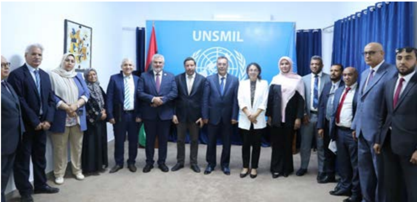
ستيفاني خوري بمقر البعثة الأممية مع قادة ومنسقي أحزاب وكتل سياسية ليبية، طرابلس 28 مايو 2024

وفي محاولة لربط كل هذه المعطيات أفصحت مصادر قريبة من يسومون بأطراف الأزمة لـ«الوسط»، بأن سيناريو تشكيل حكومة جديدة هو الآن قيد الاكتمال بقيادة البعثة الأممية، ودعم غربي على رأسه الطرف الأميركي، على أن تكون حكومة مصغرة مهمتها الأولى تهيئة البلاد لإجراء الانتخابات في أقرب أجل.