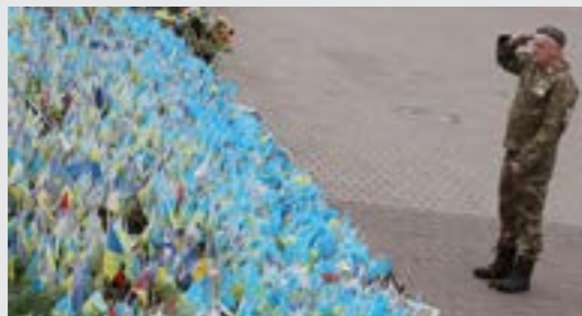
ضابط أوكراني يؤدي التحية أمام نصب في ساحة الاستقلال بكيف