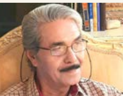
بقلم: البوميري عبدالله

ولم يكن فيما بين المدينة والبحر سور، وكانت سفن الروم شارعة في مرسلها إلى بيوتهم، ووجدوا مسلكا لها من الموضع الذي غاص عن البحر ففعلوا حتى أتوا من ناحية الكنيسة وكبورا، فلم يكن مفرغ للروم إلا سفنهم، وأبصر عمرو وأصحابه الثلثة في جوف المدينة، فأقبل بجيشه حتى دخل عليهم، فلم تغلت الروم إلا بما خف لهم من مراكبهم، وغنم عمرو ما كان بالمدينة».