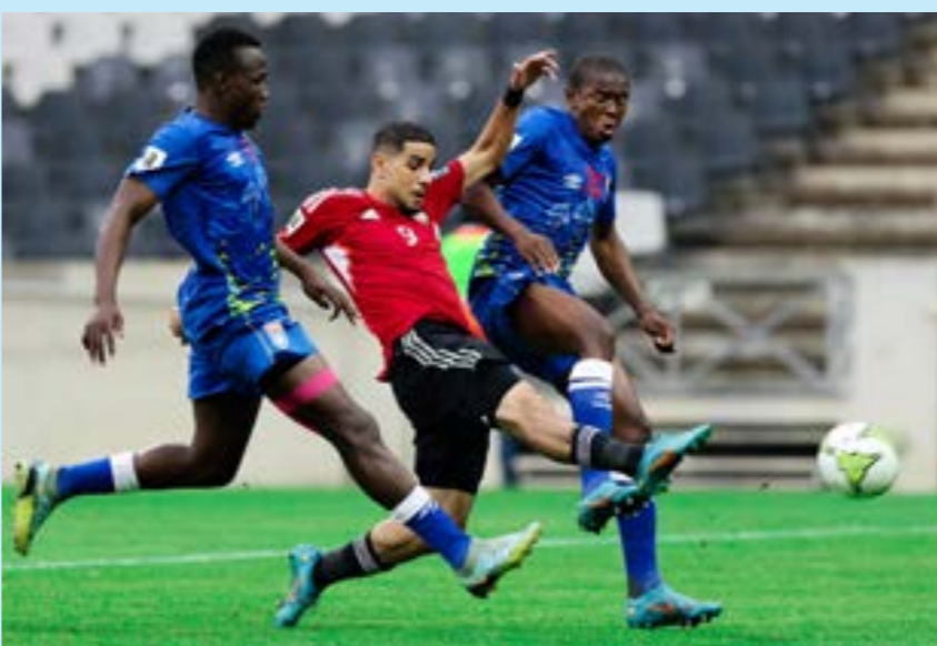
• مباراة منتخب ليبيا وإسواتيني بتصفيات كأس العالم