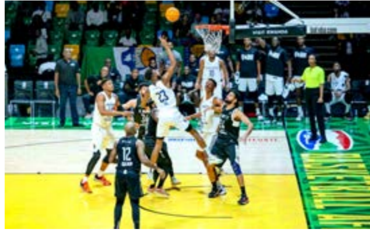
• مباراة الأهلي بنغازي وريفرز هوبرز النيجيري

من تأكيد تفوقه وتقدم في النتيجة، ليحسم نتيجة المباراة لمصلحته 89 - 83. جاء تأهل سلة الأهلي بنغازي بعدما تمكن من التقدم بثبات وثقة خلال نهائيات الدوري الأفريقي