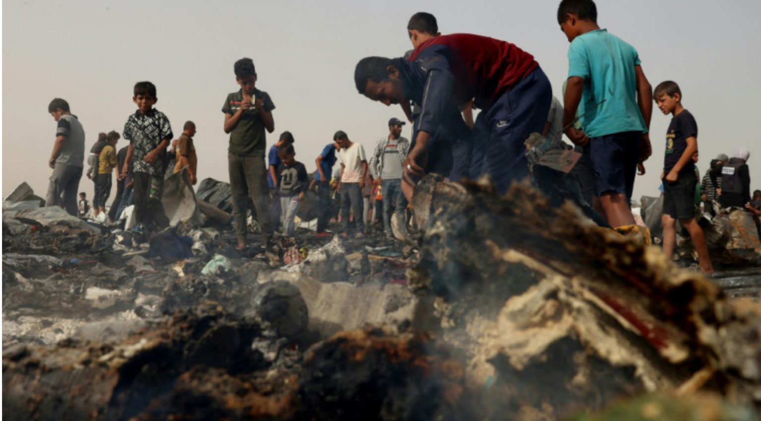
فلسطينيون يتفقدون أضرار مخيم النازحين الذي قصفته قوات الاحتلال الإسرائيلي في رفح.