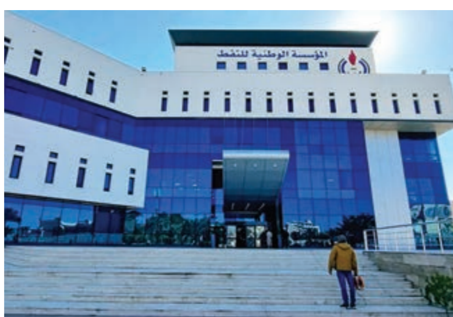
مقر المؤسسة الوطنية للنفط في طرابلس

واطلعت «الوسط» على مذكرة رئيس المؤسسة فرحات بن قدارة، دعا فيها إلى التفاوض مع الشركتين للوصول إلى ما وصفه بـ«حل مرضية للطرفين تضمن تنفيذ برنامج تطوير الشركة بأسرع وقت ممكن»، لكن المذكرة نفسها تكشف عن حقائق لا تثير العجلة التي يدعو إليها بن قدارة لتغيير اتفاقات عقود الامتياز والمشاركة التي سوف تنتهي في فترة تتراوح بين 12 إلى 16 عاماً.