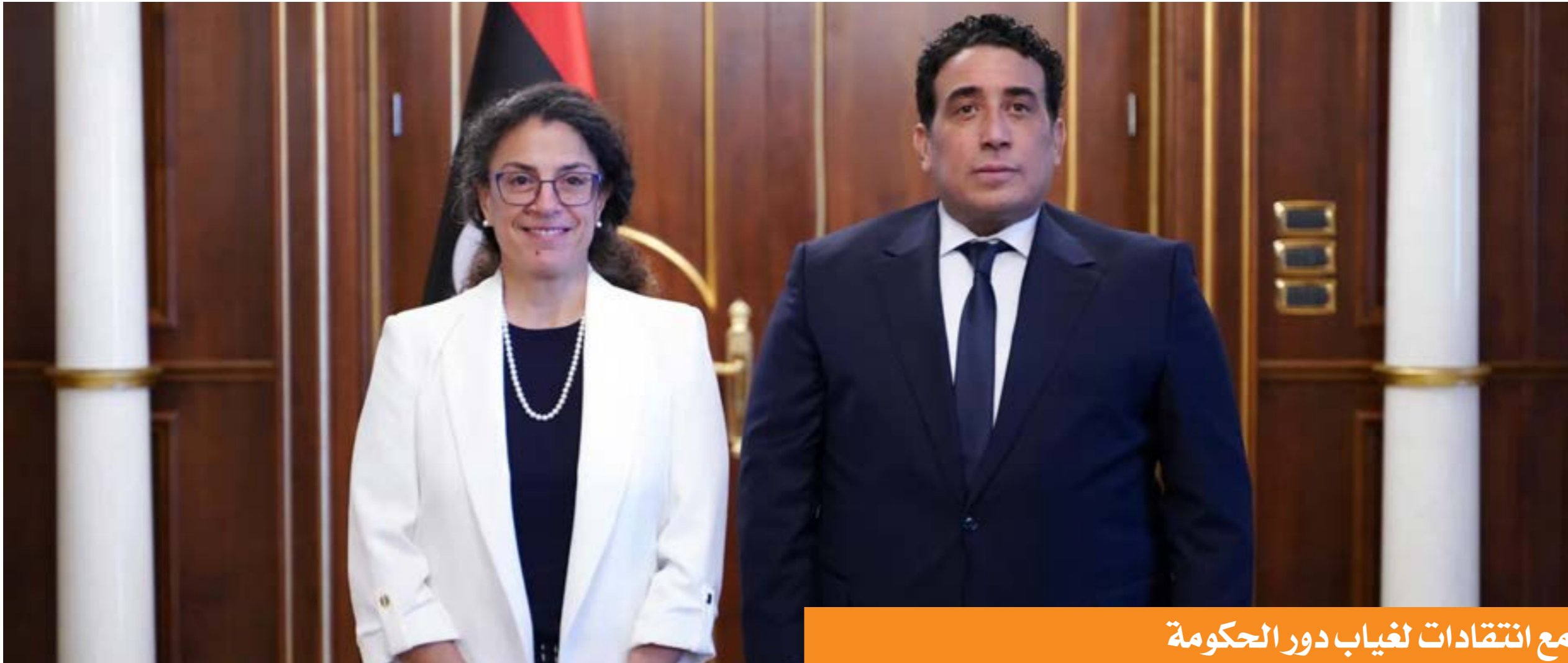
مع انتقادات لغياب دور الحكومة