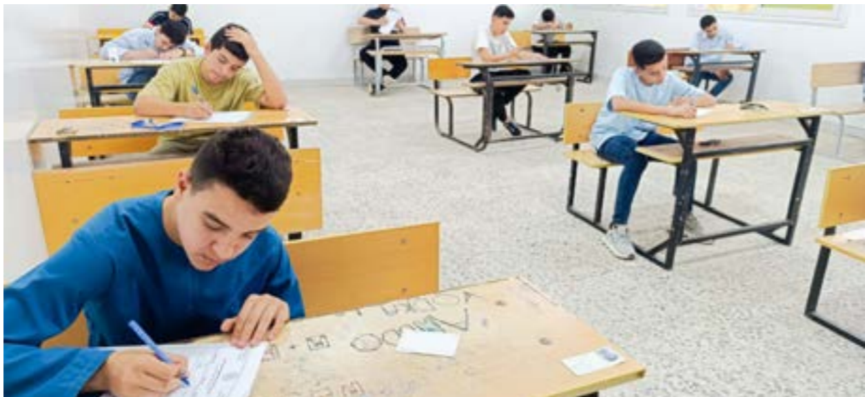
جانب من امتحانات شهادة إتمام التعليم الأساسي، وزارة التعليم،