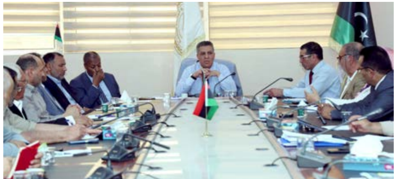
المقريف يترأس اجتماع اللجنة العليا لمراقبة الامتحانات، طرابلس، 21 مايو 2024

إتمام مرحلة التعليم الأساسي، وأحلتهم على التحقيق الإداري. وأشار إلى أن القرار ضم خمسة رؤساء لجان إشراف، و13 مراقبا بلجان الإشراف، وخمسة متابعي لجان، وملاحظين؛ وذلك لتصويرهم في أداء واجبه في ضبط حالات غش إلكتروني بلجانهم الامتحانية. وظهر الثلاثاء ترأس وزير التربية والتعليم الاجتماع الرابع للجنة العليا للإشراف على امتحانات الشهادات العامة للعام الدراسي 2023-2024، والذي عقد بقاعة الاجتماعات بدوان الوزارة.