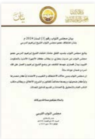
بيان مجلس النواب بشأن اختفاء الدرسي