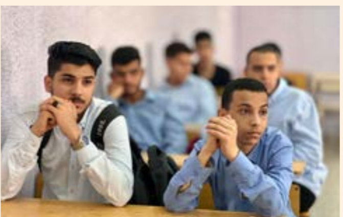
طلاب الثانوية يحددون جدول امتحاناتهم بأنفسهم «أرشيقة»

التعليم الأساسي. مدير المركز الوطني لامتحانات السيد أحمد أعلن الثلاثاء، وفق 3 مقترحات منصة «حكومتنا»، عن طرح مقررته لجدول امتحانات شهادة إتمام التعليم الثانوي للعام الدراسي 2023-2024 خلال 24 ساعة، وذلك لأخذ آراء المعلمين وقياسها.