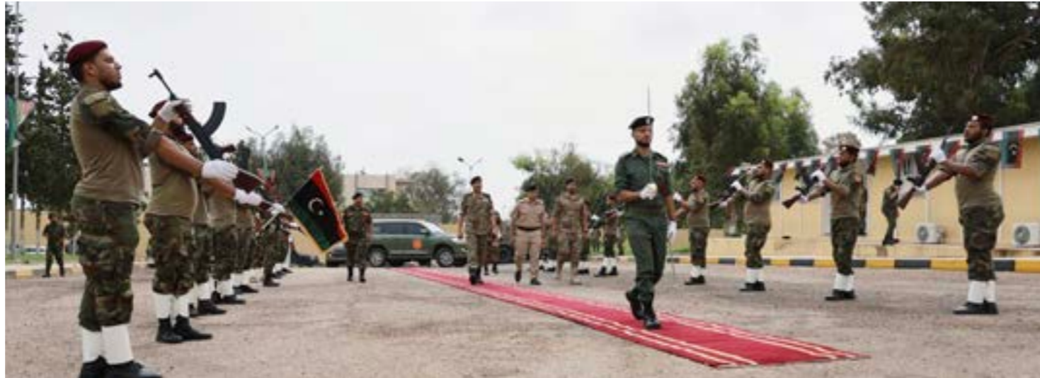
● رئيس أركان الجيش الليبي الفريق أول محمد الحداد في زيارة الكتبية «38 مشاة»

ترفض المشاركة في هذا التكتل لعدة أسباب، فهم يعتبرون أن الولايات المتحدة تحاول الزج بهم في معركة ليست معركتهم، في وقت يعتبرون أن سياسة واشنطن ساهمت في الفراغ الأمني الليبي وأنه لولا دعمها للانقسام السياسي في ليبيا لما كان هناك تواجد روسي. كما أن الحليف التركي غير متوافق مع الأميركيين بخصوص الهجوم على أي قواعد تتواجد فيها الروس، لا سيما عقب الاتفاق الذي رعاه الرئيسان التركي والروسي والذي قاد لوقف إطلاق النار، وأي تحرك قد يسبب انهيارا للاتفاق. ويعتقد مراقبون أن الولايات المتحدة سوف تحاول الزج ببعض الكتائب التي لها توجه ديني، وهو تكرار لسيناريو لما حدث في أفغانستان عندما دعمت واشنطن متطرفين خرجوا من البلاد.