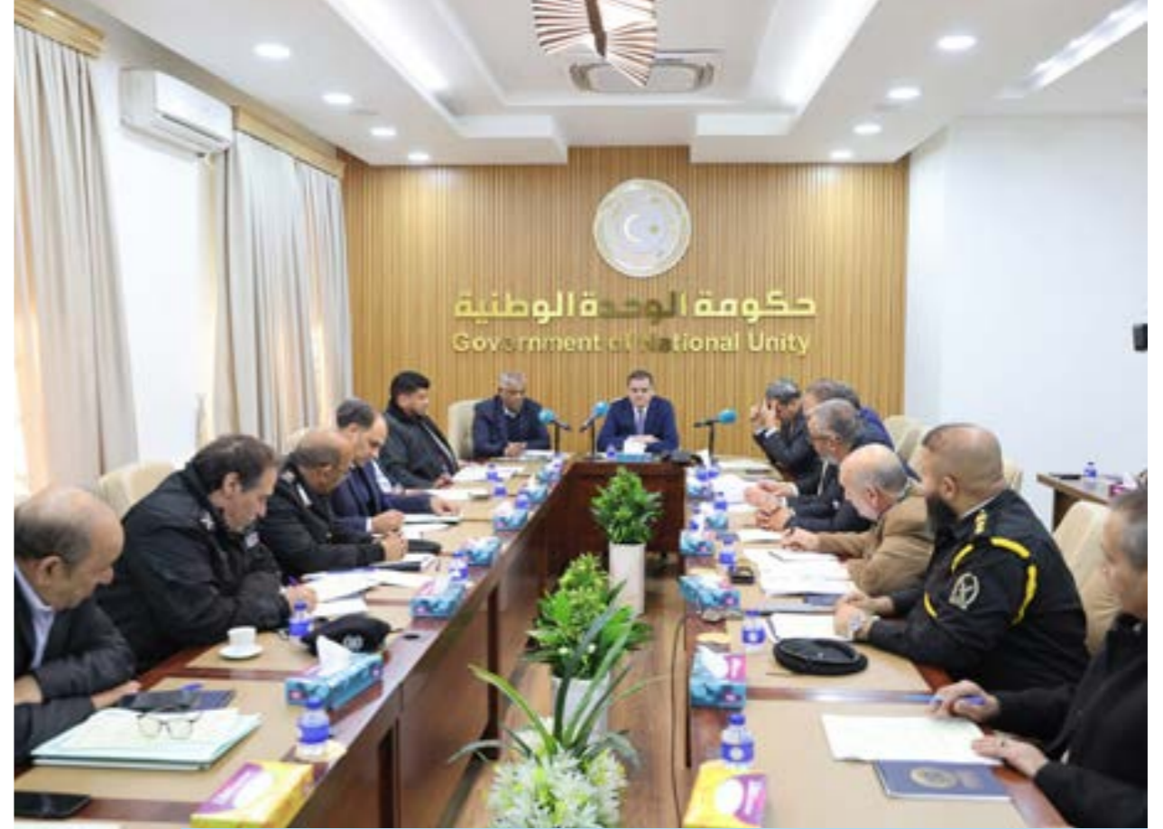
مع بدء حصاد القمح والشعير..