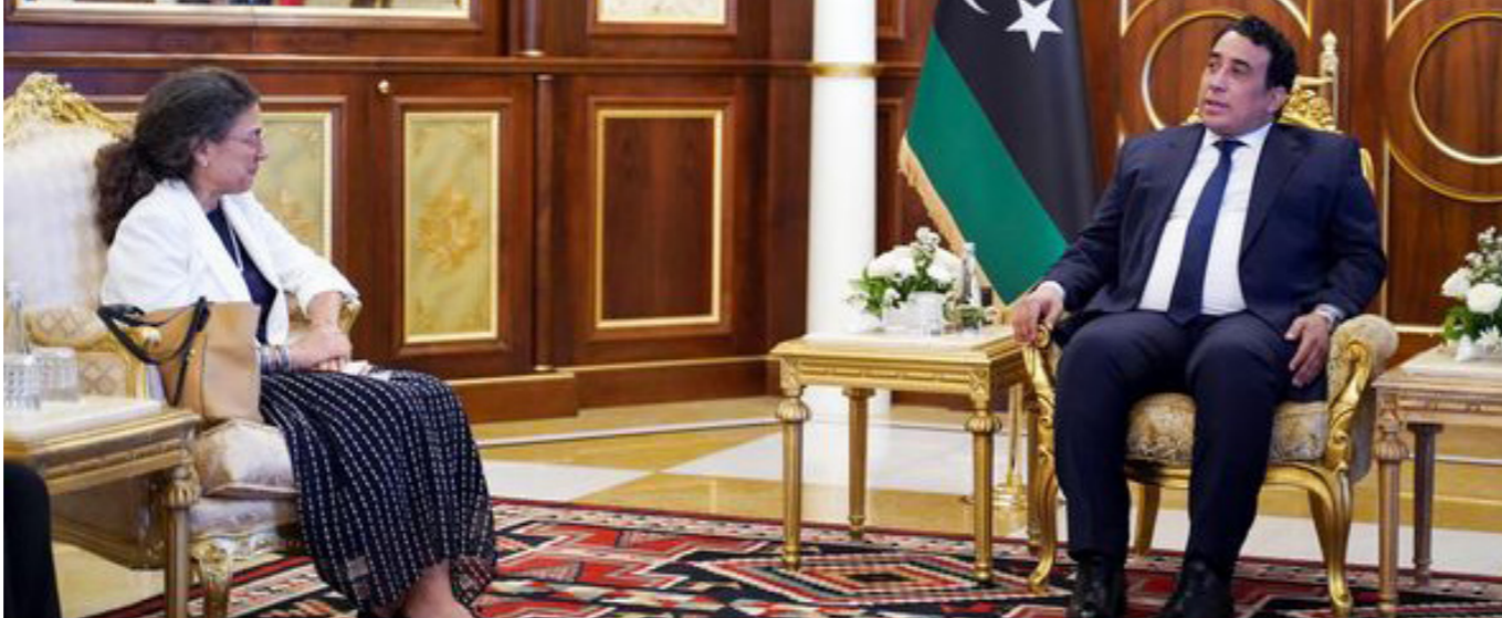
محمد المنفي مع ستيفاني خوري بالمجلس الرئاسي، طرابلس 22 مايو 2024

كل هذا يدلل مجدداً على حالة المراهقة التي تعيشها الأزمة الليبية، وينبئ بان مهمة الأميركية ستيفاني خوري، أو مهمة الثانية كما يسميها البعض، لن تنجح من أسر هذه المراهقة طالما لا خيار أمامها سوى التعامل مع الأدوات نفسها المتسببة في هذه الحالة.