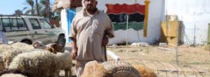
سوق لبيع الأغنام في ليبيا، أرشيقة.

فقد أوضح أن الطلب على المواشي يزداد بشكل ملحوظ خلال عيد الأضحى. وفي ظل محدودية العرض، ارتفعت الأسعار التي تأثرت كذلك بالأوضاع الاقتصادية العامة في البلاد. وأوضح المظهر أن ارتفاع تكاليف الأعلاف والرعاية البيطرية يؤثر بشكل كبير على مربى المواشي، خصوصاً مع تفرّات سعر الصرف خلال العام الجاري بسبب «ضريبة الدولار». وتستهلك ليبيا نحو مليون رأس من الأغنام في عيد الأضحى المبارك، حسب إحصاءات رسمية.