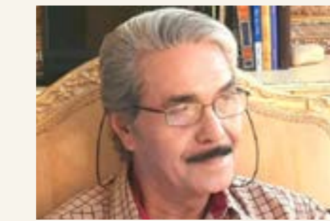
بقلم: البوصيري عبدالله

من الأسمنت، و2.007.000 قنطار من الحديد يتألف من 269.628.000 قنطار، قصب، و3.240.000 قنطار من الأسلاك الشائكة و(263.343.000) متر أي ما يعادل ربع طول محيط خط الاستواء، و225.000 قنطار من مواد البناء بالإضافة إلى مياه لعين المواد. أما القيمة الاجمالية لإنجاز هذا المشروع فقد بلغت (17.737.173.80) سبعة عشر مليوناً وسبعمئة وسبعة وثلاثين ألفاً ومئة وثلاثة وسبعين ألفاً وثمانين سنتيماً. فيما قام بهذا المشروع (2500) عامل فني وعادي، و(1200) رجل مسلح للحماية، و(200) مركبة آلية، و(18) باخرة تفرغ حمولتها في ميناء «بردية». ويتباهى السفاح غراتسياني بمشروع قائلًا: «إن مد الأسلاك الشائكة على طول حدود مصر هو عمل لم يسبق لأي أحد أن قام بهذا المشروع في مدة قصيرة مثلما قامت به قواتنا رغم بعد المسافات ورداءة مسالك المنطقة. لأنها رملية وصحرابية لا ماء فيها ولا شجر». وهكذا تفخر الامبريالية بإنجازاتها القتالية، وتصرف الأموال الطائلة من أجلها، فيما تموت شعوبها جوعاً؛ وصديق أمير الشعراء شوقي إذ قالت: «ما صرُّ لو جعلوا العلاقة في غد بين الشعوب مودة وإخاء»