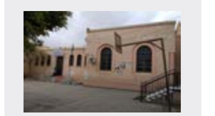
اعتماد مدرسة العنضة الخضراء ضمن معالم طرابلس التاريخية 16 ص