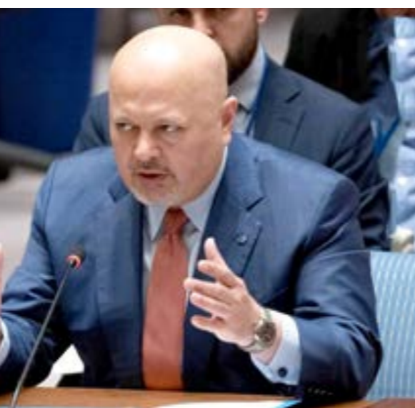
كريم خان يقدم إحاطته لمجلس الأمن الدولي، 14 مايو 2024

معتبراً كلمات الدول الكبرى كاشفةً أجندتها، وكيف ستتعاوى مع المحكمة الجنائية.