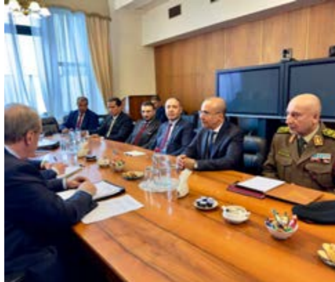
● اللافي والباعور والحداد خلال اجتماعهم مع لافروف، موسكو 13 مايو 2024

على الطيران الليبي والتعاون في إنتاج الطاقة البديلة وأمداداتها، حسب مصادر دبلوماسية. وشهدت واشنطن نشاطاً لتسوية الأحزاب الليبية وعدد من السياسيين الليبيين في محاولة لعب دور لكسر الجمود السياسي الذي تعيشه ليبيا، وهو الفرض الذي استضافهم من أجل معهد الدراسات السياسية المتقدمة بجامعة «جون هوبكنز»، والمجلس الأطلسي في واشنطن لأجل إيجاد أرضية مشتركة لليبيين، مقترناً بخاوف بريطانيا من حصول موسكو إلى ثروة النفط الليبية؛ حيث دعا النائب في البرلمان البريطاني ورئيسة المفوضية الأوروبية أورسولا فون دير لاين، وتصدرت مسألة الهجرة ملفات البحث في لقاءات الطرفين، إلى جانب معالجة الحظر