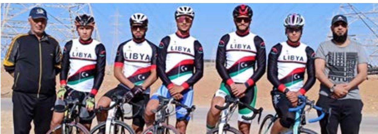
المنتخب الليبي للدراجات

وأضاف الناطق باسم نادي الأهلي بنغازي أنه في أثناء توجه اللاعبين من غرفة الملابس إلى الملعب، لاداء تدريبات الفوغانيين خارج الغرفة، وجرى الاعتداء بشكل مباشر على حارس المرعي