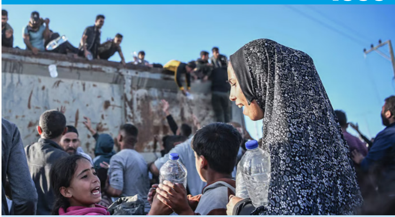
جانب من أزمة مياه الشرب في قطاع غزة