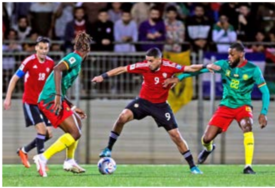
مباراة المنتخب الوطني أمام الكاميرون بتصفيات كأس العالم

ومن غير المستبعد أن يتزايد عدد الأندية المطالبة