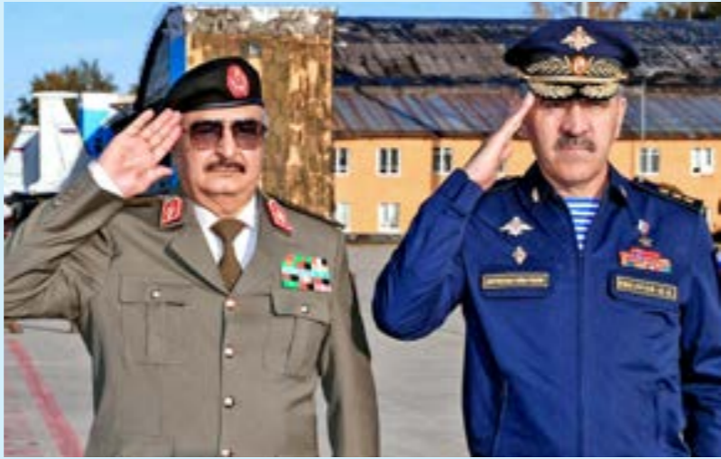
• خليفة حفتر مع نائب وزير الدفاع الروسي يونس بك يفكوروب، موسكو 26 سبتمبر 2023

ويتمثل الهدف الثالث في استخدام حملات التحليل لتعزيز الخطاب المعادي للغرب وأوروبا وروايات اضطهاد «الجنوب العالمي» من قبل الغرب الجماعي، الولايات المتحدة والاتحاد الأوروبي وحلف شمال الأطلسي». أما الهدف الرابع فهو تحديد استراتيجيات الكرملين التي تقوم على المواءمة والشراكة الاستراتيجية مع قوى مثل إيران والصين وكوريا الشمالية. وقالت الباحثة: «عملت روسيا على بناء دمج قوي وفي الجبهة الشرقية لحلف الناتو، وكفكت وجودها في الجبهة الجنوبية بحثا عن الفرص لتعزيز نفوذها السياسي والعسكري. واعتبرت موسكو أن تراجع الولايات المتحدة عن التدخل في سورية، بالعام 2013 حينما استخدمت بشار الأسد الأسلحة الكيميائية، وانسحابها من أفغانستان في 2021، علامة على الضعف وغياب الردع». واعتبرت أن «وجود روسيا ونفوذها في الجناح الجنوبي لحلف الناتو، في ليبيا وشمال أفريقيا جزء من الخطة الكبرى للنسخة الثانية، وهي على غرار الصراع بين بريطانيا ضد روسيا بالقرن التاسع عشر، لكن مع عدد أكبر من اللاعبين، وتدور رحاها بشكل رئيسي في أفريقيا».