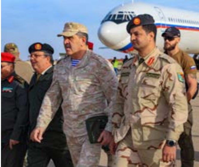
● خالد حفتر يستقبل نائب وزير الدفاع الروسي، بنغازي - أرشييفية - القيادة العامة

ولم يتوقف الجدل الدائر حول تشكيل حكومة جديدة والانتخابات المترتبة، إذ أبدى رئيس المجلس الأعلى للدولة محمد تكتلة رفضه تداول دمج حكومتها الجديدة، وحماد كخزرج من الانسداد السياسي الراهن، وقال في حوار صحفي عبر شبكة «بي بي سي» إن النموذج الحقيقي للحل في ليبيا يمكنه جعلها الدولة الوحيدة، ولبنائها من أي عقد جولة ثانية من جلسات الحوار تجمع محمد المنفي، ورئيس مجلس النواب عقيلة صالح، ومحمد تكتلة في مقر الجامعة العربية بالقاهرة.