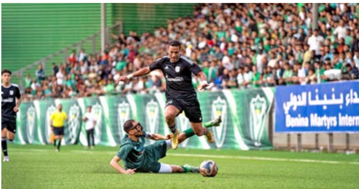
مباراة النصر والتحدي