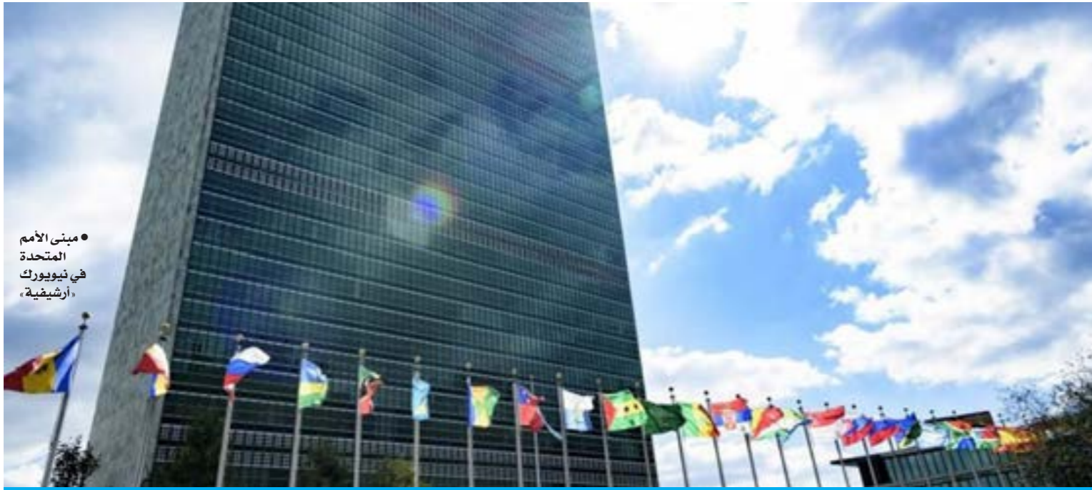
• مبنى الأمم المتحدة في نيويورك، أريشيفيا.

الغويل: مشروع جديد يعتمد على القاعدة الشعبية لإنهاء «المأساة الليبية»