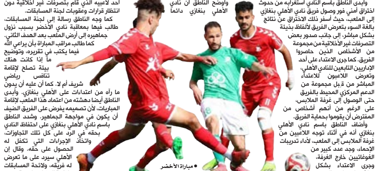
مباراة الأخضر والأهلي بنغازي

تواصل الاستعدادات داخل أروقة الاتحاد الليبي للدراجات لإقامة وتنظيم طواف ليبيا الدولي للدراجات 2024. وفي هذا الإطار، عقد رئيس الاتحاد الليبي للدراجات الدكتور نورالدين التريكي عديد الاجتماعات رفقة فريق العمل الخاص بتنظيم الطواف في عدد من المناطق الليبية التي سير بها الطواف المحدد لإقامته الفترة من 1 إلى 8 يونيو المقبل. كما زار ليبيا خلال الأيام الماضية الحكم الدولي الجزائري محمد عبدالله وبوقرارة الذي كلفه الاتحاد الدولي للعبة بالإشراف ومتابعة طواف ليبيا الدولي للدراجات. وأشار إلى أن اللجنة المنظمة للطواف أعلنت في وقت سابق عن إقامة السباق من عدة مراحل، المرحلة الأولى من بنغازي إلى المرج، والمرحلة الثانية من المرج إلى البيضاء، والمرحلة الثالثة من البيضاء إلى درنة، والمرحلة الرابعة من صبراتة إلى الخمس، والمرحلة الأخيرة فتشغل من طرابلس