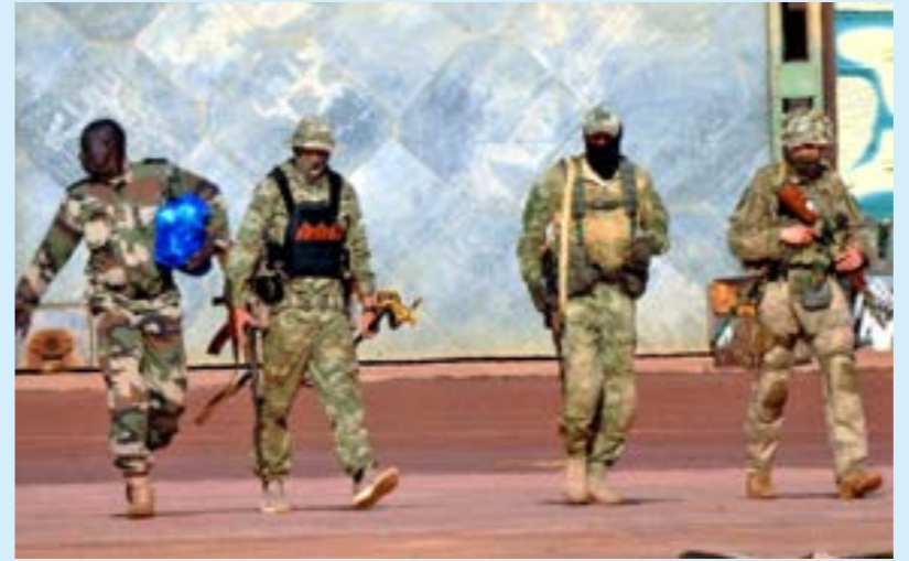
• عناصر من فاغنز ليبيا (أريشيفيا إنترنت)

في ليبيا مع وجود حكومتين متنافستين في شرق وغرب البلاد، وكذلك ظهور أطراف فرعية تعتمد شرعيتها حسب ما وصفه التحليل بـ«الولايات المتحدة»، وهي تشمل القبائل والمجموعات العرقية والجماعات المتطرفة مثل «داعش» و«القاعدة». واعتبر المعهد الإسباني أن الانسحاب التدريجي للولايات المتحدة وفرنسا والاتحاد الأوروبي من أفريقيا بشكل عام أسهم في تعزيز فراغ السلطة، الذي هزعت روسيا إلى استغلاله، تبعها دول مثل الصين وتركيا وقطر. كما تحولت شمال أفريقيا ومنطقة الساحل بشكل تدريجي إلى مسرح جديد للتوترات والمناقشة الجيوسياسية بين القوى العظمى». وقال إن هدف موسكو الأول من التوغل في ليبيا ومنها إلى منطقة الساحل هو معادلة الغرب، وأضاف: «منطقة الساحل ليست أولوية للآمن القومي الروسي، لكنها أولوية في السياسة الخارجية لأنها جزء من خطة لعودة القوى الغربية حيثما كانت». وأضاف: «لا تملك روسيا أي تفضيلات سياسية في منطقة الساحل. فاستراتيجيتها فعالة وهنفا الرئيسي هو التصدي للغرب وتحميد حلف الناتو من فائدة الجناح الجنوبي له. إن أهداف