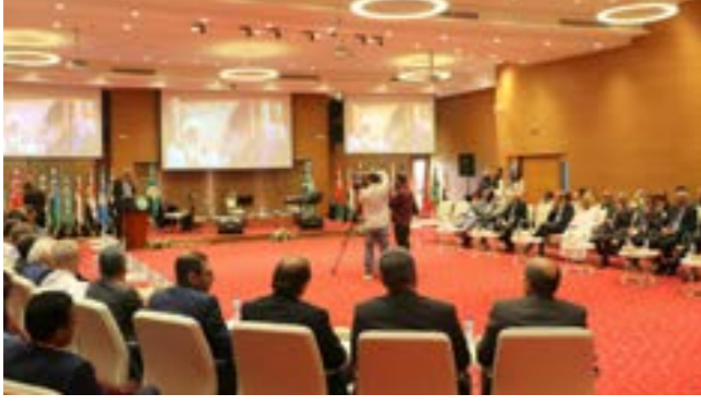
احتفالية تكريم الشاعر الراحل سليمان الباروني

وخصص سعيد حامد فصلاً كاملاً عن أصل التسمية للمدينة وكيف جاء رسم حروفها في كتب الرحالة، مشيراً إلى أن نقطة تحول حاسمة في تاريخ المدينة بعد أن تمكن القائد العربي عمرو بن العاص من فتحها سنة 643 ميلادياً، إذ جاء العرب والمسلمون يشيرون مبادئ الدين الإسلامي واللغة العربية