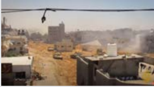
• دبابات إسرائيلية في مرمى نيران عناصر المقاومة الفلسطينية