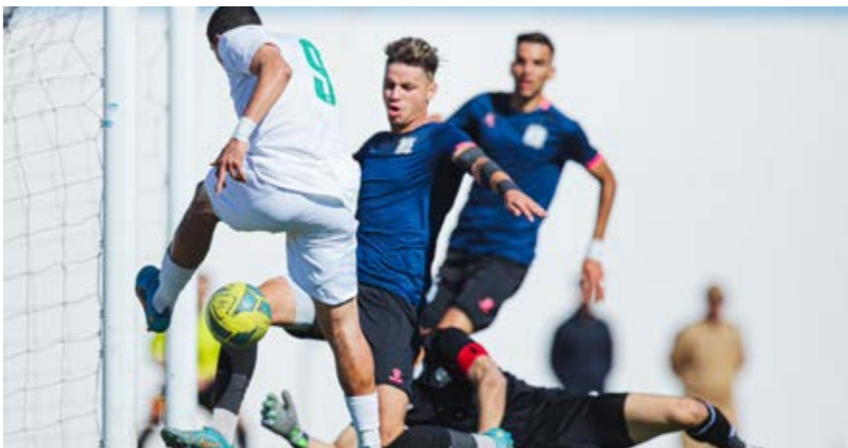
مباراة الأهلي طرابلس وأساريا

طرابلس بالفضل مكانه في سداسي التتويج مبكراً بفترته بالمباراة برصيد 44 نقطة، وهو صيد لن يصل إليه أي فريق آخر، لينحصر التنافس في نقطة، والاتحاد المصري الذي يملك 25 نقطة، وهذه المجموعة على بطاقتين بين فريق المدينة الذي يملك ثلاثين نقطة، والاتحاد صاحب 27 نقطة، والاتحاد المصري الذي يملك 25 نقطة، وعلى الرغم من تعثره في آخر جولتين، فإن