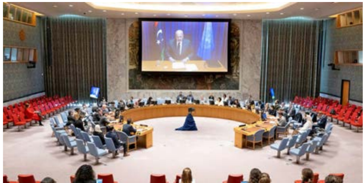
كريم خان في إحاطة بشأن ليبيا أمام مجلس الأمن الدولي، نوفمبر 2022