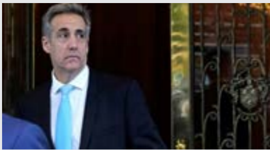
• مايكل كوهين المحامي السابق لدونالد ترامب

ويرى مراقبون أن ميزانية الدفاع الضخمة لروسيا هي الدافع الرئيسي وراء تنصيب شخص ذي خلفية اقتصادية في منصب وزير الدفاع. وقد أكد الكرملين أن «بيلوسوف سيجهل الجيش الروسي أكثر افتخا على الابتكار».