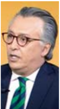
• حافظ الغويل

سياسي وأمني واجتماعي، ممثل في المصالحة الوطنية». كما يستلزم تنفيذها «تفاعل من المجتمع الدولي». وأكمل: «هي متعددة، وبها حلول لكل الإشكاليات، وليست فقط مسألة تأسيس الدولة، كما أنها ليست مبادرة للوصول إلى السلطة كما كان في جنيف وغيرها». رئيس الحزب المدني: لا بد من مسار ديمقراطي يقول الشعب كلمته خلاله بعد الاستفتاء وقال رئيس الحزب المدني الديمقراطي محمد سعد: «لنستعيد الوطن، ونخلص من مظاهر الأزمة الحالية، لا بد من مسار ديمقراطي يقول الشعب كلمته خلاله بعد الاستفتاء على تأنيق يصدرها المؤتمر التأسيسي، أو ما يجمع عليه الليبيون». سعد أكمل في مداخلة مع برنامج «وسط الخبر»: «وتكون هناك شرعية مكتسبة من خلال استفتاء عام، بعد ذلك انتخابات السلطتين التشريعية والتنفيذية، وتبني الدولة من القاعدة، بمعنى أن تكون هناك انتخابات على المستوى المحلي، ونوع من الحكم المحلي الذي ينهي حالة المركزية السياسية والمالية».