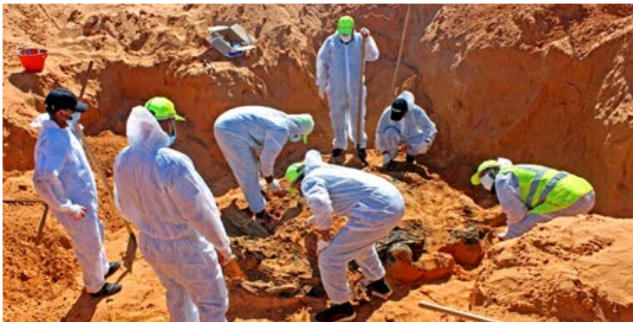
المقابر الجماعية في ترهونة ضمن أولويات المحكمة الدولية، أريضية.

«مدعي» الجنائية الدولية: لا يمكن إعلان تحقيقات المحكمة في الحالة الليبية