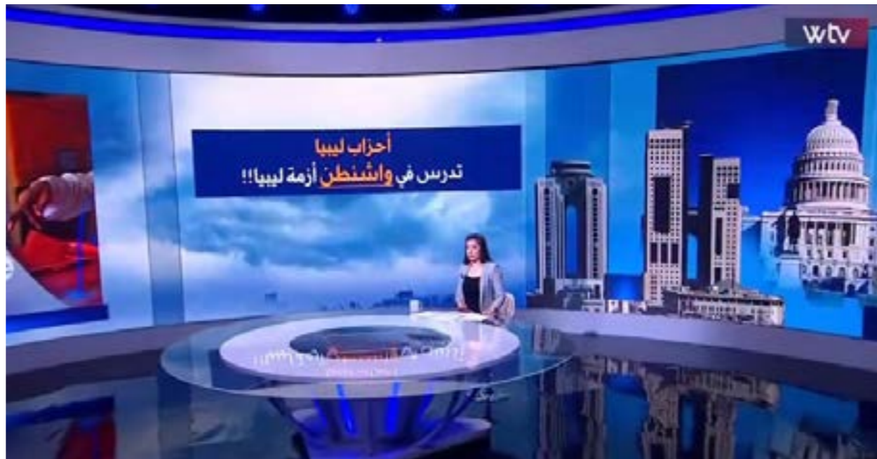
• برنامج «وسط الخبر» على قناة «الوسط»، الإثنين 13 مايو 2024

متى يعلن تعيين المبعوث الأممي الجديد؟ المجموعون تطرقوا إلى تعيين مبعوث أممي جديد، سيعلن قبل نهاية الصيف المقبل، فضلا عن النقاش حول أهمية دور المبعوث الجديد، وضرورة تجديد دماء البعثة لدى ليبيا، وأوضح المصدر أن العمل المكثف سيستمر بين الأمم المتحدة وتنسيقية الأحزاب في الفترة المقبلة، مع استعراض نتائج توافر التنسيقية مع الأطراف المحلية والدولية، مشيرا إلى تلقي وعد بعقد اجتماع آخر مع الوفد الأممي عقب تعيين المبعوث الجديد.