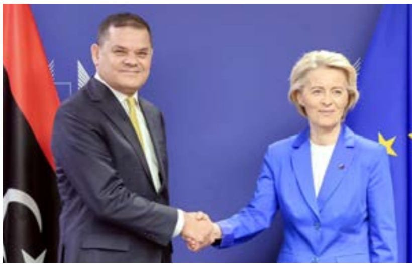
الديبية وفون دير لاين، بروكسل 15 مايو 2024

توصيات التعامل مع ملف الهجرة غير النظامية وخلفت الندوة إلى حزمة من التوصيات، أبرزها الدعوة إلى ضرورة تقديم الخدمات الصحية والتعليمية الأساسية للمهاجرين، وتفعيل الاتفاقيات الدولية التي أبرمتها ليبيا في السابق عبر سن التشريعات التي تضع قواعد للاتفاقيات الدولية لحماية حقوق الإنسان موضع التنفيذ. وأوصت بتشكيل فريق دعم طبي متكامل، لدعم المؤسسات العاملة في مدينة الكفرة من أجل تمكين النازحين من دولة السودان من الاستفادة من الخدمات الصحية، وتسهيل عمل المنظمات الإغاثية العاملة على تقديم الدعم والمساعدات للنازحين.