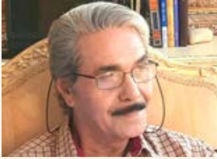
بقلم: البوصيري عبدالله

أما إسبانيا فقد عاجلت هذا الموقف بأربعة أساليب مختلفة، هي: -1- غزو تاجوراء، بيد أن إسبانيا لم تجن شيئاً من محاولاتها هذه سوى القليل من الغنائم التي سلبوها من القبائل المجاورة التي اضطرت تحت استعمال العنف إلى تسليم سلاحها. -2- كانت طرابلس تحت حكم الإسبان أشبه بمملكة بلا رعية، فقد فيها الملك لذة الملك وأبهة الحكم، لذا أصدر نائب الملك في صقلية نداء إلى مواطنيه يعلن فيه «إن الذين يرغبون في السكن بطرابلس سيمنحون مساكن ملائمة وأراضي يزرعونها معفاة من الضرائب والإتاوات لمدة عشر سنوات، بالإضافة إلى العقو الناجز من أي جنابة مدنية أو جريمة قد ارتكبوها»، ولكن أحداً لم يستجب إلى الإعلان بسبب الأتلاق السياسية، والكساد الاقتصادي الذي انتشر خبره بواسطة تجار جنوة والبندقية. -3- اتباع أسلوب المهادنة، حيث أعلن الملك شارل الخامس موافقته على إطلاق سراح الشيخ أبو البركة -انظر المادة- وتعادته إلى بلاده، لاستخدامه في توطيد العلاقات بين المحتلن والأهالي، وتهدئة الحالة، ولقد هدأت الحالة خلال سنة 1520. على أن الأهالي لم يقبلوا فكرة احتلال أراضيهم، فعدوا من جديد إلى محاصرة المدينة بمدخلها الشرقي والغربي، وقطع الطريق أمام السفن المتجهة إلى مينائها، وقد شجعهم على ذلك بداية ظهور الدولة العثمانية في حوض البحر الأبيض المتوسط كقوة إسلامية جديدة. -4- إن فكرة الانسحاب