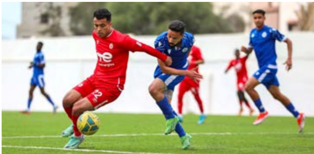
مباراة الاتحاد والأولمبي

من جهته، يملك الخمس 14 نقطة، وهو بحاجة لتسع نقاط للبقاء في «دورينا»، مما يعني حماية الفوز في مبارياته الثلاث الأخيرة أمام أبولسليم والملعب الليبي والأولمبي، إلا أن سبع نقاط فقط قد تكون كافية لبقائه في حالة تعادل الملعب الليبي وأساريا، بل ربما يبقى بجمع ست نقاط في حالة فوز الملعب الليبي على أساريا. أما فريق أساريا، صاحب المركز الأخير برصيد 13 نقطة، فيحتاج إلى تسع نقاط لضمان البقاء، لذا سيصبح مضطراً للفوز في مبارياته الثلاث المتبقية أمام الاتحاد المصري وأبولسليم والملاعب الليبي، كما يمكن أن يبقى في الدوري الممتاز بعد خساره سبع نقاط في حالة تعادل الخمس والملعب الليبي، أو ست نقاط فقط في حالة خسارة البشار مباراتين.