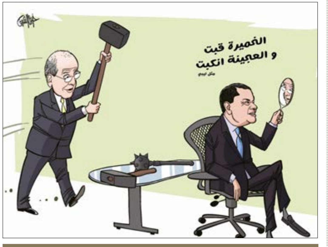
الأميرة كبت والعجينة انكبت م.م.م.م.

2- لؤي فوزي، موقع الجزيرة نت، 11 ديسمبر 2023.