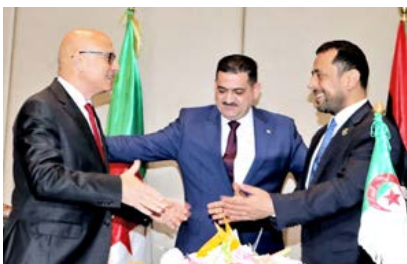
• الاجتماع التشاوري حول آلية تنفيذ اتفاق المياه الجوفية، الجزائر 24 أبريل 2024

الصحراء الدائرية الضخمة التي باتت تلون أراضي شاسعة وتزود أغلبية ولايات البلاد بالبخاراوات والفواكه غير الموسمية على مدار السنة.