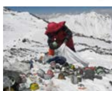
تعاثل حيوانات القطاس (بالأ)، على أن تنقل النفايات المتبقية إلى كاتماندو لإعادة تدويرها.

ويهدف المشروع الذي يُنفذ بالتعاون مع المنظمات المحلية، ولا سيما لجان مكافحة التلوث في ساغرماتا إلى تحويل جزء من المواد البلاستيكية في الموقع إلى أشياء صغيرة أو