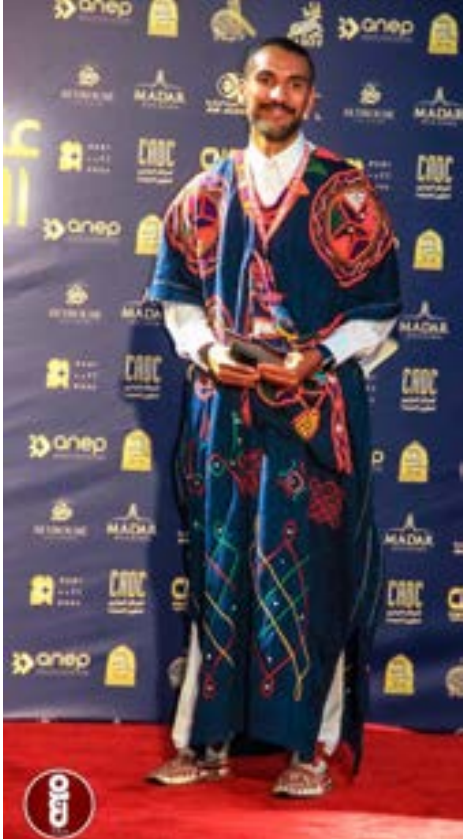
المخرج الليبي ياسين الحطمانى