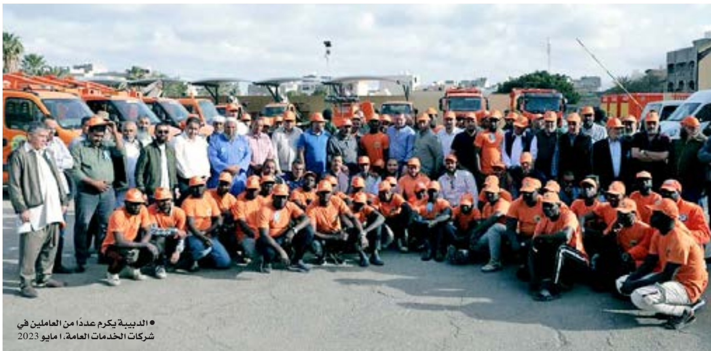
• الدبسية تكريم عددا من العاملين في شركات الخدمات العامة، 1 مايو 2023

«حكومة حماد» تحاول احتواء غضب «نقابات العمال» في بنغازي