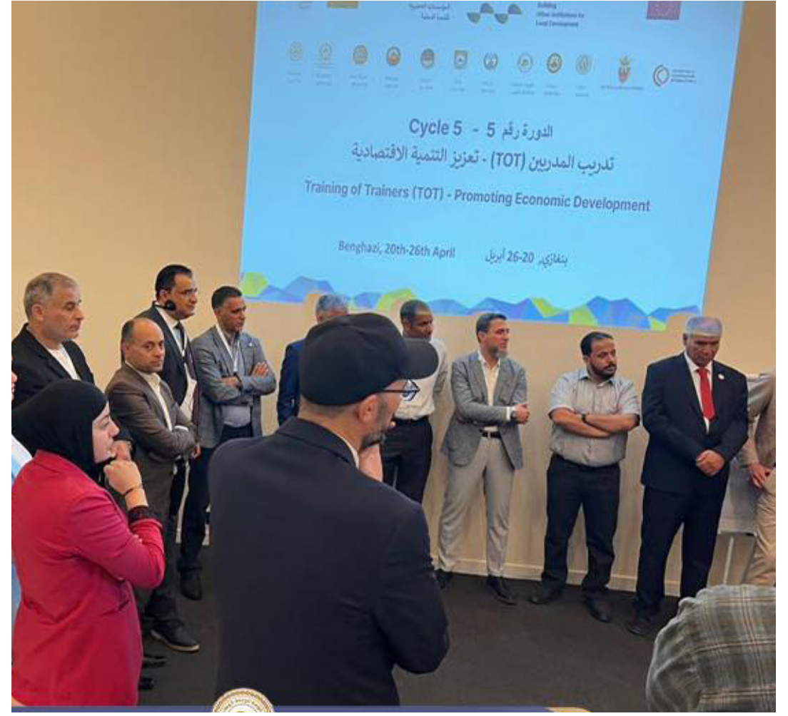
تنسيق لمواجهة الحمى القلاعية..