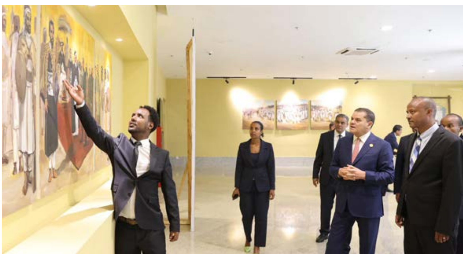
• الدببية في متحف النصر الاثيوبي، أديس أبابا 25 أبريل 2024

وكشف النائب صالح أفجيحة أن المجلس أقر قانون الميزانية المقدم من الحكومة المكلفة بقيمة 90 مليار دينار، ولا تشمل باب التنمية. دولياً، واستمر الحراك الدبلوماسي الأميركي بحث المبعوث الأميركي الخاص إلى ليبيا السفير ريتشارد نورلاند مع