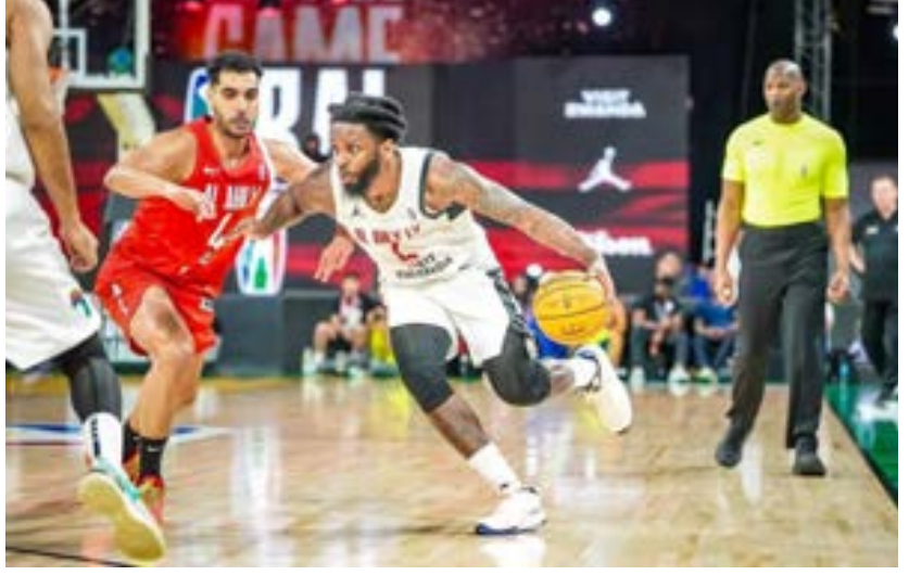
• مباراة الأهلي بنغازي والأهلي المصري في تصفيات BAL

مصر خصص مباريات تارحجت فيها نتائجها ما بين الفوز والهزيمة فافتتح مشواره بمواجهة بانغي من أفريقيا الوسطى في مباراة فاز بها ممثل كرة السلة الليبية بنتيجة 93-71، وفي الجولة الثانية واجه فريق الأهلي المصري لكنه فقد نتيجة المباراة 86-98، وفي الجولة الثالثة من التصفيات واجه فريق سيتي أولمبزر الأوغندي ففاز عليه بنتيجة 79-68. وفي الجولة الرابعة من تصفيات «BAL» واجه الأهلي بنغازي فريق بانغي من أفريقيا