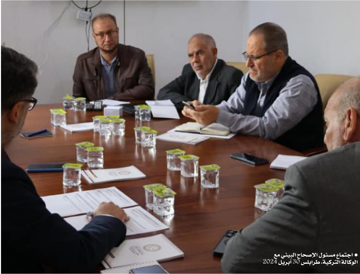
اجتماع مسئول الإصحاح البيئي مع الوكالة التركية، طرابلس 30 أبريل 2024