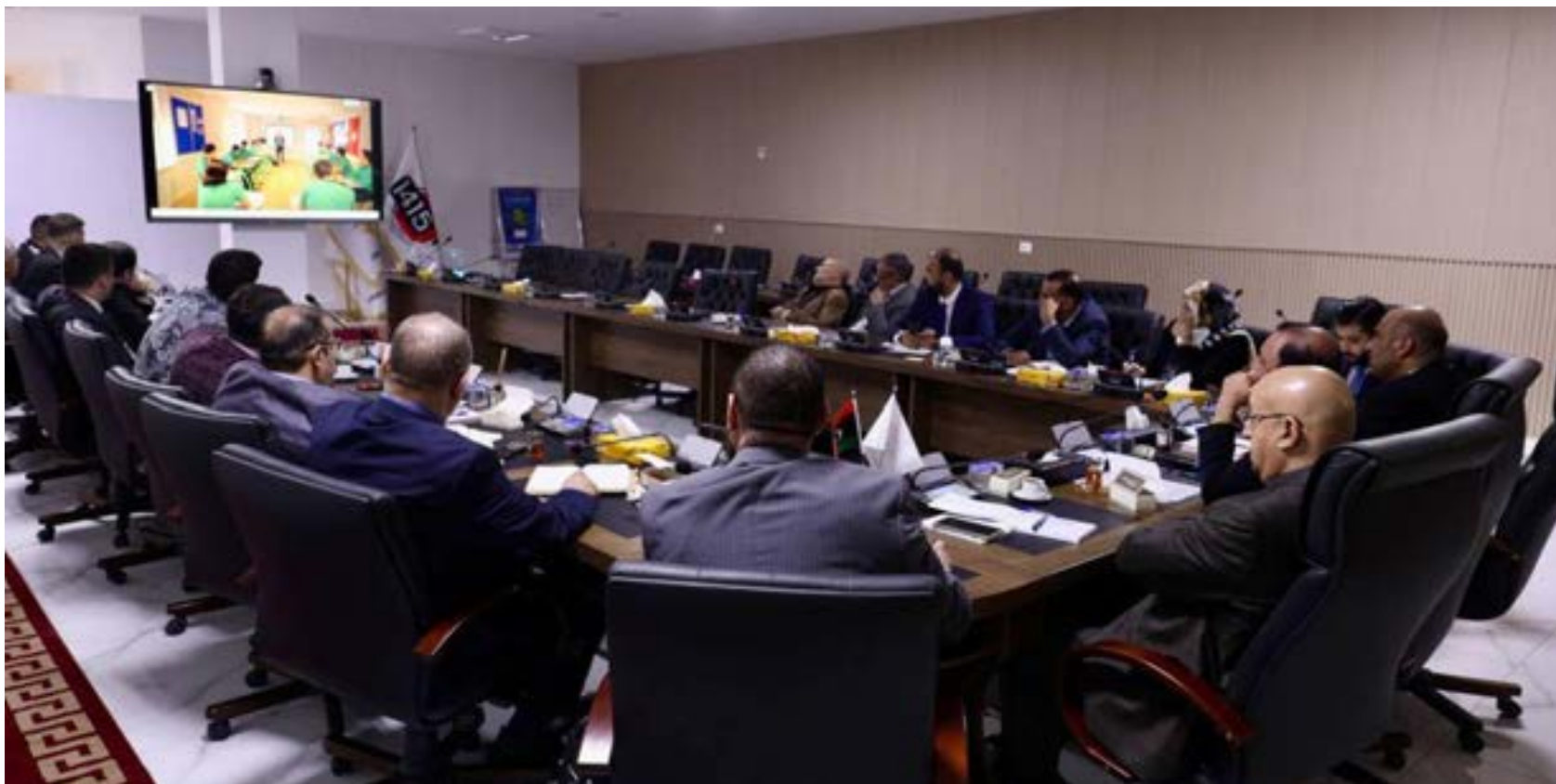
اجتماع وكيل وزارة الحكم المحلي مع ممثلي الشركتين الليبية والتركية ، طرابلس 28 أبريل 2024

الدورة التدريبية تضمنت ثلاث وحدات، تمثلت في: التنمية الاقتصادية المحلية والمستدامة، ومبادئ الترويج لمنطقة أو إقليم معين، وريادة الأعمال والاقتصاد الدائري وخلق فرص العمل. وتهدف الدورة، بحسب القائمين عليها، إلى خلق أو الحفاظ على بيئة مواتية لإنشاء وتطوير الأعمال التجارية، بالإضافة إلى بناء قدرات البلديات حتى تتمكن من تصميم وتنفيذ