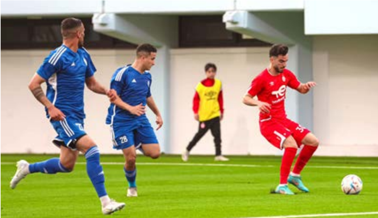
• مباراة الاتحاد والملعب الليبي

وفي مباراة أخرى، عزز الاتحاد من فرص تأهله إلى دور سداسي التتويج بفوزه الصعب على الملعب الليبي بنتيجة ثلاثة أهداف مقابل هدفين، ليرتفع رصيد الاتحاد إلى 26 نقطة في الترتيب الثالث، وفي المقابل توقف رصيد الملعب الليبي عند 13 نقطة. واختتمت منافسات الجولة بمباراة جمعت الأهلي طرابلس وضيّفه الخمس، وانتهت بفوز الأهلي طرابلس بنتيجة هدف دون رد، ليبرز صدارته لترتيب فرق