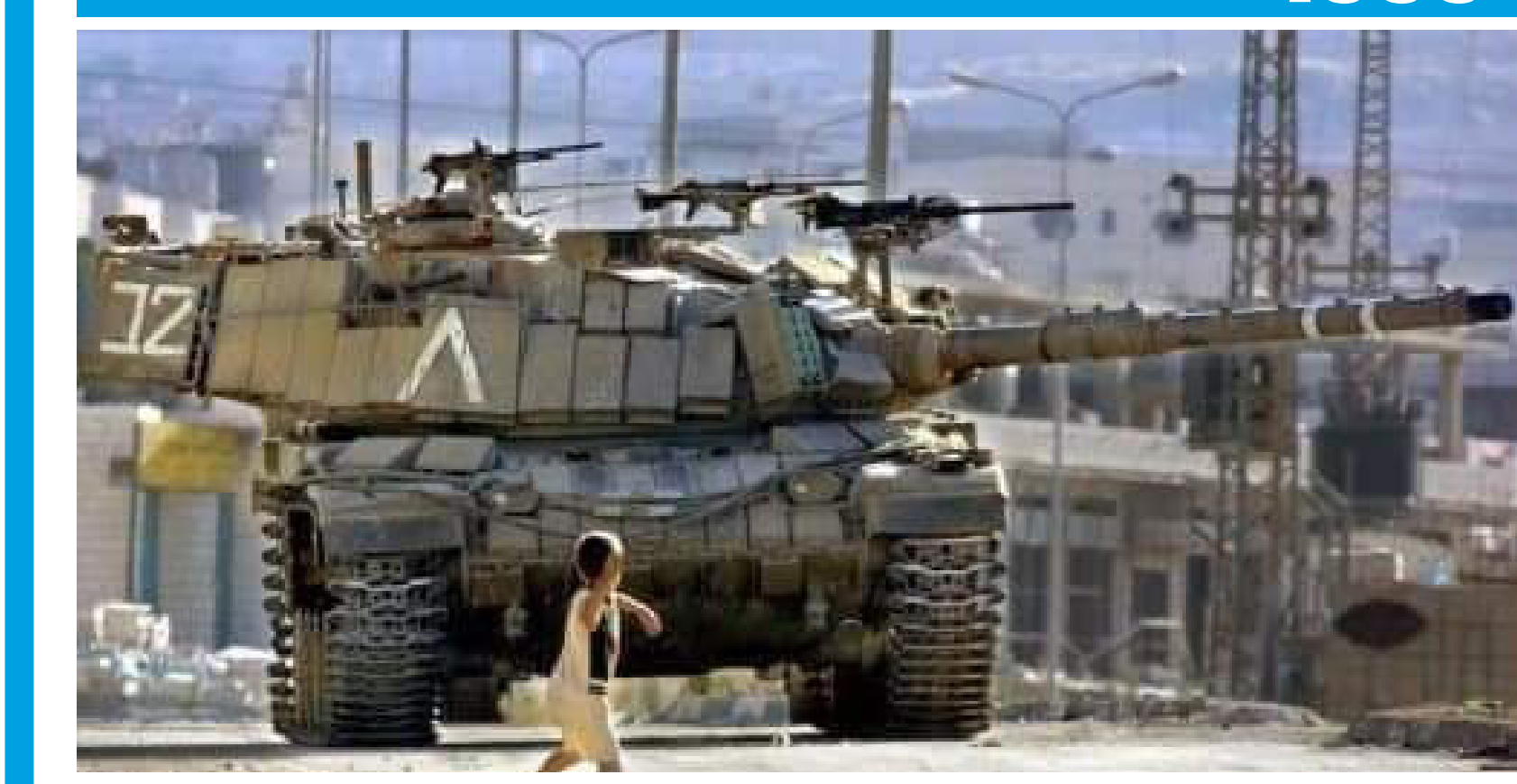
• طفل فلسطيني أمام دبابة قوات الاحتلال الصهيوني