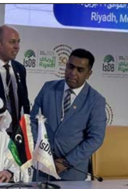
● من توقيع مذكرة التفاهم بين محافظ المصرف المركزي الصديق عمر الكبير، ورئيس مجموعة البنك الإسلامي للتنمية محمد الجاسر، 30 أبريل 2024

وتشير إحصاءات رسمية، تعود لشهر يناير الماضي، إلى أن نسبة العاملين بالقطاع الخاص