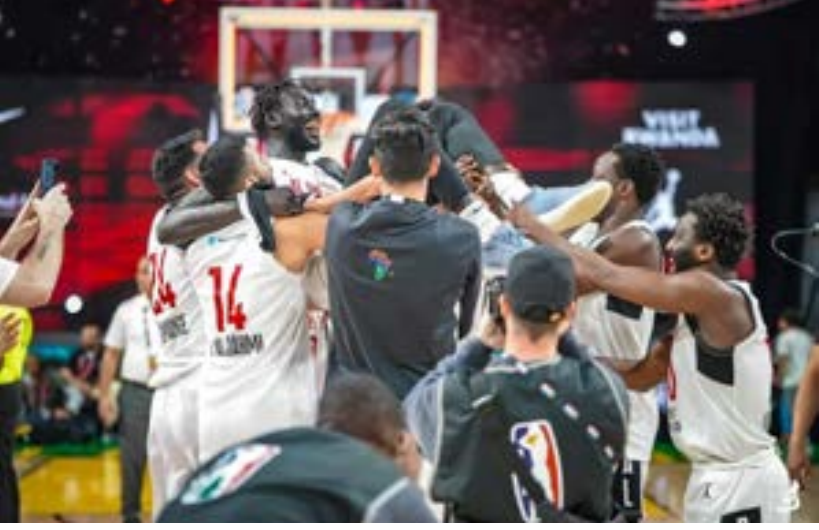
• فرحة لاعبي الأهلي بنغازي بتأهلهم لنهائيات BAL

الوسطى في مباراة فقد ممثل السلة الليبية نتيجتها 93-96، ليتعقد الموقف من جديد، خاصة أن تبع تلك المباراة بمواجهة فريق الأهلي المصري في الجولة الخامسة الذي كرز فوزه على الأهلي بنغازي بنتيجة 87-76. ليتأجل حسم التأهل إلى الجولة الأخيرة من التصفيات التي جمعت الأهلي بنغازي مع فريق سيتي أولمبزر الأوغندي تمكن أبطال السلة الليبية من حسم نتيجتها 110-78.