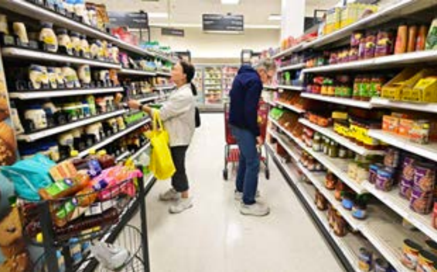
● أشخاص يتسوقون في قسم المواد الغذائية بمتجر بيع بالتجزئة في كاليفورنيا

أهمية جهودنا المستمرة لخفض التكاليف». ويكتسي مستوى التضخم أهمية سياسية قبل ستة أشهر من الانتخابات الرئاسية، حيث أكدت برينارد أن «الرئيس بايدن كاتفح من أجل خفض أكبر الفواتير التي تواجهها العائلات، وهذا يتناقض بشكل حاد مع سلوك الجمهوريين في الكونغرس».