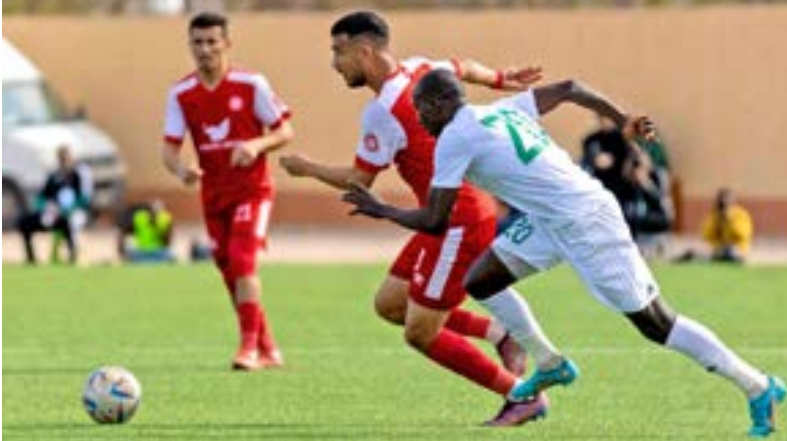
• مباراة السويحلي والأولمبي

النصر في الصدارة برصيد 34 نقطة، والأهلي بنغازي ثانياً برصيد 30 نقطة، يليه الهلال ثالثاً برصيد 29 نقطة، والأخضر رابعاً برصيد 25 نقطة، والتعاون خامساً برصيد 25 نقطة، فالتحدي سادساً برصيد 14 نقطة، والأنوار سابعاً برصيد 13 نقطة، ويتساوى المروج والصدّاقه في الرصيد ولكل منهما 12 نقطة، وفي آخر الترتيب يأتي الصقور برصيد عشر نقاط.