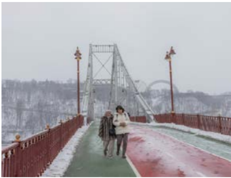
• سيداتان تسيران على جسر فوق نهر دنيبرو في كييف

الأوسط وأسيا ظلت على العامش إلى حد كبير فيما يتعلق بأوكرانيا، لكن تلك الدول سيكون لها ممثلون في المؤتمر.