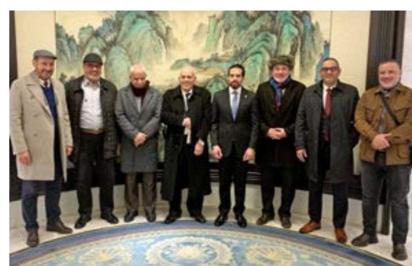
محمد السنوسي مع وفد درنة، 16 يناير 2024

المبدولة للوصول بالبلاد إلى بر الأمان عبر حوار وطني مخلص وجاد. رؤية السنوسي للحل السياسي ومطلع يناير الجاري، اقترح السنوسي إعادة العمل بدستور 1951 باعتباره «نقطة انطلاق منطقية» لإعادة إرساء الديمقراطية وتقليل الصراع على السلطة، منتقدا مبادرات المجتمع الدولي التي فشلت طيلة 12 سنة في تقديم الحل، مرجعا على نتائج الحوار الوطني الذي شرع فيه كآلية للمصالحة الوطنية. وأوضح في مقابلة مع موقع «موروكو وورلد نيوز» المغربي مطلع يناير الجاري رؤية لمستقبل ليبيا بالاعتماد على جذورها التاريخية والتأكيد على أهمية الحل الذي يقوده الليبيون. السنوسي الحفيد سطر الضوء على المحاور الرئيسية بما في ذلك الأساس التاريخي للديمقراطية البرلمانية الليبية قبل العام 1969، واحتمال إعادة دستور الاستقلال للعام 1951، وأهمية الحوار الوطني الليبي المتواصل، ودور المجتمع الدولي في دعم