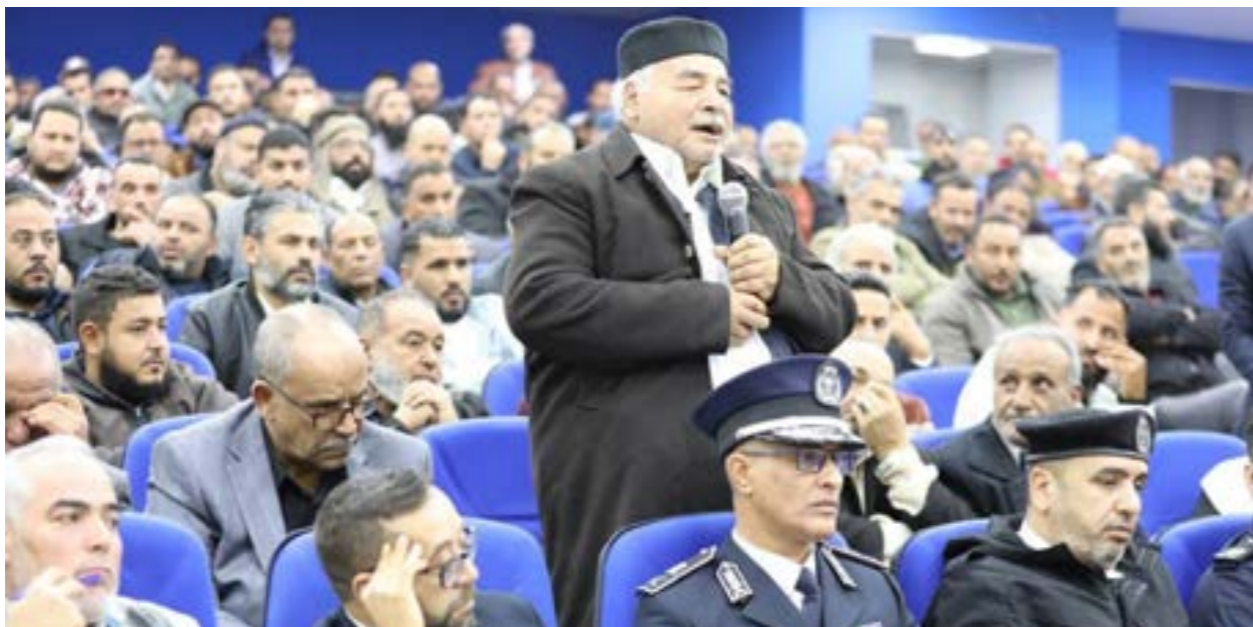
• جانب من حضور الاجتماع بديوان وزارة الداخلية، طرابلس 16 يناير 2024