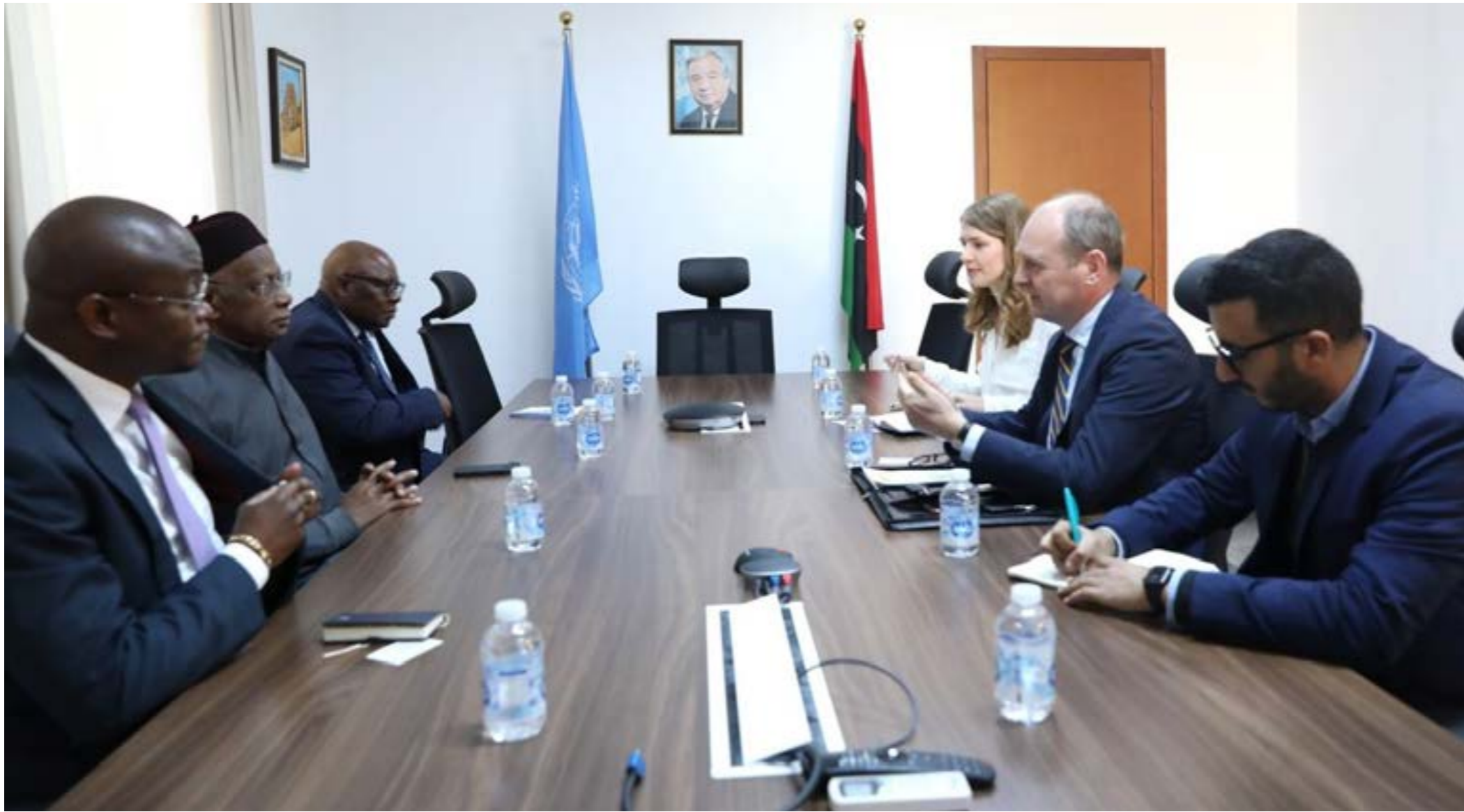
باتيلي في اجتماعه مع سفير هولندا يوست كلارنيك

لا يزال المشاور طويلاً ليصل القادة الليبيون إلى اجتماع يقود إلى توافق مع انشغال الجميع بالخلافات الاقتصادية والصقات النفطية التي شغلت الأطراف المختلفة عن الملف السياسي المتراجع منذ بداية العام، بينما لا يبدو في الأفق أي مؤشر على التوافق حول الانتخابات أو حسم الأزمة السياسية.