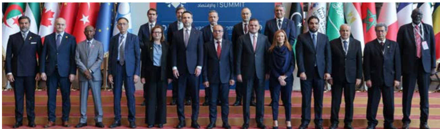
مشاركون في قمة ليبيا للطاقة والاقتصاد