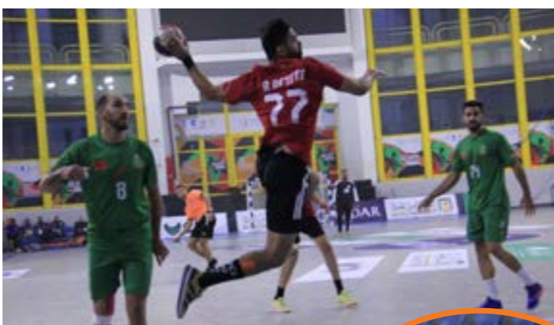
• المنتخب الوطني ليد المشاركة في البطولة

بثمانية ألقاب، في الاحتفاظ بكأس البطولة للمرة الثالثة على التوالي، وتقليص الفارق الذي يفصله عن المنتخب التونسي إلى لقب وحيد، وفاز منتخب مصر بالبطولة العام 2020، حين استضافتها تونس، عقب فوزه على المنتخب التونسي في النهائي، قبل أن يحتفظ بالبطولة في البطولة التالية التي أقيمت على أرضه العام 2022، إثر تغلبه على منتخب كاب فيردي، أما المنتخب الجزائري، الذي أحرز اللقب سبع مرات، فيأمل في الظفر بالبطولة للمرة الأولى منذ العام 2014 حين نظم البطولة وفاز باللقب بتغلبه على المنتخب التونسي في النهائي، وتعد هذه هي المرة السابعة التي تقام خلالها البطولة على الملاعب المصرية، علما بأن هذه هي المرة الرابعة التي تنظم فيها أرض الكنانة البطولة خلال البطولات الثمانية الأخيرة، وسبق لمصر أن استضافت أمم أفريقيا العام 1983، وأحرزت الجزائر لقبها بعد فوزها على الكونغو برازافيل في النهائي، كما نظمت المسابقة العام 1991 وتوج بها منتخب «الفرانعة» على حساب الجزائر في النهائي.