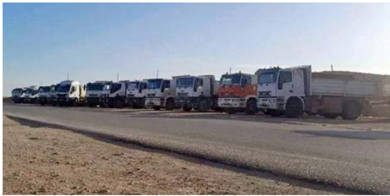
• اعتصام سائقي الشاحنات يؤثر سلبا على معيشة المواطنين

وإلى جانب ذلك، جرت مناقشة المشاكل التي تواجه سائقي الشاحنات، ووضع الحلول لها بما يضمن تعزيز حق المواطن في النقل، والانتفاع بالمرافق العامة، بالإضافة إلى مناقشة المشاكل التي تواجههم فيما يتعلق بالتزويد بوقود