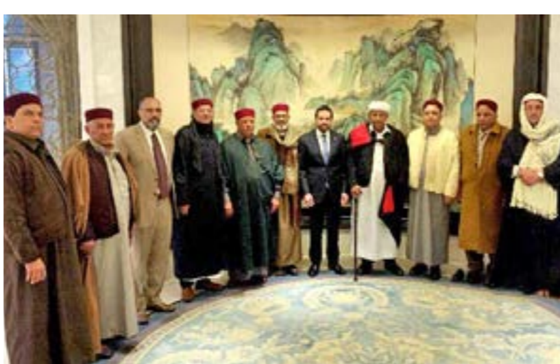
... ومع أعيان من المنطقة الشرقية، 13 يناير 2024

وأشار السنوسي إلى أن دستور 1951 «منح المرأة حق التصويت لأول مرة في ليبيا». وقال «في الواقع، كان للمرأة حق التصويت في ليبيا قبل أن تفعل ذلك في سويسرا والبرتغال». في ذلك السويد والمملكة المتحدة وإسبانيا وهولندا والدنمارك والنرويج واليابان. وقد تطورت كل واحدة منها من تاريخ الدولة وثقافتها وهويتها الوطنية وتتوافق معها». وأطبع بالملك إدريس الذي حكم ليبيا منذ استقلالها في العام 1951 عبر انقلاب عسكري بقيادة عمر القذافي في العام 1969. أضاف السنوسي أن الدستور يحدد العمليات الديمقراطية، بما في ذلك الانتخابات والأدوار البرلمانية والصل بين السلطات، ما يسهل العودة إلى الأعراف والممارسات الديمقراطية. مبينا أنه من خلال إعادة الدستور يمكن للبلاد إعادة فرض الضوابط والتوازنات، مما يمنع تركيز السلطة والميول الاستبدادية.