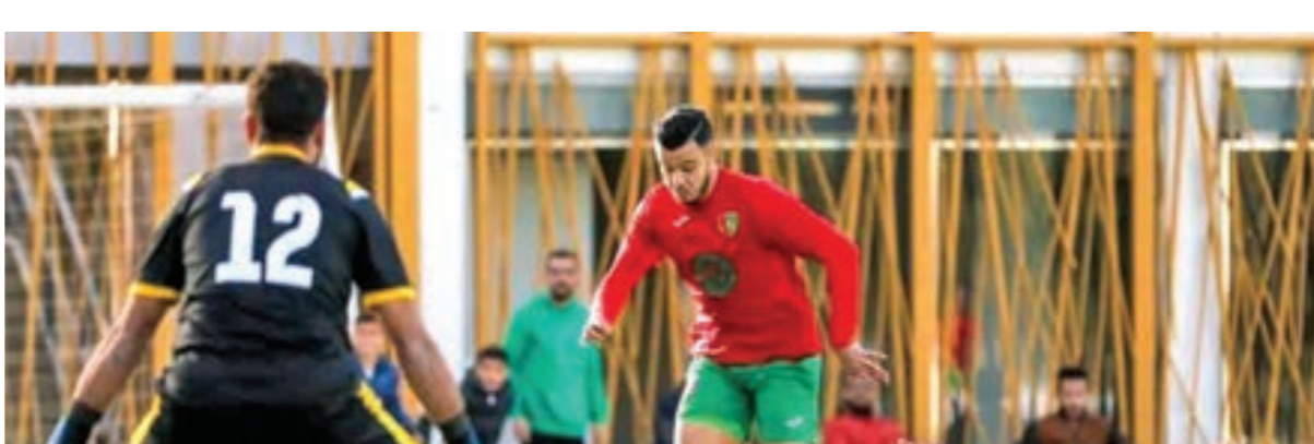
• مباراة الوحدة والنصر زليتين

وبعد هذه النتائج يحتل فريقا الظهرة وشباب الغار صدارة الترتيب بسبع نقاط لكل منهما بعد مرور ثلاث جولات من عمر المسابقة، ثم يأتي نجوم الصابرية ثالثا بست نقاط، فالطلائع رابعا بخمس نقاط، ثم الفالوجا خامسا بأربع نقاط، فالشموغ سادسا بأربع نقاط أيضا، يليه المستقبل والشرطة ولكل منهما ثلاث نقاط، ثم غوط الشعال بنتقلين، ويتساوى فريقا اليرموك والأحرار زليتين في الرصيد ولكل منهما نقطة واحدة.