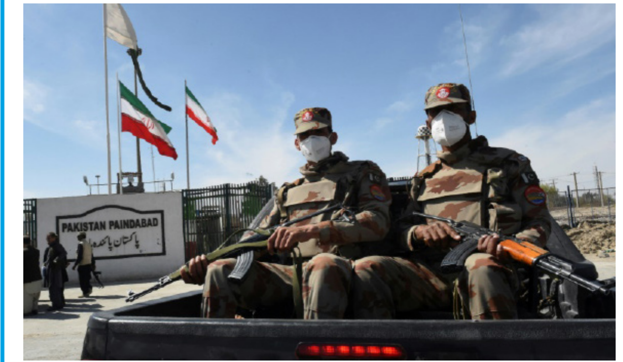
• جنديان باكستانيان خلال دورية عند الحدود الباكستانية- الإيرانية