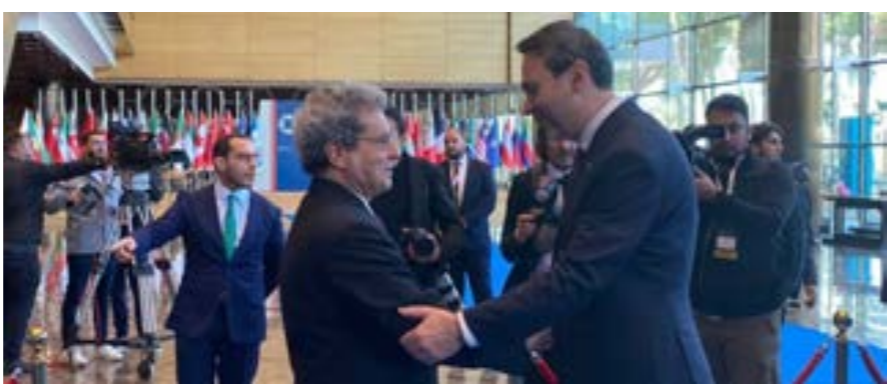
مشاركون في قمة ليبيا للطاقة والاقتصاد

وقال تقرير الوزارة إن إجمالي الترتيبات المالية الاستثمارية المخصصة للمؤسسة الوطنية للنفط بلغت خلال العام نحو 17 ملياراً و542 مليوناً و757 ألفاً و387 ديناراً من إجمالي نفقات الإنتاج النفطي والغاز، إلى جانب دفع مختلف الشركات الأجنبية والعامة للاستثمار في العلاقات المتجددة.