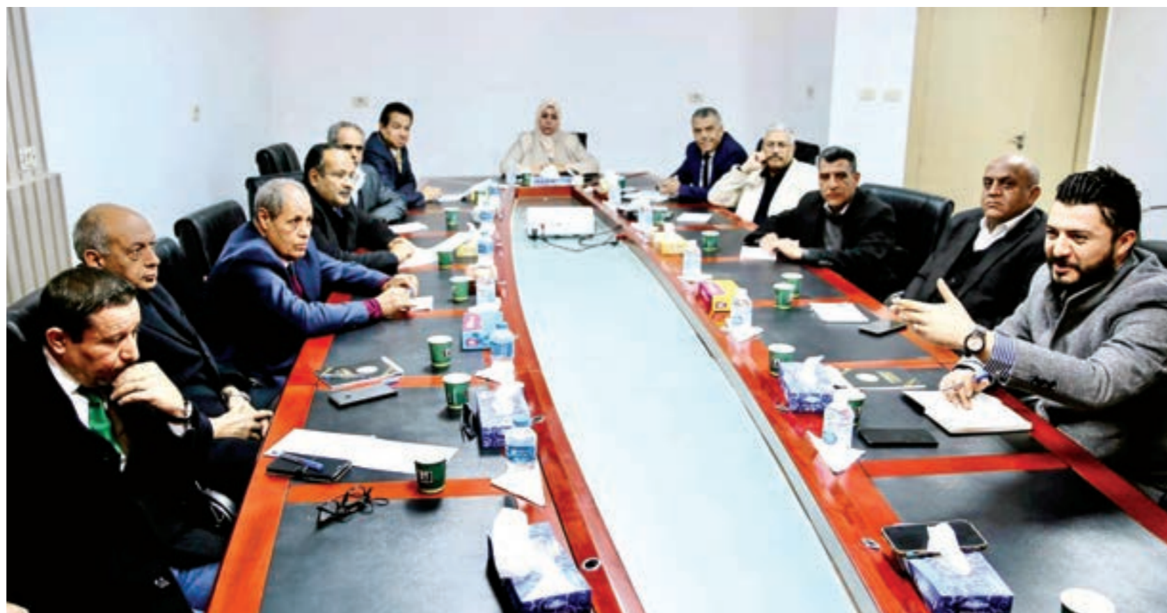
المجلس الأعلى للدولة

ومنذ الإطاحة بنظام العقيد معمر القذافي بتوريها على ثلاثين بلدية، وقبلها بإرسال المركز شحات من التطعيمات المماثلة إلى مناطق الجبل، لتوزع على أربع عشرة بلدية. وقال المركز، في منشور عبر صفحته على «فيسبوك»، إن أسطول نقل التطعيمات سيصل المنطقة الشرقية، لتغطية احتياجات ثلاثين بلدية، حيث جرى توزيعها على ثلاثة أيام. وأوضح أن التطعيمات يجري توزيعها على مستحقيها في كل المناطق، بالإضافة إلى تعزيز فكرة المواظبة على ضرورة إعطاء التطعيمات، ودورها في الحفاظ على الصحة.