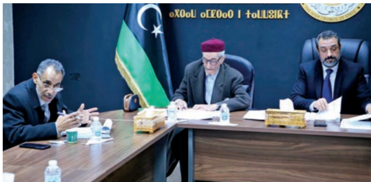
اجتماع لجنة الشؤون القانونية والأمن القومي والمجلس الأعلى للدولة 10 يناير 2024

مشترك آخر يُحدد مواعيد بالاتفاق بين اللجنتين. معهد روسي يستشرف الأزمة في ليبيا خلال 2024 في سياق متصل، سلط مركز أبحاث روسي الضوء على الوضع السياسي والأمني المعقد في ليبيا مع دخول العام الجديد، منها