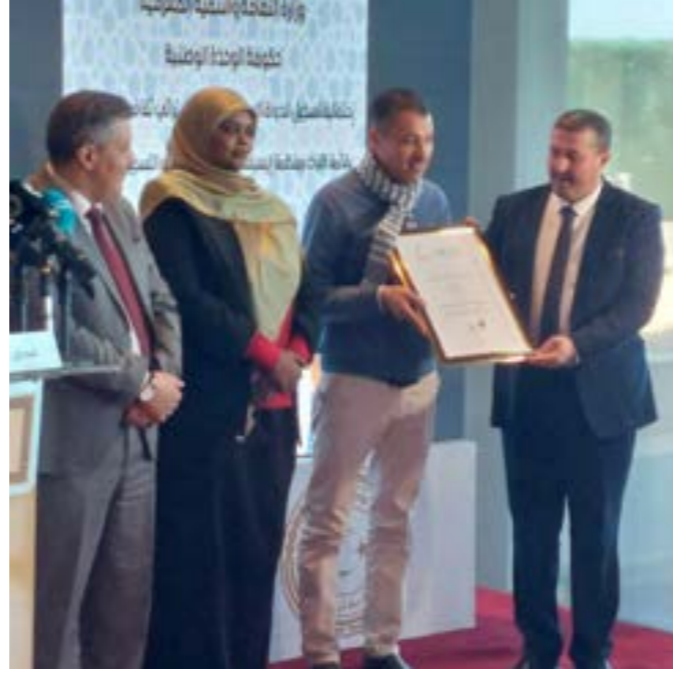
• أثناء تسليم شهادات اعتماد المواقع

رواية «ما وراء الحاجز» للكاتب الليبي إبراهيم البشاري