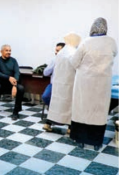
تطعيمات ضد الإنفلونزا الموسمية

تطعيمات ضد الإنفلونزا الموسمية بفيروس كورونا خلال الفترة المقبلة نتيجة انتشار المتحور الجديد. وأضاف: «هذا الوضع قد يؤدي إلى ازدياد حالات الإيواء في المستشفيات، خاصة لدى الفئات الهشة مثل كبار السن وذوي الأمراض المزمنة وذوي المناعة المنخفضة، وغيرهم». «مكافحة الأمراض» يتوقع ازدياد إصابات «كورونا» ونهاية ديسمبر الماضي، توقع المركز الوطني لمكافحة الأمراض ازدياد حالات الإصابة بفيروس «كورونا» خلال الفترة المقبلة، مرجعا ذلك إلى انتشار المتحور الجديد JN.1، وبالتالي ارتفاع