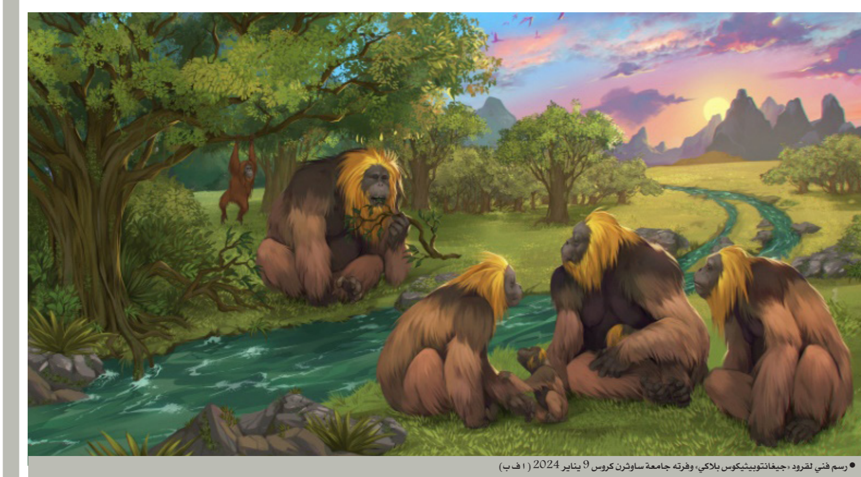
• رسم فني لقرود «جيجانتوتوبيكوس بلاكي»، وفرته جامعة ساوثرن كروس 9 يناير 2024 (1 هـ ب)