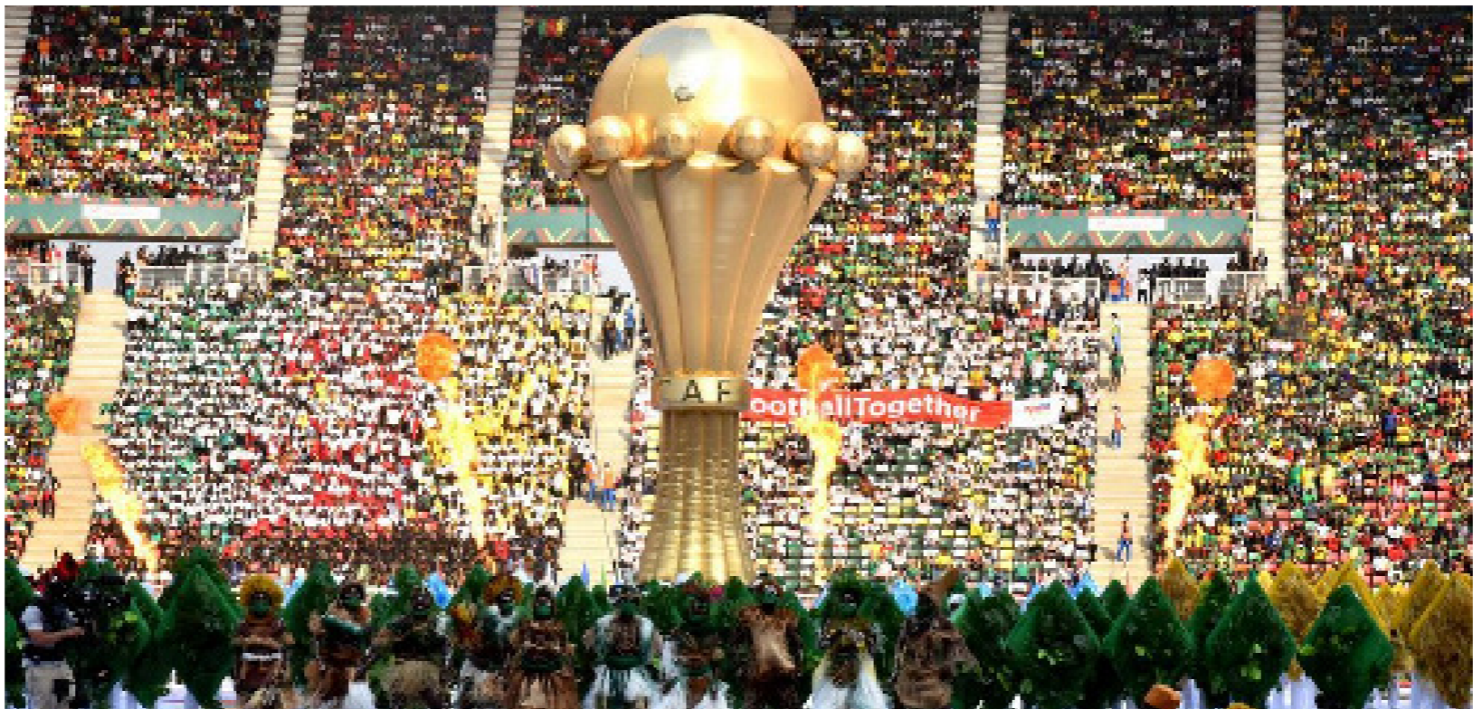
● افتتاح سابق لكأس الأمم الأفريقية

«جيراسي يقود غينيا ونوري أحد أوراق الجزائر والخنوس في المغرب وقديوس مع غانا