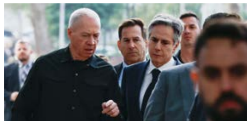
وزير الدفاع الإسرائيلي يوفأ غالات يتحدث إلى وزير الخارجية الأميركي أنتوني بلينكن في تل أبيب

تصاعد الحديث عن مستقبل غزة في وقت زار فيه وزير الخارجية الأميركي أنتوني بلينكن المنطقة والتي وجد فيها فرصة جديدة لواصل الدفاع عن المحتل الإسرائيلي الذي تجاوز 3 أشهر في عدوانه على غزة، أسقط خلالها أكثر من 23 ألفاً و300 شهيد. بلينكن التقى الرئيس الفلسطيني محمود عباس، الأربعاء، فيما حذر أيومازن من خطورة إجراءات الاحتلال الإسرائيلي الهادفة إلى تهجير الفلسطينيين من غزة أو الضفة الغربية بما فيها القدس، منتقداً تصريحات المسؤولين الإسرائيليين بالخصوص.