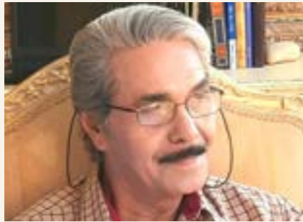
بقلم: البوصيري عبدالله

موقفة تقديراً اجتماعياً ناضجا عبرت عنه بوضوح أغنية «مش عيب» التي تحدث لنا العيب وتقبضه: «مش عيب عندي أحب ويجونني.. ومش عيب لو حبيت سود عيون.. ومش عيب لو حبيت ولد بلادي.. مش عيب لو حبيت ضاوي خذ.. ومش عيب لو قتلك فلان أنحب.. ولكن العيب الحقيقي من وجهة نظرها هو: «ننزل ديار العيب ويلوموني.. وعيب وخطأ نشبع الشبع الدوني.. وعيب ف الدروب الضايعة تقونني.. وعيب تسلبوا حقي قبال عيونني.. وعيب حرام نخون وتخونوني».