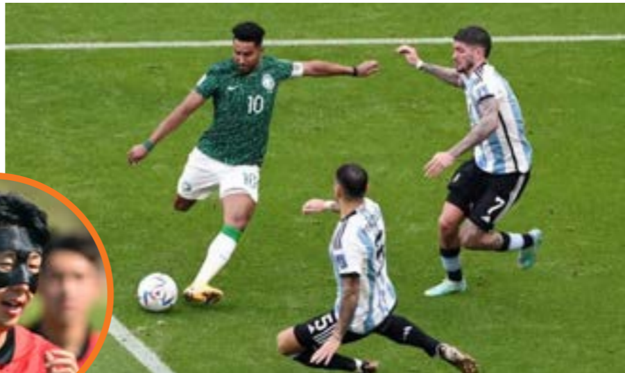
الدوسري يسجل هدفة التاريخي في الأرجنتين

ينتظر تألق نجم منتخب إيران مهدي طارمي رغم أن بلاده لم تفز بكأس آسيا منذ 1976 لكن وجود مهاجم بورنو البرتغالي مهدي طارمي يعزز من حظوظها في إنهاء هذا الصيام الطويل، وسجل طارمي (31 عاما) العديد من الأهداف منذ انضمامه إلى العملاق البرتغالي العام 2020 ويملك سجلا حافلا مع منتخب بلاده أيضا، واستبعد طارمي من مبارياتين العام 2022 لانقاده مدرب الفريق آنذاك المصري دراغان سكوتشيتش، لكنه سرعان ما عاد بسبب موهبته، ومن المرجح أن يشكل شراكة هجومية خطيرة مع مهاجم روما سردار آزمون.