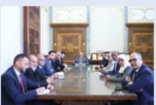
من اجتماع مسؤولي المصرف المركزي لمناقشة استكمال إجراءات التوحيد

وبالنسبة لاستخدامات المصارف التجارية، فقد جرى تخصيص 12 ملياراً و511 مليون دولار للائتمانات المستندية، و335 مليون دولار للحالات، و8 مليارات و159 مليون دولار للأغراض الشخصية. وبالعملة المحلية، أكد المصرف توزيع 106 مليارات دينار على فروع المصارف التجارية بجمع المدن الليبية، وذلك في إطار تنفيذ استراتيجية توفير السيولة النقدية لجمع فروع المصارف. وقال «المركزي» إن إجمالي الصكوك المنفذة خلال تلك الفترة عبر نظام المقاصة الإلكترونية بلغ 2.3 مليون صك بقيمة 71.9 مليار دينار، عبر 648 فرعاً مصرفياً ومركز مقاصة بأبناء البلاد. وبلغ عدد المحافظ الإلكترونية بلغ 139 ألفاً و937 محافظة، بلغ إجمالي حجم التداول عليها 36 مليون دينار، أما بالنسبة للبطاقات النشطة فقد بلغت 3.6 مليون بطاقة، في حين بلغ عدد أجهزة نقاط البيع العاملة 48 ألفاً و958 جهازاً، بإجمالي حجم تداول 9.6 مليار دينار.