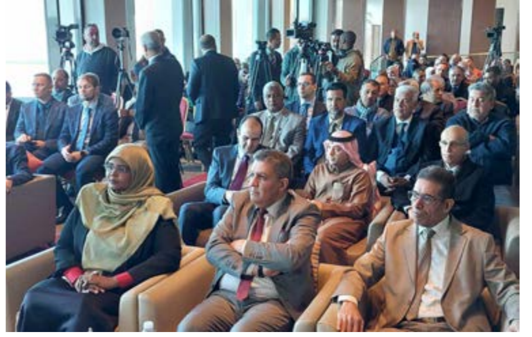
• توعي والمقرير يتقدمان الحضور