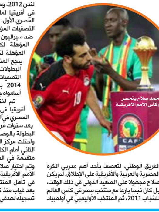
● محمد صلاح يتحضر أمام كأس الأمم الأفريقية

لندن 2012، وحصل على جائزة أفضل لاعب صاعد في أفريقيا لعام 2012 ثم شارك مع المنتخب المصري الأول، وكانت مباراته الدولية الأولى خلال التصفيات المؤهلة لكأس الأمم الأفريقية 2013 ضد سيراليون، ثم شارك في التصفيات الأفريقية المؤهلة لكأس العالم 2014، والتصفيات المؤهلة لكأس الأمم الأفريقية 2015، ولم ينجح المنتخب المصري في التأهل لأي من البطولات الثلاث، لكن صلاح كان هدف التصفيات الأفريقية المؤهلة لكأس العالم 2014 بإحرازه 6 أهداف بالمشاركة مع أسامواه جيان ومحمد أبو تريكة. تم اختيار صلاح ضمن فريق العمل في أفريقيا في 2016، عقب ذلك نجح المنتخب المصري في التأهل لكأس الأمم الأفريقية 2017، وبعد سنوات من الغياب، ونجح «الفراعنة» في تلك البطولة بالوصول إلى النهائي، لكن خسرت مصر واحتلت مركز الوصيف، بعد السقوط في الشوط الثاني أمام الكاميرون بنتيجة 1-2، بعد أن كانت متقدمة في الشوط الأول بهدف لمحمد النني، وتم اختيار صلاح ضمن التشكيلة المثالية لكأس الأمم الأفريقية 2017، وشارك أيضاً بشكل فعال في تأهل المنتخب المصري لكأس العالم 2018 بعد غياب منذ كأس العالم 1990، وذلك من خلال تسجيله لهديف فوز مصر على الكونغو بنتيجة 2-1،