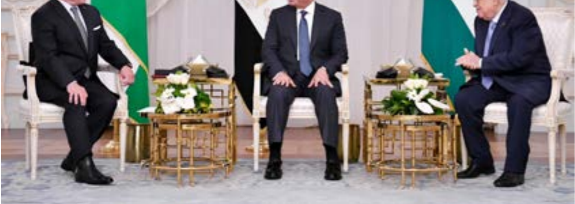
السيسي يتوسط أيومازن وعبدالله