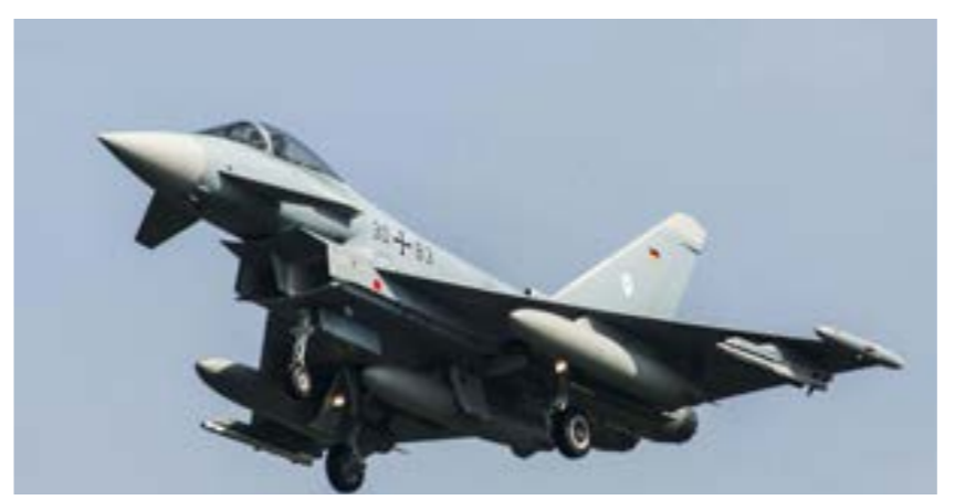
طائرة يوروفايتر، المقاتلة الألمانية

أعلنت الحكومة الألمانية، أمس الأربعاء، أنها وافقت على عملية بيع صواريخ للسعودية، رافعة بذلك حظراً فرضته منذ فترة طويلة على صادرات الأسلحة إلى الرياض. وقال الناطق باسم المستشار الألماني، أولاف شولتس، لصحفيين إن الحكومة أعطت الضوء الأخضر في نهاية العام 2023 لبيع صواريخ من طراز «إيريس-تي» للسعودية، بعد أن كشفت جريدة «دير شبيغل» المعلومة، وجمدت ألمانيا، في وقت سابق، مبيعات الأسلحة للرياض منذ مقتل الصحفي جمال خاشقجي أواخر العام 2018 في عملية أُنحت الاستخبارات الأميركية خصوصاً باللائمة فيها على ولي العهد السعودي محمد بن سلمان.