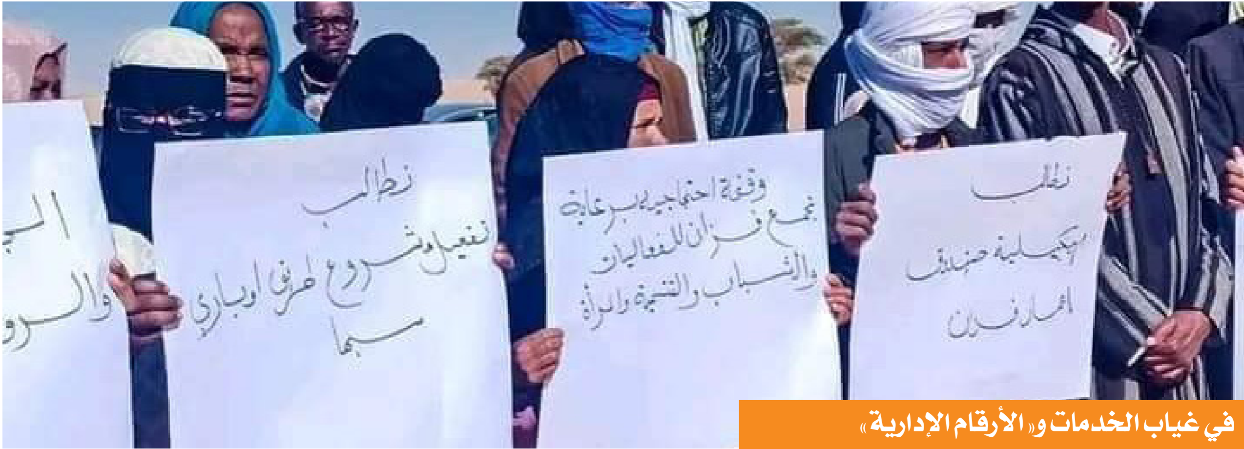
في غياب الخدمات و«الأرقام الإدارية»