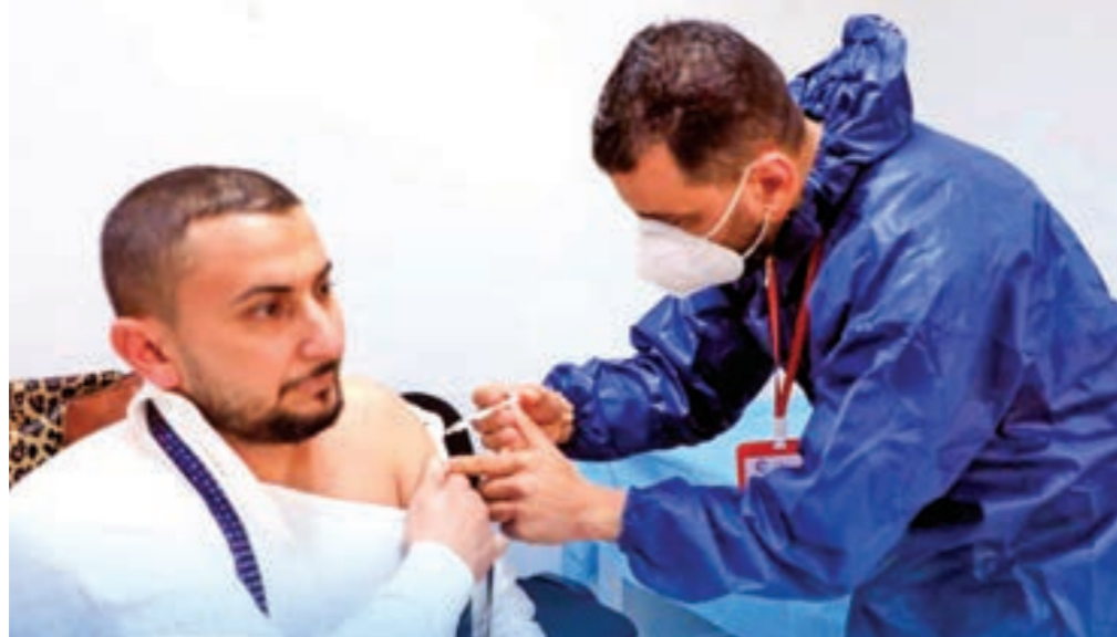
المركز الوطني لمكافحة الأمراض.

بشكل مستمر، والبقاء في المنزل عند الإحساس بظهور الأعراض أو العدوى. يذكر أن متحور «كورونا» الجديد سريع الانتشار، وقد يتسبب في أمراض تنفسية تصل إلى حدوث التهابات رئوية في بعض الحالات، ويتزامن ظهوره مع انتشار الفيروسات الموسمية مثل الإنفلونزا، والفيروس المعطوي التنفسي، والالتهاب الرئوي الشائع في مرحلة الطفولة، وفق منظمة الصحة العالمية. شحنة تطعيمات إلى 30 بلدية في المنطقة الشرقية وفي 31 ديسمبر الماضي، أعلن المركز الوطني