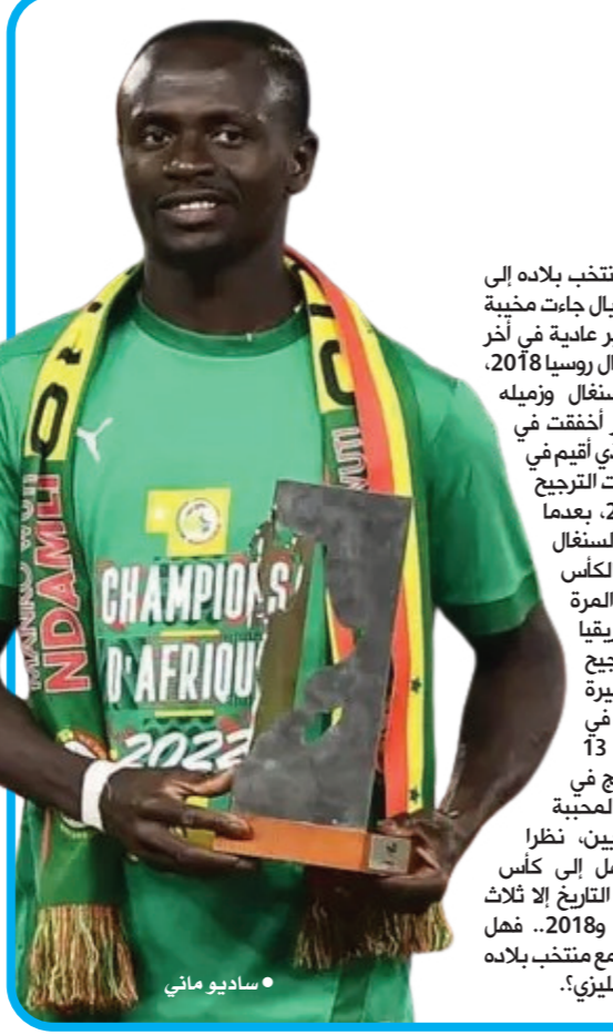
● ساديو ماني

إذا ما استثنينا بعض المشاركات الخجولة التي انتهت في مهدها، وكم تمنيت لو نحدد من المسؤول عن هذا التصغير، هل اتحاد الليبيين الذي لا تسمح إمكاناته المادية بنشر اللعبة وإقامة المسابقات المحلية والمشاركة الدولية أو اللجنة الأولمبية التي لا يعرف أغلب أعضائها إلا السفريات والتواجد في كل انتخابات على قمة هرم اللجنة الأولمبية بدليل استمرارية رئيسها للمرة الثالثة وقد يصل حتى للعاشر أو وزارة الرياضة التي تدفع مع السيد رئيس الحكومة بسواء لأندية دعماً لها دون أن تساهم في إيجاد ملاعب لكرة السلة وبقية احتياجاتها أو وزارة التربية والتعليم التي يفترض أن تنظم بطولة للمدارس في اللعبة بداية من داخل المدينة إلى تحديد بطل ليبيا في اللعبة. أخيراً إذا لم يتم نشر اللعبة على نطاق واسع داخل البلاد فإن جهود هؤلاء الأبطال والمدرب سوف تنتهي مع الاعتزال وتعود اللعبة إلى المشاركات فقط دون طموحات المبدعات... لا ريب سخر لنا المسؤولين الذين يعرفون المعنى الحقيقي لنشر أي لعبة في معظم مناطق ليبيا، ولما لها من نتائج إيجابية في تطور ورفع مستوى الألعاب الرياضية، أخيراً إن نتيجة المباريات النهائية مع الفريق المصري تعد إنجازاً بعد ذاته مع الفرق صاحب البطولات الثلاث عشرة والمفضلة لسنوات لدى المصريين، نظراً لسهولة اقتناعهم بعكس التأهل إلى كأس العالم، الذي لم يأتي إنجازاً غير التاريخ إلى ثلاث مرات، الأولى في 1934، 1990، و2018. فهل يعقل صلاص ويتوج اسمه ببطولة مع منتخب بلاده على غرار ما يفعله مع ليفرول في إنجلترا؟