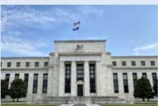
مقر الفيدرالي الأمريكي

أعلنت الحكومة الأمريكية الثلاثاء الماضي تراجع العجز التجاري الأمريكي في نوفمبر 2023، في ظل تراجع الواردات والصادرات على حد سواء، وتأثير معدلات الجاء المرتفعة. وعلى الرغم من توقعات المحللين بتسجيل العجز التجاري زيادة طفيفة، فإنه بلغ 63.2 مليار دولار، مقارنة مع الرقم المسجل في أكتوبر الذي تمت مراجعته، وبلغ 64.5 مليار دولار، بحسب وزارة التجارة. لكن المحللين توقعوا أن يؤثر ارتفاع معدلات الفائدة، التي تنعكس على الطلب، على الواردات. في تلك الأثناء، يمكن أن تتأثر الصادرات بتباطؤ النمو في أهم شركاء الولايات المتحدة التجاريين أيضاً على خلفية تشديد السياسات النقدية. وفي نوفمبر، تراحت الصادرات الأمريكية بمقدار 4.8 مليار دولار إلى 253.7 مليار دولار، بينما سجلت الواردات تراجعاً أكبر، بلغ 6.1 مليار دولار إلى 316.9 مليار دولار. وقال خبير الاقتصاد الأمريكي، ماثيو مارتن، من «أكسفورد إيكونوميكس» إنه يتوقع أن يتباطأ إنفاق المستهلكين في الفصول المقبلة، لكن يفترض أن يبقى قوياً بما يكفي لـ«منع تراجع الواردات فترات مطولة»، معتبراً أداء الصادرات كان «جيداً نسبياً» على الرغم من الوضع الاقتصادي العالمي.