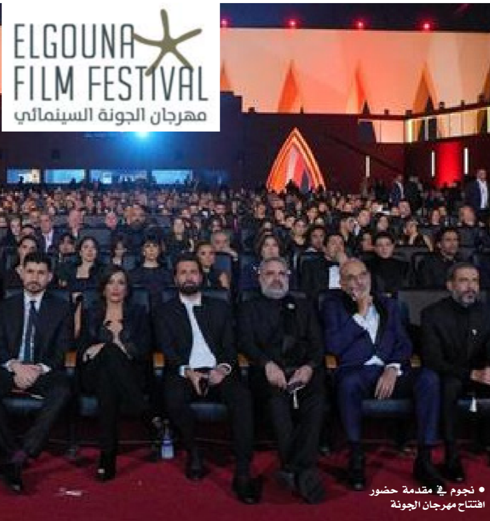
• نجوم في مقدمة حضور افتتاح مهرجان الجونة