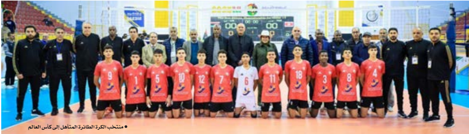
منتخب الكرة الطائرة المتأهل إلى كأس العالم

حقق المنتخب الوطني ناشئي الكرة الطائرة إنجازاً عالمياً بتأهله المستحق إلى بطولة كأس العالم التي ستقام العام المقبل. جاء تأهل شباب ليبيا الواعد عن جدارة واستحقاق بعدما نجح في الوصول إلى المباراة النهائية للبطولة الأفريقية الأولى أمام نظيره المصري، ليصعد المنتخبان معاً إلى مونديال الطائرة. ويهدأ يكون ناشئو ليبيا قد تركوا بصمتهم في القارة الأفريقية في أول بطولة أفريقية تقام لهذه المرحلة السنوية، متفوقين على منتخبات عدة قابلتهم في الطريق إلى نهائي البطولة الأفريقية التي استضافتها ليبيا في مدينة مصراتة. وخلال الدور التمهيدي لبطولة أفريقيا، نجح لاعبو المنتخب الوطني في التغلب على منتخبي المغرب والكاميرون، لكنه فقد نتيجة مبارياته أمام منتخبي تونس ومصر، ليتأهل المنتخب إلى الدور نصف النهائي الذي كرز فيه المواجهة مع شقيقه التونسي، وهذه المرة تمكن أبناء ليبيا من رد الدين والتغلب على المنتخب التونسي، ليحجز مكاناً له في المباراة النهائية أمام المنتخب المصري الذي تأهل بدوره عقب الفوز