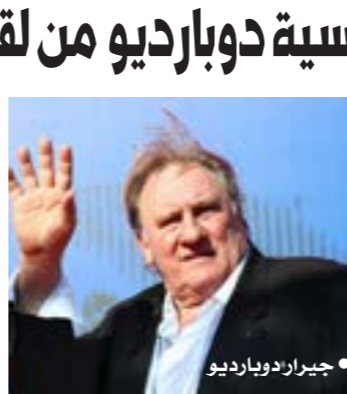
• جيرارد دوبارديو

جوقة الشرف. وقال محاميا النجم السينمائي الفرنسي، السبت، إنه وضع جائزة وسام جوقة الشرف التي حصل عليها في تصرف سابق من ديسمبر الجاري، أقيمت بلدية بلجيكية السبت على تجريد أسطورة السينما الفرنسية جيرار دوبارديو من لقب المواطن الفخري. واتهم دوبارديو (74 عاماً) بالاعتداء في العام 2020، كما واجه 13 اتهاماً بالتحرش الجنسي أو الاعتداء، وكلها اتهامات نفىها الممثل، وفقاً لوكالة «فرانس برس». وأظهر فيلم وثائقي حمل عنوان «سقوط القول»، بثته قناة «فرانس 2» الفرنسية العاملة في 7 ديسمبر الجاري، مقاطع للممثل خلال رحلة العام 2018 إلى كوريا الشمالية، يبين فيه دوبارديو يبدلي بتعليقات متكررة تنطوي على تلميحات جنسية صريحة بحضور مترجمة، كما حاولت إيهائه الجنسية التي أظهرها الوثائقي قناة صغيرة تركب حصاناً. وانتقد محاميا الممثل الوثائقي في بيان السبت، قائلاً إنه «برنامج مثير للجدل ومشكوك فيه يهين مجموعة صور التقطت في المجال الحميم والخاص». وقالت السلطات المحلية إن تعليقات الممثل التي تروج لها بلدية إستانيمويي». القيم التي تروج لها بلدية إستانيمويي». وزير الثقافة يدين دوبارديو ويأتي القرار البلجيكي غداً إداة وزيرة الثقافة الفرنسية لسلك دوبارديو، لكن بلدية إستانيمويي البلجيكية أعلنت أنها ألغت اللقب الممنوح لدوبارديو عندما كان يعيش هناك في العام 2013. وقالت روما عبدالمك إن جرى اتخاذ «إجراء تاديبي» لتحديد ما إذا كان سيجري تجريده من أعلى وسام في البلاد، وهو وسام تقرير قناة «فرانس 2».