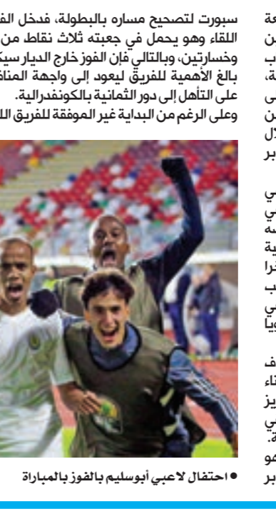
احتفال لاعبي أبوسليم بالفوز بالمباراة

سوبرت لتصبح مساره بالبطولة، فدخل الفريق اللقاء وهو يحمل في جعبته ثلاث نقاط من فوز وخسارتين، وبالتالي فإن الفوز خارج الديار سيكون بالغ الأهمية للفريق ليعود إلى واجهة المنافسة على التأهل إلى دور الثمانية بالكونفدرالية. وعلى الرغم من البداية غير الموفقة للفريق الليبي سيوتتحي مساره بالبطولة، فدخل الفريق اللقاء وهو يحمل في جعبته ثلاث نقاط من فوز وخسارتين، وبالتالي فإن الفوز خارج الديار سيكون بالغ الأهمية للفريق ليعود إلى واجهة المنافسة على التأهل إلى دور الثمانية بالكونفدرالية. وعلى الرغم من البداية غير الموفقة للفريق الليبي سيوتتحي مساره بالبطولة، فدخل الفريق اللقاء وهو يحمل في جعبته ثلاث نقاط من فوز وخسارتين، وبالتالي فإن الفوز خارج الديار سيكون بالغ الأهمية للفريق ليعود إلى واجهة المنافسة على التأهل إلى دور الثمانية بالكونفدرالية.