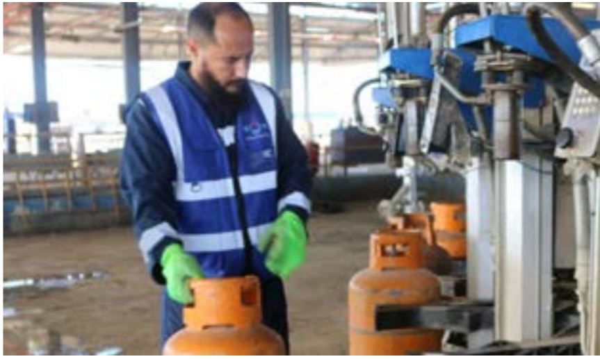
● من تعبئة اسطوانات غاز الطبي بمحطة تابعة لشركة البريقة، لتسويق النفط

حلت ليبيا في قائمة أكثر 10 دول استهلاكاً للوقود بأفريقيا، بمتوسط استهلاك يبلغ 262 ألف برميل يومياً من الوقود، وذلك وفقاً لتصنيف موقع «بيزنس إنسايدر أفريقيا». واحتلت ليبيا المرتبة السادسة من بين أكثر عشر دول أفريقية مستهلكة للوقود، والمرتبة 48 على الصعيد العالمي. وتصدرت القائمة الأفريقية كل من: مصر بواقع 802 ألف برميل وقود يومياً، ثم جنوب أفريقيا بمعدل 660 ألف برميل يومياً، ثم الجزائر بمعدل 316 ألف برميل يومياً. وجاء في آخر القائمة كينيا بـ 93 ألف برميل يومياً، تسبقها تونس بـ 98 ألف برميل يومياً من الوقود. ولفت الموقع المعني بمتابعة أهم الأسواق في القارة السمراء، أن ليبيا إلى جانب نيجيريا والجزائر وأنغولا، من أهم اللاعبين في صناعة النفط في أفريقيا، مع شحن ملايين البراميل سنوياً.