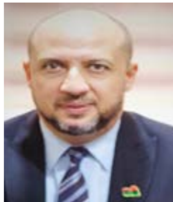
• أكرم الفكاح

وبالنسبة لرئيس حزب النداء أكرم الفكاح المترشح للانتخابات الرئاسية الليبية، فإنه لا يزال على «يقين تام أن الاستحقاق قائم لا محالة والأمل دائما موجود ونحن نكافح من أجل ذلك بكل ما نستطيع سواء كنت مرشحا للرئاسة أو المرشح للرئاسة». وقال الفكاح في تصريح إلى «الوسط»، إن الأمل في الانتخابات سيظل قائما والدليل الـ2.8 مليون ناخب الذين ينتظرون فرصة لإدلاء بأصواتهم واختيار من يمثلهم، مع ضرورة الإشارة إلى ملكية الليبيين وقيادتهم لأي عملية سياسية لأنها في مفتاح الحل الذي سيقود للاستقرار الذي نتطلع إليه وفق تعبيره. ومن وجهة نظر السياسي الليبي،