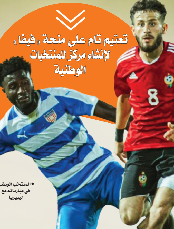
المنتخب الوطني في مبارياته مع ليبيا

هذا المشروع إقامة مركز للمنتخبات الوطنية الليبية ضمن برامج الدعم التي تقدمها الاتحادات الأهلية حول العالم. من جانبه، لم يقدم حتى الآن الاتحاد الليبي أي توضيحات عن هذا المبلغ وهل جرى تحويله كاملاً، ومتى سيجري البدء في تنفيذ مركز المنتخب، وكم من الوقت سيستغرقه تنفيذ المشروع في ظل غياب الشفافية في التعامل مع العديد من أمور الاتحاد المهمة، من خلال تجاهل عقد المؤتمرات الصحفية، وعدم توضيح حقائق كثيرة للوسط الرياضي. وليس جديداً أن يدعم «فيفا» الاتحاد الليبي شأنه في ذلك شأن كثير من الاتحادات حول العالم منذ برنامج الهدف سنة 2006، وهو برنامج كان يهدف لبناء مركز في كل دولة خاصة الدول التي هي بحاجة لهذه المراكز لتطوير اللعبة، حيث كان الاتحاد الليبي يتحصل على مبلغ ربع مليون دولار من برنامج الهدف من 2006 وحتى العام 2014، عندما رفع «فيفا» القيمة إلى مليون دولار سنوياً لجمع الاتحادات العالم، لكنه اشترط على كل الاتحادات تقديم تقرير سنوي عن كيفية صرف المبالغ، حيث تطلب