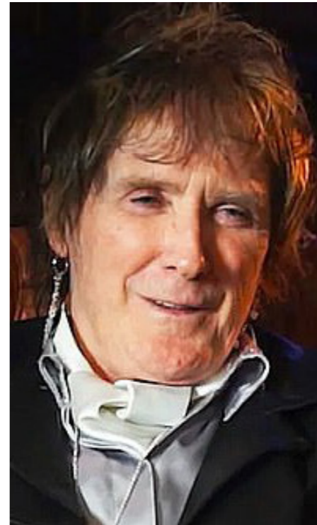
• كولين بيرجيس

عن عمر يناهز 77 عاماً توفي عازف الدرامز الأول في «إيه سي دي سي» كولين بيرجيس، وفق ما أعلنت الفرقة الأسترالية الشهيرة. وتثبيت «إيه سي دي سي» على صفحتها على الشبكات الاجتماعية إنستغرام وفيسبوك واكس «المناء تلقي نيا وفاة كولين بيرجيس»، من دون الكشف عن سبب الوفاة، وفقاً لوكالة «فرانس برس». وأضافت: «لقد كان أول عازف درامز لدينا وكان موسيقياً محترماً للغاية. تحفظت معاً بأسد الذكريات. (Rock in peace) «العب الروك بسلام» كولين». كان بيرجيس عضواً مؤسساً في الفرقة التي اشتهرت عالمياً بأغنياتها «هايواي تو هيل» العام 1979، جنباً إلى جنب مع المغني الأصلي في الفرقة ديف إيفانز، وعازف غيتار الباس لاري فان كرودت، والأخوين غارفي الغيتار أنغوس ومالكولم يونغ، وتشكيلات فرقة «إيه سي دي سي» في العام 1973، لكن بيرجيس تركها في العام التالي وحل محله عازف الدرامز الحالي غيل رود. أيضاً أسس بيرجيس فرقة «دي ماسترز Apprentices (The Masters)، التي أدرجت في قائمة مشاهير صناعة الموسيقى الأسترالية في العام 1998».