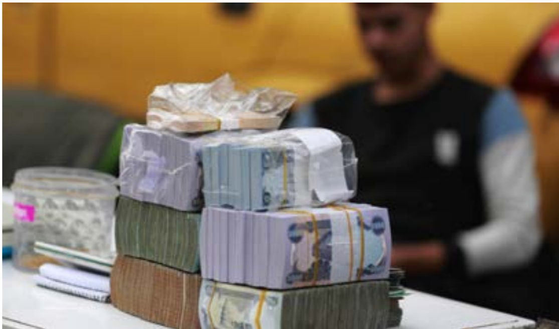
● رزم من الدنانير العراقية في مكتب صرافة في بغداد