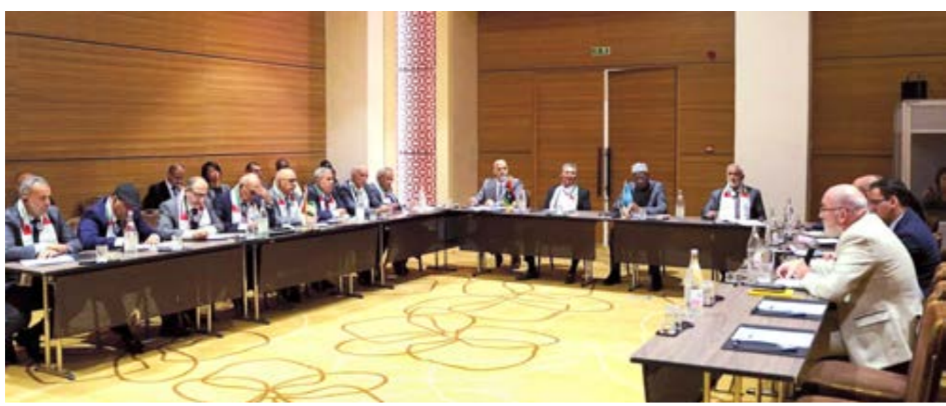
باتيلي خلال الجلسة الافتتاحية لاجتماع اللجنة العسكرية المشتركة، 5+5، تونس 7 نوفمبر 2023

غير أن مندوب ليبيا لدى الأمم المتحدة السفير الطاهر السني رفض بقاء ليبيا تحت وصاية المحكمة الجنائية الدولية إلى ما لا نهاية، متقدماً تأخر إعلان نتائج تحقيقات المحكمة الدولية في ليبيا، وقال إن الشعب الليبي «يستأثر أين هي نتائج عمل المحكمة الجنائية الدولية بعد كل هذه السنوات والتحقيقات وتبادل المعلومات والدلائل والقرائن المذكورة»، وأضاف «منذ 12 عاماً و26 إحاطة لهذا المجلس، والمدعي العام يتحدث عن 15 مهمة و4000 قرينة دليل، واستخدام النكاذب الصناعي، وبظلال السؤال المهم: أين هي النتائج؟»، أما روسيا فاقترحت سحب ملف ليبيا من المحكمة الجنائية الدولية، تبقى الإشارة إلى أن كل ما سبق ذكره بشأن العملية السياسية في ليبيا بما فيها التصار الانتخابي لا يخرج عن الحلقة المفرغة التي تعيشها هذه العملية دون إنجاز اختراق يذكر لحالة الانسداد السياسي القائمة، وبالتالي الكلام عن تسويات مهمة قد تقرب الموعد الانتخابي المأمول.