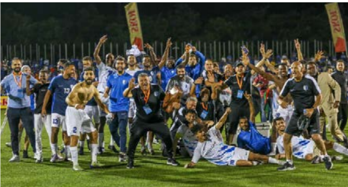
• فرقة فريق الهلال بعد التأهل لدور المجموعات في «الكونفدرالية».

يتربق ممثلا كرة القدم الليبية، ناديا الهلال وأبوسليم، قرعة دور المجموعات لبطولة كأس «الكونفدرالية» الأفريقية، المقررة إقامتها غدا الجمعة في جنوب أفريقيا. بعد نجاحهما في اجتياز الأدوار التمهيديّة للبطولة، يكملان المشوار القاري في إنجاز غير مسبوق لهما، ويصاحبه الممثلين الجوهريين ليبيا في القارة السمراء هذا الموسم على صعيد الأندية، بعد خروج مبكر للأهلي طرابلس من الدور التمهيدي الأول للبطولة الأم «دوري الأبطال»، الذي ستجرى قرعة دور المجموعات فيه غدا أيضا دون ممثل ليبي، بعد أن لحق بالأهلي طرابلس الممثل الثاني الأهلي بنغازي بالخروج أمام أسك ميمورا الإفرواني خاسرا بهدف مقابل هذين في المباراة التي جرت بينهما في أبيدجان، ضمن إياب الدور التمهيدي الثاني من البطولة، وكان يكفي الأهلي بنغازي الفوز أو التعادل الإيجابي بأي نتيجة لكي يتأهل إلى دور المجموعات، بعدما أنهت مباراة الذهاب بينهما التي أقيمت في تونس بالتعادل السلبي، لتسمر ليبيا مقعدين في دوري الأبطال، بينما تستمر في منافسات «الكونفدرالية».