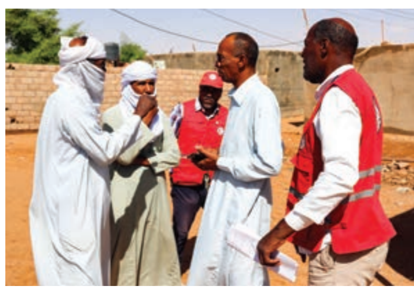
• حصر أضرار السيول في أوباري

بلدية أوباري نتيجة التقلبات الجوية في المنطقة الجنوبية، وفق ما أعلنته الشركة العامة للكهرباء.