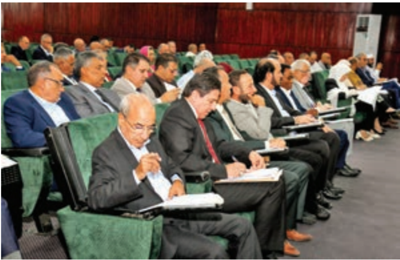
• جلسة مجلس النواب الليبي، بنغازي 2 أكتوبر 2023

وحضر الجلسة التي ترأسها عقيلة كل من النائب الأول لرئيس مجلس النواب فوزي النويري، والنائب الثاني مصباح دومة، ومقرر المجلس، ومجموعة من الأعضاء لم يعلن الناطق باسم المجلس عددهم.