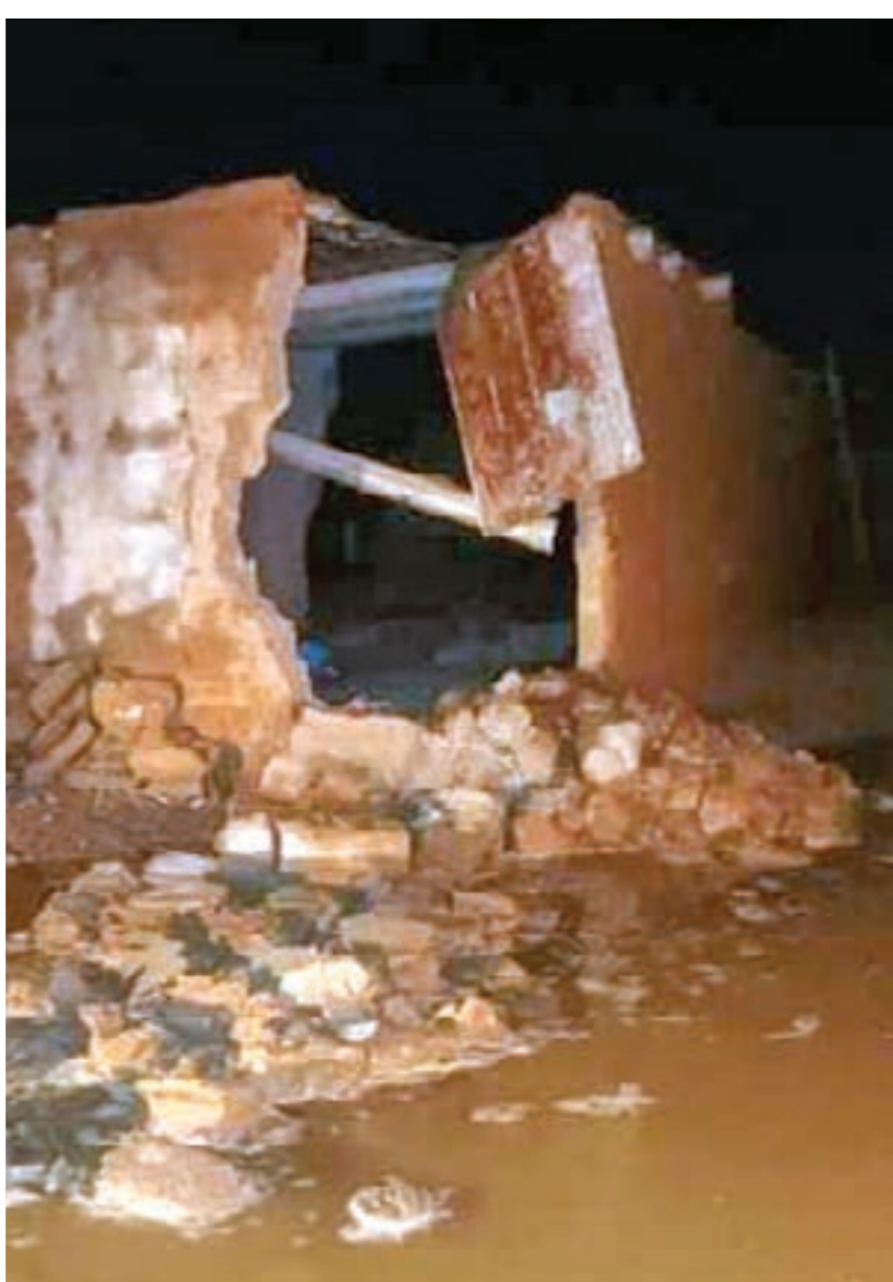
• منازل انهارت بسبب السيول في أوباري

وقال الجهاز في بيان، إن تمرکزاته الجديدة جاءت بعد إعادة الانتشار لفرق الطوارئ بإدارة فروع المدن الجنوبية، ودعم إدارة فروع المدن الغربية. واتممت أربعة منازل في محلة المشروع بمدينة أوباري، جراء هطول الأمطار الغزيرة، فيما يجري جهاز الإسعاف حصر الأضرار وتقديم الخدمات الإسعافية.