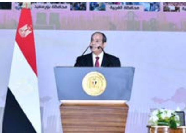
• الرئيس السيسي خلال إعلان ترشحه للرئاسة

دولار العام الماضي. وتحتاج مصر إلى تنفيذ تلك الخطة للحصول على جمیع الاموال.