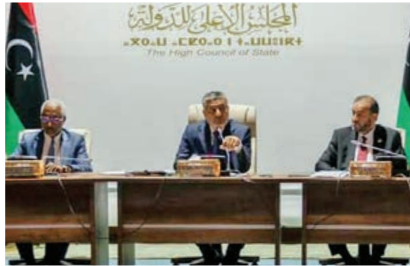
• المجلس الأعلى للدولة يزيده المشهد السياسي تعقيدا بقراره الأخير

وأستأنف المجلس الأعلى للدولة جلسته العامة رقم (91) بمقره في مدينة طرابلس، التي تمحور النقاش خلالها حول القوانين الانتخابية التي أعدتها لجنة «6+6»، وشهدت الجلسة تصويت أعضاء المجلس على مخرجات هذه اللجنة الموقعة في بوزنيقة.