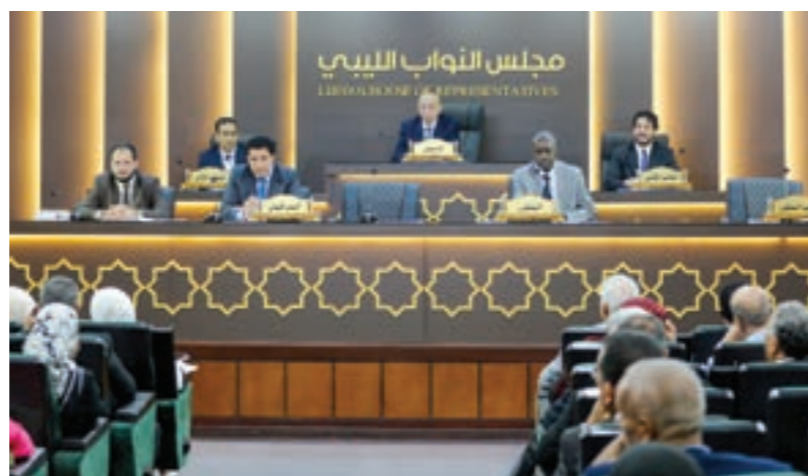
• جلسة مجلس النواب التي أقر فيها القوانين الانتخابية، بنغازي 2 أكتوبر 2023

أما شريك مجلس النواب في لجنة «6+6»، وهو مجلس الدولة فقد كان مسرحاً يوم الأربعاء، لإلقاء تلك الشراكة وسط انقسام بين أعضائه. وشدد رئيس المجلس الأعلى للدولة، محمد تكالة، خلال جلسة بطرابلس على «تمسك المجلس بالمرخبات الصادرة عن اللجنة المشتركة لإعداد القوانين الانتخابية»، رافضاً إجراء أي تعديلات أخرى عليها. واعتبر عضو المجلس الأعلى للدولة، نعيمه الحامي، أن تعديل مجلس النواب وتغييره لقوانين الانتخابات مرفوض، ويعني «إلغاء عودة لجنة (6+6) لمخرجات بوزنيعة المغربية واعتبارها أساساً لحوار حول مقبلة». مشيرة إلى رفض إجراء انتخابات مجلس الشيوخ قبل انتخابات مجلس النواب، ورفض السماح للعسكريين ومزدوجي الجنسية بالترشح. بدوره قال عضو مجلس الدولة، بلقاسم قزيط، معلناً على قرار حل لجنة «6+6»، إن القوانين الانتخابية الصادرة عن اللجنة لا يمكن إلغاؤها، مضيفاً أن «ما وقع هو حل للجنة بطريقة مريبة وغير قانونية»، لتستمر لعبة «بنغ بونغ» القرارات بين مجلسي النواب والدولة.