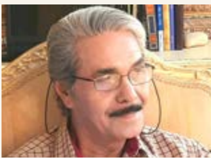
بقلم: البوصيري عبدالله

«ها أنا - عزيزي القارئ - أصل إليك أخيرا عبر هذه الصفحات من مشروعي الثقافي - الوطني الأعظم، الأقرب إلى قلبي، وهو مشروع وهبته جزءا كبيرا من عمري إذ بدأت منذ ما يتيف عن ثلاثة عقود. بدأت مراحلها الأولى بتجميع المصادر والمراجع، واقتفاء كل أثر له علاقة ببلادنا العزيزة، ومطابقتها تلك الآثار في المكتبات العامة والخاصة، وملحقتها داخل حدود الوطن وخارجه، ورصدها بلغة أمنا أو بلغة غزاتها، ثم الشروع في قراءة أو ترجمة ما نالته أيادينا ومقارنته مع بعضه بعضا لفرز الحب عن الحسك، ولمعرفة السليم من السقيم، وبعد ذلك جاءت مهمة ترتيب المواد المراد تناولها ترتيبا أبجديا، ثم أتت مرحلة التحرير، فالتصحيح، فالتقييم على جهاز الحاسوب ثم الدخول في المتاهة بحثًا عن الجهة القادرة على تحمل مسؤولية النشر والرغبة فيه أيضا».