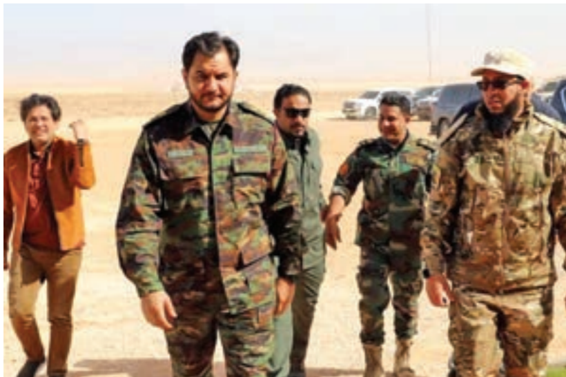
صدام حفتر يزور الكتبية 302 صاعقة

الأسلوب الثاني يجري تحميل السفن في بنغازي، وتجر إلى دول أعضاء أخرى، لتفريغ