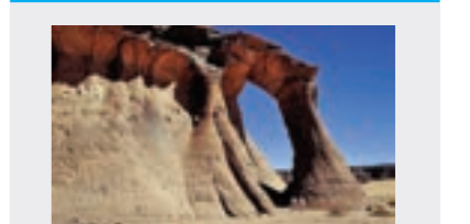
جبال أكاكوس.. لوحة طبيعية تتحدى الزمن