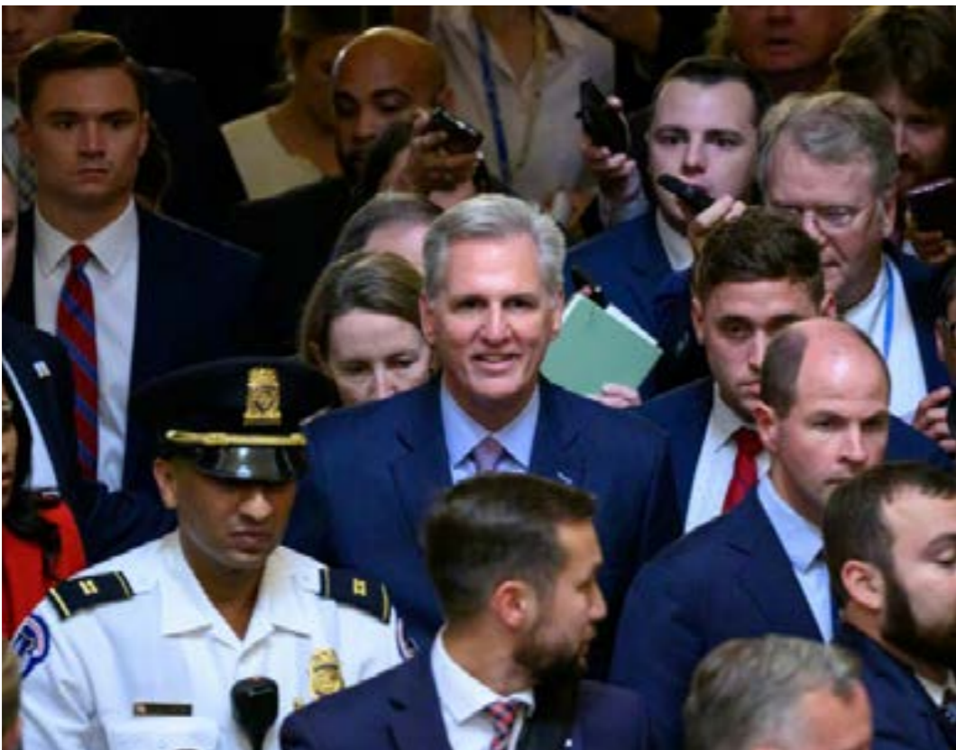
• النائب الجمهوري عن ولاية كاليفورنيا كيفن مكارثي يخرج من قاعة مجلس النواب في واشنطن بعد عزله من منصب رئيس مجلس النواب

ويعود آخر تصويت أجراه مجلس النواب الأميركي لعزل رئيسه إلى أكثر من قرن من الزمن، في حين أنها المرة الأولى على الإطلاق التي يطيح فيها المجلس برئيسه.