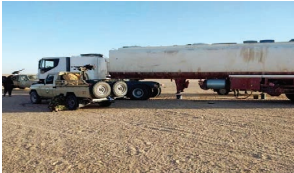
تهريب الوقود في ليبيا عرض مستمر