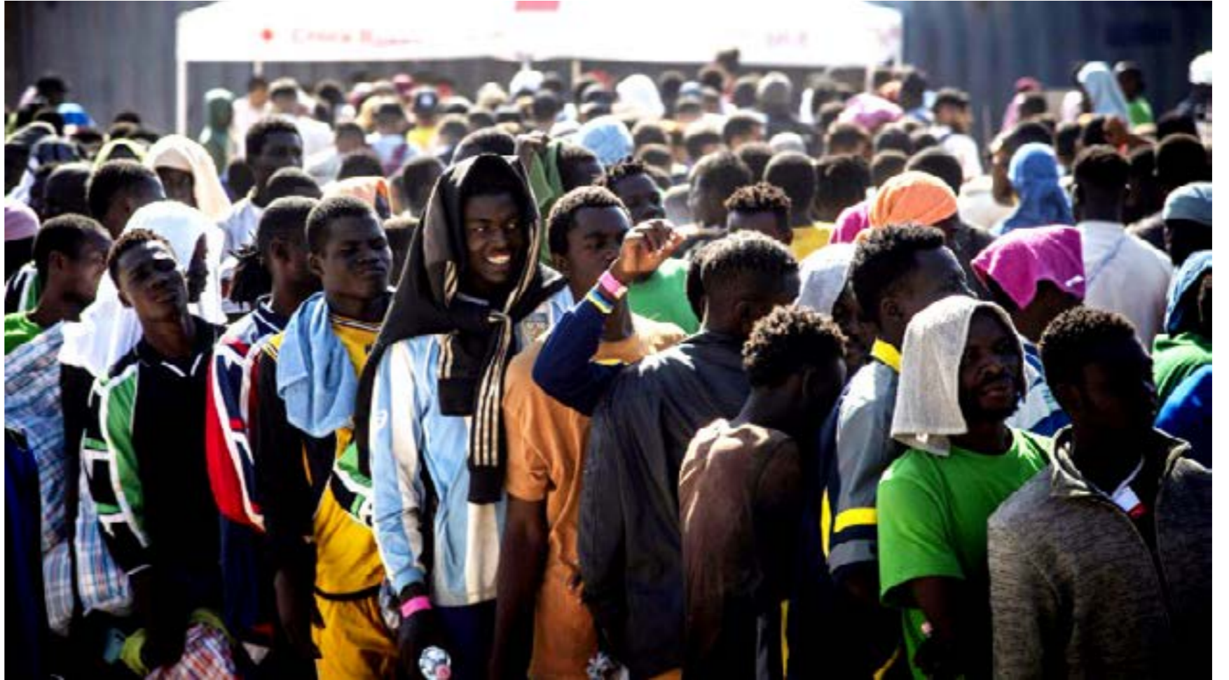
• مهاجرون يحتشدون أمام مركز استقبال على جزيرة لامبيدوسا الإيطالية في 14 سبتمبر 2023

وأضاف الناطق «ما زال هناك الكثير من العمل الذي يتعين القيام به، ونحن نعالج هذا». ومضى يقول إنه لا يوجد بعد إطار عمل رسمي وأن أصحاب المصلحة يعملون على العناصر القانونية وغيرها. ولم يتطرق المتحدث في رده إلى تفاصيل حول اتفاقية الدفاع الأميركية السعودية.