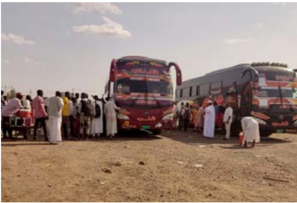
• نازحون يفرون من ولاية القصارف في شرق السودان، 3 يوليو 2023 (أرشيفية، أف ب)

وبعد عام على انتهاء مفاعيل هدنة أعلنت في أبريل 2022، لا تزال حدة المعارك منخفضة بشكل ملحوظ. إلا أن المنظمات أوضحت أن رغم ذلك فإن «التنافس على إيرادات الموانئ والتجارة والخدمات المصرفية والموارد الطبيعية والاشتباكات المسلحة المتفرقة تزيد من التوترات الحالية». وللتخفيف من معاناة السكان، طالبت المنظمات طرفي النزاع بـ«التعاون للاستجابة للاحتياجات جميع اليمنيين» والمجتمع الدولي بـ«دعم خطة إنعاش اقتصادي ممولة». كما ناشدت الجهات المانحة من أجل «سدّ فجوة التمويل الإنساني والبالغ 70٪ للقطاعات الحيوية، بما في ذلك الحماية والصحة والتعليم». وفي 18 أغسطس، أعلن برنامج الأغذية العالمي التابع للأمم المتحدة تقليص مساعداته الغذائية لأكثر من أربعة ملايين يمني اعتباراً من الشهر الجاري بسبب أزمة تمويل حادة. وسبق أن قصص البرنامج في يونيو 2022، مساعداته إلى ما دون 50 بالمائة إلى اليمنيين للسبب نفسه.