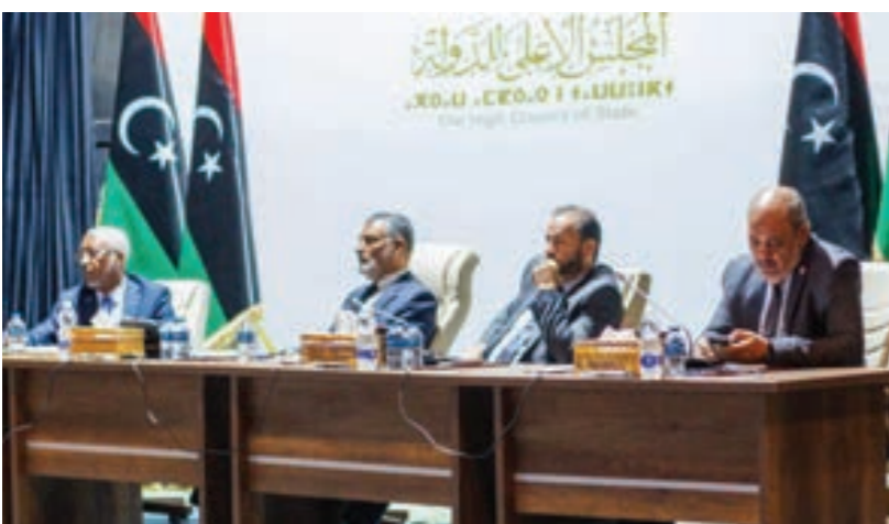
• جلسة مجلس الدولة التي رفض فيها تعديل قوانين الانتخابات، طرابلس 4 أكتوبر 2023

الصادر في 2021. كما جرى ربط إجراء الانتخابات البرلمانية بضرورة انعقاد الانتخابات الرئاسية، ما يؤكد تمسكهم بخطة البقاء في مناصبهم، إلى جانب بنود عدم إقصاء أي راعب في الترشح للانتخابات الرئاسية مع إمكانية العودة لمنصبه في حال فشله. وعقب إعلان مجلس النواب دعا باتيلي إلى تسهيل حوار عاجل بين الأطراف الرئيسية في ليبيا للتوصل إلى تسوية سياسية شاملة.