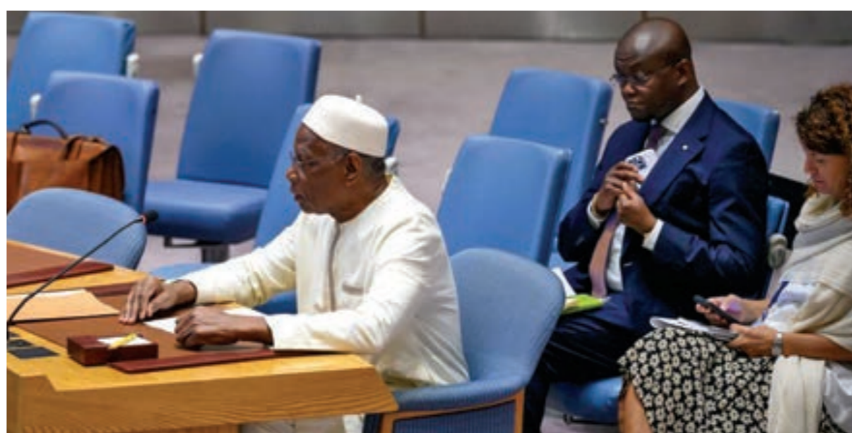
باتيلي في إحاطة أمام مجلس الأمن الدولي، 22 أغسطس 2023

اجتماع المجلس الذي عقد أغسطس الماضي، وجاء البند المتعلق بإنشاء حكومة وحدة جديدة الأكثر إثارة للخلاف، حيث عرضت الأمم المتحدة في وقت سابق هذا التحرك، معبرة عن قلقها من أنه سيقضي على أي حفز لدى أصحاب المصلحة للمضي قدماً في الالتزامات المتعلقة بالاستحقاقات الانتخابية.