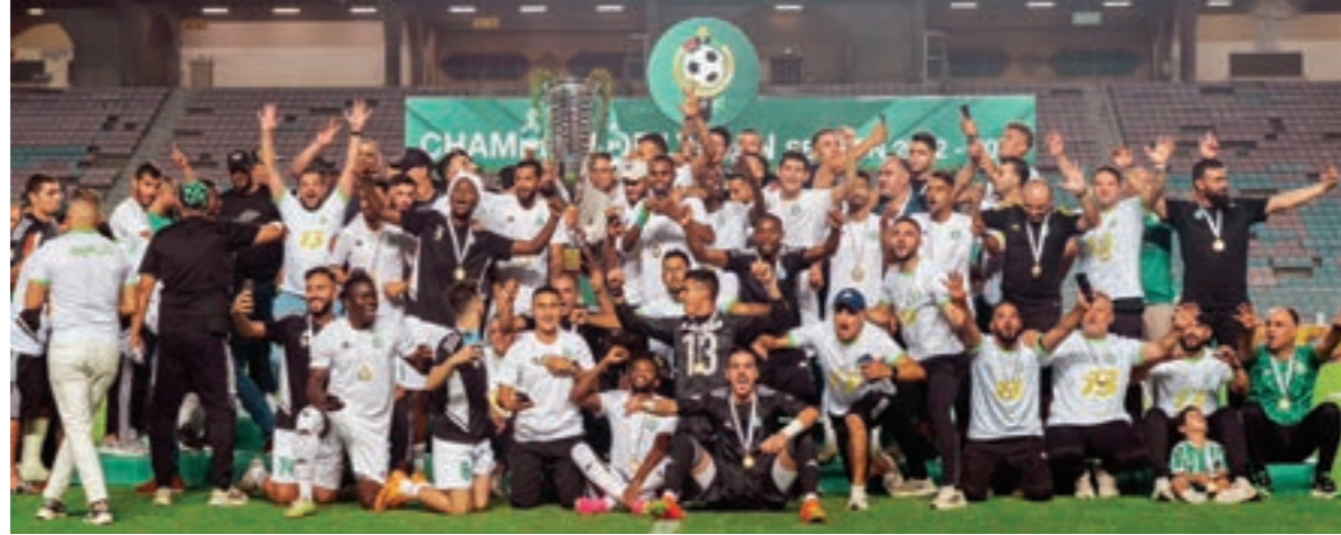
• فرحة الأهلي طرابلس بالتتويج بلقب الدوري الليبي الممتاز الأخير في موسم 2022-2023

وأضاف: «نظراً لهذه الظروف القاهرة، الأمر الذي حتم علينا إيقاف النشاط الرياضي بالاتحاد تضامناً مع إخواننا بمدينة درنة وما جاورها، وترتب على ذلك التأخر في انطلاق مسابقات الموسم