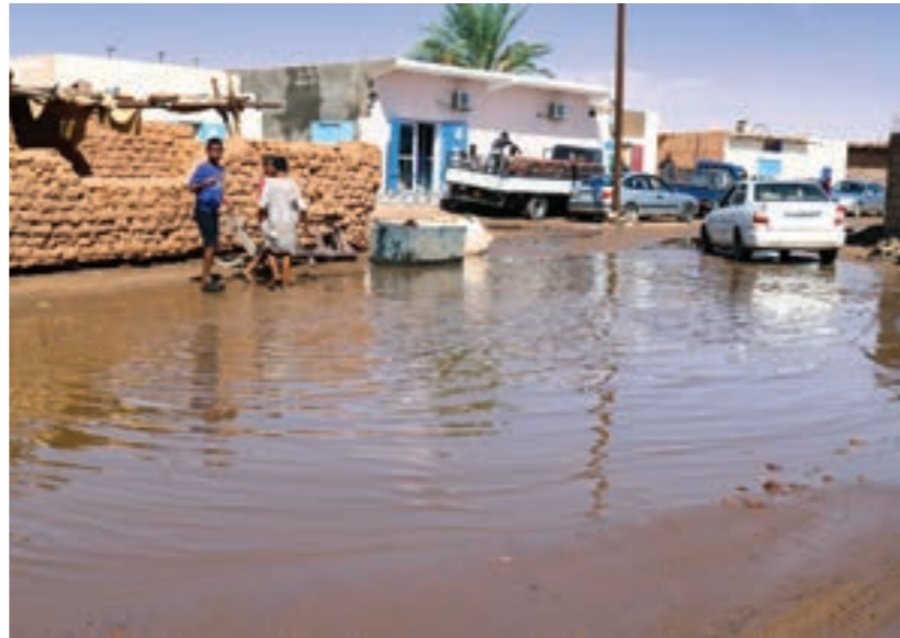
• آثار الأمطار في حي تلقين ببلدية أوباري، 2 أكتوبر 2023