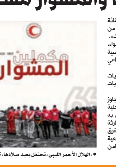
• الهلال الأحمر الليبي، تحتفل بعيد ميلادها، 5 أكتوبر 2023

الطبيعية، فقد قامت الجمعية بتنفيذ عمليات الإغاثة الطارئة وتوفير المساعدات الضرورية للمتضررين من الفيضانات والزلازل، والأعاصير، وغيرها من الكوارث. والجمعية أكدت أنها «تعمل على توفير الإسوا، والغذاء، والماء النظيف، والرعاية الصحية الأساسية للمتضررين، وتقديم الدعم النفسي والاجتماعي للمتأثرين بتلك الكوارث». وليلة مسيرتها تغلبت الجمعية على «تحديات عديدة، مثل قلة الموارد والتمويل، والصعوبات اللوجستية في الوصول إلى المناطق المتضررة». وترى الجمعية أنها رغم الصعوبات «استطاعت تجاوز تلك التحديات من خلال التعاون مع المؤسسات المحلية والدولية، وبفضل التفاني والاجتهاد الذي يتحلى به أعضاء الجمعية». ومنذ 10 سبتمبر الماضي ومع كارثة الفيضانات التي ضربت مدن الشرق الليبي تبلي فرق الهلال الأحمر الليبي بلاءً حسناً، وتستمر جمعية الهلال الأحمر الليبي في رفع راية العطاء والتضامن الإنساني، كما تتطلع إلى المستقبل بثقة وأصرار.