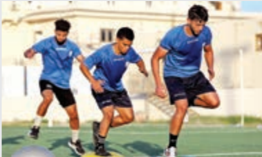
• جانب من تدريبات فريق كرة القدم الأول بنادي الخمس