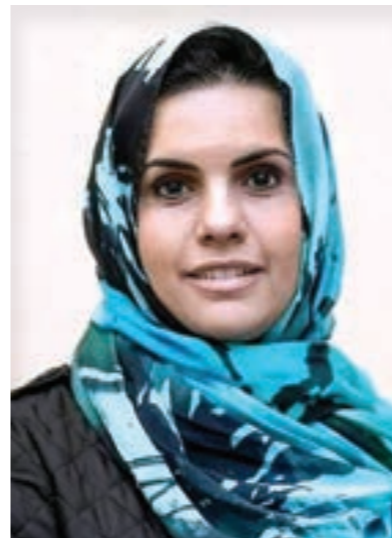
• الزهران لنقي

وردا على الاتهامات الموجهة إلى المحتجزين الثلاثة، قال مركز ليبيا للدراسات الاستراتيجية إن مدير فرعه في بنغازي، سراج دغمان، كان حريصا على أن يطلع الجهات كافة على أنشطة المركز وعمله، مما «وفر مناخا من الثقة والانفتاح والارتياح مع الجهات الرسمية»، متابعًا: «القيادة