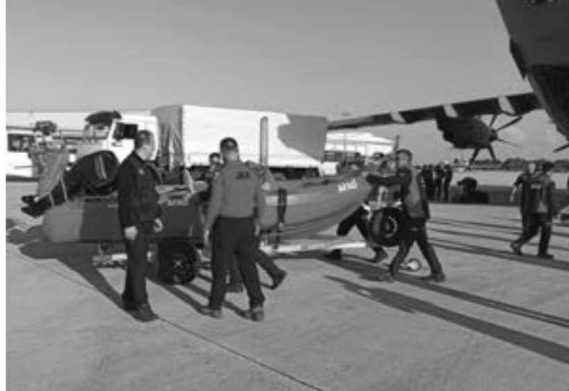
• المساعدات التركية تصل الشرق الليبي

ليبيا قيادة وحكومة وشعباً في ضحايا الفيضانات، داعياً الله أن يرحم الضحايا، وأن يلهم نديم الصبر والسلوان، وأن يمن على المصابين بالشفاء العاجل».