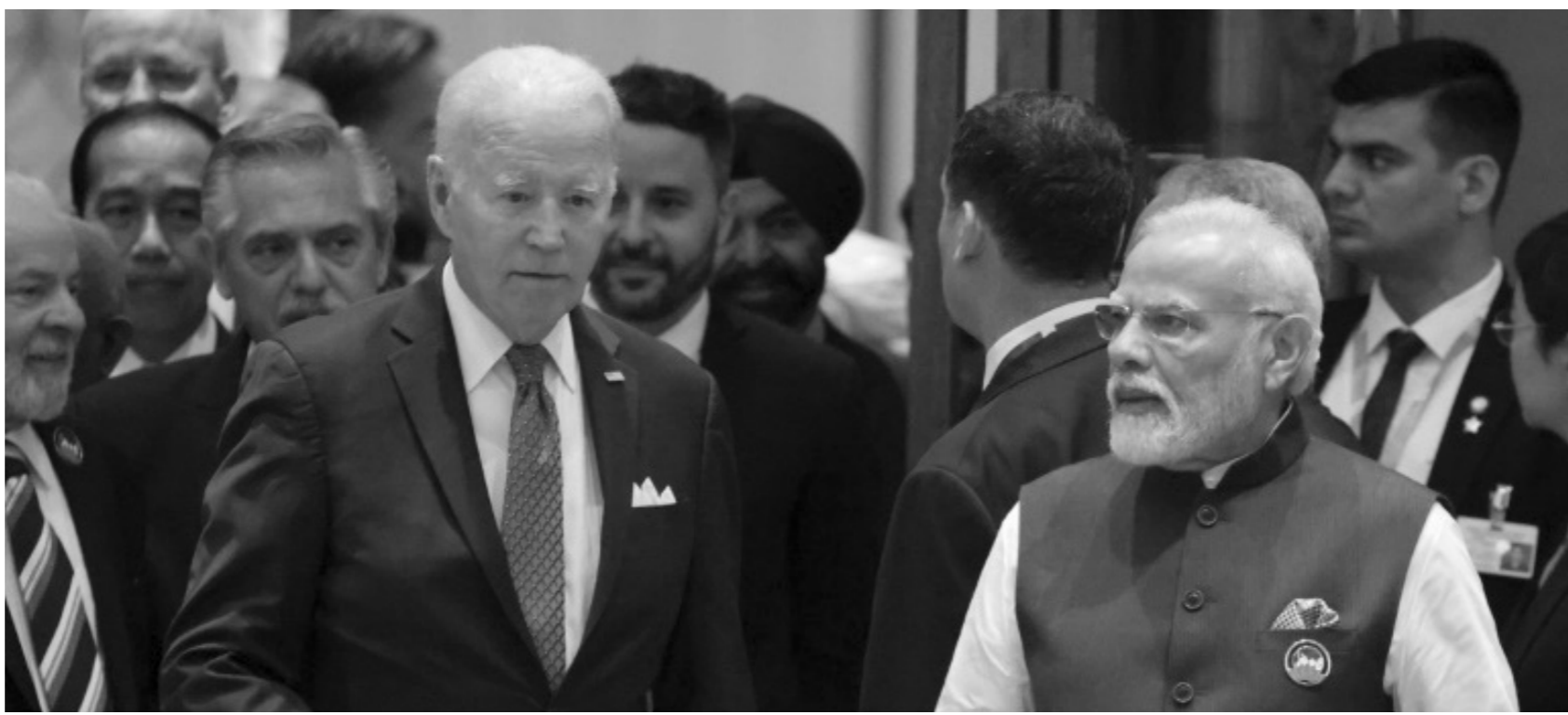
الرئيس الأميركي جو بايدن ورئيس الوزراء الهندي ناريندرا مودي في الجلسة الافتتاحية لقمة قادة مجموعة العشرين في نيودلهي في 9 سبتمبر 2023.

وتقوم بكين من خلال «مبادرة الحزام والطريق» التي تأتي ضمن إطار برنامج «طرق الحرير الجديدة» باستثمارات ضخمة في عدد من الدول النامية لبناء البنية التحتية. ويهدف هذا المشروع إلى تحسين العلاقات التجارية بين آسيا وأوروبا وأفريقيا وحتى خارجها، من خلال بناء الموانئ والسكك الحديدية والمطارات أو المجمعات الصناعية، مما يسمح للعلاقات الآسيوية بالوصول إلى المزيد من الأسواق وفتح منافذ جديدة أمام شركائهم. غير أن معارضيهم يعتبرون أن بكين تهدف من خلاله إلى تعزيز نفوذها السياسي، كما ينتقدون الديون الخطرة التي يرتبها على الدول الفقيرة. وكان جو بايدن قد وصفه في يونيو الماضي بأنه «برنامج الديون المصادرة»، الذي «لن يذهب بعيداً جداً».