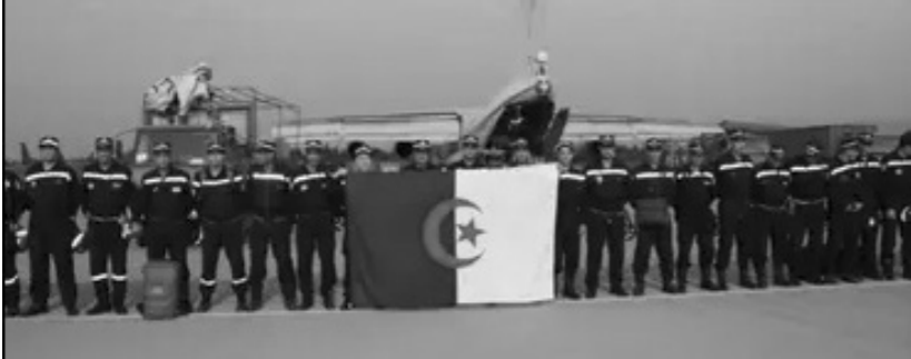
• فرق الإنقاذ الجزائرية وصلت الأراضي الليبية

الدعم للفيضانات في شرق ليبيا . بينما قدمت السفارة الإيطالية في طرابلس تعازيا في ضحايا العاصفة «دانيال». وقالت السفارة على حسابها بموقع «إكس»: «نتضامن مع السلطات المحلية والمنظمات المشاركة في جهود الإغاثة». معبرة عن استعدادها للمشاركة في جهود الإغاثة. وأكدت الوزارة أن المساعدة بلاها للتدخل من خلال هياكل المساعدة الإنسانية الخاصة بها.