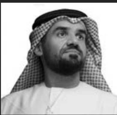
• حسين الجسمي