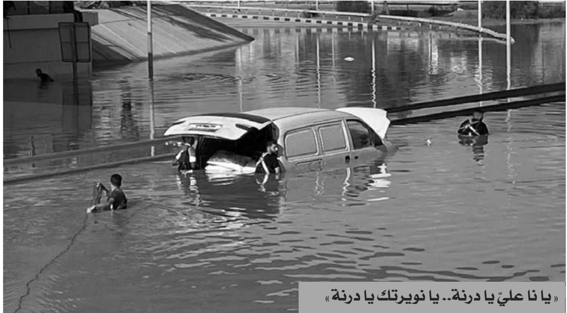
«يا نا علي يا درنة.. يا نوירתك يا درنة»

وأوضح أحد المتابعين أن مواقع التواصل الاجتماعي نفسها تستخدم في نسخها العربية كلمة رائج، متسائلاً: «فما الحاجة إلى التعريب والإجازة؟». وقال آخر «مجمع الخالدين أصبح تريند». وعلق أحد المتابعين ببيت من قصيدة «اللغة العربية» للشاعر حافظ إبراهيم يقول فيها: «كيف أضييق اليوم عن وصف آله.. وتنسيق أسماء لمخترعات».