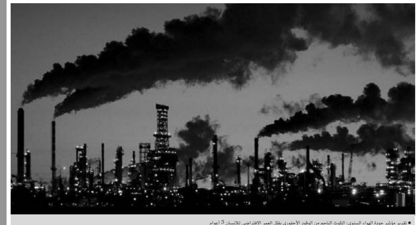
● تقرير مؤشر جودة الهواء السنوي: التلوث الناجم من الوقود الأحفوري يقلل العمر الافتراضي للإنسان 5 أعوام