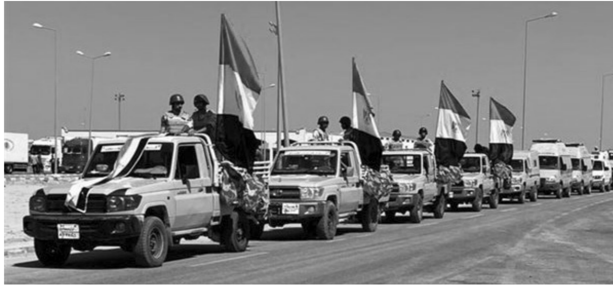
• وصول المساعدات المصرية للأراضي الليبية

وفي نيويورك، وقف أعضاء مجلس الأمن الدولي، الثلاثاء، دقيقة صمت، حدادا على أرواح ضحايا فيضانات ليبيا وزلزال المغرب.