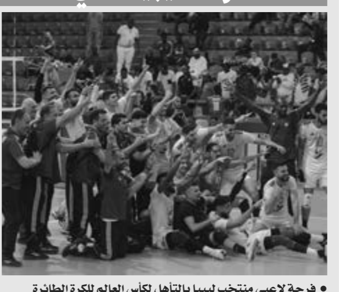
فرحة لاعبي منتخب ليبيا بالتأهل لكأس العالم لكرة الطائرة

وسط الأحرار التي تعم ليبيا على ضحايا العاصفة التي ضربت مدن الساحل الشرقي وعلى رأسها درنة، رسم المنتخب الليبي لكرة الطائرة بسمة بنجاحه في التأهل إلى كأس العالم المقرر أقامتها في اليابان العام 2025، بعد الفوز على نظيره الكاميروني 3-1 في لقاء تحديد المركز الثالث، ليجرز الميدالية البرونزية في بطولة أفريقيا التي أقيمت في العاصمة المصرية القاهرة، والمؤهلة إلى نهائيات مونديال الطائرة. المنتخب الليبي تأهل رفقة المنتخبين المصري والجزائري إلى مونديال العالم المقبل، ونافس المنتخب الليبي بقوة قبل الخسارة أمام نظيره الجزائري بنتيجة 3-2 في الدور نصف النهائي، بعدما خطف المنتخب الجزائري الشوط الخامس بنتيجة 3-صفر.