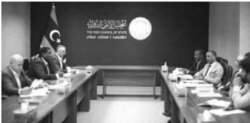
• توصيات اللجنة المشتركة من مجلسي النواب والدولة «6+6»، لم تحسم الخلاف حول قوانين الانتخابات

والمجلس الرئاسي، توحيد صفوفهم وتقديم التنازلات اللازمة لإجراء الانتخابات. إذن هؤلاء هم المعنيون بتشكيل «حكومة تصريف أعمال» مهمتها الجديدة قيادة البلاد نحو إجراء انتخابات نزيهة، وفق المندوبية الأميركية. وقد لا يعني ذلك تشكيل حكومة جديدة، بل دمج الحكومتين، لذلك جدد رئيس مجلس النواب عقيلة صالح خلال لقائه المبعوث الأممي عبدالله باتيلي، السبت الماضي «ضرورة تشكيل حكومة موحدة في آخر البلاد مهمتها الأساسية إجراء الانتخابات»، وفقاً للمكتب الإعلامي لرئيس مجلس النواب، الذي أكد بحث «مستجدات الأوضاع السياسية في ليبيا، ولا سيما المجهودات المبذولة لإجراء الانتخابات الرئاسية والبرلمانية، في مقدمتها ما توصلت إليه اللجنة المشتركة لإعداد القوانين الانتخابية (6+6)». يأتي ذلك في وقت استمرت الخلافات بين أعضاء لجنة «6+6» المكلفة التي ضمها مجلس النواب والدولة بالإعداد للقوانين الانتخابية، فقد دار في آخر قارون حول المادة 85 من قانون الانتخابات الرئاسية والتي تنص على ضرورة إشراف حكومة جديدة على الانتخابات. كما أن عدداً من أعضاء اللجنة الأساسية التي ضمها مجلس النواب الوطنية المؤقتة، ويقفون وراء تسريب بيان بشأن انتهاء أعمال اللجنة بتضمين التعديلات المطلوبة كافة في قوانين الانتخابية. الاطار الدستوري. يذكر أن تشكيل حكومة جديدة كان من ضمن البنود الأساسية التي ضمها لجنة «6+6» في نصوص القوانين الانتخابية التي انتهت إليها، في ختام لقاءاتها في ابوزنقة المغربية مطلع يونيو الماضي، وكانت من النقاط الجدلانية في القوانين الانتخابية، بالإضافة للنقاط الخلافية السابقة المتعلقة بترشح العسكريين ومزدوجي الجنسية للانتخابات الرئاسية والبرلمانية.