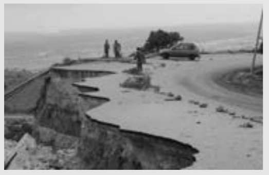
● الطرق البرية تضررت بشكل كبير في درنة من الإعصار دانيال

أعلن وزير الشباب بحكومة الوحدة الوطنية الموقته فتح الله الزني، مساء الثلاثاء، بدء تسيير الجسر الجوي من مصراتة ومعيتيقة إلى الأبرق لنقل المساعدات والفرق المختصة في عمليات الإغاثة والبحث والإنقاذ للتعامل مع آثار العاصفة «دانيال». وأشار الزني، في مؤتمر صحفي للفرق الحكومي للطوارئ والاستجابة السريعة في طرابلس، إلى وصول سيارات إسعاف من مؤسسة النفط والإسعاف العمومي بمساندة من المؤسسة. وقال إن وزارة الداخلية أرسلت شحنت إغاثة لتعزيز جاهزية مديريات الأمن بالمنطقة الشرقية، كما أرسلت هيئة المفقودين قافلة تصل مساء اليوم إلى درنة بالتنسيق مع جهاز المباحث الجنائية والنيابة العمومية. وأوضح أن الفيالق الشبابية «مزة خون» استلمت مواقعها، وتوزعت على 4 فرق لمساندة الجهود الإغاثية للنازحين ومساندة أجهزة الدولة بالتنسيق مع الجهات المختصة والقطاع الخاص، فيما تصل فرقة إسناد شبابي تطوعية من مدينة طبرق لتعزيز الإسناد الشبابي في درنة. ولفت إلى أن شركة الكهرباء بدأت في تسيير القافلة الثانية لتعزيز الفرق العاملة في البلديات المنكوبة، لافتا إلى أن قطاع المواصلات بدأ فتح المسارات الترابية بعد قطع الطرق جراء السيول حتى تتمكن فرق الإغاثة من الدخول إلى درنة.