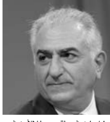
رضا بهلوي في مؤتمر ميونخ للأمن، في 18 فبراير 2023. (أ ف ب)