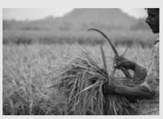
● مزارع في حقن للأرز بالهند

بلغت أسعار الأرز في أغسطس 2023 أعلى مستوياتها في العالم منذ 15 عاما مع ارتفاعها بنسبة 9.8 ٪ على شهر، بعد القيود على التصدير التي فرضتها الهند. جاء ذلك في إعلان لمنظمة الأغذية والزراعة للأمم المتحدة «فاو» أشارت فيه إلى أن أسعار المواد الغذائية على الصعيد العالمي سجلت في مجملها تراجعا طفيفا خلال أغسطس متأثرة بانخفاض أسعار الحبوب والزيوت النباتية ومشتقات الحليب. وأوضحت «فاو» في تقريرها الشهري أن أسعار الأرز ارتفعت بنسبة 9.8 ٪ مقارنة بشهر يوليو ما يعكس الاضطرابات المسجلة بعد حظر الهند صادرات الأرز الأبيض. وأضافت أن الغموض الذي يلف مدة الحظر ومخاوف من القيود على التصدير دفعت الأطراف الفاعلة الرئيسية في سلسلة التوريد على الاحتفاظ بمخزونها وإعادة التفاوض بشأن العقود أو التوقف عن تقديم عروض أسعار ما حصر التجارة بكميات صغيرة وبمعدود بيع متفق عليها سابقا. ويشكل الأرز غذاء أساسيا في العالم وارتفعت الأسعار في الأسواق العالمية بشكل كبير جراء جائحة «كورونا» وتداعيات ظاهرة «إل نينيو» المناخية على الإنتاج.