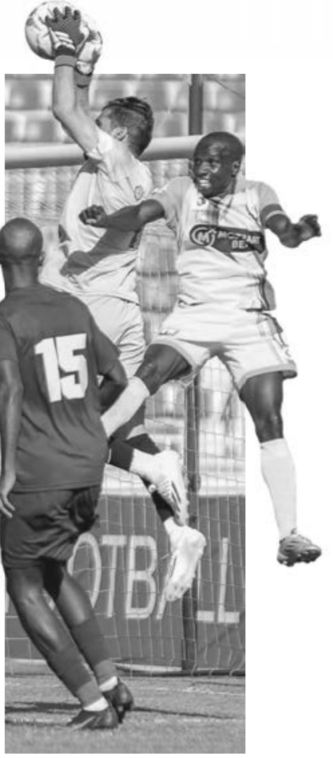
الهلال أمام كاكاميفيا الكيني في الكونفدرالية