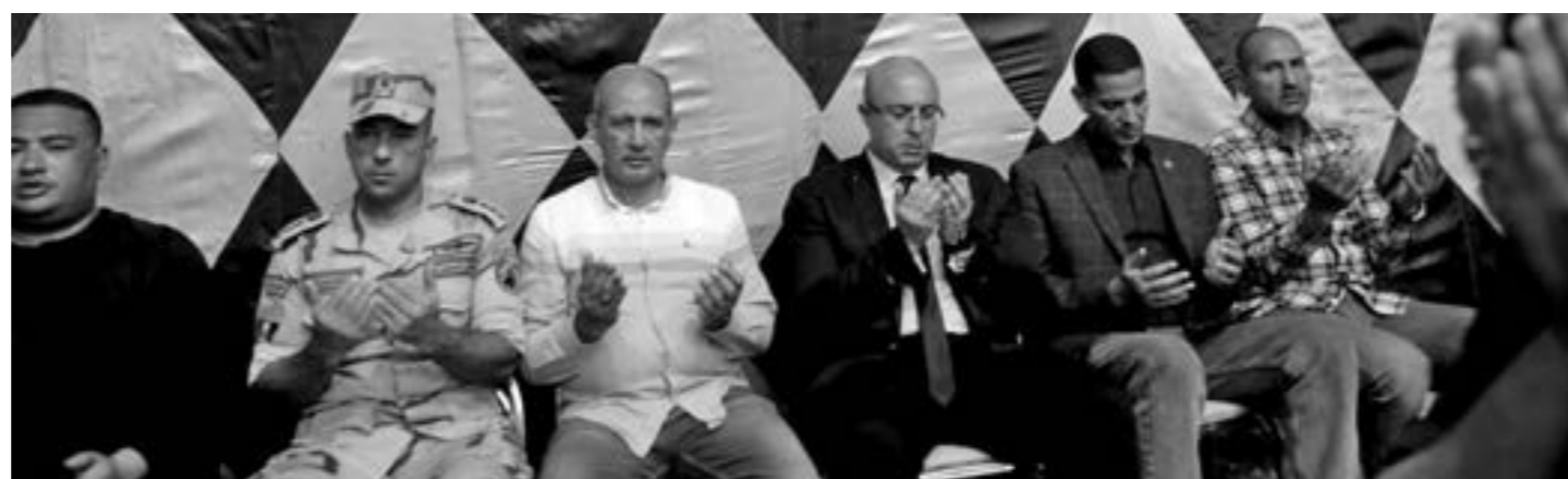
من عزاء أبناء قرية الشريف بمحافظة بني سويف المصرية، الذين توفوا نتيجة العاصفة دانيال في درنة