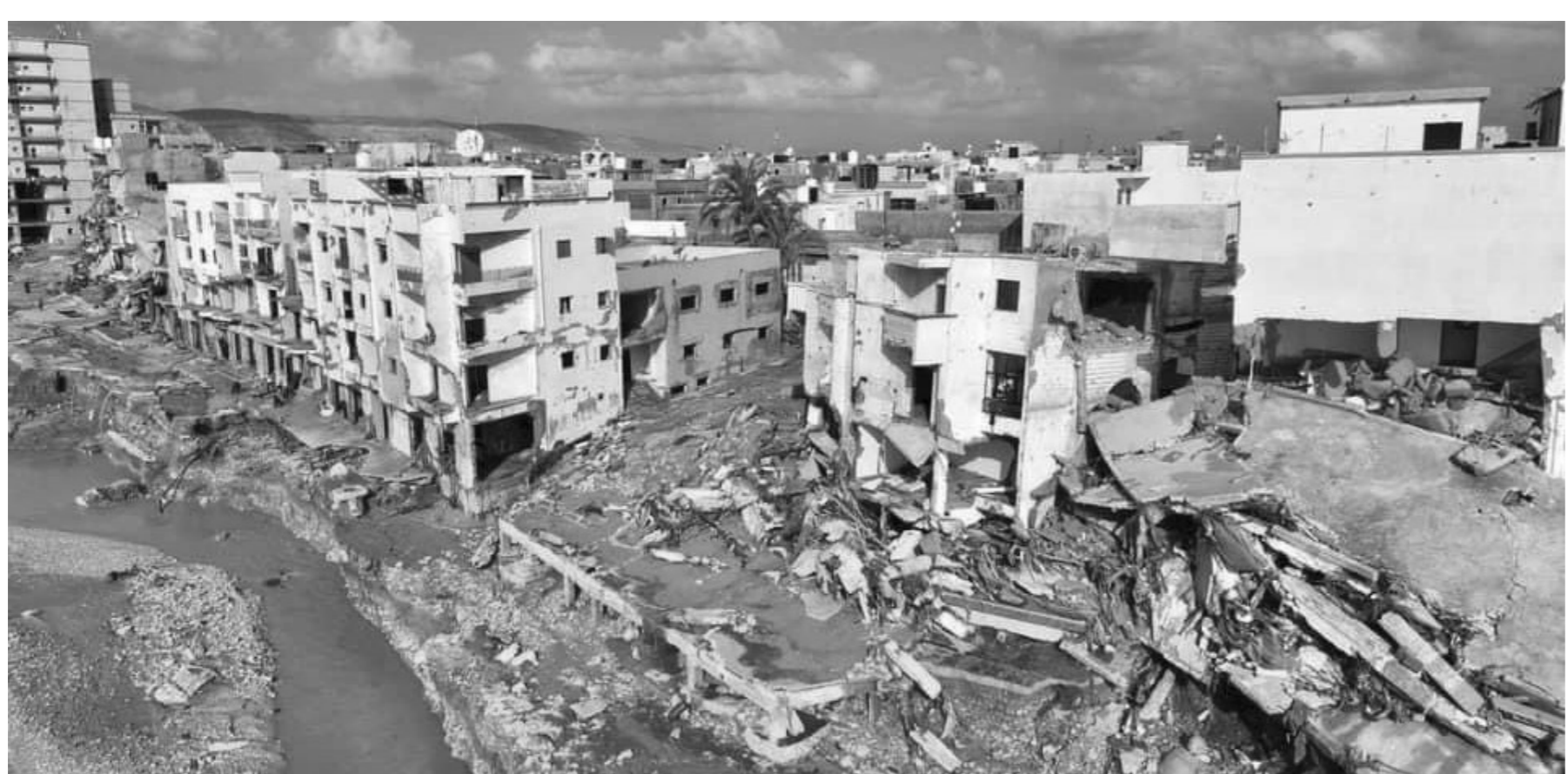
الدمار الذي لحق بمدينة درنة بعد العاصفة دانيال