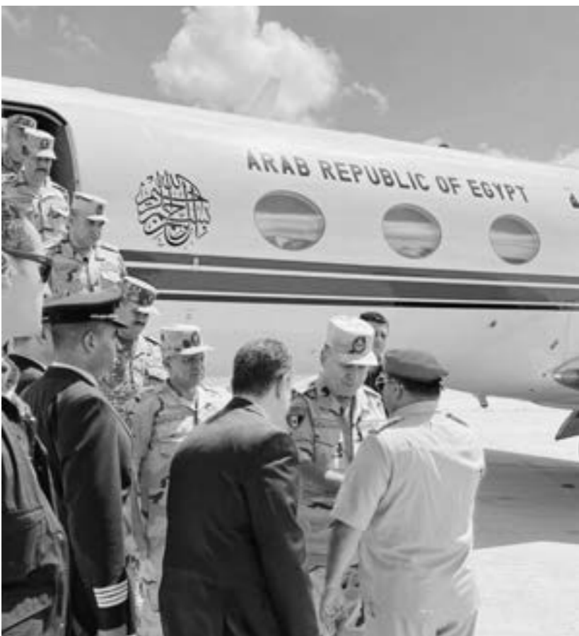
• الوفد المصري برئاسة الفريق أسامة عسكر رئيس أركان حرب القوات المسلحة يصل ليبيا 12 سبتمبر 2023

◀ مصر: جسر جوي بمواد طبية وغذائية و25 طاقم إنقاذ.. ووفد عسكري ◀ الجزائر: مساعدات عاجلة تصل في 8 طائرات.. والإمارات ترسل مساعدات وفرق إغاثة