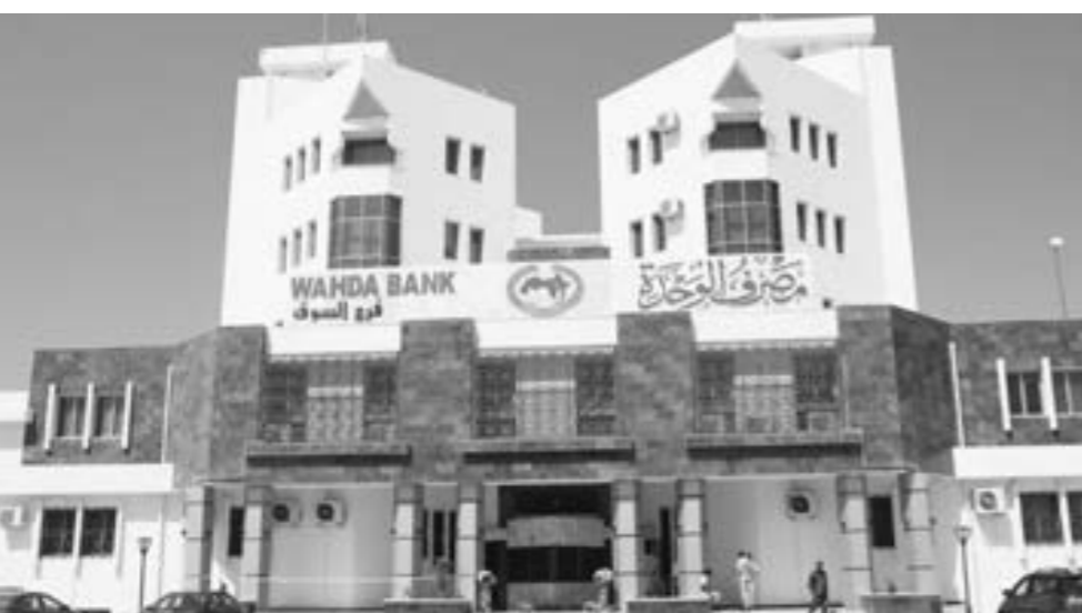
مقر مصرف الوحدة، فرع السوق في بنغازي

الحكومة والمواطنين من السيولة لدعم المناطق المنكوبة.. وعلى الرغم من التداعيات الإنسانية والخسائر الفادحة، فإن العاصفة «دانيال» أكدت وحدة الليبيين، وتضامهم في المواقف العصبية على المستويات كافة، متجاوزين الخلافات السياسية التي أسهمت على مدى أكثر من عشر سنوات في تقسيم البلاد. في شأن آخر، أصدر محافظ مصرف ليبيا المركزي، الصديق الكبير، تعليماته بصرف المخصصات المالية لمركز سبها الطبي حتى يتمكن من أداء المهام الموكلة له خدمة للمرضى، خلال لقائه مع عضو المجلس الرئاسي موسى الكوني صباح الأحد الماضي. وتمحور لقاء الكوني والكبير حول صرف المخصصات المالية لمركز سبها الطبي، بالإضافة إلى بحث آليات تذليل المشاكل والصعوبات المالية التي تتوق عن عمل المستشفى باعتباره وجهة المرضى بالمنطقة الجنوبية، واستعراض آخر تطورات توحيد المصرف والوقوف على جهوده في تعزيز الإفصاح والشفافية.