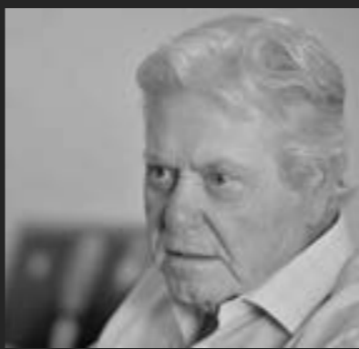
• حسين فهمي