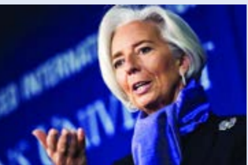
● رئيسة البنك المركزي الأوروبي كريستين لاغارد