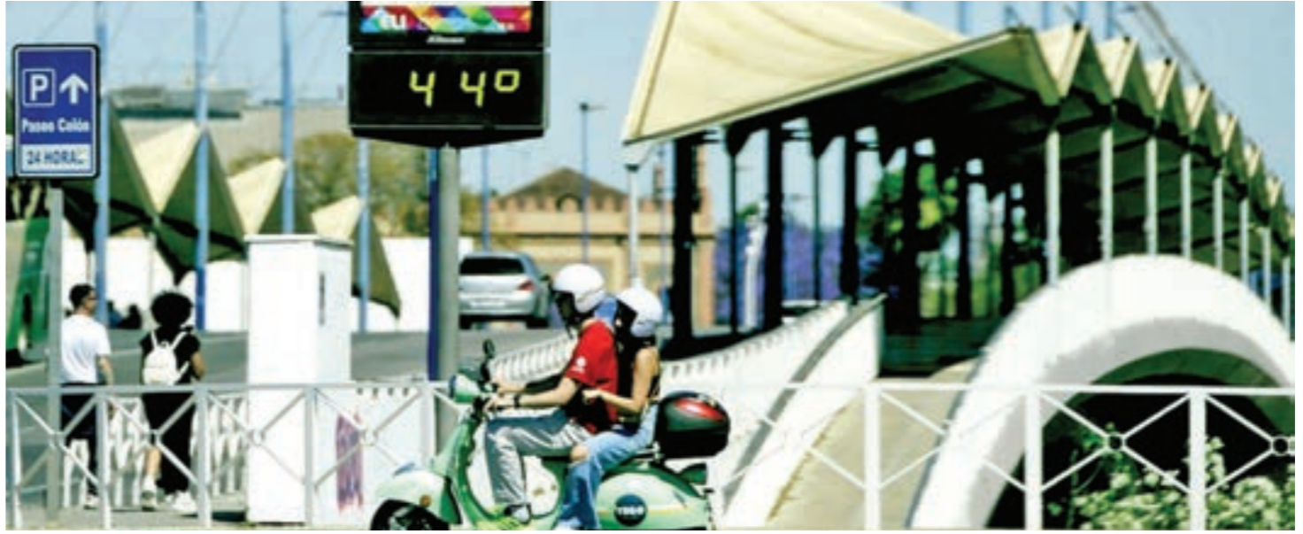
◉ لافتة تظهر درجات الحرارة التي بلغت 44 درجة مئوية في إشيلية

رفضت صربيا استقلال البوسنة والهرسك بشدة مبدية