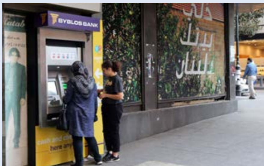
عميلتان تستخدمان ماكينة الصراف الآلي خارج فرع بنك «بيبلوس»، في بيروت