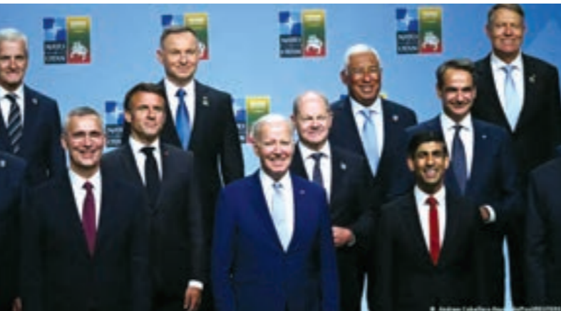
◉ أعضاء حلف شمال الأطلسي خلال قمتهم في فيلنيوس

ولكن روسيا الجديدة الرئيسي يتعلق بمدى أهمية هذه الأسلحة السبالة، أما بالنسبة للولايات المتحدة التي زومت أوكرانيا بالخاثر العقودية هذه ستعطي ميزة لتعويض النقص عن المصفية 155 ميليمتر، هذه القنابل تنفجر فوق سطح الأرض بامتار وتتوزع الكرات