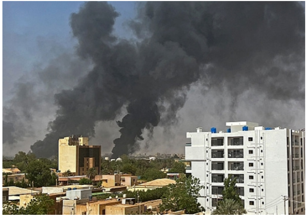
• دخان يتصاعد جراء المعارك في السودان