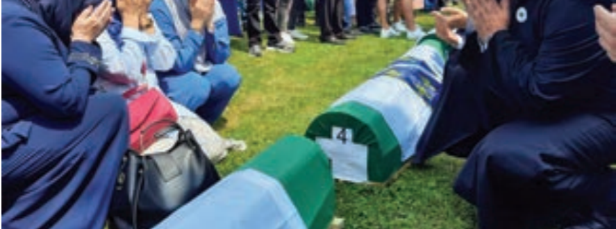
◉ مفتي البوسنة يصلي مع العائلات فيما تنتظر توأبيت أقاربهم الدفن

وإل نينيو، هي ظاهرة مناخية تحدث مرة كل سنتين إلى سبع سنوات وتستمر عادة من 9 إلى 12 شهراً، وترتبط بارتفاع درجات حرارة سطح المحيط في وسط وشرق المحيط الهادئ. لكن الحلقة الحالية «تأتي في سياق مناخ جرى تغييره بسبب الأنشطة البشرية»، على ما أكدت المنظمة العالمية للأرصاد الجوية.