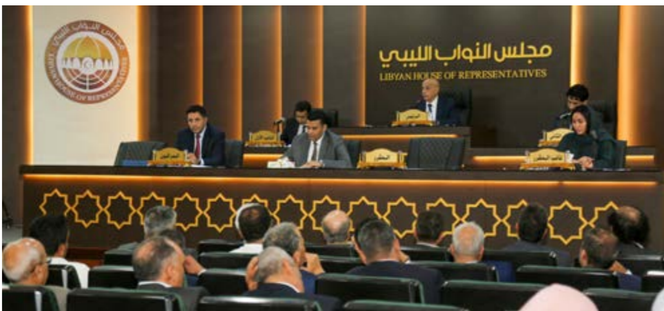
● جلسة مجلس النواب في بنغازي 10 يوليو التي جرى تأجيلها لاحقاً إلى 11 يوليو ثم 25 يوليو 2023

وفي اجتماعات منفصلة لباتيالي مع رئيس المجلس الرئاسي محمد المنفي، ورئيس مفوضية الانتخابات عماد السايح، وخالد المشري، والسفيرين الإيطالي جيانلوكا البريني والألماني مايكل أوتماخت، شدد على «أهمية أن يتوصل جميع الأطراف إلى إجماع وطني يضع البلاد على طريق الانتخابات». كما تناول مع المنفي الخطوات المنجزة من قبل الرئاسي في المسارات السياسية والاقتصادية والعسكرية.