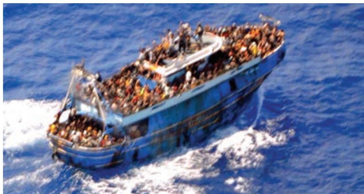
المركب الغارقة أمام السواحل اليونانية

لماذا ظهرت وحدة «KEA» للعمليات الخاصة؟ أما خفر السواحل اليوناني، فأعلن في تصريحات رسمية، أن العملية لم تسجل، لأن مصدرنا الطاقم كان يركز على الإنقاذ. لكن مصدرنا في خفر السواحل أوضح أن الكاميرات لا تحتاج إلى تشغيل يدوي، فهي موجودة على وجه التحديد لالتقاط مثل هذه الحوادث.