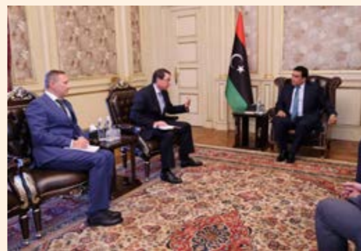
المنفي مستقبلا سفير روسيا في ليبيا 12 يوليو 2023