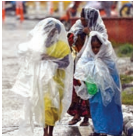
◉ عابرون يستخدمون الأغطية البلاستيكية

وأشهر معهد برشلونة تقريراً حول عدد الوفيات المرتبطة بموجات الحر الشديدة خلال العام 2022، وقال إن إسبانيا تجرب ثاني دولة في أوروبا من حيث الوفيات الناجمة عن ارتفاع درجات الحرارة، وأشار التقرير إلى أن الدولة التي توفى بها أكبر عدد من الأشخاص بسبب النوبات المتعلقة بدرجات الحرارة القصوى هي إيطاليا مع أكثر من 18 ألف شخص، تليها إسبانيا مع أكثر من 11 ألف شخص، مشيراً إلى أن صيف 2022 هو العام الأكثر سخونة على الإطلاق في القارة العجوز.