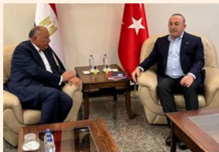
وزيرا خارجية مصر وتركيا في القاهرة مارس 2023