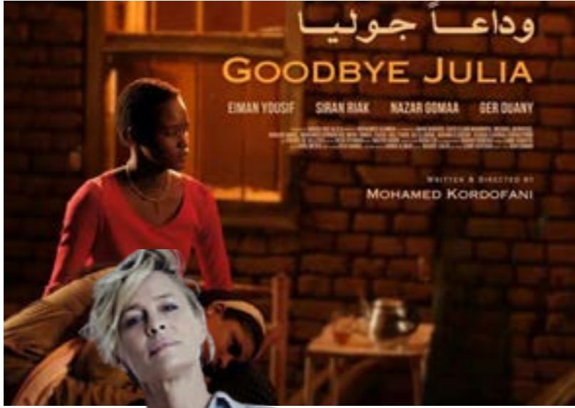
• فيلم وداعاً جوليا