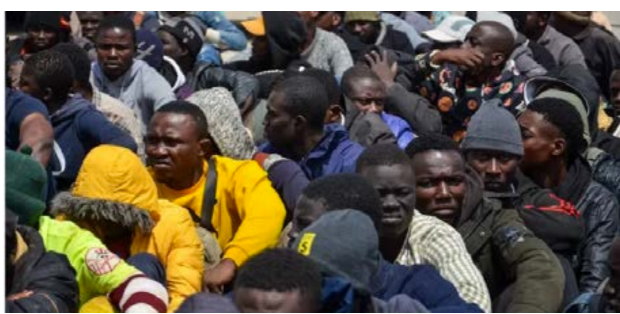
• جانب من مهاجرين أفارقة غير نظاميين أعيدوا إلى تونس

وأعلنت «المنظمة العالمية لمنهضة التعذيب» في تونس أنها دعت لجنة مناهضة التعذيب التابعة للأمم المتحدة للتنديد بحالة «مهاجرين من ليبيا والجزائر، وتجمع الصحران جرى ترحيله إلى الحدود بين تونس وليبيا في 2 يوليو، بعد اعتقاله من دون سبب وضربه بقضيب حديدي في مراكز أمنية» في بن قردان (شرق). وحملت بعض من منظمة «الهلال الأحمر التونسي»، بعض الماء والطعام للمهاجرين في الأيام القليلة الماضية وقامت بتقديم المساعدات للجرحى، بحسب شهادات من مهاجرين، أما بالنسبة لأولئك الذين يجري إرسالهم إلى مقربة من الحدود