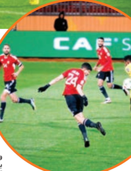
السنغال يقود هجوم ليبيا في مباراة سابقة أمام الجزائر

جديد، لعدم تكرار تجربة نظيره الوطني، بعد إخفاق حمدي بطا الذي قال قبل الرحيل في منشور عبر منصة «فيسبوك»: «ها نحن اليوم نصل إلى نهاية المشوار ديفوار العام المقبل، حيث خسر مباراتنا في الجولة الخامسة بالتصفيات من مضيفة بوتسوانا بهدف دون رد، فيما كان أمله الوحيد هو الفوز بالمباراة لكي يبقى على حظوظه في التأهل قادمة، وهو ما لم يحدث، وعقب الخسارة أمام بوتسوانا قام المدير الفني للمنتخب الوطني حمدي بطا بتقديم استقالته من منصبه، ليصبح المنتخب حالياً دون مدرب، واحتل المنتخب الليبي المركز السادس والثلاثين على مستوى منتخبات القارة الأفريقية، بعدما حصل 1130.75 نقطة، وبهذا يكون المنتخب الوطني لكرة القدم تراجع ستة مراكز دفعة واحدة في تصنيف منتخبات العالم الصادر عن «فيفا»، حيث كان يشغل في التصنيف الصادر في السادس من أبريل الماضي المركز 121 برصيد نقاط بلغ 1145.82 نقطة.