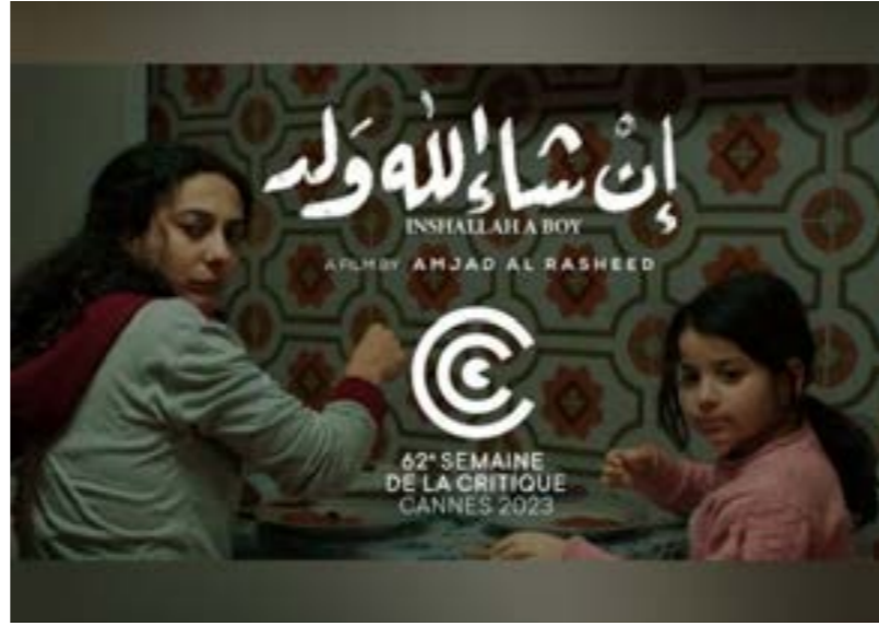
• فيلم إن شاء الله ولد