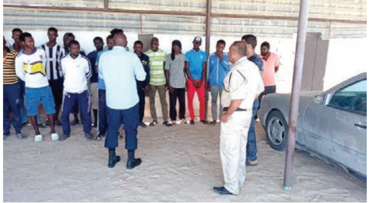
عدد من المهاجرين الموقوفين في المنطقة الشرقية