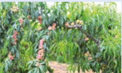
● مزرعة خوخ في سيدي بوزيد التونسية. (أرشيفية)

تحتل السوق الليبية المركز الأول من حيث صادرات الفاكهة التونسية بـ60.5% وفق ما كشفه المرصد الوطني للفلاحة في تونس. وعلى الرغم من ذلك، استوردت ليبيا 9.9 طن من الفواكه التونسية حتى 3 يوليو 2023، مقابل 15.085 طن خلال الفترة نفسها من الموسم الماضي، أي انخفاض 34.4% في الكمية. بعد الخوخ الفاكهة الرئيسية المصدرة إلى ليبيا، حيث بلغت 4294 طناً بـ43.4%. وأشار المرصد الوطني هيئة حكومية إلى أرقام الناشطين في مجال إنتاج الفواكه، حيث احتلت السوق الإيطالية المركز الثاني بـ4632 طناً مستوردة، مقابل 5484 طناً العام 2022، بقيمة 13.1 مليون دينار. في حين يعد البلطخ الفاكهة الرئيسية المصدرة إلى إيطاليا، حيث بلغت كميته المصدرة 4214 طناً بـ90.9%.