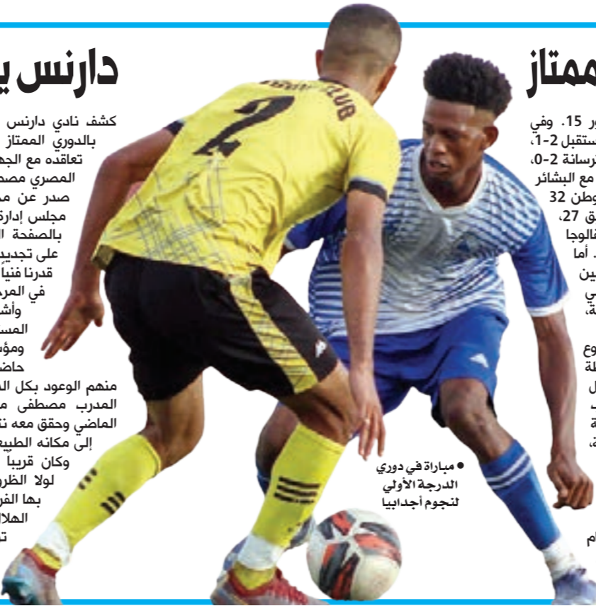
مباراة في دوري الدرجة الأولى نجوم أجدابيا

لم يتبق إلا جولة واحدة ويسدل الستار على المرحلة الأولى لمسابقة دوري الدرجة الأولى الليبي لكرة القدم. وقبل الجولة الأخيرة، ضمنت فرق البروق والأنوار ونجوم أجدابيا والوطن والترسانة والملاعب الليبي والنصر زلتي التاهل لتصفيات الصعود للقسمة الممتاز للموسم الرياضي المقبل 2023-2024. وقد شهدت نتائج الجولة السابعة عشرة للمجموعة الأولى في ثلاث مباريات فوز الهلال على القرضابية 1-0، والشراة على المصنوع 1-0، والنهضة على الصداقة 1-0. ليأتي ترتيب هذه المجموعة قبل الجولة 17 على النحو التالي: النهضة في الصدارة برصيد 16 نقطة، وأقرب الملاحقين هي القرضابية بـ 15، ثم الشراة بـ 14، والهلال بـ 14، والنهضة بـ 10، والمهاري بـ 5 نقاط. أما مباريات الجولة الأخيرة فستشهد منافسة بين الشراة والهلال، بينما جرت في المجموعة الثانية خمس مباريات، انتهت بفوز البروق على نجوم بنغازي 2-3، والأنصار على السنور 1-2، والأنوار على الخليج 2-0، والنجمة 0-1، وجاء ترتيب الفرق المتنافسة كالتالي: البروق 35 نقطة، والأنوار 32، ونجوم أجدابيا 28، والقبولان 23، وبنغازي الجديدة 23، والخليج 19، ونجوم بنغازي 19، والأنصار 18، والنجمة 17، والسنور 15. وفي المجموعة الرابعة، فاز أي الأشر على المستقبل 1-2، والمجد على الشط 3-5، والوطن على الترسانة 2-0، والفالوجا على ترهونة 2-7، وتعادل ريفق مع البشار 0-0. ليأتي ترتيب المجموعة الرابعة: الوطن 32 نقطة، والترسانة 31، والبشار 30، وريفق 27، والمستقبل 25، وأي الأشر 23، والفالوجا 22، والشط 17، والمجد 16، وترهونة 4. أما مباريات الجولة الأخيرة فستشهد منافسة بين المستقبل وريفق، والشط مع البشار، وأي الأشر أمام الوطن، والمجد مع ترهونة، والترسانة والفالوجا.