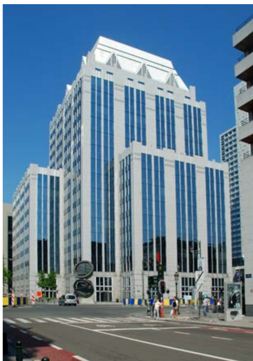
مصرف «بيروكلير» ببروكسل