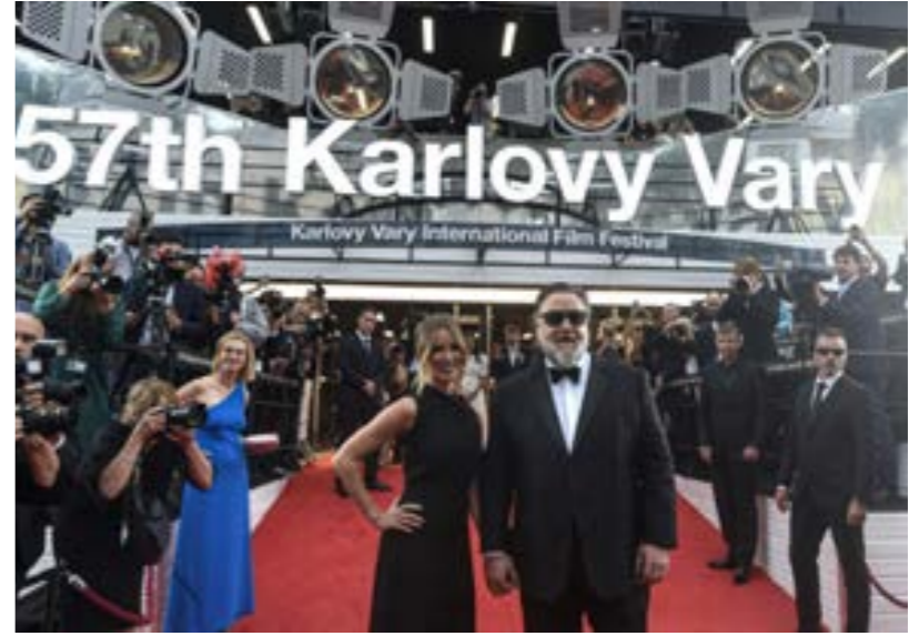
• راسل كرو وشريكة حياته بريتن تيريو في ختام مهرجان كارلوفي فاري 8 يوليو 2023