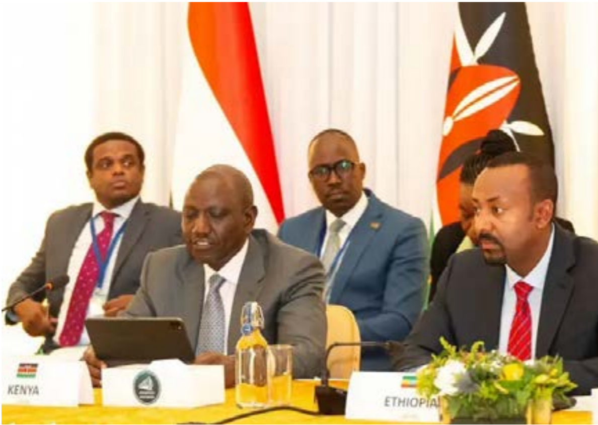
• اللجنة الرباعية تعقد اجتماعا في أديس أبابا شارك فيه رئيس كينيا وليام روتو ورئيس وزراء إثيوبيا أبي أحمد