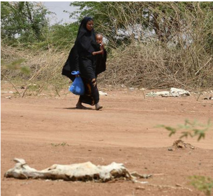
● أم وطفلا يمران بالقرب من جيف الماعز والأغنام في لوق بالصومال، 21 مارس 2022

كما جاء في التقرير «بشكل صادم، عاد العالم إلى مستويات للوجع لم نشهدها منذ العام 2005». وواجه واحد من كل ثلاثة أشخاص تقريباً (2.3 مليار شخص) انعداماً للأمن الغذائي تراوح بين المتوسط والحد في العام 2021، وحذر التقرير أيضاً من أن سوء تغذية الأطفال ما زال يثير قلقاً عالمياً. وذكر التقرير أن «قرابة 1.1 مليار شخص يعيشون