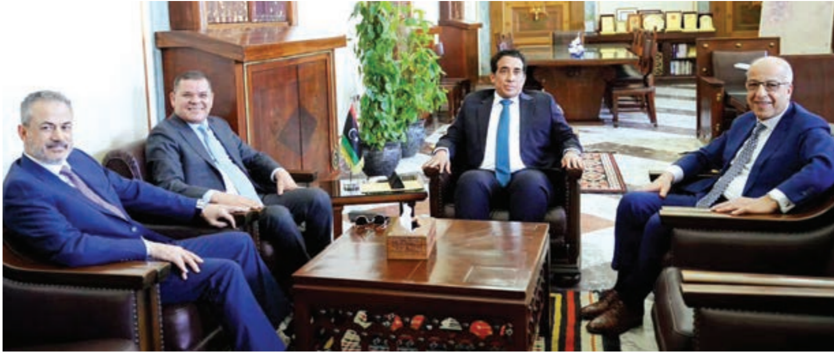
اجتماع المنفي والديبية والصديق الكبير ورئيس مؤسسة النفط فخرات بن قدرة

تحقيق اتفاق عام على آلية توزيع الإيرادات النفطية واعتبرت الوزارة أن الهدف من تشكيل اللجنة هو «خلق اتفاق عام» على آلية الإنفاق العام من ريع النفط والغاز، قائلة أنه «كان يجب أن يعكس في ميزانية عامة يعتمدها مجلس النواب الليبي وتصدر بقانون يفرض اتباعها وتطبيقها، وهو المنهج الصحيح الذي تتبعه كل الدول في العالم». أضافت: «يجب ألا نجد عن النظام المالي للدولة ولا تخلق منظومات وهيئات ولجان رديفة خارجه عنه تسقط إجراءات الدولة في العشوائية والضبابية وتعرضها للطعن القانوني والتعطيل».