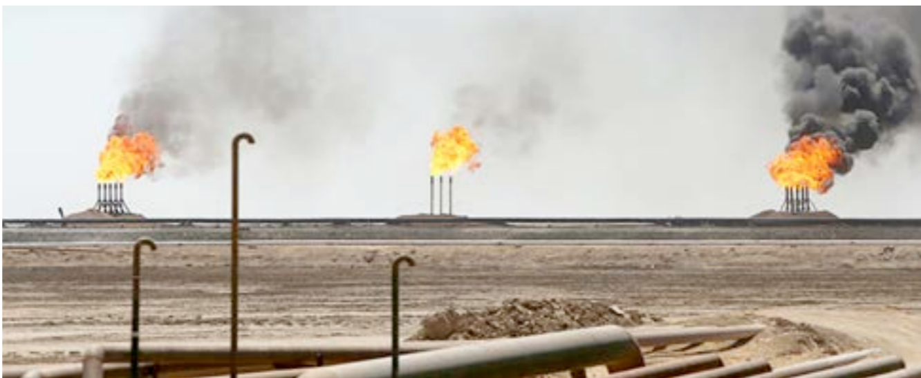
● موقع إنتاج في حقل الفيل النفطي (أرشيفية، الإنترنت)