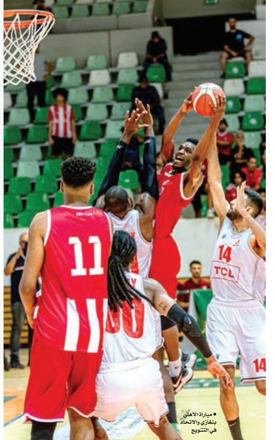
مباراة الأهلي بنغازي والاتحاد في التنوير