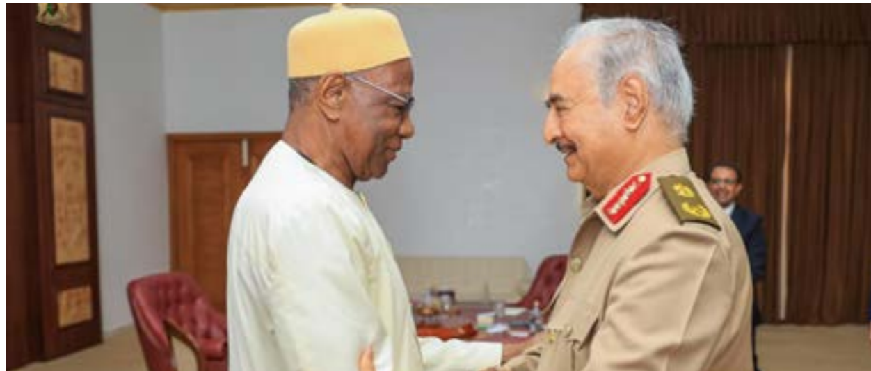
حفر مرحبا بالمبعوث الأممي، بنغازي 11 يوليو 2023

وقالت المفوضية عبر صفحتها على «فيسبوك» إن اللقاء جرى خلاله «بحث آخر مستجدات العملية الانتخابية، واستعدادات المفوضية ومستوى جاهزيتها لتنفيذها، وبحث ما يمكن تقديمه من الدعم والخبرات المساندة في مجال إدارة وتنفيذ الانتخابات». كما جرى استعراض سبل تدعيم المقترحات والمسامي التي تضمن نجاحها وفقا للمعايير الدولية». وأوضحت المفوضية أن زيارة السفير الروسي تأتي في إطار دعم المجتمع الدولي العملية الانتخابية في ليبيا، مشيرة إلى أن أغاتين أكد للسايح دعم روسيا جهود المفوضية في سبل إنجاز انتخابات حرة وذات مصداقية تعبر عن إرادة الناخب الليبي وتطلعاته نحو السلم والاستقرار.