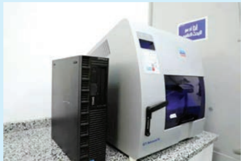
أحد المعامل الحديثة التي جرى افتتاحها

الحيوية - مشروع مكافحة ذبابة الفاشة - مشروع النانوتكنولوجي - قسم الأنسجة النباتية. وقالت وزارة التعليم العالي والبحث العلمي في منشور مصور على صفحتها بموقع فيسبوك، «تعتبر ليبيا الدولة الرائدة عربياً في امتلاك بعضها، حيث ستكون لهذه الأجهزة دور مهم في الحصول على نتائج علمية تدعم الأستاذة والباحثين والطلبة في دراستهم ما