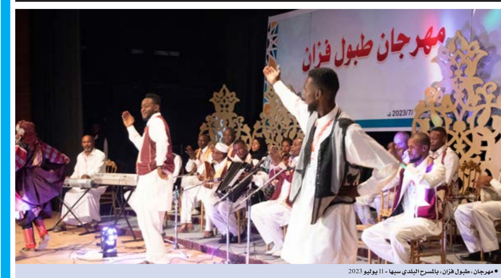
• مهرجان «طبول فزان» بالمسرح البلدي سبها - 11 يوليو 2023