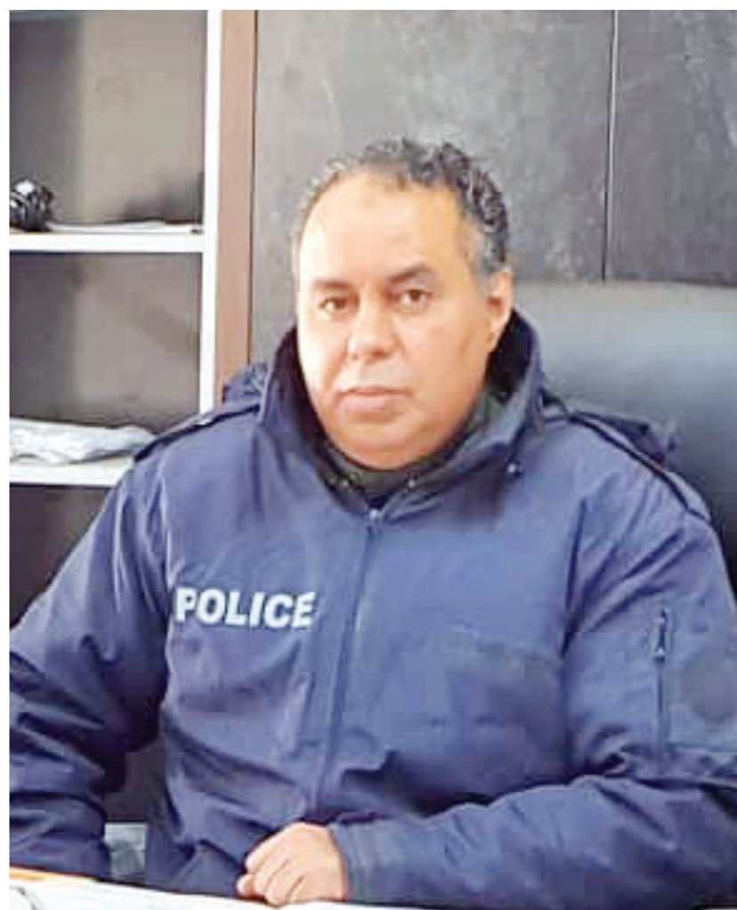
اللواء رافع البرغثي رئيس جهاز مكافحة الهجرة غير الشرعية بالمنطقة الشرقية

لكي يقوم بعمله، ولا يوجد دعم للجهاز، كما هو معلوم، لأن الأموال والميزانيات تصرف من حكومة الوحدة التي تجاهلت هذا الملف. والدعم يأتي للجهاز من قبل القيادة العامة للجيش الليبي، رغم القيود والحصر المفروض عليها، إلا أنها دائما في الموعد لدعم كافة الأجهزة الأمنية في المنطقة الشرقية. هل أثرت الأحداث في السودان على أعداد المهاجرين، وهل لديكم قاعدة بيانات توثق الأرقام؟ بالفعل توجد موجة نزوح من الجنسية السودانية، دخلت البلاد وبالفعل هناك قاعدة بيانات لهم بالتنسيق مع الجالية السودانية. ما هي الأعداد الموجودة في مراكز الإيواء لديكم حتى الآن؟ فيما يتعلق بأعداد المهاجرين الموجودين