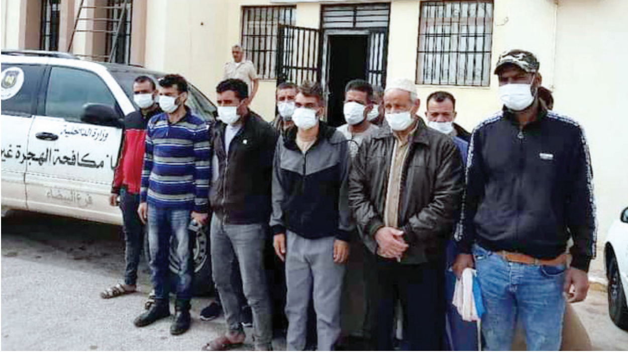
جهاز مكافحة الهجرة غير الشرعية