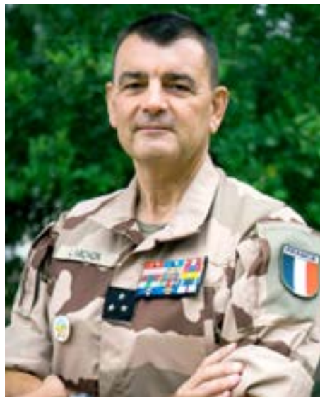
الجنرال لوران ميشون

■ ما هو تقييمك لعملية إعادة هيكلة التدخل العسكري الفرنسي التي بدأت قبل أشهر قليلة؟ ما هي التغييرات الجديدة التي ستحدث في عام 2022؟ نحن بصدد استكمال المرحلة الأولى، وهي الانسحاب من أقصى شمال مالي وبعثة وكيدال وتيساليت) بالتعاون مع سلطات مالي وبعثة الأمم المتحدة في مالي (مينوسما) وأصدقائنا الأوروبيين المشاركين في قوة تاكوبا. تمت عملية الانسحاب التدريجي بأكثر قدر ممكن من السلاسة، وفي تلك المواقع التي توجد فيها القوات الأممية، ظل ميزان القوى العسكري دون تغيير لأن الجيش المالي حل مكاننا. ستبدأ المرحلة الثانية في الأشهر الستة القادمة، وستشمل إعادة هيكلة كل من القيادة والقوات، لا سيما في مالي. ولن تتوقف العملية عند هذا الحد. كنا حوالي 5 آلاف عسكري فرنسي في منطقة الساحل في صيف 2021، وسنصبح نحو 3 آلاف في صيف 2022. سيكون هناك عدد أقل بكثير من القوات التقليدية ومزيد من القوات الخاصة المكلفة مهام الشراكة القتالية تعمل ضمن قوة تاكوبا الأوروبية. هناك الآن نحو 900 عنصر في القوة والأوروبيون يواصلون تقديم طلبات الانضمام. يعد هذا الانخراط الأوروبي نجاحاً سياسياً لمنطقة الساحل ومالي. سيستمر مقر قيادة تاكوبا من منطقة مينانكا إلى غاو في الأشهر الستة القادمة، وسيتم تعزيز التعاون مع شركائنا المحليين عبر إنشاء مركز قيادة متقدم دائم في نيامي. ■ تتم عملية إعادة التنظيم هذه في سياق اجتماعي وسياسي متوتر؛ توتر بين باريس والمجلس العسكري المالي، وعلامات على رفض السكان المحليين للوجود العسكري الفرنسي، ومحلات مناهضة للفرنسيين على