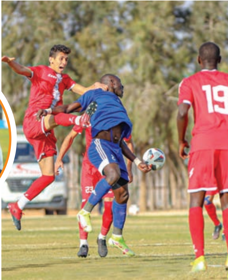
مباراة السويحلي والخنس في الدوري