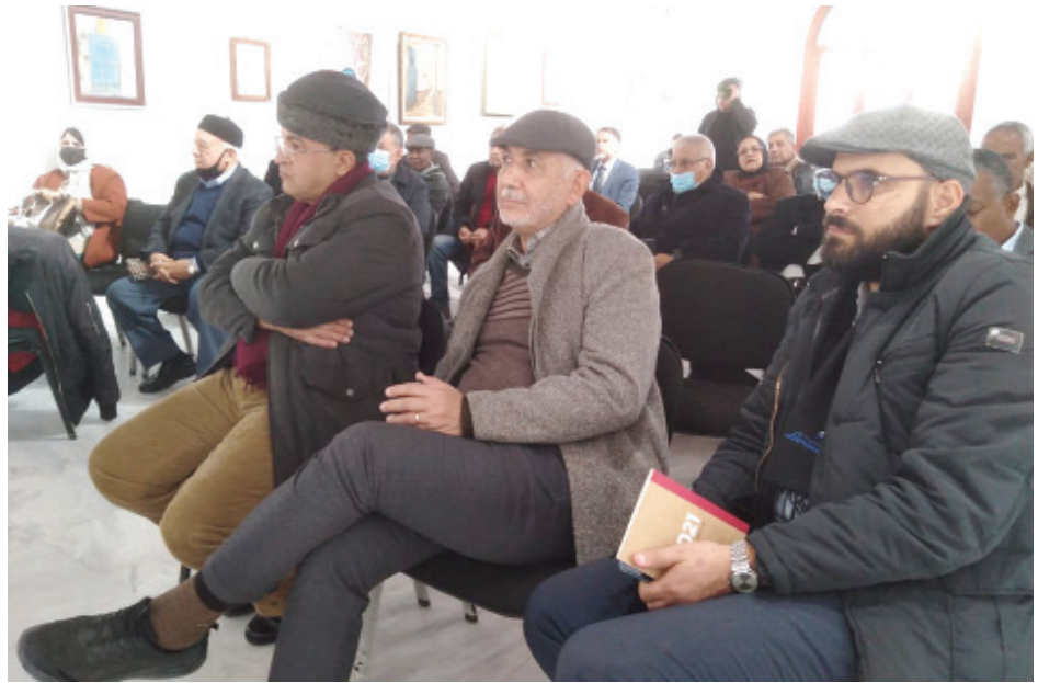
ندوة فكرية حول كتاب «وزراء الملك»