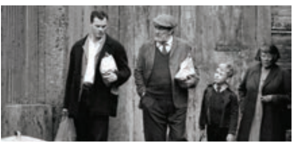
مشهد من فيلم «بلفاست»