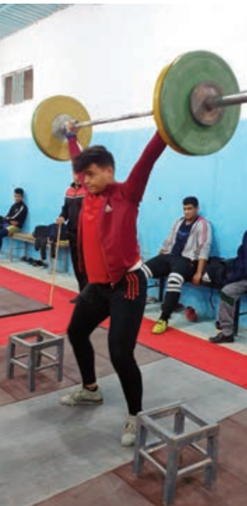
جانب من استعدادات الرباعين الليبيين

يشار إلى أن البطولة ستشهد مشاركة ربايعين من ليبيا والعراق والسعودية وسورية ولبنان والأردن والجزائر والكويت وفلسطين وعمان.