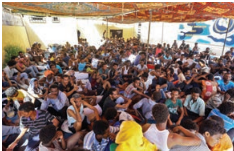
مهاجرون في ليبيا

المتحد، تقريرا بشأن المهاجرين في ليبيا إلى مجلس الأمن الدولي بشأن تنفيذ القرار «2240» للعام 2015.