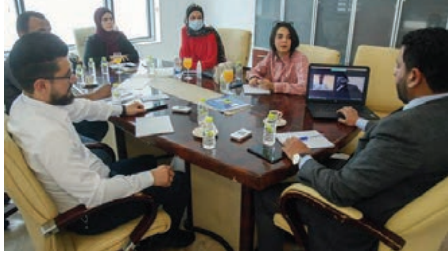
اجتماع اللجنة التأسيسية للبرلمان الشبابي الانتقالي الليبي.

يبدو أن حلم تشكيل «برلمان شباب ليبيا» سيصبح حقيقة في القريب، حسب ما يرى متابعون للشأن الليبي، فداخل ديوان وزارة الشباب بالعاصمة طرابلس، عقد أعضاء اللجنة التأسيسية لبرلمان الشباب الليبي، الإثنين، الاجتماع السابع، الذي جرى فيه النقاش حول الأعداد والفرز المبدئي للمتقدمين للبرلمان الشبابي، وذلك عبر الضوابط المنشورة في الصفحة الرسمية للوزارة على موقع التواصل الاجتماعي «فيسبوك».