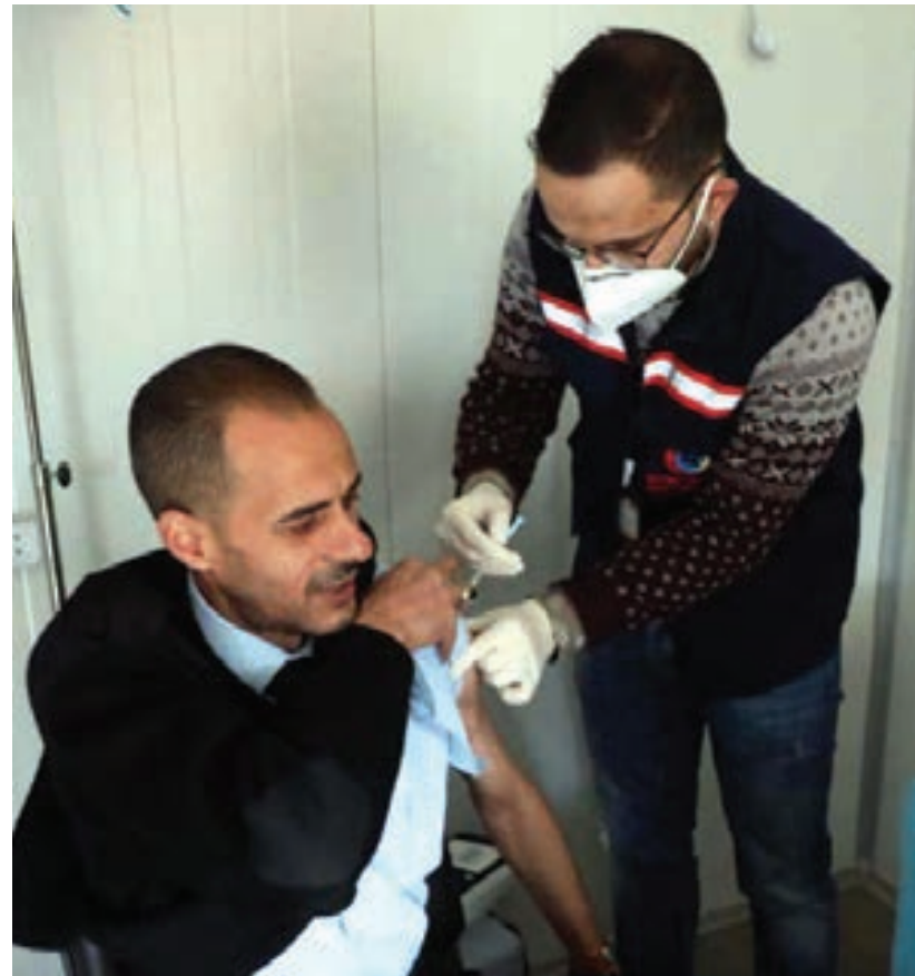
تطعيم العاملين بمطار معيتيقة الدولي السبت الماضي

بفيروس «كورونا المستجد»، منها 99 حالة حرجة، وتمتثل للشفاء 920 مصاباً، وتوفي سبعة آخرون، حسب بيان المركز، على صفحته في موقع التواصل الاجتماعي «فيسبوك»، الأربعاء. وبلغت نسبة الإصابات الجديدة 12% من إجمالي 4040 عينة جرى تحليلها، حيث ظهرت سلبية 3552 منها. وتوزعت حالات الوفاة، بواقع خمس حالات بالمنطقة الغربية وحالتين في المنطقة الشرقية. وبحصوله الثلاثاء، ارتفع عدد الحالات المعصابة بفيروس «كورونا» المسجلة في ليبيا منذ ظهور الوباء، إلى 379 ألفاً و816 حالة، منها 7157 حالة نشطة، بينما تعافى 367 ألفاً و83 حالة، وسُجّلت 5576 حالة وفاة بالمرض في البلاد.