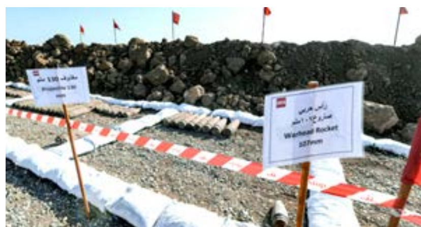
ذخائر ورؤوس حربية نزعتها فرق تفكيك الألغام، في منطقة قريبة من قرية حسن جلال شمال الموصل (شمال العراق)، 29 نوفمبر 2021.

ويواصل فريق مختص بتفكيك الألغام عمله وينقل المتفجرات التي يعثر عليها إلى منطقة خالية مخطورة ومطوقة بحزام أحمر. وتصف المتفجرات بين صواريخ عيار 107 ملم ومقنونات عيار 23 ملم والغم «في أس 500». وتعد محافظة الأنبار (غرب) ونيوى من أكثر المناطق تضرراً، كما هو الحال في جميع المعازل السابقة لتنظيم الدولة الإسلامية.