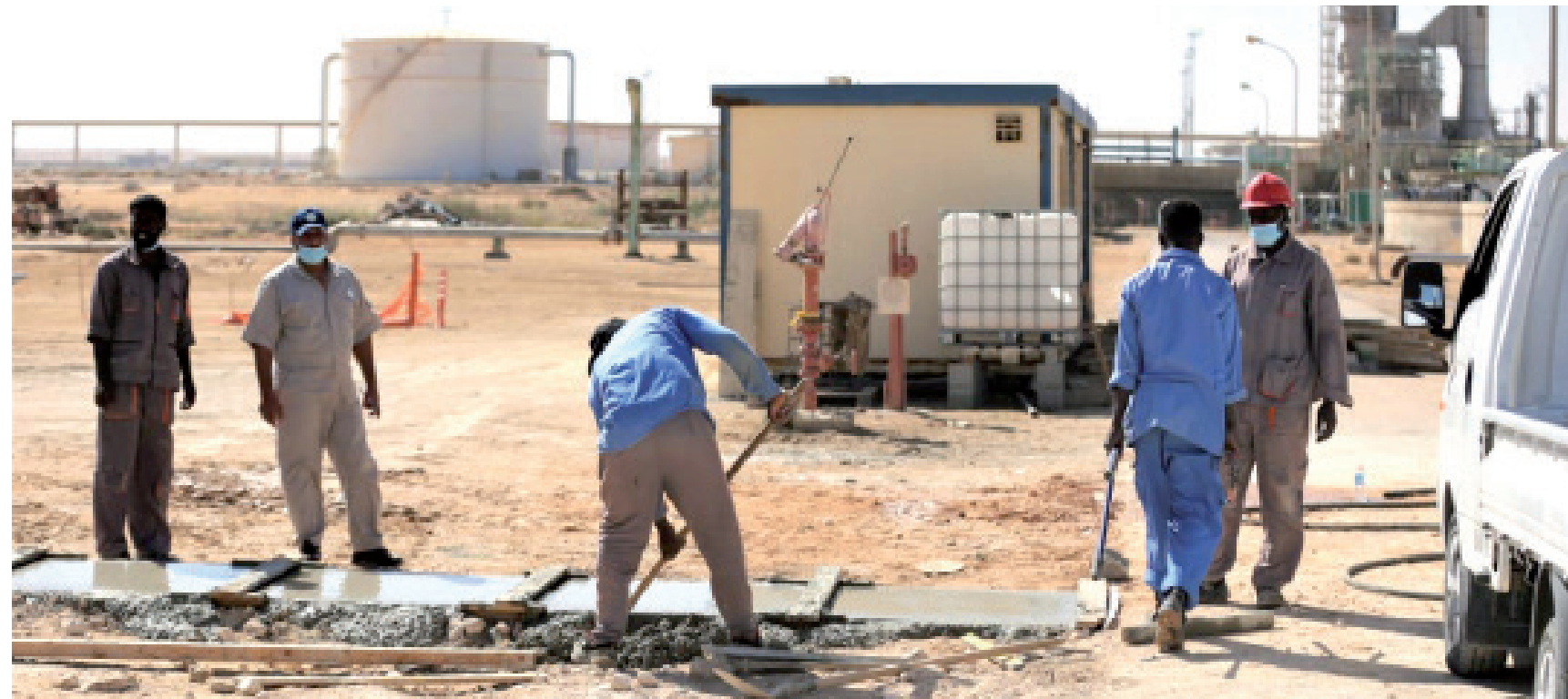
• عمال في منشآت نفطية بشركة راس لانوف