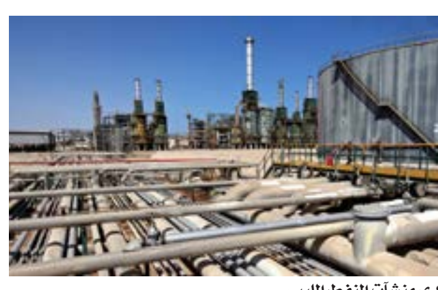
• إحدى منشآت النفط الليبي

تراهن شركات دولية على نتائج الانتخابات لعودة الاستقرار ورفع إنتاج النفط الليبي، وسط آمال بأن يؤدي إجراء الانتخابات المقررة على 24 ديسمبر الجاري، إلى زيادة استقرار صناعة النفط وتقليل فرص قيام أطراف الصراع بإعادة القتال أو إغلاق الموانئ والحقول مرة أخرى. وتزامن رهان هذه الشركات مع صدور التقرير الشهري لمنظمة الدول المصدرة للنفط «أوبك» الذي أوضح انخفاض إنتاج ليبيا إلى 1.14 مليون برميل يومياً، وتعثر إنتاج النفط على خلفية مشاكل وتسريبات طالت شبكة نقل الطاقة، مقارنة مع زيادة دول «أوبك» إنتاجها بمقدار 285 ألف برميل يومياً إلى 27.7 مليون برميل يومياً، بنسبة 122٪؛ علماً بأن ليبيا وإيران وفنزويلا معفاة من قيود الحصص. وتتطلع الشركات الأجنبية الرئيسية إلى زيادة إضافية في الإنتاج، ومن بينها شركة «توتال إيريجي» الفرنسية التي واصلت جهودها في هذا الإطار