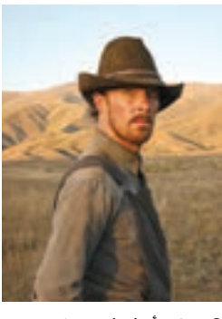
باور أوف ذي دوغ

تصدر فيلم «بلفاست» للمخرج كينيث براناه و«باور أوف ذي دوغ» لجين كامبيون قائمة الترشيحات لجوائز «غولدن غلوب» التي أعلنت، الإثنين، وسط موجة انتقادات ومقاطعة تعرض لها لانتقارها إلى التنوع والشفافية. وواجهت رابطة الصحافة الأجنبية في هوليوود التي تعتبر أيضاً لجنة تحكيم الجوائز اتهامات في الأشهر الأخيرة بالعنصرية والتمييز على أساس الجنس والفساد، وفق «فرانس برس».