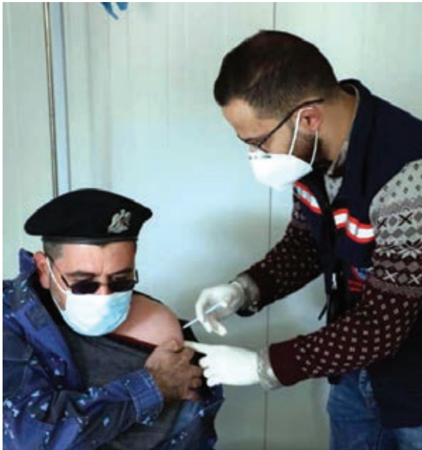
تطعيم العاملين بمطار معيتيقة الدولي السبت الماضي

وأكد «سميو»، في تصريحات نقلتها وكالة الأنباء الليبية «وال»، الأحد، الاستمرار في تطعيم طلبة المدارس من سن 12 إلى 17 سنة داخل مراكز التطعيم بالمقاهي الصيفية «سينوفارم»، في انتظار وصول شحنات أخرى من اللقاح الأميركي «فايزر»، نهاية الشهر. وأوضح أن إجمالي عدد المطعمين بالجرعة الأولى بلغ مليوناً و785 ألفاً و671 و671 وبالجرعة الثانية 780 ألفاً و489 و9 مطعماً، مضيفاً أنهم في انتظار موافقة رئاسة الوزراء بشأن منح الإذن بالتعاقد على توريد تطعيم الإنفلونزا الموسمي. وفي 29 نوفمبر الماضي، قرر المركز الوطني لمكافحة الأمراض، إعطاء جرعة تعزيزية واحدة (جرعة ثالثة) لثلاث فئات، ضمن تعليمات بشأن التطعيمات المضادة لفيروس «كورونا». التوجيهات تضمنت إعطاء جرعة تعزيزية واحدة (جرعة ثالثة) من لقاح «سينوفارم» أو «فايزر» في حال مرور ستة أشهر من تلقي الجرعة الثانية لثلاث فئات هم: «جميع العاملين بالقطاع الصحي، والفتات العمرية من 50 سنة فما فوق، والذين يعانون أمراضاً مزمنة ونقصاً في المناعة بغض النظر عن العمر».