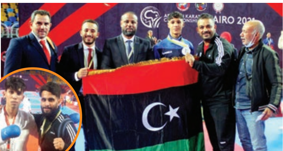
نوري السعداوي وسط مدربيه