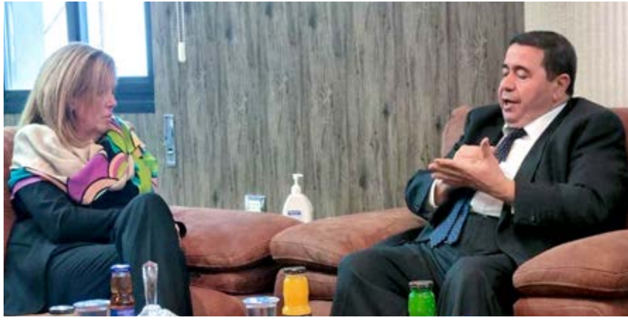
• ستيفاني وليامز ورئيس المجلس الأعلى للقضاء المستشار محمد الحافي 13 ديسمبر 2021

وقفات احتجاجية رفضاً لتأجيل الانتخابات وضرورة إعلان القوائم النهائية للمرشحين، إلا أن تجدد الاشتباكات وعودة التحشيد العسكري في سبها، أعاد الهواجس الأمنية إلى الواجهة. وجاءت هذه الاشتباكات التي تعد خرقاً لاتفاق وقف إطلاق النار بعد ساعات من إعلان مديرية أمنها سيطرة قوات تابعة للقيادة العامة، على 11 سيارة شرطة حديثة لها مساء الإثنين. وذكرت المديرية، أن القوات المدججة بالأسلحة الثقيلة والمدمرات، اقتادت أفراد الشرطة الذين كانوا يستقلون السيارات إلى قاعدة براك ببلدية الشاطئ. واعتبر اللواء خالد المحجوب مسؤول الجيش الوطني الاشتباكات محاولة لضرب الاستقرار في الجنوب، قبل اجتماع تعده اللجنة العسكرية المشتركة «5+5» بقرها في مدينة سرت، يومي الخميس والجمعة لمناقشة خطة خروج المرتزقة والقوات الأجنبية.