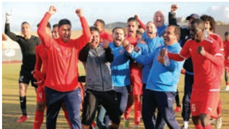
• فرحة نجوم فريق الاتحاد بالفوز