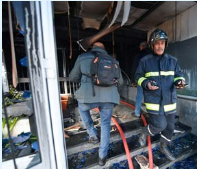
إطفاؤيون تونسيون وعناصر من القوى الأمنية في مقر حزب النهضة في تونس العاصمة حيث اندلع حريق في التاسع من ديسمبر 2021.

الجورشي لـ«فرانس برس» إن الرئيس لم يتأثر بكل الضغوط سواء من الأحزاب أو من الشخصيات السياسية التي تدعوه للتراجع عن قراراته التي اتخذها في 25 يوليو الفائت، وهو مصرّ على «اتمام تنفيذ مشروعه السياسي» بتغيير نظام الحكم في البلاد والذي كان يقوم على منح السلطة التشريعية صلاحية العمل أوسع على حساب التنفيذية. ويتابع «حاول عبر مناوئته السياسية أن يسحب البساط من