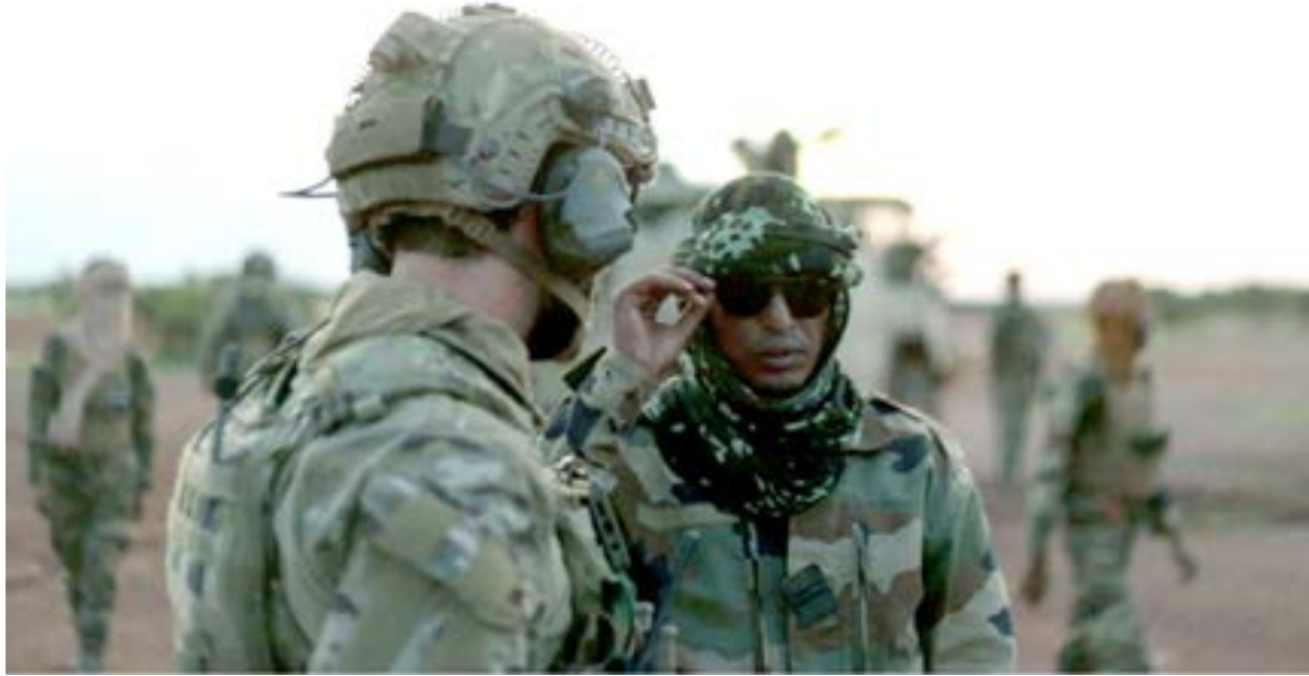
ضابط من قوة تاكوبا الجديدة يتحدث مع ضابط مالي خلال دورية بالقرب من حدود النيجر.