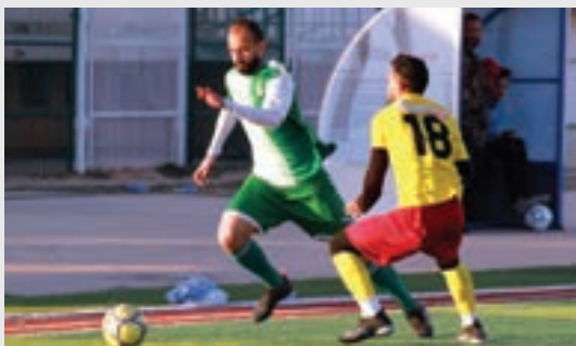
مباراة ودية للأنوار استعداداً لدوري الدرجة الأولى

من فرق «صقور العلالقة» و«ترهونة» و«الفالوجا» و«المجد» و«الطلوع» و«أساريا» و«الظهرة»، ومجموعة الجنوب تضم ستة فرق، هي «القرضابية» و«الشرارة» و«الملال» و«النضرة» و«المدية» و«الأمل» و«باوباري» و«فرق المنطقة الشرقية، التي يصل عدد فرقها 20 فريقاً ستوزع على ثلاث مجموعات أيضاً وهي فرق «الوفاق أجدابيا» و«نجوم أجدابيا» و«الأنوار» و«النجمة» و«نجوم بنغازي» و«شمال بنغازي» و«المرج» و«بنغازي الجديدة» و«الوحد بنغازي» و«الطيران» و«السد» و«السواعد» و«الاندلس» و«المختار» و«الصقور» و«النسور» و«البرانس» و«القيروان» و«الأفريقي» و«المنار».