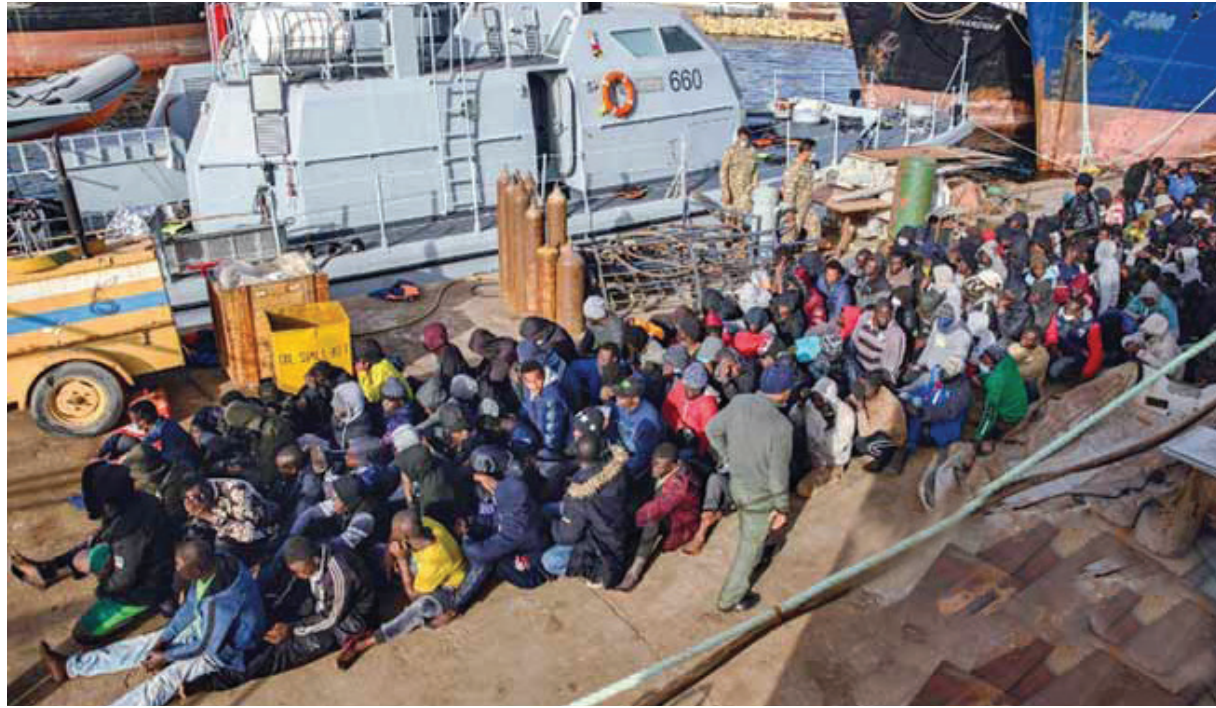
مهاجرون اقتادوا قبالة ساحل الخمس الليبي 10 فبراير 2021.

يندر أنه في العشرين من مايو الماضي، عقدت اللجنة التأسيسية للبرلمان الشبابي الليبي برئاسة الدكتورعلي السيد اجتماعها الثاني، بمقر ديوان وزارة الشباب وبحضور أعضاء اللجنة بمن فيهم رحيل العبيدي