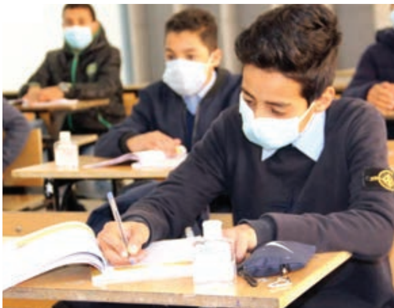
عودة منتظمة للدراسة في مدارس ليبيا للأسبوع الثاني على التوالي

المقرّب وهو أيضاً رئيس اللجنة الوطنية للتربية والثقافة والعلوم، وجه الشكر إلى المعلمين والمعلمات في ليبيا، واعتبرهم «خط الدفاع الأول والحصن الحصين لنظامنا التعليمي، نظير ما قاموا به من تضحيات وبلاء حسن، في سبيل ضمان استكمال العام الدراسي لأبنائنا وبناتنا بمختلف مستوياتهم التعليمية، رغم التعقيدات والصعوبات الجمة التي واجهت الجميع، وفرصتها الجائحة». وتمنّى وزير التربية والتعليم جهود جميع الكوادر التربوية من خبراء تربويين ومفتشين، وإداريين وفنيين، وكذلك الأطر الصحية بوزارة الصحة، والمراكز والعيادات الصحية ذات العلاقة، لإسهاماتهم الفاعلة في ضمان استمرار العملية التعليمية في كل ربوع البلاد، وذلك وفق بيان نشرته الوزارة على صفحتها على موقع «فيسبوك».