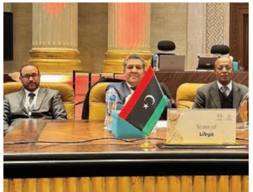
المقرّب يرأس وفد ليبيا في مؤتمر الإيسيسكو بالقاهرة

المؤسسات التعليمية، البالغ عددها 4 آلاف 427 مؤسسة تعليمية، خلال أيام، موضحاً أن بنود صرفها ستقتصر على صيانات خفيفة وتوفير مواد تنظيف، مؤكداً استلام معظم