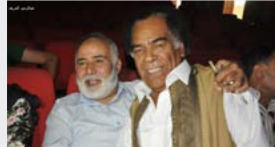
الثقافي البوزيدي والشاوش

مختلف منصات السوشيال ميديا. ونعت وزارة الثقافة والتنمية المعرفية الفنان الراحل، كما نعته الجمعية الليبية للأدب والفنون، وقدمت تعازياً لها إلى أسرته، وزملائه وأصدقائه.