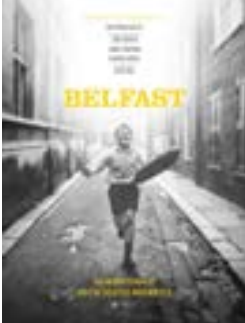
بوستر فيلم «بلفاست»

وأعلن عدد من النجوم والاستوديوهات الكبيرة مثل «وارنر برذرز» و«نتفليكس» و«أمازون» أنهم لن يتعاونوا بعد اليوم مع الرابطة ما لم تنفذ تغييرات «كبيرة». ويجتنب احتفال «غولدن غلوب» عادة جميع النجوم العالميين، إلا أنه من المتوقع أن تغيب الوجوه هذه السنة عن الأمسية التي أعلنت قنوات «إن بي سي» عزمها التوقف عن نقلها. ولم يتضح بعد ما إذا كان احتفال توزيع الجوائز في 9 يناير، وهو التاسع والسبعون، سيقام أصلاً بصيغة حضورية، وحتى ما إذا كان الفائزون سيستلمون جوائزهم.