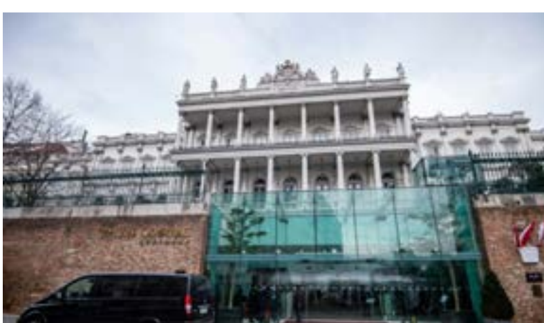
قصر كوبورج الذي يستضيف محادثات الملف النووي الإيراني، في فيينا

وتزامنت زيارة محمد بن سلمان مع زيارة أجراها الرئيس التركي رجب طيب إردوغان إلى قطر، وسط أجواء تقارب بين دول الخليج وأنقرة بعد سنوات من