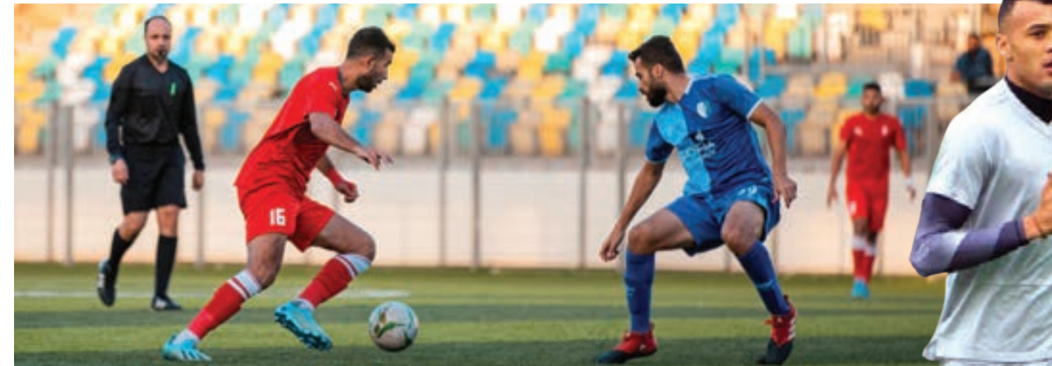
• مباراة الأهلي بنغازي أمام الهلال

كشفت لجنة المسابقات بالاتحاد الليبي لكرة القدم مواعيد مباريات الأسبوع الخامس، والمباريات المؤجلة في الدوري الليبي الممتاز لكرة القدم، التي جاءت على النحو التالي: الأربعاء 15 ديسمبر. على ملعب درنة، «دارنس» يستضيف «الأهلي بنغازي» والمراتب بالمقامس الحبيب، وعلى ملعب العاشمي الجهلول «المحلة» يلتقي «الاتحاد المصري» والمراتب بعرض الككلي. الخميس 16 ديسمبر. على ملعب بنينا، «التحدي» يستضيف «الصادقة» والمراتب المنصور التاورغي، وعلى ملعب اجناديا «خليج سرت» يتبارى مع «الأخضر» والمراتب محمد الأمين. الجمعة 17 ديسمبر. على ملعب اجناديا، «التعاون» يستضيف «شباب الجبل» والمراتب المبروك الفارسي، وعلى ملعب بنينا لقاء الجارين «الهلال» و«النصر» والمراتب فيصل بادي. السبت 18 ديسمبر. على ملعب مصراتة، المباراة المؤجلة بين «الأهلي طرابلس» و«المدينة» والمراتب الهادي سويطي.. الأربعاء 22 ديسمبر. على