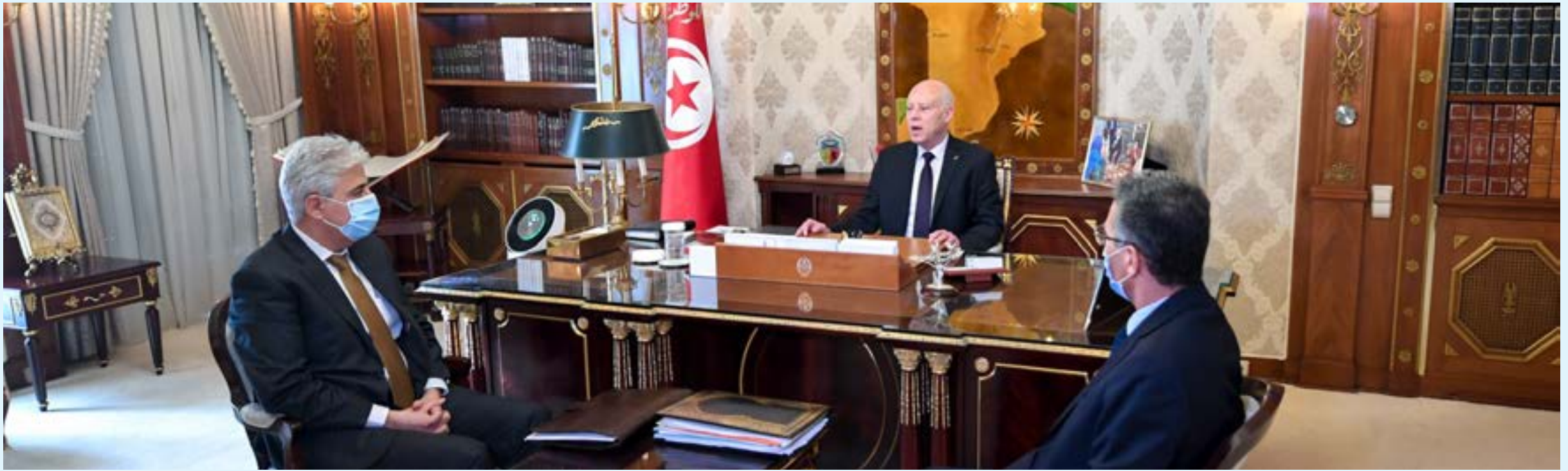
الرئيس التونسي قيس سعيد وعماد ميثي، وزير الدفاع الوطني، وتوفيق شرف الدين، وزير الداخلية خلال اجتماع بقصر قرطاج، 14 ديسمبر 2021.