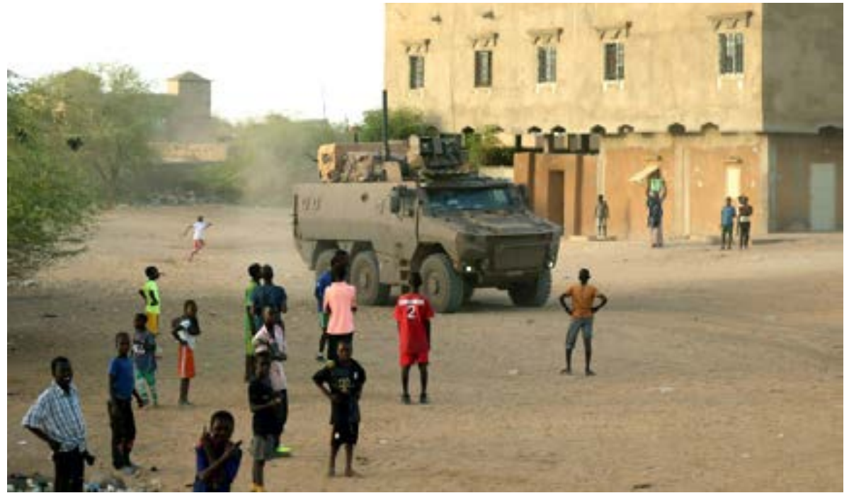
عربة مدرعة فرنسية من «برخان» في منطقة غاو بمالي، 4 ديسمبر 2021.