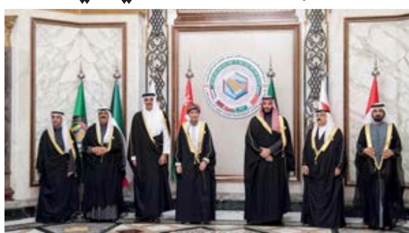
قمة الخليج بالرياض

منذ بداية العام، اتخذت إيران عدة خطوات في برنامجها النووي، إذ رفعت معدل تخصيب اليورانيوم إلى مستويات غير مسبوقة قريبة من