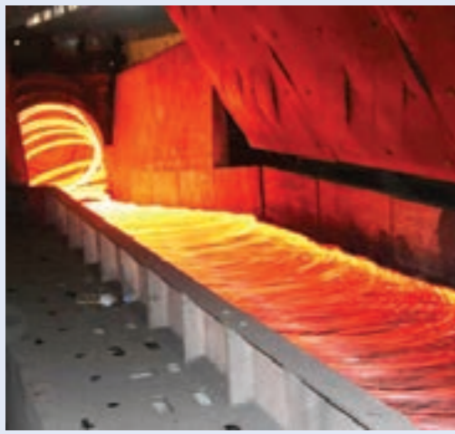
صهاريج داخل الشركة الليبية للحديد والصلب