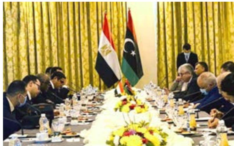
● باشاغا، مع الوفد المصري الذي زار طرابلس، 27 ديسمبر 2020.

والجزائر، بدائرة المنفتحين أكثر على طرابلس بعدما شكل ملف الاستقرار في ليبيا، واستعادة دورها في القارة الأفريقية والمنطقة المتوسطية محور اتصال هاتفي بين وزير الشؤون الخارجية والهجرة والتونسين بالخارج عثمان الجردي، ونظيره الجزائري صبري بوقادوم، كما أجرى بوقادوم والجردي كل على حدة، مباحثات هاتفية مع محمد الطاهر سيالة، حول تطورات الأوضاع في ليبيا، التي تتعلق أساساً بالترتيبات لملتقى الحوار السياسي المباشر المقبل في تونس الأسبوع المقبل. هذه المؤشرات الإيجابية التي تجلت خلال الأيام الأخيرة من عمر العام الحالي 2020، اعتبرها مثقالون مقدمة واعدة لما يمكن أن يستجد مطلع العام الجديد من تطورات إيجابية في مسار العملية السياسية، المنتظر أن تتوج بحكومة وحدة وطنية تقود المرحلة إلى موعد الاستحقاق الانتخابي في 24 ديسمبر، وفق ما جرى الاتفاق عليه في الجولات الأولى للحوار السياسي في تونس، ليحجب عن السؤال الدائر الآن: هل سيكون العام 2021 العام الحل في ليبيا؟