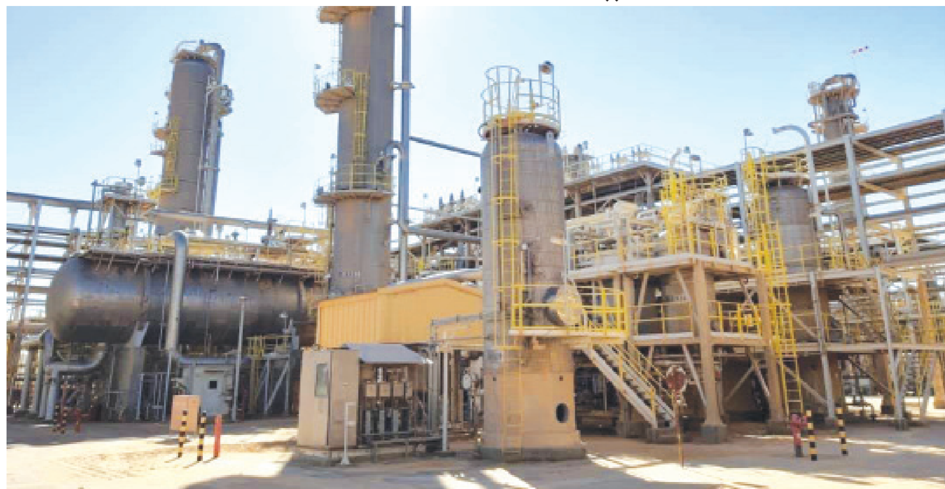
• منشآت داخل معمل الغاز بحقل الاستقلال النفطي

بعد عام كانت الاضطرابات الاقتصادية والارتباك عنوانه الأبرز نتيجة عوامل عدة، يأمل الليبيون أن يحمل العام الجديد 2021 معه انفراجة اقتصادية تحسن من مستوى المعيشة وتزيد من الدخل الوطني للبلاد، وقبل ذلك انقشاع أزمة فيروس «كورونا المستجد» التي حصدت أرواح الملايين وألحقت خسائر غير مسبوقة بالاقتصاد في غالب دول العالم. وسيطرت الإضرابات على المشهد في ليبيا على مدى الـ12 شهرا الماضية؛ فقد بدأ العام بارتباك وعدم وضوح لمستقبل البلاد اقتصاديا، تزامنا مع استمرار حرب طرابلس، وتفاقم الأمر بالإغلاقات النفطية التي استمرت من 18 يناير إلى 26 أكتوبر، كما شهد العام أيضا خلافا كبيرا بين مؤسسة النفط والمصرف المركزي؛ فيما حملت الأيام الأخيرة من العام انفراجة بالنسبة للمصرف المركزي الذي اجتمع موحدًا وقرر توحيد سعر صرف الدينار، وهو القرار الذي اعتبره مسؤولون مقدمة للقضاء على السوق السوداء للعملة، ورفع مستوى المعيشة.. وهذه أبرز أحداث العام: