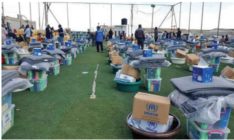
مساعدات تنتظر التوزيع على لاجئين في ليبيا

2020. وقال أحد اللاجئين لمنظمة العفو الدولية في أغسطس: «الآن سوف يعبر اللاجئون البحر... فلا يوجد إجلاء ولا إعادة توطين... فاللاجئون في ليبيا معرضون للخطر. (نحن) بين الحياة والموت». وهذا يعني أن اللاجئين والمهاجرين اليانسين ليس لديهم سوى سبل قليلة ممكنة للخروج من ليبيا غير المجازفة بعبور البحر الأبيض المتوسط على قوارب غير صالحة للإبحار. بيد أن المعابر لا تزال بالغة الخطورة، بما في ذلك بسبب اعتراض خفر السواحل والجماعات الإجرامية. لها، ففي أحد الحوادث الدامية، التي وقعت في منتصف أغسطس، قال الناجون لمنظمة العفو الدولية إن الرجال المسجلين على متن قارب يدعى «قبطان السلام 181» تموا بسرقتهم، ثم أطلقوا النار على قاربهم، الأمر الذي أدى إلى اشتعال النيران في المحرك، واندلاع القارب. قُتل ما يقدر بنحو 40 شخصاً، بعد أن تركوا في محنة في عرض البحر.