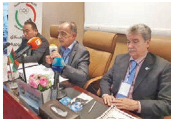
• اجتماع اللجنة الأولمبية الليبية

اعتماد إضافة تسمية على شعار اللجنة الأولمبية الليبية، ويتم اعتماد المقترح الجديد بالتميز بعد إحالة بوقت كاف إلى كامل أعضاء الجمعية العمومية لإبداء الملاحظات ومناقشة عرض أعمال المكاتب (الاستثمار - المشروعات - القانوني - التضامن الأولمبي) للعام 2019/2020. وتم الارتياح لما قامت وتقوم به مكاتب اللجنة الأولمبية الليبية واعتماد اللائحة المالية ولائحة شؤون الموظفين والهيكلة التنظيمي للجنة الأولمبية الليبية، مع إضافة مدير مكتب الأمين العام، وتأجيل اعتماد رئيس مجلس إدارة اللجنة الأولمبية الليبية الجديدة بالتميز بعد إحالة بوقت كاف إلى كامل أعضاء الجمعية العمومية لإبداء الملاحظات ومناقشة عرض أعمال المكاتب (الاستثمار - المشروعات - القانوني - التضامن الأولمبي) للعام 2019/2020.