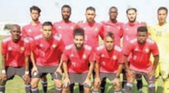
• منتخب المحليين