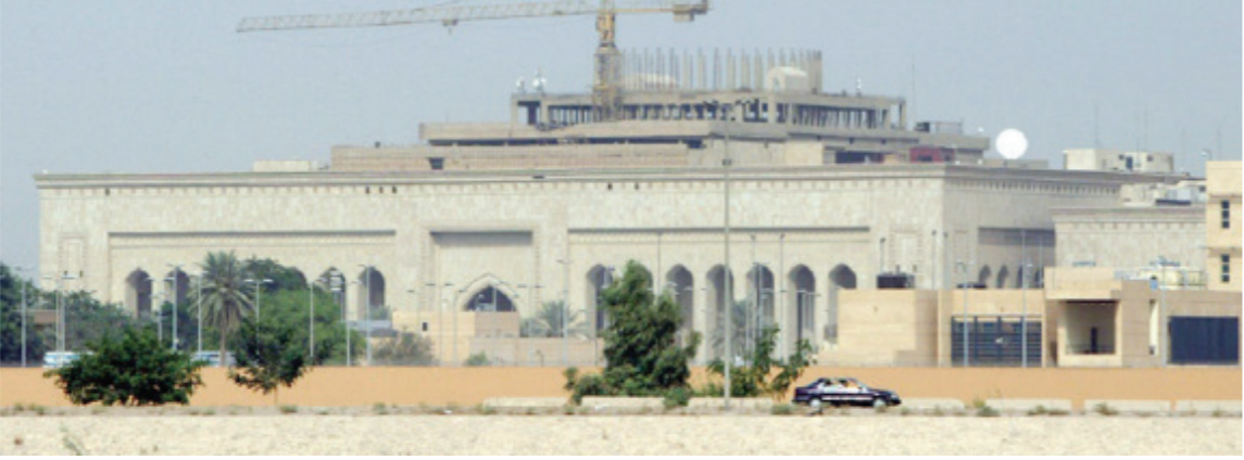
واجهة مجمع السفارة الأمريكية في بغداد