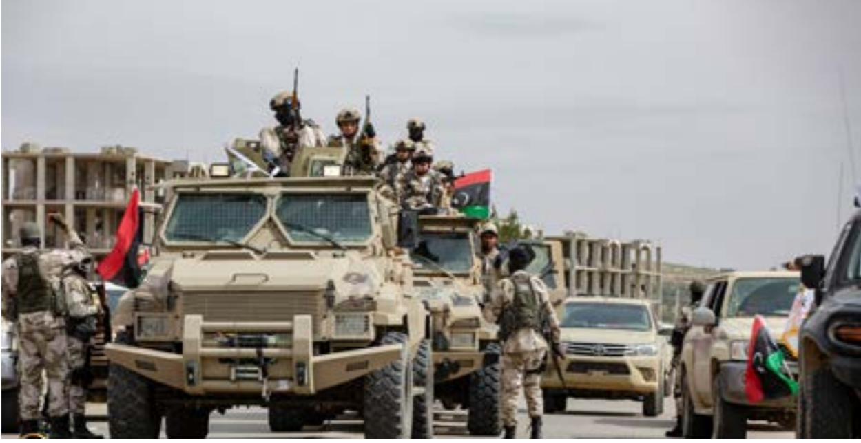
• مدرعات شاركت في حرب العاصمة طرابلس.