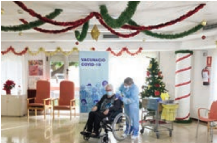
● مسنة إسبانية في دار للرعاية بعد تلقيها اللقاح ضد «كوفيد - 19»

ويسهه لويس دارتيل، الخبير في علم الأحياء الفلكي صاحب موسوعة «حول الكوارث والقدرة على الصمود»، «كوفيد - 19» بموجة عارمة ضربتنا لكن يتراءى خلفها تسونامي التغيير المناخي والاحتراز.