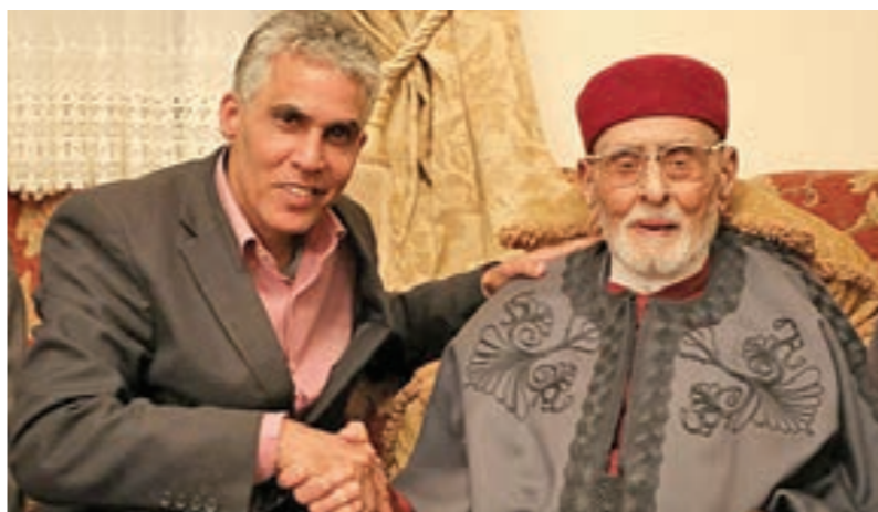
• أحمد صويديق أول وزير للرياضة في تاريخ ليبيا

وفي ظل توقف وتعثر النشاط الكروي هذا العام سيكون العام الجديد عاماً ماراتونيا حافلاً بالمواعيد والاستحقاقات والتحديات للمنتخب الوطني الأول لكرة القدم، الذي سيستهل عامه بالمشاركة في نهائيات بطولة «الشان» التي يسجل حضوره بملاعبها للمرة الرابعة في تاريخه، وأوقته الفرقة في مواجهة منتخبات الكونغو الديمقراطية حامل بطولة «الشان» في مناسبتين والكونغو برازافيل والنيجر، كما سيشارك المنتخب الوطني في بطولة كأس العرب، التي تمنى أن يحالفه النجاح فيها، وتستمر مسيرته الدولية على كافة الجبهات، وهو يفتح ويبدئ العام الجديد الذي نتمنى أن تكون سنته سعيدة خالية من «كورونا» ومن الفقد والوجع والإخفاقات رغم كل التحديات.