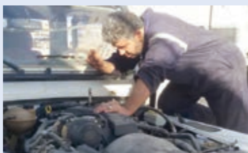
عامل يؤدي وظيفته بشركة، شمال أفريقيا، للاستكشاف الجيوفيزيائي

ناقشت الجمعية العمومية لشركة شمال أفريقيا للاستكشاف الجيوفيزيائي (ناجيكو)، برئاسة رئيس مجلس إدارة المؤسسة الوطنية للنفط، إعادة تفعيل نشاط الشركة واقتناء المعدات التقنية المفقودة والميزانية المقترحة للعام 2021.