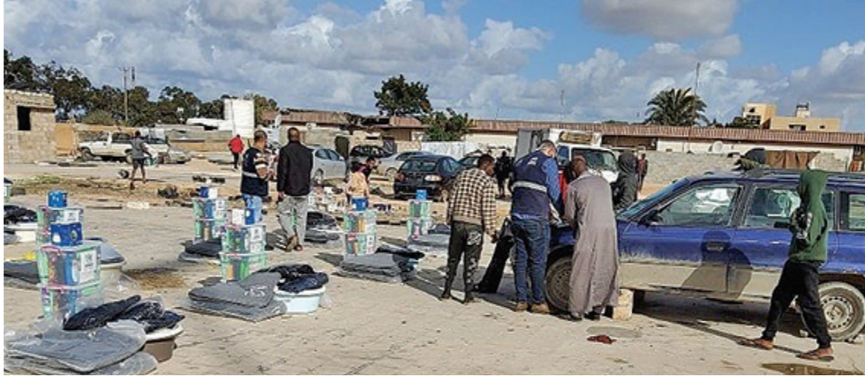
توزيع مساعدات على مخيمات لتاجحي تاورغاء

وأنتهى اتفاق مصالحة تاريخي بين مصراتة وتاورغاء برعاية دولية منتصف 2018، العدا بين المدينتين استمر لنحو ثماني سنوات، وبموجب الاتفاق سمح لسكان تاورغاء المهجرين بالعودة إلى مدينتهم الواقعة على بعد 240 كلم شرق طرابلس. وتعددت حكومة الوفاق المدعومة من الأمم المتحدة بإعادة إعمارها ودفع تعويضات للمتضررين في كلتا المدينتين، وعلى الرغم من مرور عامين ونصف على الاتفاق، لا يزال قسم كبير من مهجري تاورغاء يرفضون العودة إلى مدينتهم ويقومون في مخيمات عشوائية، بعدما أجبرهم معارضو القذافي من مدينة مصراتة الواقعة على بعد أربعين كيلومتراً، على مغادرتها عقب الثورة الليبية في 2011.