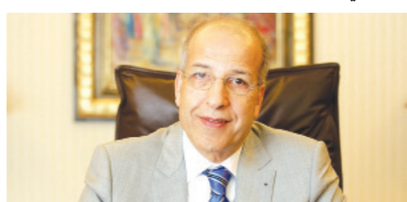
• الصديق الكبير

وأشار إلى وضع إجراءات بشرط للحصول على الدولار بصفة رسمية، معتبراً أن تحديد سعر 4.48 دينار للدولار ليس سعراً ثابتاً «بل سيتغير إلى الانخفاض»، كما توقع أن يكون 2021 «عام انطلاق قطار التنمية في ليبيا».