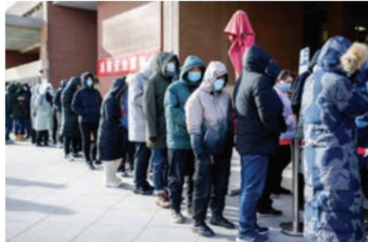
● أشخاص يقفون في الصف للخضوع لاختبار «كوفيد - 19» في بكين