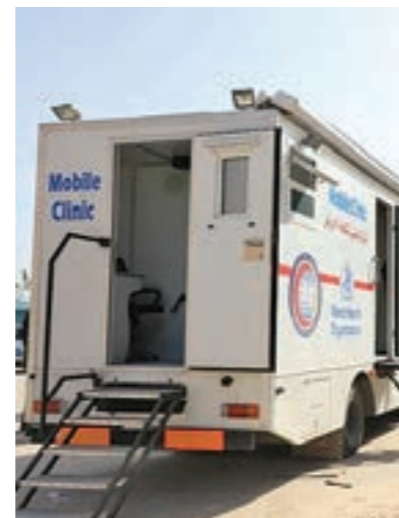
عبادة متنقلة للمركز الوطني لمكافحة الأمراض