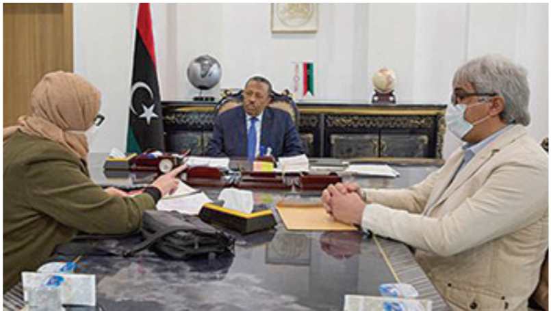
اجتماع لرئيس الحكومة المؤقتة عبد الله الثاني لبحث الاحتياجات الطبية لسبها وبنغازي

الطريق الرابط بين أجدابيا والبريقة بمسافة 80 كلم، والطرق المتهالكة داخل المدينة، إضافة إلى سير عمل القطاع الصحي، ومشكلة المياه والصرف الصحي بالبلدية وآليات حلها، إضافة إلى صيانة جامعة النجم الساطع تمهيداً لعودتها للعمل واستقبال الطلاب.