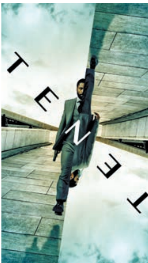
توستر فيلم «تينييت»