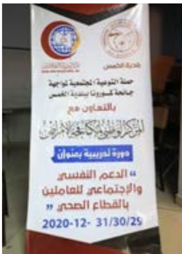
لاقتة لإطلاق حملة توعوية ببلدية الخمس

وأضافت الحكومة المؤقتة أن التي أصدر من جهته تعليماته بضرورة الإسراع في توفير مصنع للأكسجين، ووضع آلية لتوفيره بمركز بنغازي الطبي إلى حين توفير المصنع، ونشرت الحكومة على صفحتها الرسمية في تويتر، منشيرة إلى أنه اطلع أيضاً على أبرز المشاكل التي تواجه مركز سيها الطبي، مؤكداً ضرورة معالجتها في أسرع وقت.