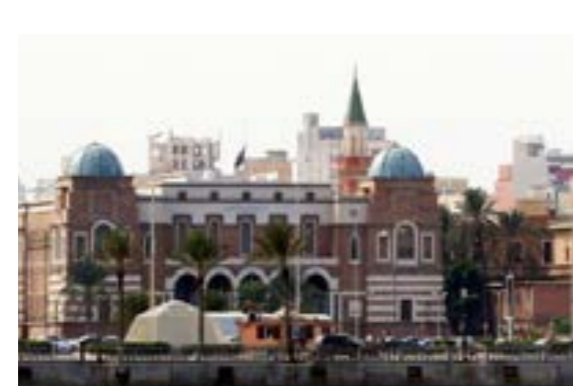
• مقر مصرف ليبيا المركزي.

وقدر البيان الخسائر المباشرة لإيقاف إنتاج النفط وتصديره خلال الفترة بنحو 11 مليار دولار، لافتاً إلى تدني تحصيل الإيرادات السيادية غير النفطية، حيث وصلت نسبة العجز في تحصيلها إلى 48٪، ما دعاه إلى مطالبة الجهات ذات العلاقة بهذه الإيرادات بالعمل على جيلتها وتحصيلها.