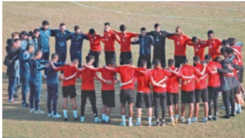
• تدريبات فريق الأهلي بنغازي

جديد بداية من يوم الثلاثاء المقبل، بمواجهة «الاتحاد» وفريق «بييراميدز» المصري، لم يلعب الدفاع الجوي بالقاهرة، رافعا شعار التعويض