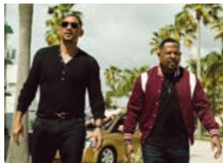
مشهد من فيلم «باد بويز فور لايف»

وحصل فيلم ملحوت روبي، «Birds of Prey» على المركز السابع عالميا محققا 201.858.461، وجاء بعده «The Invisible Man» بإيراد دولي 142.803.000، و«Onward» في المركز التاسع بمبلغ 141.477.370 شبك التذاكر العالمي، وفي المركز العاشر «The Call of the Wild» وحقق الـ110.939.029.