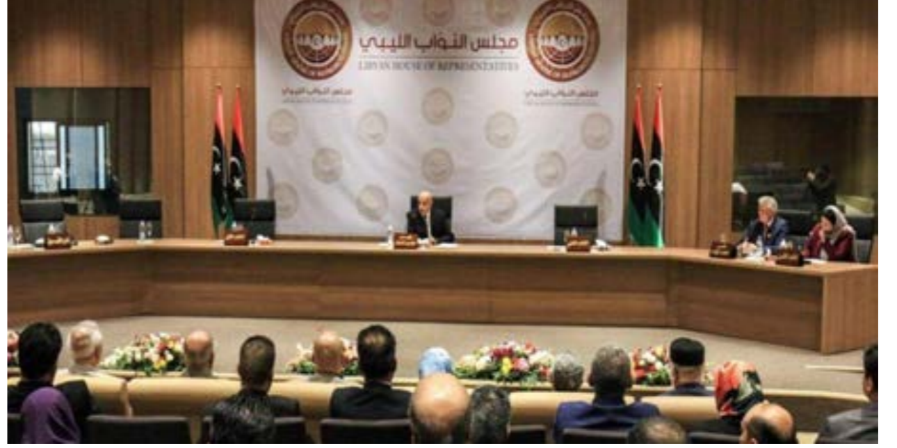
• جلسة سابقة لمجلس النواب في طبرق.