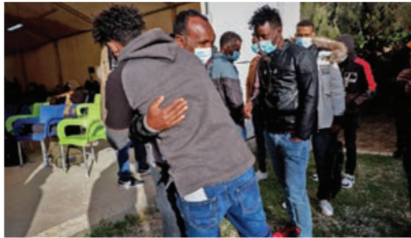
إجلاء طلاب لجوء من ليبيا إلى رواندا

لا مخرج لنا سوى البحر القاتل ونظراً للظروف والانتهاكات المروعة، فإن برامج إعادة التوطين والإجلاء القائمة غير كافية لتوفير مسارات آمنة وقانونية للخروج من ليبيا لمن هم في أشد الحاجة إليها، حيث استفاد من هذه البرامج فقط 5709 لاجئين عرضة للخطر منذ العام 2017، حتى 11 سبتمبر 2020. وهذا يعكس العدد الضئيل من فريخ إعادة التوطين التي قدمتها البلدان المستقبلية للاجئين، بما في ذلك البلدان الأعضاء في الاتحاد الأوروبي، كما أدت القيود المفروضة على السفر نتيجة لتفشي وباء فيروس كورونا (كوفيد - 19) إلى تقاعس المفوضية، حيث تم إجلاء 297 لاجئاً فقط من ليبيا في 2020، قبل إغلاق الحدود في مارس