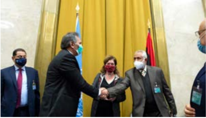
• جانب من توقيع وقف إطلاق النار في ليبيا بجنيينا