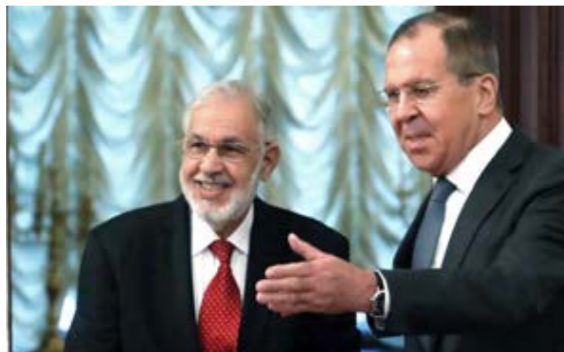
● لافروف خلال استقبال سيالة في موسكو الأربعاء في 30 ديسمبر 2020 (سبوتنيك)

والجزائر، بدائرة المنفتحين أكثر على طرابلس بعدما شكل ملف الاستقرار في ليبيا، واستعادة دورها في القارة الأفريقية والمنطقة المتوسطية محور اتصال هاتفي بين وزير الشؤون الخارجية والهجرة والتونسين بالخارج عثمان الجردي، ونظيره الجزائري صبري بوقادوم، كما أجرى بوقادوم والجردي كل على حدة، مباحثات هاتفية مع محمد الطاهر سيالة، حول تطورات الأوضاع في ليبيا، التي تتعلق أساساً بالترتيبات لملتقى الحوار السياسي المباشر المقبل في تونس الأسبوع المقبل. هذه المؤشرات الإيجابية التي تجلت خلال الأيام الأخيرة من عمر العام الحالي 2020، اعتبرها مثقالون مقدمة واعدة لما يمكن أن يستجد مطلع العام الجديد من تطورات إيجابية في مسار العملية السياسية، المنتظر أن تتوج بحكومة وحدة وطنية تقود المرحلة إلى موعد الاستحقاق الانتخابي في 24 ديسمبر، وفق ما جرى الاتفاق عليه في الجولات الأولى للحوار السياسي في تونس، ليحجب عن السؤال الدائر الآن: هل سيكون العام 2021 العام الحل في ليبيا؟