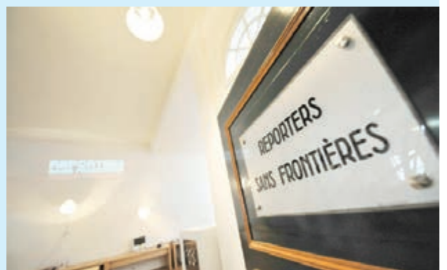
● مدخل مكاتب منظمة «مراسلون بلا حدود» في باريس

وأشارت المنظمة إلى «انخفاض عدد الصحفيين الذين قتلوا في حروب» مع ازدياد متواصل لاغتيال صحفيين في بلدان يعم فيها السلام وهو منحي كان بدأ في 2016. وتراجعت نسبة الصحفيين الذين قضاوا في مناطق نزاعات من 58٪ في العام 2016 إلى 32٪ هذا العام في بلدان تشهد حروباً مثل سورية واليمن أو في «مناطق تشهد نزاعات منخفضة أو متوسطة الحد» على غرار أفغانستان أو العراق. وفي 2020 قتل نحو 70٪ من الصحفيين أي 34 صحفياً في بلدان لا تشهد نزاعات. وكانت المكسيك الدولة التي قتل فيها