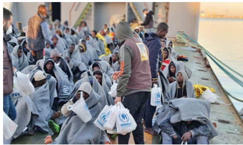
لاجئون أعيدها إلى ليبيا بعد محاولتهم الهجرة عبر البحر