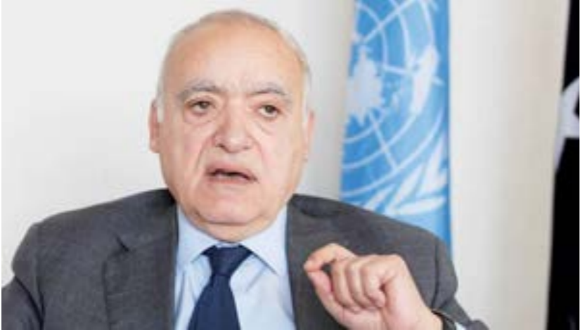
• غسان سلامة

الملتقى بسير المناقشات كل أسبوعين، كما تخصص بتقديم المشورة للملتقى بشأن المسائل المتعلقة بالإطار القانوني اللازم لتنفيذ الاتفاق، 24 ديسمبر من العام الجديد. وتسلّمت المفوضية الوطنية العليا للانتخابات مبلغ 50 مليون دينار من حكومة الوفاق للتخصيص للانتخابات المقبلة، حسب وليمز التي وصفت الأمر بأنه: «خبر ممتاز ومشجع لدعم الانتخابات الوطنية التي تحظى باهتمام كبير من بعثة الأمم المتحدة للدعم في ليبيا ومن المجتمع الدولي».