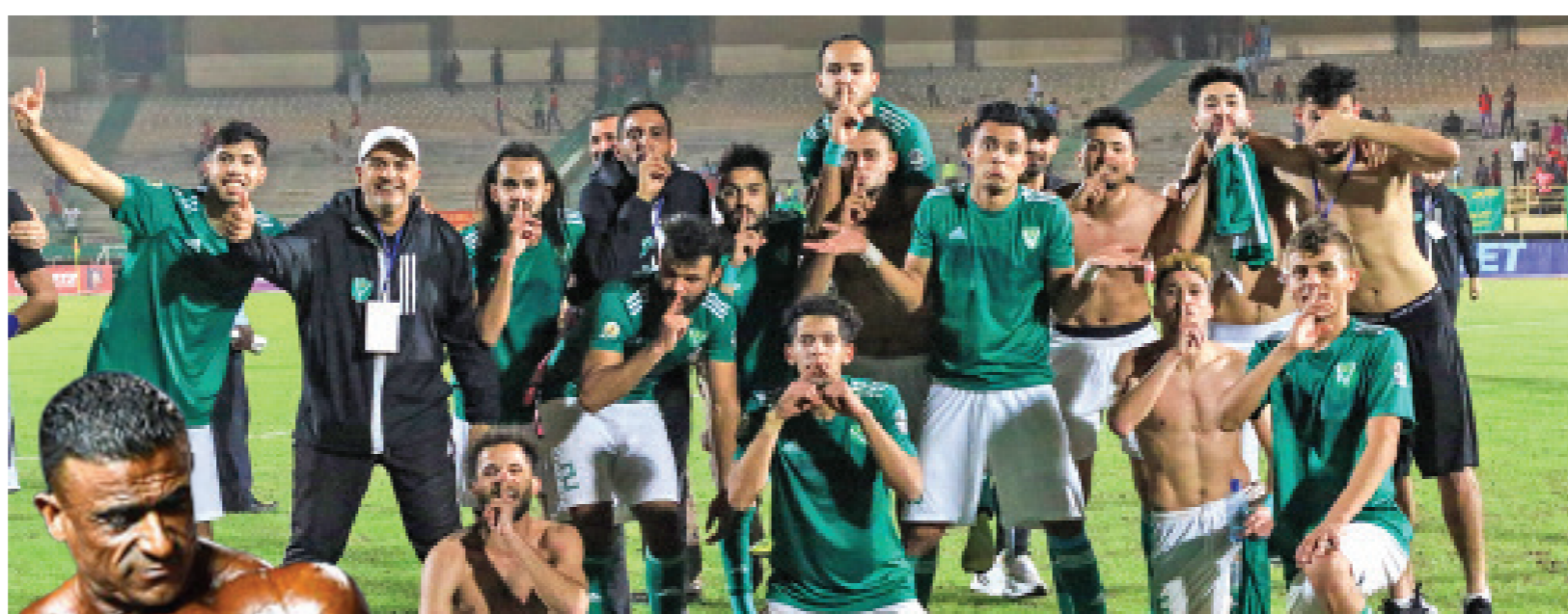
• فريق النصر بعد تأهله إلى ربع نهائي الكونفدرالية

فهل ستوقف مسيرة هذا المنتخب الشباب عند هذه المحطة بعد تعثره في الاختيار؟ أم ننتظر ونترقب عودته للظهور مع أول استحقاق ومناسبة قادمة؟ وهل سيكون مصيره كثيره من المنتخبات التي سبقته من الأجيال السابقة التي أصبحت منتخبات للمناسبات بعد أن طالها الإهمال وطواها النسيان؟ أم سنلوي الصحة ونستفيد من أخطاء هذه التجربة ونضعها تحت المهرج ونضيفها إلى الرصيد، وبنيت عليها ونحافظ على استمراريتها ودعمه واستقراره ليكون في حالة جاهزية دائمة لكافة المواعيد والاستحقاقات القادمة رغم كل التحديات.