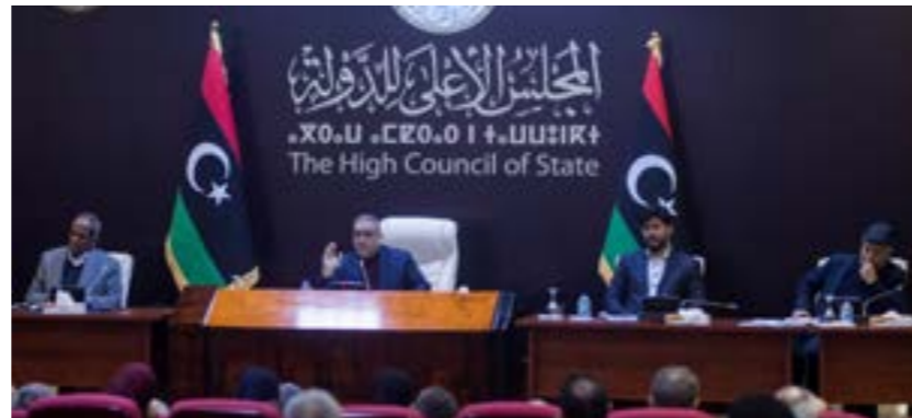
• جلسة سابقة للمجلس الأعلى للدولة