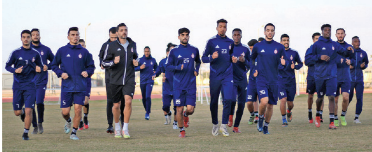
• تدريبات فريق الاتحاد بالإسكندرية استعدادا لبييراميدز

وكان فريق «الأهلي بنغازي» قدم أداء جيدا خلال شوطي المباراة، حتى كاد يسجل في ثلاث مناسبات هدد خلالها مرمي «الترجي» التونسي، ولكنها باءت بالفشل، لتنتهي المباراة بالتعادل السليم. بينما سيكون «الأهلي طرابلس»، مساء الأربعاء المقبل، على موعد مع مواجهة صعبة ومعقدة مع «الاتحاد المنستيري» بالقاهرة، الذي حسم لقاء الذهاب الأول لصالحه بهدفين أحرزهما خلال دقائق الشوط الأول، ولم يقدم «الأهلي طرابلس» المستوى والمردود المنتظر منه، حيث جاء الأداء مخيبا ويتطلع في لقاء الحسم بالقاهرة لمصاحبة جماهيره، وتعويض فارق الهفوة والتأهل لدور المجموعات. ومنذ خوضها لقاءات الذهاب وأصلت الفرق المحلية الثلاثة تدريباتها، وكثفت من برنامج إعدادها، ورفعت من وتيرة تحضيراتها، وأعاد مدربو ممثلي الكرة الليبية الثلاثة قراءة شريط المباريات الأولى بهدف تفادي وتلافي الأخطاء وتدارك تكرار سيناريوات المباريات الأولى: من أجل تحقيق النتائج الأفضل في جولة الحسم الأفريقية الثانية، التي تخوضها وهي على مشارف وأعقاب بلوغ دور المجموعات على واجهتي الكونفدرالية ودوري الأبطال الأفريقي.