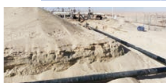
• أنابيب في حقل النافورة النفطي

في 26 أكتوبر الماضي، جرى الإعلان عن عودة الإنتاج والتصدير من جميع الحقول النفطية، إذ أعلنت المؤسسة الوطنية للنفط رفع حالة «القوة القاهرة» عن حقل الفيل النفطي والانتهاج الشامل للإغلاقات. ووجهت التعليمات لشركة مليحة للنفط والغاز بمباشرة الإنتاج من حقل الفيل، وعودة خام مليحة تدريجياً إلى معدلاته الطبيعية.