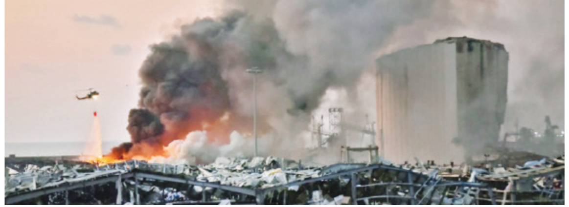
مروحية تساهم في إخماد النيران بعد الانفجار في مرها بيروت