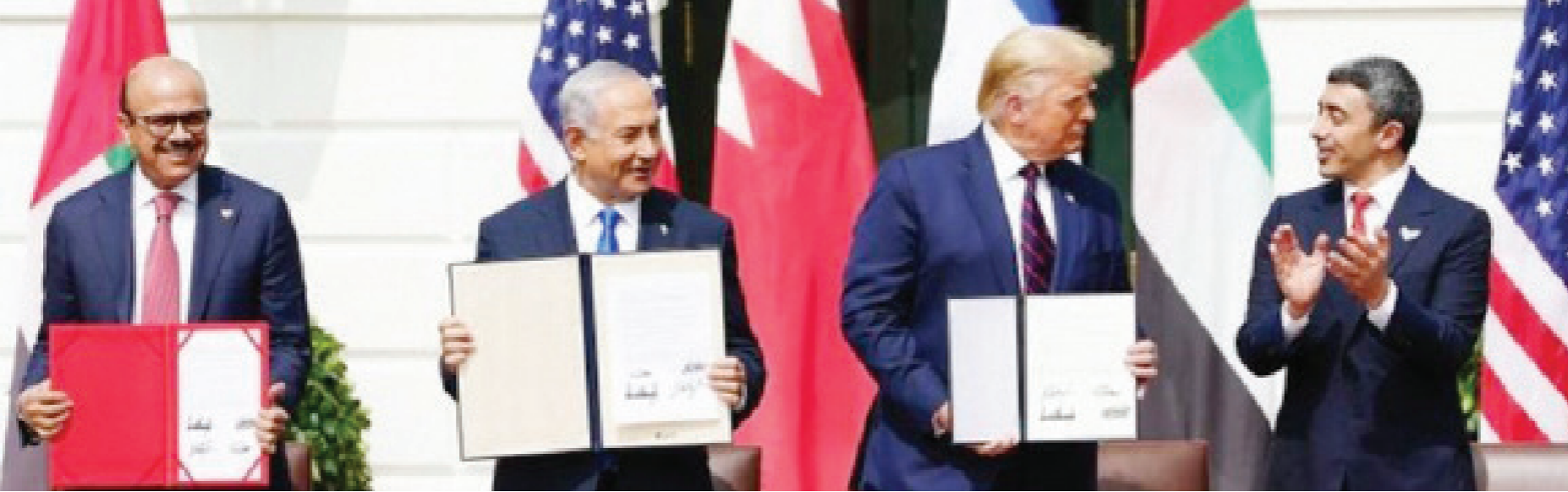
صورة للتوقيع الرسمي بين الإمارات والبحرين على التطبيع مع إسرائيل برعاية أميركية

عندما شارك العام 2020 على البداية لم تكن هناك آمال في انطلاقة المرحلة مختلفة في المنطقة العربية، وإنما كانت الآمال في أقصاها تتطلع إلى إبقاء الأوضاع القائمة على حالها. ويبدو أن التطورات بشأن العام المقبل لن تكون أفضل حالا. وحسب وكالة الأنباء الألمانية، تميز العام 2020 في العالم العربي بحصيلة من التوترات التي اعتادت المنطقة على أن تتصاعد فيها تارة وتهدأ أخرى، فلم تكف الشعوب العربية تنمي احتفالاتها ببيداية العام حتى استفاقت على قيام الولايات المتحدة باغتيال رجل إيران القوي قاسم سليمان في غارة جوية بالعراق، لينفتح بذلك، ليس حلقة جديدة، وإنما باب واسع النطاق لتصاعد التوترات والتهديدات بين إيران وحلفائها من جهة، وواشنطن وحلفائها من جهة أخرى.