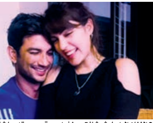
الفنان الراحل شوشانت سينغ وحبيبته ريا شاكراپورتى

«تسبب بالضرر للكثير منهم»، ورغم معاودة المشاريع الإنتاجية مؤقتا، لا تزال القيود المعمدة في إطار مكافحة «كوفيد-19»، تمنعهم من تصوير المشاهد الموسيقية التي تميز السينما الهندية.