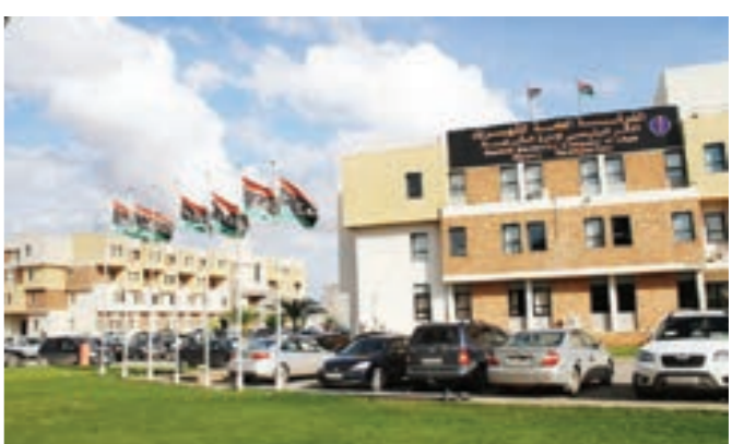
مقر الشركة العامة للكهرباء

وأضاف أن ديناميكية التعاون مع ليبيا تندرج «في إطار الشراكة رابع - رابع»، موضحة أن الأمر يتعلق بعرض كل الفرص المتاحة والمصالح المشتركة للشركتين»، كاشفاً إنشاء مجموعة عمل في غضون أيام لتتوسط في مختلف مجالات التعاون بين البلدين. وأرسلت السلطات الجزائرية مطلع أكتوبر الماضي فريقاً من 13 تقنياً من الشركة الجزائرية لإنتاج الكهرباء من أجل المشاركة في إصلاح خط نقل وقع على مستوى المحطة الكهربائية التي تزود العاصمة طرابلس. وجاءت المبادرة إثر طلب تقدم به رئيس المجلس الرئاسي لحكومة لوفاق فائز السراج إلى رئيس الجزائر عبدالمجيد تبون.